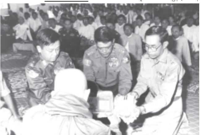
ထို့နောက် ကြည့်မြင်တိုင်မြို့နယ် အမှတ်(၁) အခြေစိုက်ပညာအထက် တန်းကျောင်း ဝတ်အသင်းအဖွဲ့ဝင် များက အရပ်ဆယ်မျက်နှာ မေတ္တာ ဂိုဏ်းကြပြီး အခမ်းအနားကို ဗုဒ္ဓ သာသနံ စီရံတရုတ် သုံးကြိမ်ရုတ်ဆို ဆုတောင်း၍ ရုပ်သိမ်းလိုက်သည်။

ထို့နောက် ဆွမ်းပဒေသာပင် အလှူတော်ငွေများအဖြစ် တပ်မတော် (ကြည်း၊ရေ၊လေ) မိသားစုများက ငွေကျပ် ၁၇၀၀၀၀၊ ရန်ကုန်တိုင်း အေးချမ်းသာယာရေးနှင့် ဖွံ့ဖြိုးရေး ကောင်စီက ငွေကျပ် ၅၀၀၀၀၊ ရန်ကုန်မြောက်ပိုင်းခရိုင် အေးချမ်း သာယာရေးနှင့် ဖွံ့ဖြိုးရေးကောင်စီက ငွေကျပ် ၈၅၀၀၀၊ အင်းစိန်မြို့နယ် အေးချမ်းသာယာရေးနှင့် ဖွံ့ဖြိုးရေး ကောင်စီနှင့် ဌာနဆိုင်ရာများက ငွေ ကျပ် ၁၀၀၀၀၀၊ မြန်မာ့အာဖရိက