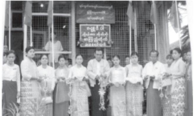
ဒိုက်ဦးမြို့နယ် ပညာရေးနှင့်ပြည်စာကြည့်တိုက်ဖွင့်၊ စာအုပ်များလှူဒါန်း