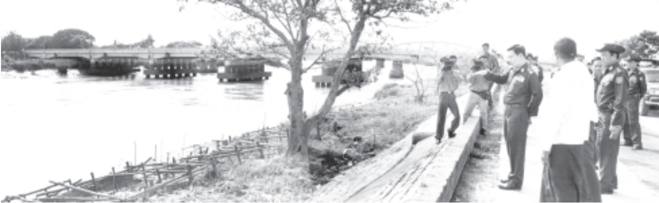
ရန်ကုန် အောက်တိုဘာ ၃

အမျိုးသားကျန်းမာရေးကော်မတီဥက္ကဋ္ဌ နိုင်ငံတော်ဝန်ကြီးချုပ် ဗိုလ်ချုပ်ကြီးခင်ညွန့်သည် ယနေ့နံနက်ပိုင်းတွင် အသွယ်ရောင်အသားဝါ(ဘီ)ကာကွယ်ဆေးစက်ရုံနှင့် စိတ်ကျန်းမာရေးဆေးရုံကြီး(ရန်ကုန်)တို့ကို လှည့်လည်ကြည့်ရှုစစ်ဆေးပြီး လိုအပ်သည်များ ဖွားတားသည်။