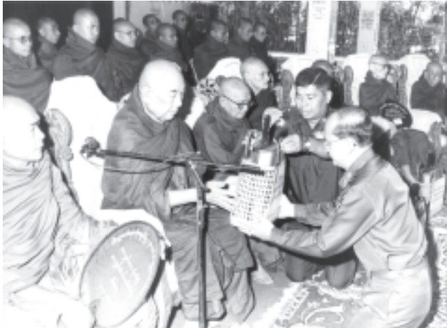
နိုင်ငံတော် အေးချမ်းသာယာရေးနှင့် ဖွံ့ဖြိုးရေးကောင်စီ အတွင်း ရေးမှူး(၂) စစ်ရေးချုပ် ဒုတိယဗိုလ်ချုပ်ကြီးသိန်းစိန် ရန်ကုန်အောက်ပိုင်း ခရိုင် ကြည့်မြင်တိုင်မြို့နယ်အတွင်းရှိ ပရိယတ္တိစာသင်တိုက်များသို့ တပ်မတော်(ကြည်း၊ရေ၊လေ)မိသားစုများနှင့် စေတနာရှင်ပြည်သူများက ဆွမ်းဆန်တော်၊ ဆီ၊ ဆား၊ ဆေး၊ ပဲနှင့် ဆွမ်းပဒေသာပင်အလှူတော် ငွေများ ပေးအပ်စိုက်ထူလှူဒါန်းပွဲအခမ်းအနားတွင် ဆရာတော်ထံ လှူဖွယ် ပစ္စည်းများ ဆက်ကပ်လှူဒါန်းစဉ်။ (သတင်းစဉ်)

အခမ်းအနားသို့ ကြည့်မြင်တိုင် မြို့နယ် သာဓုပရိယတ္တိစာသင်တိုက် ပဓာနနာယကဆရာတော် ဘဒ္ဒန္တပညာ ဝံသာအမှူးပြုသော ဆရာတော် သံဃာ တော်အရှင်သုမြတ်များ ကြွရောက် တော်မူကြပြီး စစ်ဦးစီးအရာရှိချုပ် (ရေ) ဗိုလ်မှူးကြီးဉာဏ်ထွန်း၊ လူမှုဝန်ထမ်း၊ ကယ်ဆယ်ရေးနှင့် ပြန်လည်နေရာချ ထားရေးဝန်ကြီးဌာန ဒုတိယဝန်ကြီး ဗိုလ်မှူးချုပ်ကျော်မြင့်၊ ဒုတိယမြို့တော် ဝန်ရိုင်းမှူးကြီးမောင်ပါနှင့် တပ်မတော် အရာရှိကြီးများ၊ ဌာနဆိုင်ရာတာဝန်ရှိ ပုဂ္ဂိုလ်များ၊ ရန်ကုန်အောက်ပိုင်းခရိုင် အေးချမ်းသာယာရေးနှင့် ဖွံ့ဖြိုးရေး ကောင်စီဥက္ကဋ္ဌနှင့် အဖွဲ့ ဝင်များ၊ မြို့နယ် အေးချမ်းသာယာရေးနှင့် ဖွံ့ဖြိုးရေးကောင်စီဥက္ကဋ္ဌနှင့် အဖွဲ့ဝင် များ၊ တာဝန်ရှိသူများ၊ လူမှုရေးအသင်း အဖွဲ့ဝင်များ၊ ဘာသာရေးအသင်းအဖွဲ့ ဝင်များနှင့် အလှူရှင်များ တက်ရောက် ကြည့်မြင်ကြသည်။