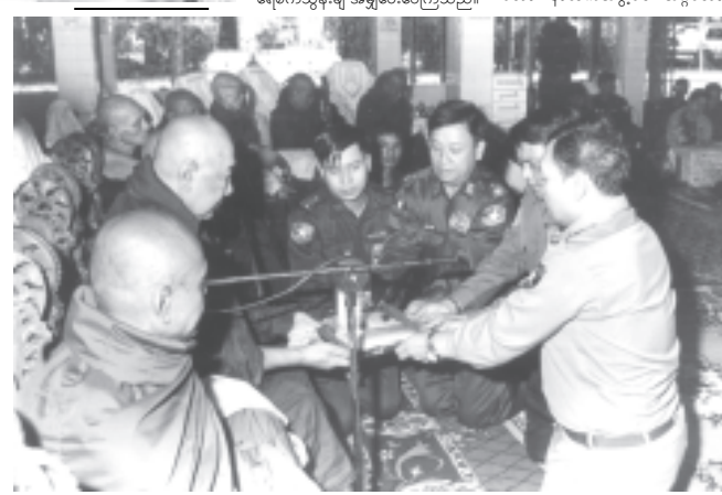
ရန်ကုန်အောက်ပိုင်းခရိုင် ကြည့်မြင်တိုင်မြို့နယ်အတွင်းရှိ ပရိယတ္တိ စာသင်တိုက်များသို့ တပ်မတော် (ကြည်း၊ ရေ၊ လေ) မိသားစုများနှင့် စေတနာရှင် ပြည်သူများက ဆွမ်းဆန်တော်၊ ဆီ၊ ဆား၊ ဆေး၊ ပဲနှင့် ဆွမ်း ပဒေသာပင် အလှူတော်ငွေများ ပေးအပ်စိုက်ထူလှူဒါန်းပွဲ အခမ်း အနားတွင် တပ်မတော် (ကြည်း၊ ရေ၊ လေ) အရာရှိကြီးများက ဆရာတော်ထံ ဆွမ်းဆန်တော်၊ ဆီ၊ ဆား၊ ဆေး၊ ပဲတို့ကို ဆက်ကပ် လှူဒါန်းစဉ်။ (သတင်းစဉ်)