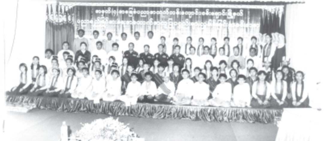
မြန်မာနိုင်ငံပညာရေးကော်မတီ ဒုတိယဥက္ကဋ္ဌ နိုင်ငံတော်အေးချမ်းသာယာရေးနှင့် ဖွံ့ဖြိုးရေးကောင်စီ အတွင်းရေးမှူး(၁) ဒုတိယဗိုလ်ချုပ်ကြီးစိုးဝင်း စမ်းချောင်းမြို့နယ် အမှတ်(၄) အခြေခံပညာအထက်တန်းကျောင်း၏ ပညာရည်မြှင့်တင်ရေး အထောက်အကူပြုစာသင်ခန်းများဖွင့်ပွဲတွင် ဆရာ ဆရာမများ၊ အလှူရှင်များ၊ ကျောင်းအကျိုးတော်ဆောင်များ၊ ကျောင်းသား ကျောင်းသူများနှင့်အတူ စုပေါင်းဓာတ်ပုံရိုက်စဉ်။