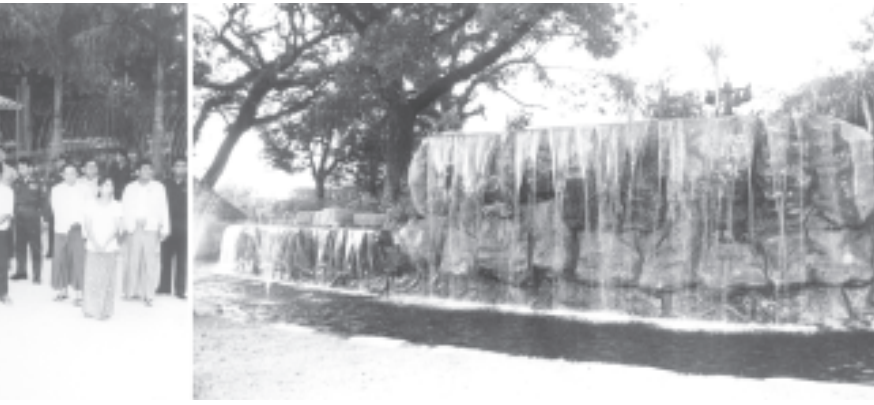
နိုင်ငံတော်ဝန်ကြီးချုပ် ဗိုလ်ချုပ်ကြီးစင်ညွန့် ရန်ကုန်မြို့တော် ကန်တော်ကြီးဥယျာဉ် Relaxation Zone အတွင်း တည်ဆောက်နေမှုများကို ကြည့်ရှုစစ်ဆေးစဉ်။

ထို့နောက် အမှတ်(၁) စက်မှု ဝန်ကြီးဌာန ဝန်ကြီး ဦးအောင်သောင်း က အထူးဆေးဝါး ထုတ်လုပ်ရေးကော်မီ ဘီအမှတ်(၁)မှ ငှက်ဖျားရောဂါ ကုသ ဆေးဝါးများထုတ်လုပ်ရန် လုပ်ငန်း ဆောင်ရွက်ခဲ့မှု အခြေအနေ၊ Artemisinin ထုတ်ယူသည့် စက် များနှင့် ဆေးပြားထုတ်လုပ်သည့် ပစ္စည်းများ ဝယ်ယူပတ်ဆင်မှု အခြေ အနေ၊ ထိုဆေးနှင့် ဆေးတောင်ထုတ် လုပ်ရန် ထပ်မံဖြည့်ဆည်းသွားမည့် စက်ပစ္စည်းများ အခြေအနေတို့နှင့် စပ်လျဉ်း၍ ရှင်းလင်းတင်ပြသည်။ ဆက်လက်၍ အမှတ်(၁) စက်မှု ဝန်ကြီးဌာန ဆေးဝါးဦးစီးဌာနညွှန်ကြား နှင့် ဝန်ကြီးဌာန ညွှန်ကြားရေးမှူး ဒေါက်တာ