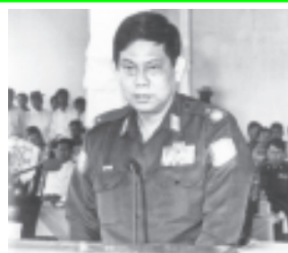
လယ်ယာစိုက်ပျိုးရေးနှင့် ဆည်မြောင်းဝန်ကြီးဌာနဝန်ကြီး ဗိုလ်ချုပ်ဌေးညီ ဆားလင်းကြီးရေလျှော်တံဆံ့ဖွင့်လှစ်အခမ်းအနားတွင် အမှာစကားပြောကြားစဉ်။ (သတင်းစဉ်)

ဝင်ငွေတိုးပွားစေပုံလောကောမှာ ဖြစ်ကြောင်း၊ ထို့ပြင် ဆားလင်းကြီးဒေသတစ်ဝန်းရှိ ပြည်သူများ သောက်သုံးရေ လွယ်လင့်တကူရှိလာတော့မည်ဖြစ်ကြောင်း။