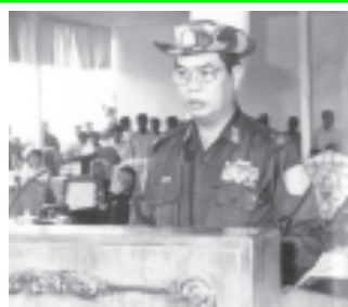
စစ်ကိုင်းတိုင်း အေးချမ်းသာယာရေးနှင့်ဖွံ့ဖြိုးရေး ကောင်စီဥက္ကဋ္ဌ အနောက်မြောက်တိုင်း စစ်ဌာနချုပ်တိုင်းမှူး ဗိုလ်ချုပ်သားအေး ဆားလင်းကြီး ရေလျှော်တံဆံ့ဖွင့်လှစ်အခမ်းအနားတွင် အမှာစကားပြောကြားစဉ်။ (သတင်းစဉ်)

ဆားလင်းကြီးမြို့နယ်နှင့် ဆက်စပ်နေသည့် ပတ်ဝန်းကျင်တွင် တည်ဆောက်ပြီးရေလျှော်တံဆံ့များကိုကြည့်မည်ဆိုလျှင် ၁၉၈၅ခုနှစ်နောက်ပိုင်း သာစည်ရေလျှော်တံဆံ့၊ ထန်းဇလုပ်ရေလျှော်တံဆံ့၊ နှယ်ရွှေရေလျှော်တံဆံ့၊ လက်ပယ်ရေလျှော်တံဆံ့၊ ကြက်မောက်နှင့် လယ်တီရေလျှော်တံဆံ့၊ မြောင်းယားရေလျှော်တံဆံ့၊ မြောက်ယားရေလျှော်တံဆံ့၊ လက်ပန်ရေလျှော်တံဆံ့နှင့် ငွေသားရေလျှော်တံဆံ့တို့ တည်ရှိနေပြီး ဖြစ်ကြောင်း။