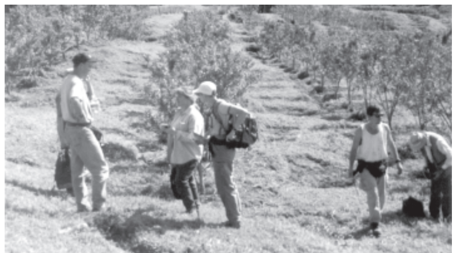
မူးယစ်ဆေးဝါးပပျောက်ရေးအတွက် မြန်မာ-အမေရိကန် နှစ်နိုင်ငံအစိုးရ ပူးပေါင်းဆောင်ရွက်မှု(၉)ကြိမ်မြောက် အစီအစဉ်အဖြစ် ၂၀၀၃ခုနှစ် ဖေဖော်ဝါရီလအတွင်းက ရှမ်းပြည်နယ်အတွင်းရှိ ဘိန်းအစားထိုးဖုံးကွယ်မှုများကို ဤသို့ကင်းစင်ကြည့်ရှုခဲ့ကြသည်။ (ဓာတ်ပုံမှတ်တမ်း-မြန်မာ့အလင်း)

မြန်မာနိုင်ငံအနေဖြင့် ဤသို့ အိမ်နီးချင်းနိုင်ငံများ၊ ဒေသတွင်းနိုင်ငံများ၊ နိုင်ငံတကာအဖွဲ့အစည်းများနှင့် မူးယစ်ဆေးဝါးပပျောက်ရေး ပူးပေါင်းဆောင်ရွက်မှုများကို ဆက်လက်တိုးမြှင့်ဆောင်ရွက်သွားမှာ ဖြစ်သကဲ့သို့ မူးယစ်ဆေးဝါးပပျောက်ရေးနှင့်ပတ်သက်၍ အမြင်ချင်းတူညီသော၊ သဘောထား၊ ခံယူချက်ခြင်းတူညီသော မည်သည့်ကမ္ဘာ့ နိုင်ငံများနှင့်မဆို မည်သည့်နိုင်ငံတကာအဖွဲ့အစည်းများနှင့်မဆို လက်တွဲပူးပေါင်း ဆောင်ရွက်သွားမည်သာဖြစ်ကြောင်း။ မူးယစ်ဆေးဝါးပပျောက်ရေးလုပ်ငန်းသည် ကမ္ဘာလူသားများအားလုံးနှင့်သက်ဆိုင်သဖြင့် ကမ္ဘာ့နိုင်ငံများအားလုံး လက်တွဲပူးပေါင်းပူးပေါင်းဆောင်ရွက်ရမည် လုပ်ငန်းဖြစ်သည်ဟု မြန်မာနိုင်ငံအနေဖြင့် ခံယူထားကြောင်း။