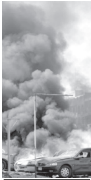
ဘဂ္ဂဒတ်အနောက်ဘက်တွင် အသေခံကားနား ဖောက်ခွဲသဖြင့် ဖော်တော်ယာဉ်များ မီးလောင်နေ သည်ကို စက်တင်ဘာ ၂၂ ရက်က တွေ့ရစဉ်။