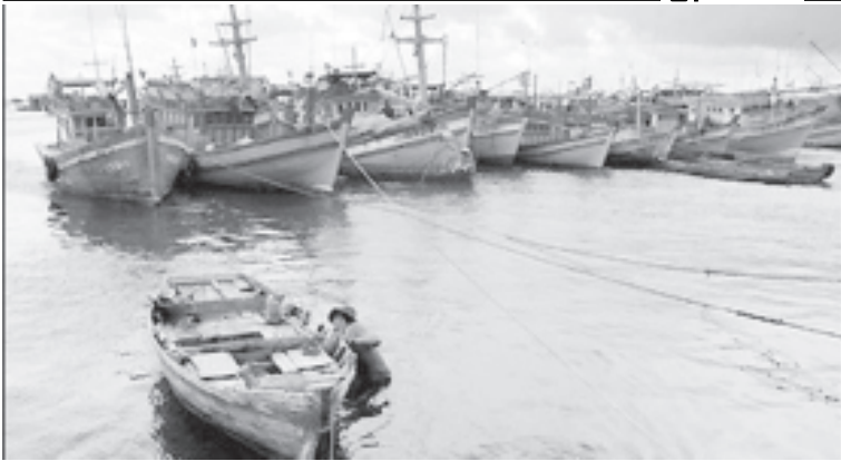
ဗီယက်နမ်နိုင်ငံတောင်ပိုင်း၊ ဖူကောကျွန်း၌ ငါးဖမ်းစက်လှေများ ဆိပ်ကမ်းတွင် ဆိုက်ကပ်ထားသည့်ကိုတွေ့ရစဉ်။ (ယင်းကျွန်းသည် ဗီယက်နမ်နိုင်ငံ၏ အဓိကရေလုပ်ငန်းကြီးဖြစ်သည့်အပြင် ခရီးသွားလုပ်ငန်းဖြင့်လည်း ဝင်ငွေရရှိနိုင်မည့်နေရာတစ်နေရာဖြစ်ကြောင်း သိရသည်။)