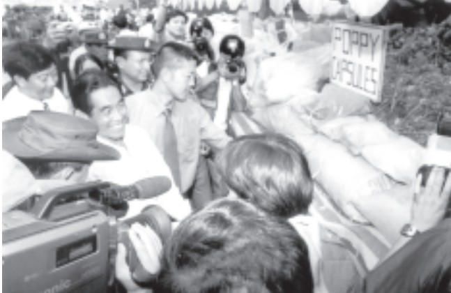
၂၀၀၂ခုနှစ် ဇွန် ၇ရက်က ရှမ်းပြည်နယ်(မြောက်ပိုင်း) လားရှိုးမြို့၌ ပြည်ထောင်စုဝန်ကြီးဌာန ဝန်ကြီး ဗိုလ်မှူးကြီးတင်လှိုင်နှင့် ကိုးကန့်ဒေသတိုင်းရင်းသားခေါင်းဆောင် ဦးဖုန်ကြားရှင်း၊ တရုတ်ပြည်သူ့ သမ္မတနိုင်ငံ ယူနန်ပြည်နယ် မူးယစ်ဆေးဝါးတားဆီးနှိမ်နင်းရေးဌာန ဒုတိယဌာနမှူး မစ္စတာ ချောင့်ရှိမြင့် နှင့် အဖွဲ့ဝင်များက တတိယအကြိမ် မီးရှို့ဖျက်ဆီးမည့် ဘိန်းမျိုးစေ့နှင့် မူးယစ်ဆေးဝါးများကို ကြည့်ရှုစစ်ဆေးခဲ့ကြစဉ်။ (ဓာတ်ပုံမှတ်တမ်း-မြန်မာ့အလင်း)

၂၀၀၄ ခုနှစ် ဇန်နဝါရီ ၁ ရက်မှ စက်တင်ဘာ ၁၅ ရက်အထိ မူးယစ်ဆေးဝါးနှင့်ပတ်သက်၍ အရေးယူပျက်ဆီးနိုင်ခဲ့မှုများ ဘိန်းစိုက်ရာသီတွင် ဘိန်းစေ့ ၇၅၄၄၃သမဂ္ဂ၂ကေကို ဖျက်ဆီးနိုင်ခဲ့ပြီး ၂၀၀၄ခုနှစ် ဇန်နဝါရီ ၁ရက်မှ စက်တင်ဘာ ၁၅ရက်အထိ မူးယစ်ဆေးဝါးနှင့် ဆက်သွယ်သော အမှုပေါင်း ၂၀၇၀မှ တရားခံပေါင်း ၂၈၈၃ဦးကို အရေးယူခဲ့၊ ဘိန်း၊ ဘိန်းဖြူ၊ စိတ်ကြွေးသွပ်ဆေး၊ အက်ဖီဒရင်၊ ဆေးခြောက်များ ဖမ်းဆီးခြင်း၊ စိတ်ကြွေးသွပ်ဆေးထုတ်လုပ်သည့် စက်တစ်လုံး၊ ဘိန်းဖြူချက် စက်ရုံနှစ်ရုံတို့ကို ဖျက်ဆီးနိုင်ခဲ့။