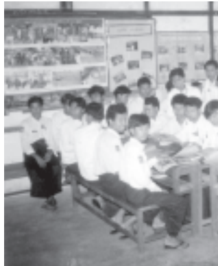
ရှမ်းပြည်နယ်(မြောက်ပိုင်း) မိုးမိတ်မြို့နယ် ပြန်ကြားရေးနှင့် ပြည်သူ့ဆက်ဆံရေးဦးစီးဌာန စာကြည့်တိုက်တွင် စာပေလေ့လာဖတ်ရှုနေကြသည့် ပြည်ထောင်စုကြံ့ခိုင်ရေးနှင့် ဖွံ့ဖြိုးရေးအသင်းဝင် လူငယ်များကို တွေ့ရစဉ်။