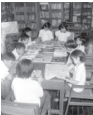
အင်းစိန်မြို့နယ် ပြန်ကြားရေးနှင့် ပြည်သူ့ဆက်ဆံရေးဦးစီးဌာန စာကြည့်တိုက် ကလေးစာဖတ်ခန်းတွင် စာဖတ်နေကြသည့် ကလေးများကို တွေ့ရစဉ်။

ယနေ့မြန်မာနိုင်ငံတွင် စာနယ်ဇင်းများ ထုတ်လုပ်မှုသည် များစွာတိုးတက်လျက်ရှိသည်။ ထုတ်လုပ်သည့် စာရင်းများကို ကြည့်ပါက တစ်လထက်တစ်လ တစ်နှစ်ထက်တစ်နှစ် များပြားလာနေသည်ကို တွေ့ရသည်။ သို့ရာတွင် ယင်းစာနယ်ဇင်းများသည် မြို့ပေါ်တွင်သာ ရပ်တန့်နေပြီး ကျေးရွာများသို့ မပေါက်ရောက်နိုင်သေးပါ။ နိုင်ငံတော်၏ စီးပွားရေးသည် ကျေးလက်ဒေသများတွင် အဓိကတည်ရှိနေသည်။ ကျေးလက်မှ ထွက်ကုန်သီးနှံ ဆန်စပါး၊ ပဲ၊ နှမ်း၊ ဝါ၊ ဂျုံ စသည်တို့ တိုးတက်ထုတ်လုပ်လာသည်နှင့်အမျှ နိုင်ငံတော်၏ စီးပွားရေး ဖွံ့ဖြိုးတိုးတက်လာမည်ဖြစ်သည်။ ထို့ကြောင့် ကျေးလက်နေ ပြည်သူများ အသိပညာ ကြွယ်ဝရန်လိုအပ်သည်။