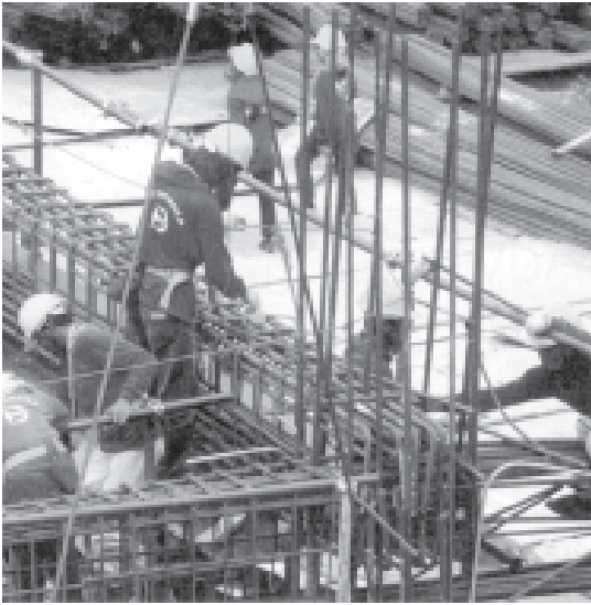
ထိုင်းနိုင်ငံ ဗန်ကောက်မြို့လယ်၌ စီးပွားရေးဆိုင်ရာ အဆောက်အအုံတစ်ခုကို ထိုင်း အလုပ်သမားများက တည်ဆောက်နေကြစဉ်။ (ထိုင်းနိုင်ငံ၏ စီးပွားရေးလုပ်ငန်းများ ပြန်လည် ကောင်းမွန်လာပြီ ဖြစ်ကြောင်း သိရသည်။)