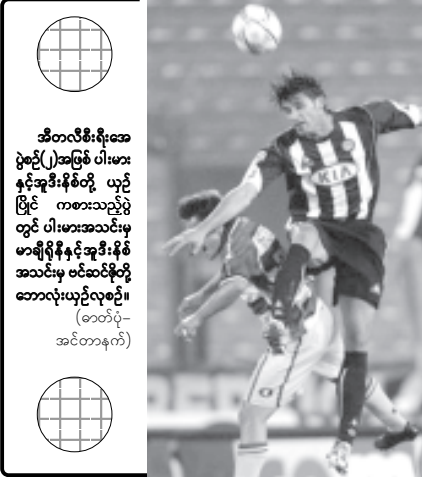
အီတလီစီးရီးအေ ပွဲစဉ်(၂)အဖြစ် ပါးမားနှင့်အူဒီးနီတို့ ယှဉ်ပြိုင် ကစားသည့်ပွဲတွင် ပါးမားအဆင့်(၁၂) နေရာ၌ရှိနေသည်။ လူနံအောင် အင်အားမြှင့်ထားသည့် အင်တာမီလန်တွင် ဗီရူနို၊ အဂျီဒေးဗစ်၊ စီမာရီလာတို့၊ ပါဝင်ဖွဲ့စည်းထားသော်လည်း နိုင်ပွဲပေးနေဆဲဖြစ်ရာ ယခုပွဲတွင် အင်တာမီလန်နိုင်ပွဲရအောင် နည်းပြ မန်ချီနီက စီမံဆောင်ရွက်တော့မည်ဖြစ်သည်။

ပြီးခဲ့သည့်နှစ် စီးရီးအေမှာ အဆင့်(၈)ရရှိခဲ့သည့် ဆန်ဒီဒိုးယားနှင့် အဆင့်(၃)ရရှိခဲ့သည့် ဂျူဗင်တပ်အသင်းတို့ ဆန်ဒီဒိုးယားကွင်း လူဂီဇာရာရစ်၌ စက်တင်ဘာ ၂၂ ရက်(ယနေ့)တွင် ယှဉ်ပြိုင်ကစားမည်ဖြစ်သည်။