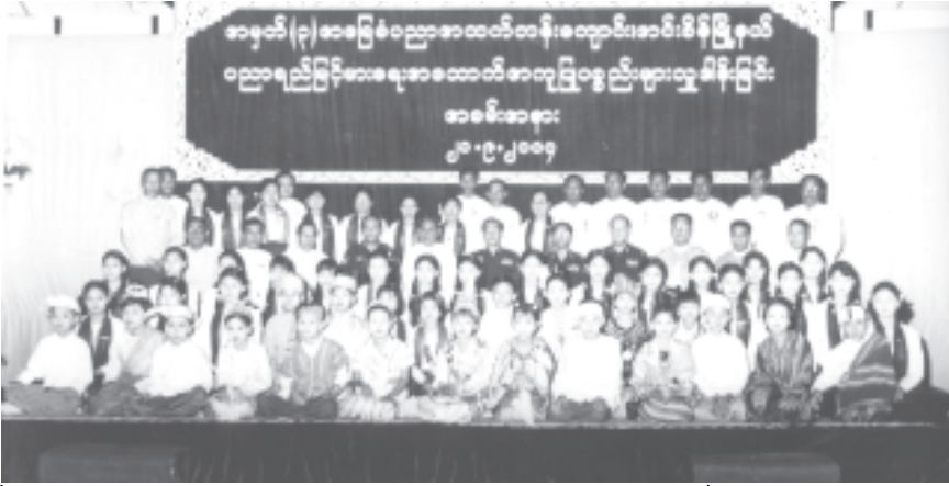
မြန်မာနိုင်ငံပညာရေးကော်မတီ ဒုတိယဥက္ကဋ္ဌ နိုင်ငံတော် အေးချမ်းသာယာရေးနှင့် ဖွံ့ဖြိုးရေးကောင်စီ အတွင်းရေးမှူး(၁) ဒုတိယဗိုလ်ချုပ်ကြီးစိုးဝင်း၊ အင်းစိန်မြို့နယ် အမှတ်(၃) အခြေစိုက်ပညာအထက်တန်းကျောင်း၏ ပညာရေးညွှန်ကြားရေး အထောက်အကူပြုစာသင်ခန်းများဖွင့်ပွဲတွင် ကျောင်းအုပ်ဆရာကြီး၊ ဆရာ ဆရာမများ၊ ကျောင်းအကျိုးတော်ဆောင်များ၊ အလှူရှင်များ၊ ကျောင်းသားကျောင်းသူများနှင့်အတူ စုပေါင်းမှတ်တမ်းတင် ဓာတ်ပုံရိုက်စဉ်။ (သတင်းစဉ်)