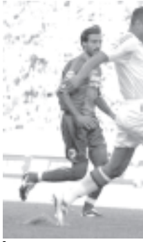
အီတလီ စီးရီးအေဘောလုံးပြိုင်ပွဲ ပွဲစဉ်(၂)အဖြစ် အေစီမီလန်နှင့် ဘိုလော့နာတို့ ယှဉ်ပြိုင်ကစားရာ အေစီမီလန်မှ ကာမူး(အလယ်)နှင့် ဘိုလော့နာမှ အမိုရီအိုတို့ ဘောလုံးယှဉ်လှပစွာ

ယခင်နှစ် စီးရီးအေအတွင်အဆင့်(၃) ချိတ်ခဲ့သော ဂျူပင်းတပ်နှင့် အတန်း