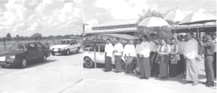
ပြည်ထောင်စုကြံ့ခိုင်ရေးနှင့် ဖွံ့ဖြိုးရေးအသင်း အမျိုးသမီးရေးရာအဖွဲ့တာဝန်ခံ ပြည်ထောင်စုကြံ့ခိုင်ရေးနှင့် ရထားပို့ဆောင်ရေးဝန်ကြီးဌာနဝန်ကြီး ဗိုလ်ချုပ်အောင်မင်းတို့ အခြေခံယာဉ်မောင်းသင်တန်း၌ သင်ကြားနေမှုကို ကြည့်ရှုအားပေးစဉ်။ (ရထား)

ရန်ကုန်၊ စက်တင်ဘာ ၂၀ မြန်မာနိုင်ငံ အမျိုးသမီးရေးရာအဖွဲ့ချုပ်နှင့် ရထားပို့ဆောင်ရေးဝန်ကြီးဌာနအောက်ရှိ ကုန်းလမ်းပို့ဆောင်ရေး ညွှန်ကြားမှုဦးစီးဌာနတို့ ပူးပေါင်း ဖွင့်လှစ်သော အခြေခံယာဉ်မောင်းသင်တန်း အမှတ်စဉ် (၁/၂၀၀၄) ဖွင့်ပွဲ အခမ်းအနားကို ကုန်းလမ်းပို့ဆောင်ရေး ညွှန်ကြားမှုဦးစီးဌာန ရွာသာကြီး တိုင်းရုံးခွဲ၌ ယနေ့နေ့စွဲနံနက် ၉ နာရီက ကျင်းပရာ ပြည်ထောင်စုကြံ့ခိုင်ရေးနှင့် ဖွံ့ဖြိုးရေးအသင်း အမျိုးသမီးရေးရာအဖွဲ့တာဝန်ခံ ပြည်ထောင်စုကြံ့ခိုင်ရေးနှင့် ဖွံ့ဖြိုးရေးဦးစီးဌာန ဝန်ကြီး ဗိုလ်မှူးကြီးတင်လှိုင်နှင့် ရထားပို့ဆောင်ရေးဝန်ကြီးဌာနဝန်ကြီး ဗိုလ်ချုပ်အောင်မင်းတို့ တက်ရောက်အမှာစကား ပြောကြားကြသည်။ ဖွင့်ပွဲအခမ်းအနားသို့ ရထားပို့ဆောင်ရေးဝန်ကြီးဌာန ဒုတိယဝန်ကြီး ဦးဖေသန်း၊ ပို့ဆောင်ရေးဝန်ကြီးဌာန ဒုတိယဝန်ကြီး ဦးလှဝင်း၊ ကုန်းလမ်းပို့ဆောင်ရေး ညွှန်ကြားမှုဦးစီးဌာန ညွှန်ကြားရေးမှူးချုပ် ဦးလှသောင်းမြင့်နှင့် တာဝန်ရှိသူများ၊ မြန်မာနိုင်ငံအမျိုးသမီးရေးရာအဖွဲ့ချုပ် စီးပွားရေးအဖွဲ့မှ တာဝန်ရှိသူများနှင့် သင်တန်းသူ ၆၄ ဦး တက်ရောက်ခဲ့သည်။ အဆိုပါသင်တန်းကို ကုန်းလမ်းပို့ဆောင်ရေး ညွှန်ကြားမှုဦးစီးဌာန ရွာသာကြီးတိုင်းရုံးခွဲတွင် ဖွင့်လှစ်သင်ကြားပြီး သင်တန်းကို စနေ၊ တနင်္ဂနွေ နေ့များတွင် သင်ကြားပေးမည်ဖြစ်၍ သင်တန်းကာလမှာ ရက်သတ္တရက်ပတ် ကြာမည်ဖြစ်ကြောင်း သတင်းရရှိသည်။ (သတင်းစဉ်)