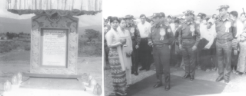
ဆောက်လုပ်ရေးဝန်ကြီးဌာန ဝန်ကြီး ဗိုလ်ချုပ်စောထွန်း၊ မကွေးတိုင်း ဂန့်ဂေါခရိုင် ဂန့်ဂေါမြို့နယ် ဂန့်ဂေါ- ကလေး ကားလမ်းပေါ်ရှိ တော်ဝင်တံတားဖွင့်ပွဲတွင် မှတ်တမ်းကျောက်စာတိုင်ကို စက်လှေတံခွံပေါ်၌ ဖွင့်လှစ်ပေးစဉ်။