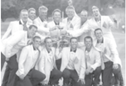
(၁၅)ကြိမ်မြောက် ရိုက်ဒါဗလား ဇေါက်သီးရိုက်ပြိုင်ပွဲကို အမေရိကန် နိုင်ငံ မီချီနာပြည်နယ် ဘလူးဖီးလ်၌ ကျင်းပရာ အနိုင်ရရှိလိမ့်သွားသော ဥရောပရိုက်ဒါဗလား ဇေါက်သီးရိုက်အားကစားသမားများအား ဆုလေးနှင့် အတူ တွေ့ရစဉ်။