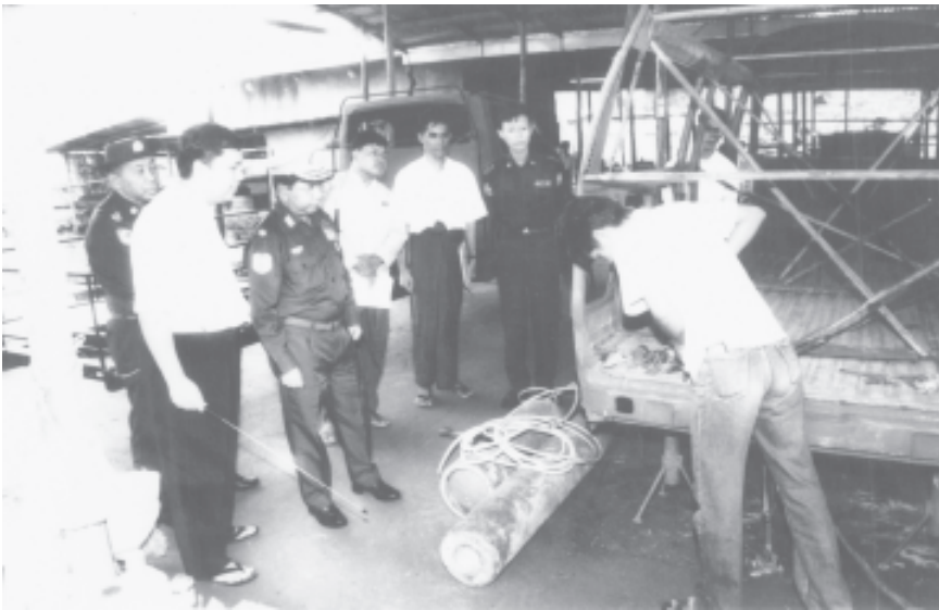
ရွှေပြည်သာစက်မှုမြို့ ဇုန်တာဝန်ခံ ပြန်ကြားရေးဝန်ကြီးဌာန ဝန်ကြီး ဗိုလ်မှူးချုပ်ကျော်ဆန်း၊ ပြန်မာဆန္ဒ အထွေထွေစီးပွားရေးလုပ်ငန်း သမဝါယမ အသင်းလီမိတက်၏ မော်တော်ယာဉ်ထုတ်လုပ်ရေးအလုပ်ရုံအတွင်း မော်တော်ယာဉ်ထုတ်လုပ်မှုကို ကြည့်ရှုစဉ်။