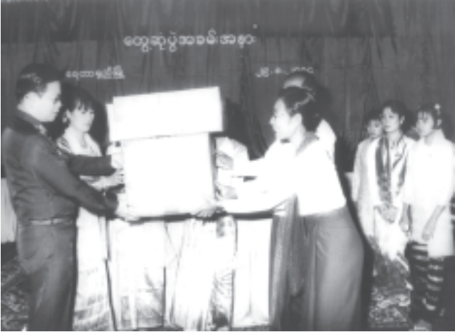
မြန်မာနိုင်ငံ ပညာရေးကော်မတီဥက္ကဋ္ဌ နိုင်ငံတော်ဝန်ကြီးချုပ် ဗိုလ်ချုပ်ကြီးစင်ညွန့်၊ ဩဂုတ် ၂၉ရက်က ပဲခူးတိုင်း ရေတာရှည်မြို့ အခြေခံပညာအထက်တန်းကျောင်း အောင်ဆန်းခန်းမ၌ ရေတာရှည်မြို့ အခြေခံပညာအထက်တန်းကျောင်းအတွက် ရုပ်မြင်သံကြားစက်၊ ဗီဒီယိုပြစက်နှင့် ကွန်ပျူတာတစ်စုံတို့ကို ကျောင်းအုပ်ကြီးအား ပေးအပ်စဉ်။ (သတင်းစဉ်)

နိုင်ငံတော်အစိုးရအနေဖြင့်လည်း ပြည်ထောင်စုကြီး၏ နယ်မြေဒေသ အစိတ်အပိုင်းများအားလုံး ဟန်ချက်ညီညီမျှမျှတတ ဖွံ့ဖြိုးတိုးတက်မြှင့်တင်ရေး တိုင်းရင်းသားစည်းလုံးညီညွတ်ရေး ပိုမိုတိုးပွားနိုင်စေမည်ဆိုသည့် သဘောထား ခံယူချက်ဖြင့် ကျေးလက်ဒေသဖွံ့ဖြိုးရေးလုပ်ငန်းစဉ်ကြီး(၅)ရပ် အပါအဝင် နိုင်ငံတော်ဖွံ့ဖြိုးတိုးတက်ရေး စီမံကိန်းအမျိုးမျိုးကို အကွက်ချ စီမံချမှတ်လျက် အကောင်အထည်ဖော် ဆောင်ရွက်ပေးလျက်ရှိကြောင်း။ သို့ဖြစ်၍ မြို့နယ်အဆင့် ဌာနဆိုင်ရာ တာဝန်ရှိသူများအနေဖြင့် မိမိတို့ မြို့နယ်အတွင်း ရှိထားပြီးဖြစ်သော စေတနာ့ဝန်ထမ်း လူမှုရေးအဖွဲ့အစည်း များကို စည်းရုံးဦးဆောင်လျက် ယင်းလူမှုရေးအဖွဲ့အစည်းများ၏ ထက်မြက်သည့် စွမ်းအားကို တကမ္ဘာတည်းတည်းပေါင်းစုလျက် ထိရောက်အကျိုးရှိစွာ အသုံးပြုပြီး ကျေးလက်ဒေသများမှအစပြုကာ မိမိတို့ မြို့နယ်တစ်ခုလုံး၊ ထိုမှတစ်ဆင့် ပြည်ထောင်စုကြီးတစ်ခုလုံး ဘက်စုံကဏ္ဍစုံက ဖွံ့ဖြိုးတိုးတက်စေရအောင် ကြိုးပမ်းဆောင်ရွက်သွားကြဖို့ မှာကြားလိုကြောင်း။ ဌာနဆိုင်ရာတာဝန်ရှိသူများ၏ မှန်ကန်သော ကြိုးပမ်းဆောင်ရွက်မှု၊ စေတနာပါသော ပံ့ပိုးကူညီမှုများကို ပြည်သူများ သိမြင်ခံစားရသည့်နှင့် အမျှ ပြည်သူများ၏ နိုင်ငံတော်အပေါ် ယုံကြည်အားကိုးမှု၊ ပူးပေါင်းပါဝင်မှုတို့ ဖြစ်ထွန်းလာပြီး မိမိတို့၏ဒေသ ဖွံ့ဖြိုးတိုးတက်ရေး အစီအမံများလည်း အောင်မြင်ဖြစ်ထွန်းလာမှာဖြစ်ကြောင်း။ ဤကဲ့သို့ နိုင်ငံတော်၏ ဦးစီးဦးဆောင်ပြုမှုအောက်တွင် ပြည်သူများ တစ်စိတ်တစ်ပိုင်းတစ်စုံတစ်ရာ ပူးပေါင်းပါဝင်လာသည့်နှင့်အမျှ ပြည်သူများ အကြား စိတ်ဓာတ်ရေးရာ အခြေခံများ တိုးတက်မြင့်မားပြီး အမျိုးသားရေး