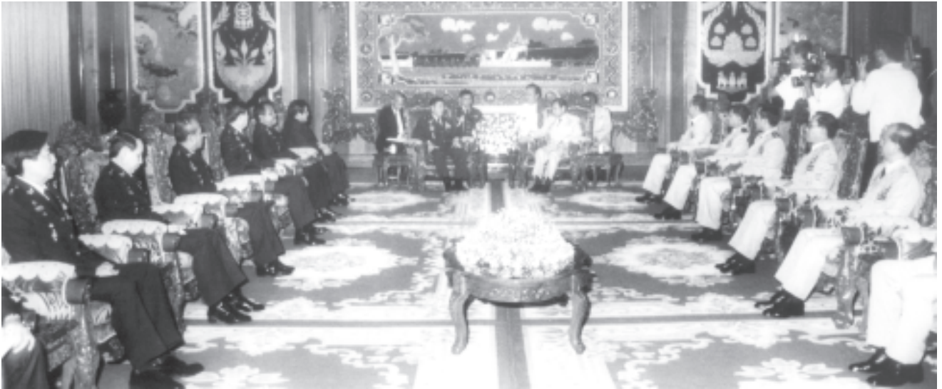
ရန်ကုန်၊ ဩဂုတ် ၃၁

ပြည်ထောင်စုမြန်မာနိုင်ငံတော် နိုင်ငံတော်အေးချမ်းသာယာရေးနှင့် ဖွံ့ဖြိုးရေးကောင်စီဒုတိယဥက္ကဋ္ဌ ဒုတိယတပ်မတော်ကာကွယ်ရေးဦးစီးချုပ် ကာကွယ်ရေးဦးစီးချုပ်(ကြည်း) ဒုတိယဗိုလ်ချုပ်မှူးကြီးမောင်အေးသည် ထိုင်းဘုရင့်တပ်မတော် (ကြည်းတပ်)ဦးစီးချုပ် General Chaisit Shinawatra နှင့်အဖွဲ့အား ယနေ့ညနေ ၆ နာရီတွင် ရန်ကုန်မြို့ ကုန်းမြင့်သာရှိ ဓမ္မပုဏ္ဏားရိပ်သာခန်းမ၌ လက်ခံတွေ့ဆုံသည်။ (အပေါ်ပုံ)