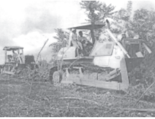
ကော်မီနီနှင့် မကွဲသေးမီးယား စိုက်ပျိုးရေးလုပ်ငန်းရှင်များအတွက် ကော်မီနီနှင့် မကွဲသေးမီးယားစိုက်ခင်းများကို လယ်ယာ စိုက်ပျိုးရေးနှင့်ဆိုင်ရာဝန်ကြီးဌာနက တာဝန်ယူပေးထုတ်ခိုက်ပျိုးပေးလျက်ရှိသည်။

ရန်ကုန် မြို့တော် ၃၁ ကော်မီနီနှင့် မကွဲသေးမီးယား စိုက်ပျိုးလိုသော်လည်း အကြောင်းအမျိုးမျိုးကြောင့် မစိုက်ပျိုး ဖြစ်သော စိုက်ပျိုးရေးလုပ်ငန်းရှင်များအတွက် ကော်မီနီနှင့် မကွဲသေးမီးယားစိုက်ခင်းများကို လယ်ယာ စိုက်ပျိုးရေးနှင့်ဆိုင်ရာဝန်ကြီးဌာနက တာဝန်ယူပေးထုတ်ခိုက်ပျိုးပေးလျက်ရှိသည်။ (အောက်ပုံ)