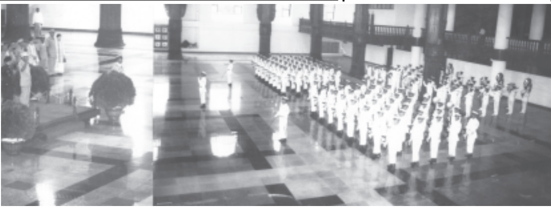
တပ်မတော်(ကြည်းတပ်) ဦးစီးချုပ် ဦးမြတ်ကျော်က ကြည့်ရှုလေ့လာကြစဉ်။ (သတင်းစဉ်)

ပြည်ထောင်စုမြန်မာနိုင်ငံတော် နိုင်ငံတော်အေးချမ်းသာယာရေးနှင့် ဖွံ့ဖြိုးရေးကောင်စီဒုတိယဥက္ကဋ္ဌ ဒုတိယတပ်မတော်ကာကွယ်ရေး ဦးစီးချုပ် ကာကွယ်ရေးဦးစီးချုပ်(ကြည်း) ဒုတိယဗိုလ်ချုပ်မှူးကြီးမောင်အေးနှင့် ထိုင်းဘုရင့်တပ်မတော်(ကြည်းတပ်) ဦးစီးချုပ် General Chaisit Shinawatraတို့ ရန်ကုန်အပြည်ပြည်ဆိုင်ရာလေဆိပ်ရှိ ဂုဏ်ပြုခံခန်းမ ဆောင် အလေးပြုခံစင်မြင့်၌ ဂုဏ်ပြုတပ်ဖွဲ့၏ အလေးပြုမြင်းကို ခံယူစဉ်။ (သတင်းစဉ်)