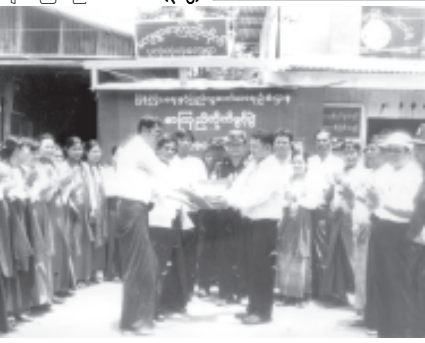
ဩဂုတ် ၁၅ရက်က ကျန်းမာရေးဆိုင်ရာ အသိပညာပေး ဟောပြောပွဲ ကျင်းပသည့် အခန်းအနားတွင် မြို့နယ်အတွင်း ရေးရွာ ဦးလှမျိုးက အမှာစကားပြော ကြားပြီး ရွှေဘိုခရိုင်ဆရာဝန်ကြီးက မိုးရာသီတွင် ဖြစ်ပွားတတ်သော ဝမ်း ပျက်၊ ဝမ်းလျှောရောဂါများ ကာကွယ် နည်း၊ ကူးစက်ရောဂါ ဆရာဝန်ကြီးက ရောဂါပိုးများ ကူးစက်တတ်ပုံနှင့် တိုင်းဆရာဝန်ကြီးက ပြည်သူ့ကျန်းမာ ရေးအတွက် ဟောပြောကြသည်။