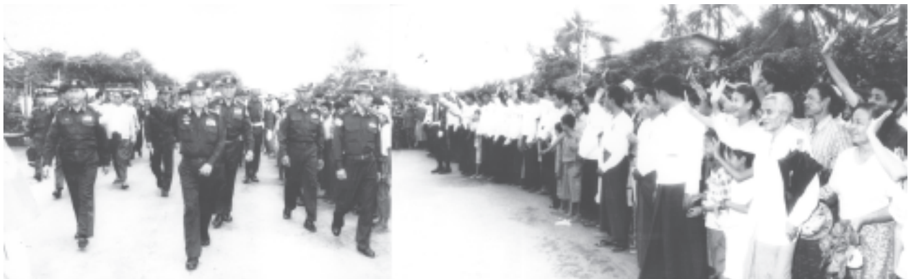
ရန်ကုန်၊ ဩဂုတ် ၃၁

နိုင်ငံတော်ဝန်ကြီးချုပ် ဗိုလ်ချုပ်ကြီးခင်ညွန့်နှင့် အဖွဲ့ဝင်များအား ဩဂုတ် ၂၉ ရက် နံနက်ပိုင်းတွင် ပဲခူးတိုင်း ရေတာရှည်မြို့နယ် သာကရမြို့၌ကျင်းပသည့် အမှတ်(၂)စက်မှုဝန်ကြီးဌာန ဘက်စုံသုံးဒီဇယ်အင်ဂျင်ထုတ်လုပ်မှုစက်ရုံ အဆောက်အအုံ ရတနာအုတ်မြစ်စီ မဟာအခမ်းအနားသို့ တက်ရောက်ချီးမြှင့်ပြီးနောက် နိုင်ငံတော်အေးချမ်းသာယာရေးနှင့် ဖွံ့ဖြိုးရေးကောင်စီဝင်များဖြစ်ကြသော ကာကွယ်ရေးဝန်ကြီးဌာနမှ ဒုတိယဗိုလ်ချုပ်ကြီးရဲမြင့်နှင့် ဒုတိယဗိုလ်ချုပ်ကြီးခင်မောင်သန်း၊ ဗဟိုလေးတိုင်း အေးချမ်းသာယာရေးနှင့် ဖွံ့ဖြိုးရေးကောင်စီဥက္ကဋ္ဌ အလယ်ပိုင်းတိုင်းစစ်ဌာနချုပ် တိုင်းမှူး ဗိုလ်ချုပ်ရဲမြင့်၊ ပဲခူးတိုင်းအေးချမ်းသာယာရေးနှင့် ဖွံ့ဖြိုးရေးကောင်စီဥက္ကဋ္ဌ တောင်ပိုင်းတိုင်းစစ်ဌာနချုပ် တိုင်းမှူး ဗိုလ်ချုပ်ကိုကို၊ အစိုးရအဖွဲ့ အဖွဲ့ဝင်ဝန်ကြီးများ၊ စစ်ဦးစီးအရာရှိချုပ်(ရေ)၊ ဒုတိယဝန်ကြီးများ၊ နိုင်ငံတော်အေးချမ်းသာယာရေးနှင့် ဖွံ့ဖြိုးရေးကောင်စီရုံးမှ တာဝန်ရှိသူများနှင့် ဌာနဆိုင်ရာအကြီးအကဲများနှင့်အတူ ရဟတ်ယာဉ်များဖြင့် သာကရမြို့မှ ထွက်ခွာကြရာ နံနက် ၁၁ နာရီ ၄၅ မိနစ်တွင် ပဲခူးတိုင်း ရေတာရှည်မြို့သို့ ရောက်ရှိကြသည်။