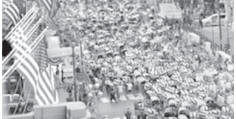
အီရတ်တွင်သေဆုံးခဲ့ရသည့် အမေရိကန်တပ်မှူးဝင်၁၀၀၀ခန့်၏ သဏ္ဌာန်တူရုပ်ကလာပ်များ သယ်ဆောင်ကာ နယူးယောက်မြို့ မက်ဒီဆင်ရင်ပြင်ကိုဖြတ်၍ သမ္မတဘုရား ဆန့်ကျင်ဆန္ဒပြနေကြသည်ကို ဩဂုတ်၂၉ရက်ကတွေ့ရစဉ်။

တစ်နာရီကြာ ချီတက်ဆန္ဒပြစဉ်အတွင်း ရိုပတ်ဘလစ်ကန် ကိုယ်စားလှယ်များနှင့် ထိပ်တိုက်တွေ့ရန် တိုင်းမရဲခြင်းသို့ ချီတက်သွားသူ ၆၀ခန့်ကို ရဲက ဖမ်းဆီးခဲ့သည်။ ထို့အပြင် စင်ထရယ် ဥပဒေရေးရာဌာနမှ လူစုလူဝေးမလုပ်ရန် တားမြစ်ချက်ကို မနာခံဘဲ လူထောင်ပေါင်းများစွာသည် စင်ထရယ်ဥပဒေဌာန၌ စုရုံးခဲ့ကြသည်။ လူရာပေါင်းများစွာက မြက်ခင်းပေါ်၌ လှဲအိပ်ကာ ငြိမ်းချမ်းရေးအမှတ်လက္ခဏာကို လူများဖြင့်ပုံဖော်ပြီး ဆန္ဒပြခဲ့ကြသည်။ အမီအေအိုက်တာ