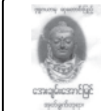
အောင်ချမ်းသာ

ရန်ကုန် ဩဂုတ် ၁ ရန်ကုန်မြို့ ၁၇မြို့သစ်အရှေ့ပိုင်း (၁၃)ရပ်ကွက် ကျွန်စစ်သားလမ်း တိပိဋကမဟာဂန္ဓဝင်နိကာယ်ကျောင်း တိုက်တွင် ဝါဆိုဝါကပ်တော်မူကြမည့် တိပိဋကဓရ မေဃာဌာနဂါရိက အဂ္ဂမဟာပဏ္ဍိတ ရေစကြိုဆရာတော် ဘဒ္ဒန္တဝါယမိန္ဒ အမှူးပြုသော တိပိဋကလောင်းလျာ သံဃာတော်အရှင်သုမြတ်အပါး ၃၀၀တို့နှင့် ဆရာတော်၏ ရန်ကုန်၊ မန္တလေးကျောင်းတိုက်ခွဲများ၌ ဝါဆိုဝါကပ်တော်မူကြမည့် တပည့်သံဃာတော် ၁၃၇၂၀တို့အား နိဗ္ဗာန်ဆွမ်းအလှူရှင်များနှင့် ဒါယကာဒါယကာမများ စုပေါင်း၍ ၁၆၆၄ ခုတိယဝါဆိုလဆုတ် ၈ ရက် (ဩဂုတ် ၈ရက်) နံနက်၁၀နာရီတွင် ဆက်ကပ်လှူဒါန်းမည်ဖြစ်ကြောင်း သိရသည်။ (က-၁)