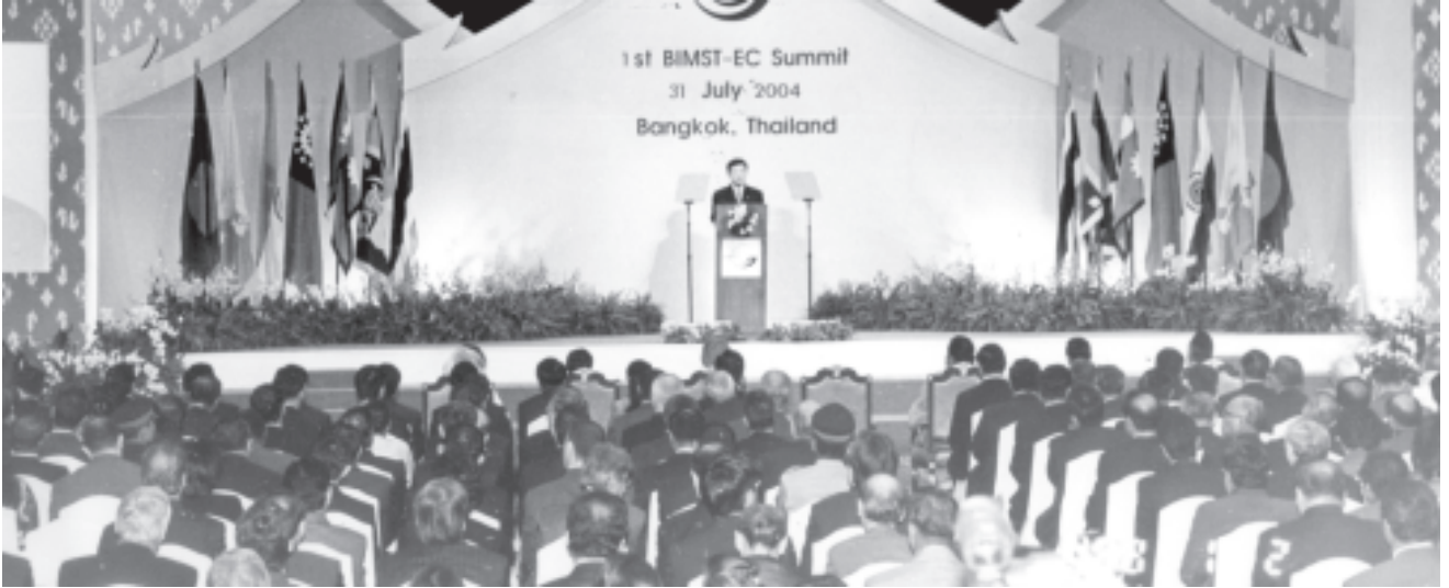
စာမျက်နှာ ၃ မှ

ဘင်းမိစတက်အဖွဲ့သည် အရှေ့တောင်အာရှနှင့် တောင်အာရှနိုင်ငံများ အကြား အရေးကြီးသည့် ပေါင်းကူးဆက်သွယ်မှုတစ်ခုဖြစ်သည်။ အားလျော်စွာ ဘင်းမိစတက်ဒေသတွင်း လွတ်လပ်သောကုန်သွယ်မှုဒေသတစ်ခု တည်ထောင်နိုင်ခဲ့ခြင်းသည် ဒေသ၏ လိုအပ်ချက်ကို ဖြည့်ဆည်းနိုင်ခဲ့သည်ဟု ယူဆပါကြောင်း၊ ထို့အပြင် ဘင်းမိစတက်အဖွဲ့၏ လွတ်လပ်သော ကုန်သွယ်မှုဒေသသည် အဖွဲ့ဝင်နိုင်ငံများအကြား စီးပွားရေးပူးပေါင်းဆောင်ရွက်မှုများ ပိုမိုမြှင့်တင်လာအောင် ဆောင်ရွက်ရာတွင် လိုအပ်သည် ဟု ကျန်းအားတစ်ရပ်ဖြစ်သည်ဟု ယုံကြည်ပါကြောင်း၊ လွတ်လပ်သော ကုန်သွယ်မှုဒေသ တည်ထောင်နိုင်မှုကြောင့်