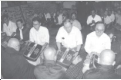
ကျေးဇူးတော်ရှင် ဝနဝါသီဥပဇ္ဈာန်မိမိဆောင်ရွက် ဖော်ပြနိုင် ဆရာတော်ကြီး၏ သက်တော် (၆၃)နှစ်ပြည့် ဝိဇာတမင်္ဂလာပူဇော်ပွဲကို ဩဂုတ် ၁ရက်က သင်္ဃန်းကျွန်းမြို့နယ် ၈/တောင်ရပ်ကွက် သာသနာ့ အလင်းရောင်ဓမ္မာရုံတွင်ကျင်းပရာ ပူဇော်ပွဲကျင်းပရေးကော်မတီဥက္ကဋ္ဌ ဦးသိန်းဦးနှင့် ကော်မတီဝင်များက ရွှေမြင်းရိုက်ဆရာတော်အမှူးပြုသော သံဃာတော်အရှင်မြတ်တို့အား လွှဲဖူးပစ္စည်းများ ဆက်ကပ်လှူဒါန်းကြစဉ်။ (က-၁)

ရန်ကုန် ဩဂုတ် ၁ အားကစားဝန်ကြီးဌာနကကြီးမှူး ၏ မြန်မာနိုင်ငံစက်ဘီးအဖွဲ့ချုပ်နှင့် ရွှေသံလွင်ကုမ္ပဏီတို့ ပူးပေါင်းပြီး ၂၀၀၄ခုနှစ် ပိုးရာသီအမျိုးသား၊ အမျိုးသမီး အလွတ်တန်းတဝေး (လမ်းမပေါ်) စက်ဘီးပြိုင်ပွဲကို ဩဂုတ် ၇ရက် နံနက်၈နာရီခွဲတွင် ကျင်းပရန် စီစဉ်ထားရာ ရန်ကုန်-ပဲခူး-ရန်ကုန် အသွားအပြန် တာဝေး(လမ်းမပေါ်) အမျိုးသား ကိုလိုမီတာ၁၀၀နှင့် အမျိုးသမီး ကိုလိုမီတာ၈၀ ပြိုင်ပွဲများ ပါဝင်သည်။