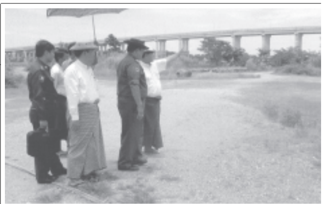
ပို့ဆောင်ရေးဝန်ကြီးဌာနဝန်ကြီး ဗိုလ်ချုပ်လှမြင့်ဆွေ ဗိုလ်မြတ်ထွန်းတံတား ဝန်းကျင်တွင် ကြည့်ရှု စစ်ဆေးစဉ်။ (ပို့ဆောင်ရေး)

ရန်ကုန် ဇူလိုင် ၃၁ ပို့ဆောင်ရေးဝန်ကြီးဌာနဝန်ကြီး ဗိုလ်ချုပ်လှမြင့်ဆွေသည် ရေအရင်းအမြစ်နှင့်မြစ်ချောင်းများ ဖွံ့ဖြိုးတိုးတက်ရေး ဦးစီးဌာနမှ တာဝန်ရှိသူများလိုက်ပါလျက် ယမန်နေ့နံနက်ပိုင်းတွင် ညောင်တုန်းမြို့သို့ ရောက်ရှိလာပြီး ရေအရင်းအမြစ်နှင့် မြစ်ချောင်းများ ဖွံ့ဖြိုးတိုးတက်ရေးဦးစီးဌာနမှ ညွှန်ကြားရေးမှူးချုပ်ဦးချစ်ဇင်က ညောင်တုန်းတံတားရေတိုက်စားမှုမှ ကာကွယ်ရေးလုပ်ငန်းများကို မြေပုံကားချပ်များဖြင့် ရှင်းလင်းတင်ပြသည်။