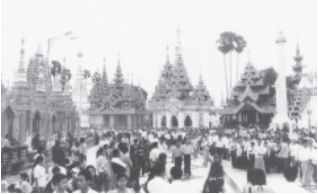
၁၃၆၆ ခုနှစ် ဒုတိယဝါဆိုလပြည့်(ဓမ္မစကြာအခါတော်နေ့)တွင် ရွတ်ဖတ်ပူဇော်တော် ရုပ်ပြတော်တော်တော် အနယ်နယ် အရပ်ရပ်မှ ဘုရားဖူးပြည်သူများဖြင့် စည်ကားလျက်ရှိစဉ်။