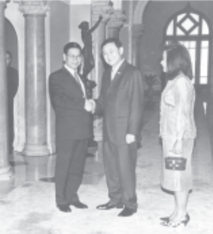
ကြိုဆိုနှုတ်ဆက်

ပြည်ထောင်စု မြန်မာနိုင်ငံတော် နိုင်ငံတော်ဝန်ကြီးချုပ် ဗိုလ်ချုပ်ကြီး ခင်ညွန့် ထိုင်းနိုင်ငံဝန်ကြီးချုပ် မစ္စတာ သက်ဆင်ရှင်နာဝပ်နှင့် ဓနိုး ခွန်ယင်းဗိုဒ်ဂျမန်ရှင်နာဝပ်တို့က ဘင်းမိစတက်အဖွဲ့ဝင်နိုင်ငံများမှ အစိုးရအဖွဲ့အကြီးအကဲများအား တည်ခင်းစဉ်ခံသည့် ဂုဏ်ပြုညစာ စားပွဲသို့တက်ရောက်ရာ ထိုင်းနိုင်ငံ ဝန်ကြီးချုပ် မစ္စတာ သက်ဆင်ရှင်နာဝပ် နှင့် ဓနိုးတို့က လိုက်လံခေါ်ဆောင်စဉ် ကြိုဆိုနှုတ်ဆက်စဉ်။ (သတင်းစဉ်)