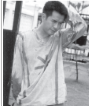
'ရင်နုနုသပြိုင်ပွဲ'ဇာတ်ကားမှ ခန့်စည်သူနှင့် ထွန်းအိန္ဒြာတို့။

ဗီဒီယိုဇာတ်ကားသုံးကားမှ သရုပ်ဆောင်ကွက်အချို့ ကောက်နုတ်ပြသ ရန်ကုန် ဇွန် ၃၀ မကြာမီ ဖြန့်ချိမည့် သရုပ်ဆောင် ဒါရိုက်တာ မင်းအုပ်စိုးခေါင်းဆောင်ပါဝင်သော ဓမ္မဗျူဟာလူမင်းယုမှ ရိုက်ကူးသည့် ဇာတ်ကားသုံးကားမှ ကောက်နုတ်ချက်ချေးချယ်ပြသပွဲကို ဇွန် ၂၇ရက် ညနေ ၅နာရီခွဲက ဦးစာရလမ်း အိုင်ပစ်စာသောက်ခန်းမ၌ ကျင်းပသည်။