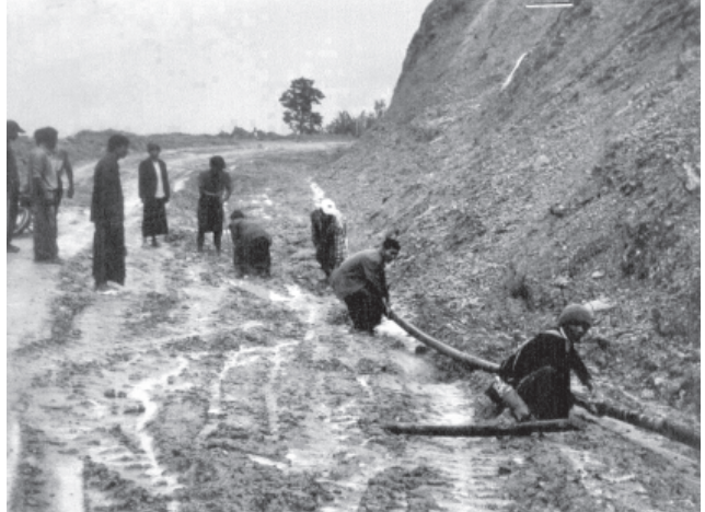
ချမ်းပြည်နယ်၊ မင်းတပ်မြို့နယ်တွင် ဒေသခံတိုင်းရင်းသားများ ဆောက်လုပ်ရေးရရှိရေးအတွက် စည်ပင်သာယာရေးအဖွဲ့က ရေတံခါးလှီးဖျက် တပ်ဆင်ပေးနေသည်ကို ဤသို့တွေ့ရသည်။