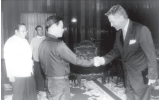
ဇွန် ၃၀ ရက်က ပြည်ထောင်စုမြန်မာနိုင်ငံတော် နိုင်ငံတော်အားချမ်းသာယာရေးနှင့်ဖွံ့ဖြိုးရေးကောင်စီဥက္ကဋ္ဌ ကိုယ်စား နိုင်ငံတော်ဝန်ကြီးချုပ် ဗိုလ်ချုပ်ကြီးစင်ညွန့်က တာဝန်သိမ်းဆောင်ခြင်းပြီးဆုံး၍ ပြန်လည်ထွက်ခွာတော့မည့် ပြည်ထောင်စုမြန်မာနိုင်ငံတော်ဆိုင်ရာ ဆိုင်ခန့်ဝင်သံအမတ်ကြီး Mr. Jan Axel Nordlanderအား ရန်ကုန်မြို့ ကုန်းမြင့်သာရှိ ဓဇယျာသိရိမိမာန်ခန်းမ၌ လက်ခံတွေ့ဆုံနှုတ်ဆက်စဉ်။ (သတင်း-ကျော့မှ) (သတင်းစဉ်)