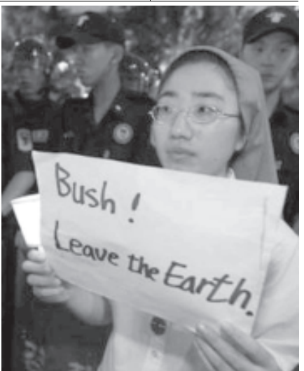
တောင်ကိုရီးယားနိုင်ငံ ဆိုးလ်မြို့၌ အီရတ်စစ်ပွဲနှင့် ပတ်သက်၍ အမေရိကန် ဆန့်ကျင်ရေး ဆန္ဒပြနေသူတစ်ဦးအား ဇွန် ၂၈ ရက်က တွေ့ရစဉ်။