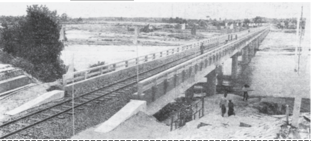
ဒေသခံပြည်သူများသွားလာဆက်သွယ်မှု လွယ်ကူစေရန်အတွက် တည်ဆောက်ပေးထားသော မကွေးတိုင်း အောင်လံမြို့နယ် ပြည်-အောင်လံရထားလမ်းပိုင်းရှိ တွက်ကြွတ်တံတားကို ဤသို့တွေ့ရသည်။