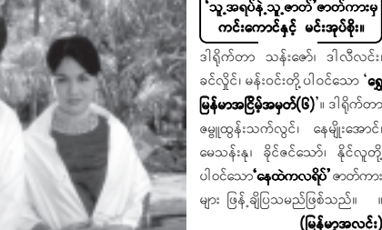
'သူ့အရပ်နဲ့သူ့ဇာတ်'ဇာတ်ကားမှ ကင်းကောင်နှင့် မင်းအုပ်စိုး။