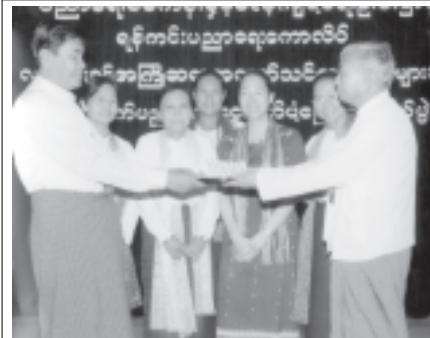
ရန်ကင်းပညာရေးကောလိပ်

ရန်ကုန်တိုင်း သယံဇာတနှင့် သတ္တုပစ္စည်း ကြီးပွားရေးရပ်ကွက် မဟာ စည်မြဝတီသာသနာ့ရိပ်သာ၌ ဝါဆို ဝါကပ်တော်မူကြသည့် မြဝတီဆရာတော်အမှူးရှိသော ဆရာတော်၊ သံဃာတော်အရှင်သူမြတ်တို့အား (၁၃)ကြိမ် မြောက်ဝါဆိုသက်နန်းဆက်ကပ်လွှဲဒါနံ့ ပွဲကို ၁၃မိနစ်ခန့် ဒုတိယဝါဆိုလပြည့် (ဇူလိုင် ၃၀ရက်) စနေနေ့နံနက် ၈နာရီ တွင် ကျင်းပမည်ဖြစ်သည်။ မိမိသဒ္ဓါ အလျောက်လွှဲဒါနံ့လိုသော အလှူရှင်များ မြဝတီသာသနာ့ရိပ်သာ ဖုန်း-၅၅၂၆၄၁၇ ဆက်သွယ်လွှဲဒါနံ့နိုင်ကြောင်းသိရသည်။ (က-ပ)