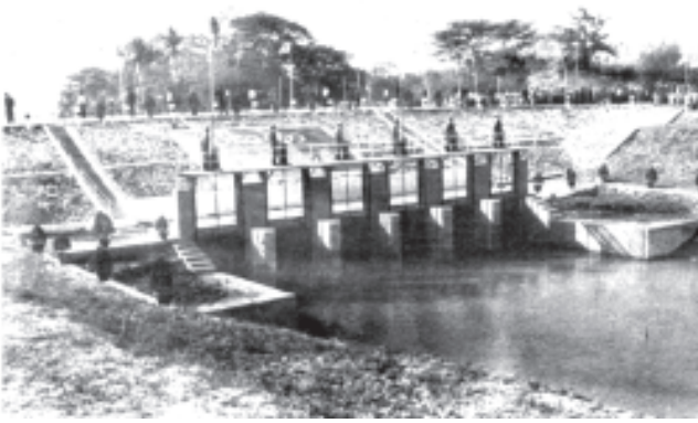
ဧရာဝတီတိုင်း၊ သောင်တုန်းမြို့နယ်၊ သောင်တုန်းကျွန်းဒေသရှိ ဒေသခံတောင်သူလယ်သမားများ၏ စိုက်ပျိုးမြေဧက ၁၅၀၀၀ အတွက် အကျိုးပြုလျက်ရှိသော ဝါးတောရေတံခါးကို ဤသို့တွေ့ရသည်။