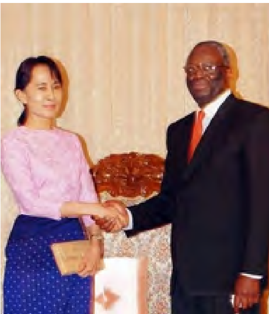
မြန်မာ့ဒီမိုကရေစီခေါင်းဆောင် ဒေါ်အောင်ဆန်းစုကြည်နှင့် မစ္စတာဘန်ကီမိုနီးအောင်မြင်စွာဆက်ဆံနေကြသည်။

ကုလအထွေထွေအသင်းလွှာ အာဘီဘီဘီ ဂမ်ဘာရီသည် စစ်အစိုးရနှင့် အတိုက်အခံ အုပ်စုတို့ကြားမှ တိုးတက်သောဆွေးနွေးပွဲ များဖြစ်ပေါ်လာရေးကို ဆောင်ရွက်ပေးခဲ့ ပြီးနောက် မြန်မာပြည်မှ ပြန်လည်ထွက်ခွာ သွားခဲ့သည်။