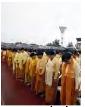
သုတေသနအဖွဲ့က စစ်အစိုးရအတွင်းက အတုအယောင်ထောက်ခံပွဲ ၁၉၀၇ ခုနှစ်မှစ၍ အတင်းအကျပ်စေခိုင်းခြင်းဆိုင်ရာ နိုင်ငံတကာဥပဒေကို နိုင်ငံပေါင်း (၁၅၀) မှ ပြဌာန်းအတည်ပြုခဲ့ပြီးဖြစ်သည်။ ထိုဥပဒေအရ ၁၉၅၇ ခုနှစ်မှစ၍ အတင်းအကျပ် အလုပ်စေခိုင်းခြင်းအား ဖျက်သိမ်းသောဥပဒေတရပ်ကို အမှတ် (၁၀၅) အရ ပြဌာန်းထားခဲ့ပြီးဖြစ်သည်။ ◆

တင်ဘာတော်လှန်ရေးကာလများအတွင်းက ငြိမ်းချမ်းစွာချီတက်ဆန္ဒပြခြင်းဖြင့် ဖော်ထုတ်ပြသခဲ့ပြီးဖြစ်သည်ဟု ထိုကြေညာချက်တွင် ဖော်ပြထားသည်။ ဆက်လက်၍ အလုပ်သမားများ၏သဘောဆန္ဒမပါဝင်ဘဲ ဤသို့ ဖိအားပေးခြင်းခြောက်၍ အတုအယောင်ညီလာခံကို တက်ရောက်စေခြင်းသည် အလုပ်သမားများ၏အခွင့်အရေးကို ချိုးဖောက်နေခြင်းဖြစ်သည်ဟုဆိုသည်။ အလားတူလုပ်ရပ်မျိုးများအား နောက်နောင်တွင် နအဖစစ်ဗိုလ်ချုပ်ကြီးများမှ လုံးဝမပြုလုပ်ရန် မေတ္တာရပ်ခံထားကြောင်းသိရသည်။ ဗီဒီယိုဆက်သွယ်မေးမြန်းရာတွင် “သူတို့အလို အတင်းအဓမ္မခေါ်ဆောင်ခြင်းဖြင့် လူထုစည်းဝေးပွဲတွေပြုလုပ်မယ်ဆိုလို့ရှိရင် ကျမတို့အလုပ်သမားသမဂ္ဂက အိုင်အယ်လ်အိုကိုတိုင်ကြားဖို့ စီစဉ်ထားပါတယ်” ဟု ဖြေကြားခဲ့သည်။ ဆက်လက်၍ အိုင်အယ်လ်အိုသို့တိုင်ကြားပါက ထိရောက်မှုရှိမည်ဟုမျှော်လင့်ကြောင်းကိုလည်း အဆိုပါ အမျိုးသမီးကဆက်လက်ပြောကြားသွားသည်။