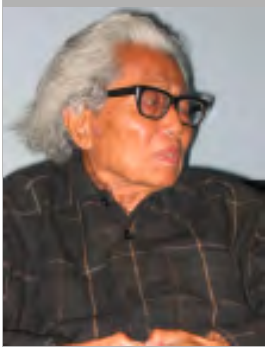
စာရေးဆရာကြီးဒဂုန်တာရာ