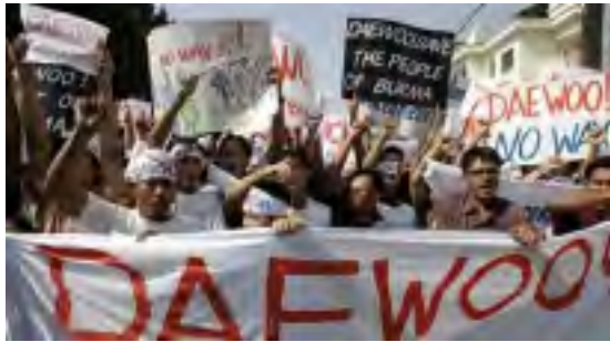
ဒေဂူးကုမ္ပဏီအား ဆန့်ကျင်ဆန္ဒပြနေသည့်သူများ