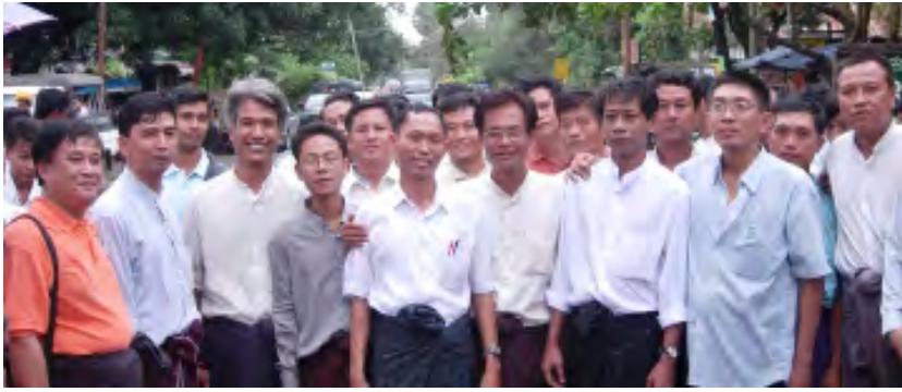
ရှစ်ဆယ့်ရှစ် မျိုးဆက်ကျောင်းသားခေါင်းဆောင်များ