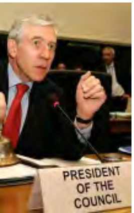
လူစင်ဘာတွင်ပြုလုပ်ခဲ့သည့် ဥရောပသမဂ္ဂနိုင်ငံခြားရေးမှူးချုပ်ကြီးအစည်းအဝေး

အောက်တိုဘာ (၁၆) ယမန်နေ့က လူစင်ဘာတွင်ပြုလုပ်ခဲ့သည့် ဥရောပသမဂ္ဂနိုင်ငံခြားရေးဝန်ကြီးအစည်းအဝေးတွင် မြန်မာနိုင်ငံအားအရေးယူဒဏ်ခတ်ရန်အတွက် ဥရောပသမဂ္ဂနိုင်ငံခြားရေးဝန်ကြီးများက ဆုံးဖြတ်လိုက်သည်။