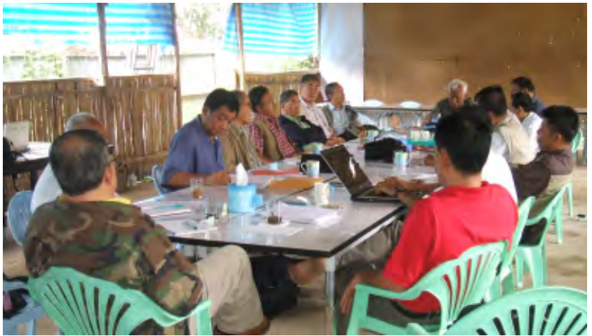
အထွေထွေအတွင်းရေးမှူး၏ခရီးစဉ်အတွက် လုပ်ငန်းညှိနှိုင်းအစည်းအဝေးတရပ်ကျင်းပနေစဉ်