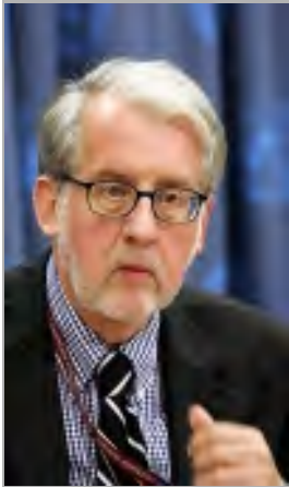
မစ္စတာ ပီညိုရီး

မြန်မာနိုင်ငံခြားရေးဝန်ကြီး ဦးညွှန်ဝင်းက မစ္စတာပီညိုရီးအား နိုဝင်ဘာလနှောင်းပိုင်းတွင် မြန်မာနိုင်ငံသို့လာရောက်နိုင်ကြောင်း ကုလသမဂ္ဂသို့ စာဖြင့်အကြောင်းကြားခဲ့သည်။ မြန်မာ့နအဖစစ်အုပ်စုသည် (၄) နှစ်တာကာလအတွင်း ကုလ၏လွှဲအပ်ချက်အရ အထူးကျွမ်းကျင်သူအား ပြည်ဝင်ခွင့်ကို ပထမဦးဆုံး သဘောတူညီလိုက်ခြင်းဖြစ်သည်။