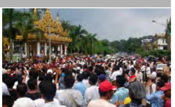
စက်တင်ဘာသပိတ်တိုက်ပွဲတွင် ပါဝင်လှုပ်ရှားခဲ့သည့် ပြည်သူလူထု

ပို့စီတန်းလမ်းလျှောက်ခဲ့သည့် သံဃာတော်များအား ညှိုးညွှန့်ဘက်သဖွယ် ပစ်ခတ်ရိုက်နှက် ဖမ်းဆီးမှုများပြုလုပ်ခဲ့ပြီးသည့်နောက် ကျောင်းတိုက်များသို့လည်း ညစဉ်ညတိုင်း ဝင်ရောက်ဖမ်းဆီးမှုများပြုလုပ်ခဲ့သည်။ ဤသို့ဖမ်းဆီးရာတွင် အသက် (၆) နှစ် (၇) နှစ်အရွယ်ကလေးများကိုပင် ချန်ထားခဲ့ခြင်း မရှိကြောင်းနှင့် သံဃာများအား ချေမှုန်း၊ ဆွမ်းကပ်ခဲ့သူများနှင့် သံဃာထူနောက်မှလိုက်ပါခဲ့သူများကိုပါ ဖမ်းဆီးမည်ပုံရှိသည်ဟု ဆိုခဲ့သည်။