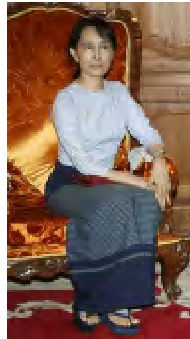
ဒေါ်အောင်ဆန်းစုကြည်

ရောက်ချိန်မှဟုတ်ဘဲ သွားရောက်စစ်ဆေးခဲ့ရ ကြောင်း သတင်းများထွက်ပေါ်လာခဲ့ပြီးနောက်