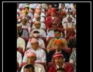
အကုသယောင်ညီလာခံကို စက်တင်ဘာလဆန်း ဝိုင်းတွင် အဆုံးသတ်မည်ဟုဆို စာမျက်နှာ (၁၈) သို့.....