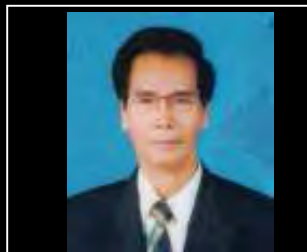
နအဖလမ်းပြခြေပုံကို အစားထိုးမည် ပြည်သူ့ကိုယ်စားလှယ်များ၏လမ်းပြခြေပုံ အထူးစာမျက်နှာသို့.....