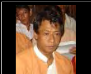
အနီးခေါက် မြေအောက် ကျောင်းသားခေါင်းဆောင် ပြည်တွင်းလှုပ်ရှားမှုများကို ဆက်လက်ဦးဆောင်မည် စာမျက်နှာ (၂) သို့.....