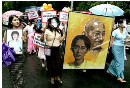
ဆီဂူယာနိုင်ငံတွင် ကျင်းပခဲ့သော မွေးနေ့အခမ်းအနား