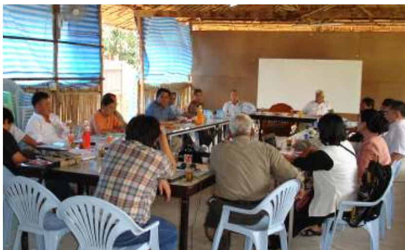
အမျိုးသားကောင်စီ သဘာဝထိအစွဲနှင့် အတွင်းရေးမှူးအစွဲ ပူးတွဲအစည်းအဝေးကျင်းပနေ့စဉ်

ပြည်ထောင်စုရန်မာနိုင်ငံအမျိုးသား ကောင်စီသဘာပတိအဖွဲ့နှင့် အတွင်းရေးမှူး အဖွဲ့ဝင်များ၏ ပူးတွဲအစည်းအဝေးကို ဇွန်လ (၁၄) ရက်နှင့် (၁၅) ရက်နေ့များ၌ ထိုင်း ပြန်မာနယ်စပ်တစ်ခုခု၌ ကျင်းပခဲ့ရာ သဘာ ပတိအဖြစ် အဲန်နီယူဘီဥက္ကဋ္ဌကြီး ဗိုလ်ချုပ် ကြီး စောတာမလာဘောက တာဝန်ယူ၍ တွဲ အဝင်အနာမည်များအဖြစ် အဲန်နီယူဘီ တွဲ အဝင်အထွေထွေအတွင်းရေးမှူး (၁) ဦးနှင့်