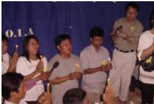
ဒေါ်အောင်ဆန်းစုကြည်နှင့် နိုင်ငံရေးအကျဉ်းသားများအားလုံး လွတ်မြောက်ရေးအတွက် ဆုတောင်းနေစဉ်