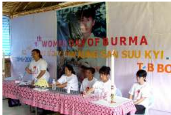
ထိုင်း-မြန်မာနယ်စပ်တွင် ကျင်းပခဲ့သော မွေးနေ့အခမ်းအနား