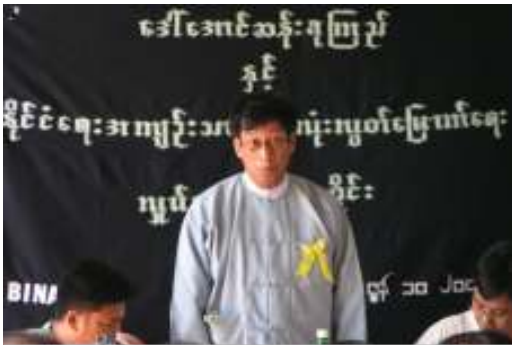
ပြည်သူ့လွှတ်တော်ကိုယ်စားလှယ်များအဖွဲ့ဥက္ကဋ္ဌ ဦးဝိတာလင်းပင်မှ စကားခိုင်းနှင့်ပတ်သက်၍ အမှာစကားပြောကြားစဉ်