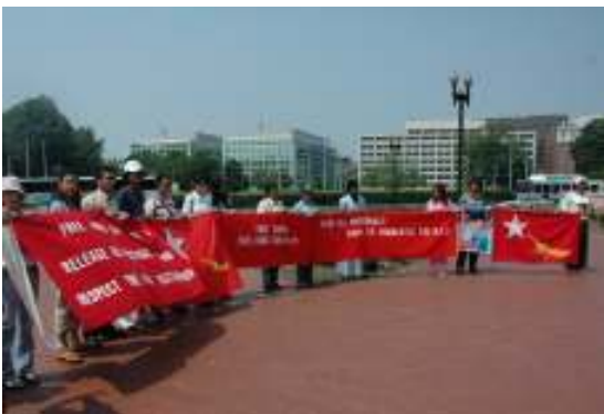
အမေရိကန်ပြည်ထောင်စုတွင် ကျင်းပခဲ့သော မွေးနေ့အခမ်းအနား