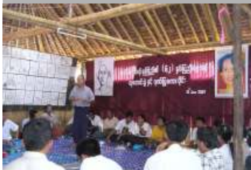
ထိုင်း-မြန်မာနယ်စပ် ရိုးရဲထွေသည့်စခန်းတွင်းကျင်းပခဲ့သော ဆုတောင်းခွဲနှင့် ဂုဏ်ပြုစကားခိုင်း

ထိုင်းနယ်စပ်အခြေစိုက် နိုင်ငံရေးအဖွဲ့အစည်းများနှင့် လူထုအခြေပြု လူ့အဖွဲ့အစည်းများ ပူးပေါင်းဖွဲ့စည်းထားသော ဒေါ်အောင်ဆန်းစုကြည်နှင့် နိုင်ငံရေးအကျဉ်းသားအားလုံး လွတ်မြောက်ရေးလှုပ်ရှားမှု ကော်မတီသည် မေလ (၃၀) ရက်နေ့မှ ဇွန်လ (၁၉) ရက်နေ့အထိ ထိုင်းနိုင်ငံရောက် ခြေပြောင်းအလုပ်သမားများ၊ ထိုင်းမြန်မာနယ်စပ်ရှိ လူမျိုးပေါင်းစုံ ပြည်သူများနှင့် ခူးတိုက်ဆွေးနွေးညှိနှိုင်းမှုများ ပြုလုပ်ခဲ့ကြောင်း ၎င်းကော်မတီ၏ ဘတင်းထုတ်ပြန်အချက်အလက်များကို ဖော်ပြသည်။