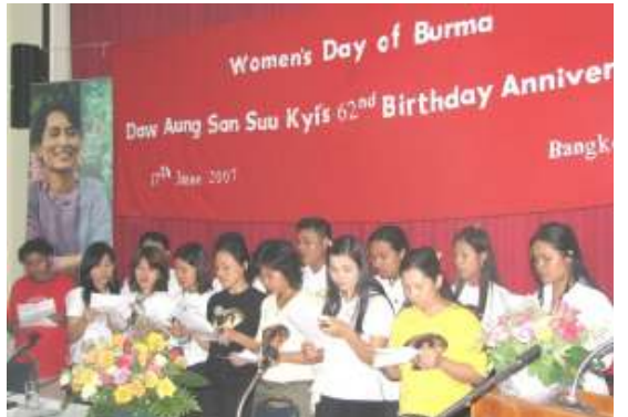
ဘန်ကောက်မြို့ မြန်မာ့ကျောင်းသားများမှ မွေးနေ့အခမ်းအနားတွင် ဆုတောင်းနေစဉ်