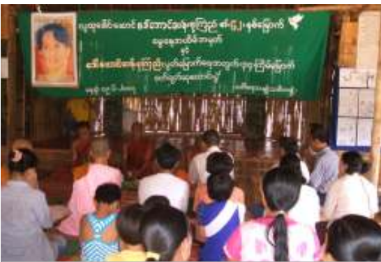
ပို့ဒိုးကုသည့်စခန်းတွင် ကျင်းပခဲ့သော မွေးနေ့အခမ်းအနား

မြန်မာနိုင်ငံ လွတ်လပ်သည့်သတင်းအေဂျင်စီမှ ထုတ်ဝေသည့်