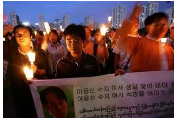
တောင်ကိုရီးယားနိုင်ငံ ဆိုက်ပြီမှ မွေးနေ့ဆုတောင်းပွဲ အခမ်းအနား