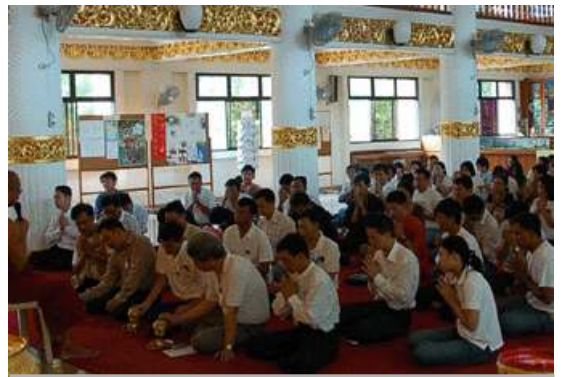
စင်ကာပူနိုင်ငံမှ ရေခဲကျမွေးနေ့ဆုတောင်းအခမ်းအနား