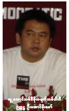
လူ့ဘောင်သစ်ဒီမိုကရက်တစ်ပါတီ ဥက္ကဋ္ဌ ဦးတင်အောင်

ဇွန်လ (၁၃) ရက်နေ့ နေ့စွဲဖြင့် တိုင်း ရင်းသားလူငယ်များ ပူးပေါင်းဆောင်ရွက် ရေးအဖွဲ့ (မြန်မာပြည်) ကလည်း ညောင် နှစ်ပင် ထောက်ခံဆောင်ရွက်မှုများဖြစ်သည့် ဂွမ်ဆယ်ဂွမ်မျိုးဆက်ကျောင်းသား (ပြည် ထောင်စုမြန်မာနိုင်ငံ)၊ ဝံသာနုအဲဒ်အယ်လ်ဒီ နှင့် အလန်ကွန်မြူနစ်ပါတီတို့မှ ဖောက်ပြန် ရေးဝါဒီများအား တောင်တန်းနယ်မြေများ အား မလာရောက်ရန်၊ လာရောက်၍ ဆွေး ထုံးလှုံ့ဆော်ပါက တောင်တန်းသားများမှ ကာကွယ်သွားမည်ဖြစ်ကြောင်း ထုတ်ပြန် ခံမူများတွင် တိုင်းရင်းသားများ၏ လူမျိုး