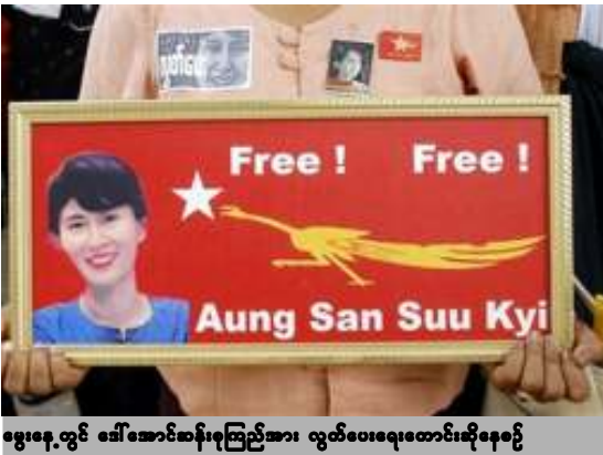
မွေးနေ့တွင် ဒေါ်အောင်ဆန်းစုကြည်အား လွှတ်ပေးရေးတောင်းဆိုနေစဉ်