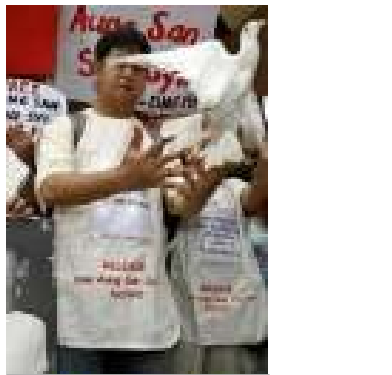
မီလန်ပိုင်နိုင်ငံမှ ဆုတောင်းပွဲ