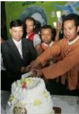
မွေးနေ့ကိတ်တီးနေစဉ်