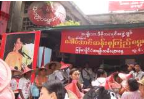
ရွှေဝံတိုင် အဖွဲ့ချုပ်ရုံးတွင် ကျင်းပသောဒေါ်အောင်ဆန်းစုကြည်၏ မွေးနေ့.