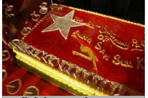
မလေးရှားနိုင်ငံတွင် ကျင်းပခဲ့သော မွေးနေ့အခမ်းအနား