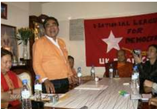
လန်ဒန်မြို့တွင်ကျင်းပသော အင်္ဂလန်ဌာနခွဲဖွဲ့ စည်းခြင်းအခမ်းအနား

၂၀၀၇ ခုနှစ်၊ မေလ (၂၀) ရက်နေ့တွင် အင်္ဂလန်နိုင်ငံ၊ လန်ဒန်မြို့၌ အမျိုးသားဒီမိုကရေစီအဖွဲ့ချုပ် (လွတ်မြောက်နယ်မြေ) အင်္ဂလန်ဌာနခွဲဖွဲ့ ဖွဲ့စည်းလိုက်ကြောင်း သတင်းရရှိသည်။ ယင်းဖွဲ့စည်းသည့် အစည်းအဝေးတွင် အင်္ဂလန်ဌာနခွဲ၏ ဖွဲ့စည်းပုံအခြေခံဥပဒေစည်းမျဉ်းအား ဆွေးနွေးအတည်ပြုခဲ့သည့်အပြင် အောက်ဖော်ပြပါ နာယက (၃) ဦးနှင့် အဖွဲ့ဝင် (၁၂) ဦး ပါဝင်သည့် လုပ်ငန်းကော်မတီကို ရွေးချယ်တင်မြှောက်ခဲ့ကြသည်ဟု သိရှိရသည်။