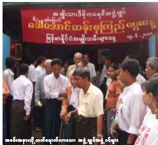
အခမ်းအနားသို့ တက်ရောက်လာသော အဖွဲ့ချုပ်အဖွဲ့ဝင်များ

၆။ ၁၉၅၀ ပြည့်နှစ် ပါတီစုံစိုက်ရေးစီမံအထွေထွေရေးကော်မတီမှပွား ဝင်ရောက်ယှဉ်ပြိုင်အနိုင်ရခဲ့ပြီး ဖျက်သိမ်းခြင်းခံရရတဲ့ နိုင်ငံရေးပါတီများကို ပြန်လည်ဖွဲ့စည်းပေးလို့ လွတ်လပ်စွာစည်းရုံးလှုပ်ရှားခွင့်ပေးရန်တို့ကို နိုင်ငံတော်အရေးချမ်းသာယာရေးနှင့် ဖွံ့ဖြိုးရေးကောင်စီက အကျန်ဆုံးဆောင်ရွက်ပေးရန်။