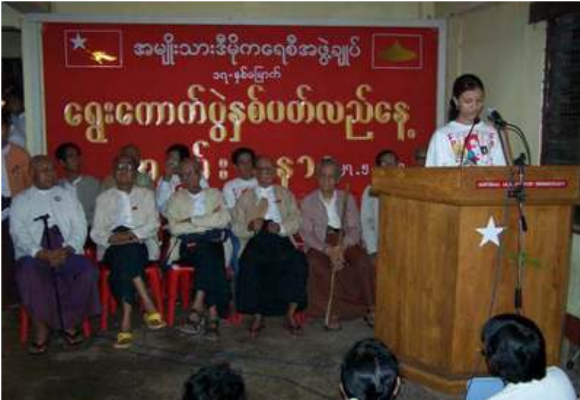
ရွှေဝိုင်း အဖွဲ့ချုပ်ရုံးတွင်ကျင်းပသော (၁၇) နှစ်မြောက် ရွေးကောက်ပွဲနှစ်ပတ်လည်နေ့အခမ်းအနား

၁၉၉၀ ပြည်ရွေးကောက်ပွဲတွင် (၁၂) ရာခိုင်နှုန်းကျော် အနိုင်ရခဲ့သည့် အမျိုးသား ဒီမိုကရေစီအဖွဲ့ချုပ်မှ မေလ (၂၇) ရက်နေ့က ရွေးကောက်ပွဲနှစ်ပတ်လည် အခမ်းအနားတွင် ထုတ်ပြန်ကြေညာချက်၌ ပါတီဝင်တို့က ရေစံ အထွေထွေရွေးကောက်ပွဲကော်မရှင်အား ပြည်သူ့လွှတ်တော် ခေါ်ယူဖွဲ့စည်းပေးနိုင်ရန် သီးသန့်အစီရင်ခံစာကို လူ့သိခွင့်ကြား အမြန်ဆုံးထုတ်ပြန်ပေးရန်နှင့် နအဖကိုလည်း ပြည်သူ့လွှတ်တော်ကို အမြန်ဆုံးခေါ်ယူပေးရန် တောင်းဆိုလိုက်သည်။