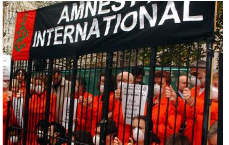
ဂွာတာနာမိုထောင်မှ အကျဉ်းသားများတွေမြင်ရစဉ်

မေ (၁၀) ရက် ညနေပိုင်းက ကြိုးဆွဲချ သေကြောင်း ကြံစည်ရန်ပြင်ဆင်သော အ ကျဉ်းသားကိုကယ်ရန်ကြိုးစားသော အစောင့် များသည် မီးချောင်းအကျိုးအပျက်များ၊ လေပန်ကာမှဒလက်များနှင့် အခြားသတ္တု အပိုင်းအစများကိုင်ဆောင်ထားသည့် အခြား