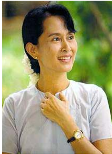
မြန်မာ့ဒီမိုကရေစီခေါင်းဆောင် ဒေါ်အောင်ဆန်းစုကြည်

ကုလသမဂ္ဂ အထွေထွေအတွင်းရေးမှူး ၏ နိုင်ငံရေးလက်ထောက် မစ္စတာဂမ်ဘာရီ (Ibrahim Gambari) သည် မတ်လ (၂၀) ရက်နေ့က မြန်မာ့ဒီမိုကရေစီခေါင်းဆောင် ဒေါ်အောင်ဆန်းစုကြည်နှင့် ရန်ကုန်မြို့တွင် (၁) နာရီကြာတွေ့ဆုံခဲ့သည်။