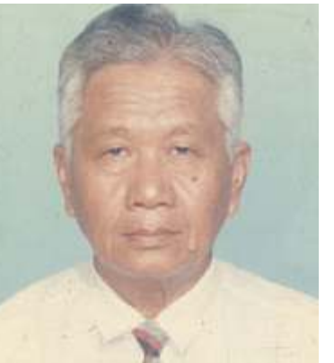
ဒေါက်တာဆလိုင်ထွန်းသန်း

မေလ (၁၀) ရက်နေ့ နေ့စဉ်ဖြင့် သူ၏ ကြေညာချက်တွင် ဆလိုင်ထွန်းသန်းက လက်ရှိမြန်မာနိုင်ငံတွင် ကြုံတွေ့နေရသော အထွေထွေအကျပ်အတည်းအားလုံးအတွက် အဓိကတာဝန်ရှိသူမှာ အာဏာသိမ်းစစ်အစိုးရဖြစ်ပြီး ယင်းအစိုးရကို ပြည်သူတစ်လုံးက မိမိနှင့်အတူ ငြိမ်းချမ်းစွာဖြင့် အာဏာ