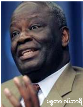
မစ္စတာ ဂမ်ဘာရီ

ဤအတောအတွင်း မြန်မာ့အရေး ဆောင်ရွက်နေသော အာဆီယံဥပဒေပြုအဖွဲ့ က ဒေါ်အောင်ဆန်းစုကြည်လွှတ်ပေးရန် ထပ်မံတောင်းဆိုလိုက်ပြီး ကုလသမဂ္ဂလုံခြုံ ရေးကောင်စီအနေဖြင့် မြန်မာနိုင်ငံရေးအ ကြပ်အတည်းကို ယခုထက် ပိုမိုထိရောက် သောနည်းလမ်းဖြင့် ကြားဝင်ဆောင်ရွက် ပေးရန်တိုက်တွန်းထားသည်။ ❖