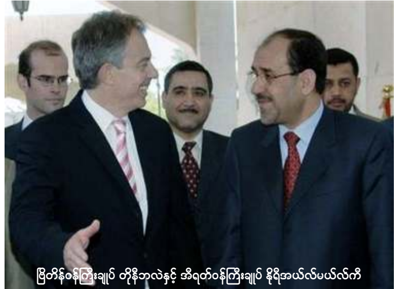
ဗြိတိန်ဝန်ကြီးချုပ် တိုနီဘလဲနှင့် အီရတ်ဝန်ကြီးချုပ် နိုရီအယ်လ်မယ်လ်ကီ

သမတဘုရ်ကမူ အမေရိကန်များဆုတ် ခွာရန် အချိန်ဇယားသတ်မှတ်ရန်ငြင်းဆိုခဲ့ ပြီး အမေရိကန်တပ်များသည် အီရတ်တွင်