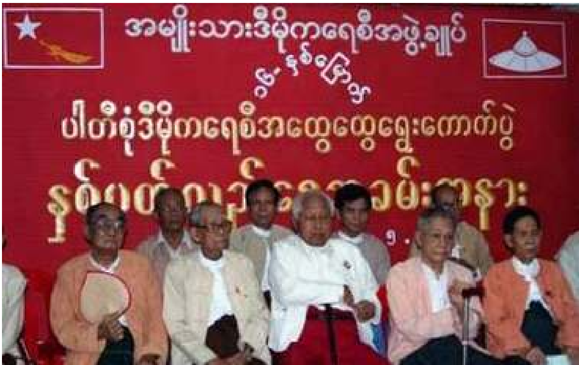
ရန်ကုန် အိန်အယ်လ်ဒီရုံးချုပ်တွင်ကျင်းပသော ရွေးကောက်ပွဲ (၁၆) နှစ်မြောက် နှစ်ပတ်လည်အခမ်းအနား

ဆက်လက်၍ “ကျနော်တို့ ပြည်သူတွေထည့်လိုက်တဲ့မဲတွေ၊ ကျနော်တို့ပြည်သူတွေပေးလိုက်တဲ့ဆန္ဒတွေ ကျနော်တို့ ဘယ်လိုမေ့မှာလဲ။ ကျနော်တို့ နှစ်ပေါင်းများစွာ စစ်အာဏာနစ်နာအောက်မှာ တပါတီအာဏာစနစ်အောက်မှာ ခါးခါးသီးသီးခံခဲ့ရတယ်။ အဲဒီဘဝကို (၈၈) အရေးတော်ပုံနဲ့ ဖြိုလဲနိုင်ခဲ့တယ်။ ကျနော်တို့သမိုင်းမှာ လူထုတိုက်ပွဲတွေ၊ လူထုလှုပ်ရှားမှုနဲ့ပြည့်နေတဲ့သမိုင်းပါ။ ဘယ်နိုင်ငံရဲ့ တော်လှန်ရေးသမိုင်းကိုပဲ ကြည့်ကြည့် လူထုလှုပ်ရှားမှုဟာ အခရာပဲ။ အဲဒီတော့ လူထုရဲစွမ်းအားကို ကျနော်တို့ယုံတယ်။ ကျနော်တို့ကြည်တာက ယနေ့ဟာ တကယ်အရေးကြီးတဲ့အချိန်ကာလကိုရောက်