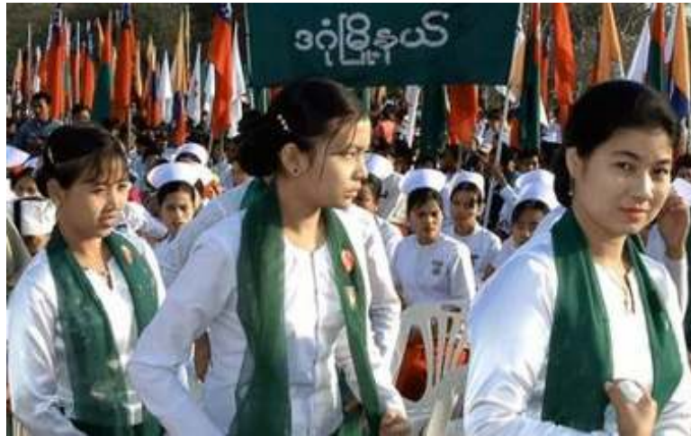
ကြို့ဖွဲ့ပါတီဝင်များအားတွေ့မြင်ရစဉ်

အစီရင်ခံစာအမည် (The White Shirts) သည် ကြို့ဖွဲ့အသင်း၏ဝတ်စုံကို ကိုယ်စားပြုပြီး အီတလီနှင့်ဂျာမနီတို့မှ အာဏာရှင်များ၏ လက်ကိုင်တပ်များဖြစ်သည်