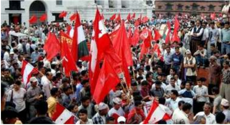
ယခုသမိုင်းဝင်နေ့က ပြည်သူ့အာဏာသည်သာ အထွတ်အထိပ်ဖြစ်သည်ကို သက်သေပြနေသောပြည်သူများ။

မြောက်ကိုးရီးယား၏ နယူးကလီယားလက်နက်စွန့်လွှတ်ရေးကိစ္စကို အကောင်အထည်ဖော်ရာတွင် အမေရိကန်ပြည်ထောင်စု၌ မှန်ကန်သောနိုင်ငံရေးရည်ရွယ်ချက်ရှိကြောင်း တိုက်ရိုက်ရှင်းလင်းပြရန် အမေရိကန်အထူးသံတမန် ခရစ်တိုဖာဟီးလ်ကို မြောက်ကိုးရီးယားက ပြိုယမ်းသို့ဖိတ်ခေါ်ခဲ့သည်။ အိမ်ဖြူတော်က မြောက်ကိုးရီးယား၏ဖိတ်ခေါ်မှုကိုပယ်ချလိုက်သည်။ “အမေရိကန်ပြည်ထောင်စုဟာ မြောက်ကိုးရီးယားနဲ့နှစ်နိုင်ငံတည်း စေ့စပ်ညှိနှိုင်းမှုမျိုးကိုလုပ်မှာမဟုတ်ဘူး”ဟု အိမ်ဖြူတော်ပြောခဲ့ရ တိုနီစနီးကပြောသည်။ သူက ဝါရှင်တန်သည် မည်သည့်စေ့စပ်ညှိနှိုင်းမှုကိုမဆို ခြောက်နိုင်ငံအစီအစဉ်ဖြင့်သာပြုလုပ်မည်ဆိုသည့် ရပ်တည်ချက်ကိုကိုင်စွဲထားမည်ဟုပြောသည်။ မြောက်ကိုးရီးယားကလည်း အမေရိကန်ပြည်ထောင်စု၊ တောင်ကိုးရီးယား၊ မြောက်ကိုးရီးယား၊ တရုတ်၊ ဂျပန်နှင့် ရုရှတို့ပါဝင်သော ခြောက်နိုင်ငံဆွေးနွေးမှုတွင် ပြန်လည်ပါဝင်ဆွေးနွေးရန်ငြင်းဆိုခဲ့သည်။