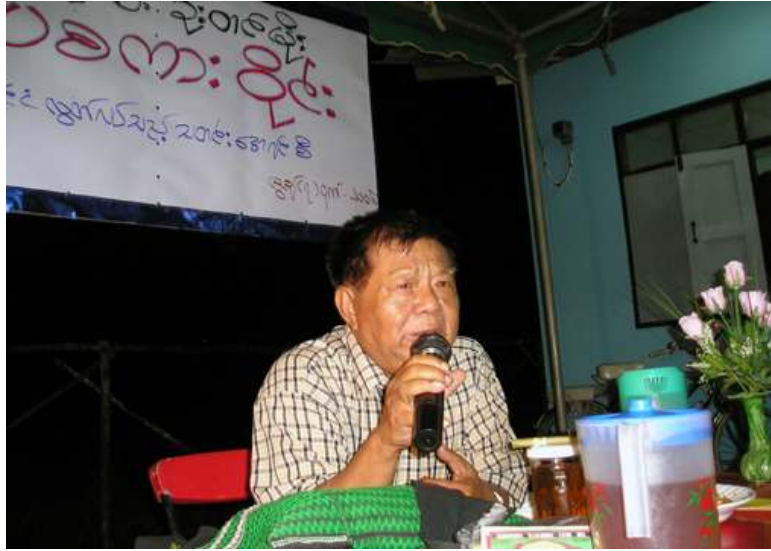
“ကဗျာလက်နက်ကို တော်လှန်ရေးသမားတွေကကြိုက်တယ်။ အဲလိုပဲပြောရမယ်။ နှလုံးသားကိုထိတယ်မှတ်လား ကဗျာက။ လူထုရဲ့နှလုံးသားကို ထိ အောင် တော်လှန်ရေးသမားလူငယ်တွေက လက်နက်အဖြစ်အသုံးပြုတယ်။”

မျိုးချစ်စာဆိုတော်၊ ကဗျာဆရာကြီး ဦးတင်မိုးနှင့် သောင်ရင်းမြစ်အရှေ့ဘက် ကမ်းမှစာပေ၊ ကဗျာမြတ်နိုးသူများ၏ စာပေ ဆွေးနွေးပွဲစကားဝိုင်းတစ်ခုကို ဇွန်လ (၆) ရက်နေ့ညနေခင်းက လွတ်မြောက်နယ်မြေ တနေရာတွင်ကျင်းပပြုလုပ်ခဲ့သည်။ ညနေ (၇) နာရီမှ (၉) နာရီအထိ (၂) နာရီကြာပြုလုပ်သော စာပေဆွေးနွေး စကားဝိုင်းတွင် ကဗျာဆရာကြီးဦးတင်မိုးက သူ၏ ကဗျာဘဝဖြတ်သန်းမှု အတွေ့အကြုံများကို မှတ်မှတ်ရပြန်ပြောင်းပြော ကြားခဲ့ပြီး၊ အစီအစဉ်နောက်ပိုင်းတွင် စာပေ ဆွေးနွေးပွဲသို့ တက်ရောက်လာသူများနှင့် အပြန်အလှန်ဆွေးနွေးခဲ့သည်။ လူငယ်တိုင်း၏ “တော်လှန်ရေးသမား တွေနှင့် ကဗျာဆရာမည်သို့မည်ပုံ ဆက်စပ် ပါသလဲဆရာ” ဟူသောအမေးကို ကဗျာ ဆရာကြီးဦးတင်မိုးက ကဗျာလက်နက်ကို တော်လှန်ရေးသမားတွေကကြိုက်တယ်။ အဲလို ပဲပြောရမယ်။ နှလုံးသားကိုထိတယ်မှတ် လား ကဗျာက။ လူထုရဲ့နှလုံးသားကိုထိအောင် တော်လှန်ရေးသမားလူငယ်တွေက လက် နက်အဖြစ်အသုံးပြုတယ်။ ကျနော်ကတော့ အဲလိုပဲထင်တယ်။”ဟု ပြန်လည်ဖြေကြားခဲ့ သည့်အပေါ် ပရိသတ်များက နှစ်သက်ကြ ဘာပေးခဲ့ကြသည်။ ဆရာတင်မိုးအတွက် အမှတ်တရ ရေး