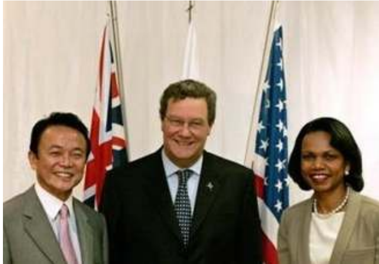
အမေရိကန်နိုင်ငံခြားရေးဝန်ကြီး ကွန်ဒိုလီဇာရိုင်၊ ဩစတြေးလျနိုင်ငံခြားရေးဝန်ကြီး အလက်ဇန္ဒားဒေါင်နာနှင့် ဂျပန်နိုင်ငံခြားရေးဝန်ကြီး မစ္စတာ တာရိုအာဆို

မြန်မာနိုင်ငံတွင် စစ်မှန်သောဒီမိုကရေစီတည်ဆောက်မှုလုပ်ငန်းစဉ်တွင် အရေးကြီးကိစ္စတစ်ခုဖြစ်သော နိုင်ငံရေးအကျဉ်းသားများအားလုံး လွတ်ပေးရေးအပါအဝင် မြန်မာ့နိုင်ငံရေး ဖြစ်ပေါ်တိုးတက်ရေးကိစ္စများကို အလေးထားစောင့်ကြည့်သွားမည်ဟု အမေရိကန်၊ ဂျပန်နှင့် ဩစတြေးလျနိုင်ငံများက မတ်လ (၁၀) ရက်နေ့က ထုတ်ဖော်ပြောဆိုလိုက်သည်။