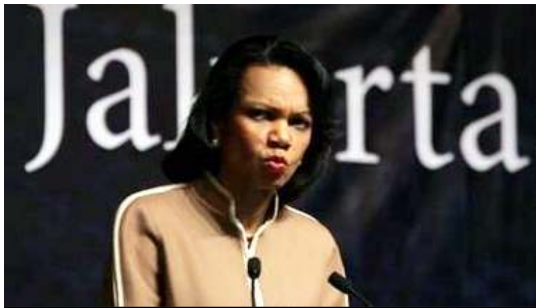
အမေရိကန်နိုင်ငံခြားရေးဝန်ကြီး ကွန်ဒိုလီဇာရိုင်

အာဆီယံနိုင်ငံ ခေါင်းဆောင်များအနေဖြင့် မြန်မာနိုင်ငံမှ စစ်တပ်အာဏာရှင်၏ အန္တရာယ်ကို ပေါ့ပေါ့တန်တန် သဘောမထားကြရန် အမေရိကန်နိုင်ငံခြားရေးဝန်ကြီး ကွန်ဒိုလီဇာရိုင်ကမတ်လ (၁၅) ရက်နေ့တွင် သတိပေးပြောဆိုလိုက်သည်။