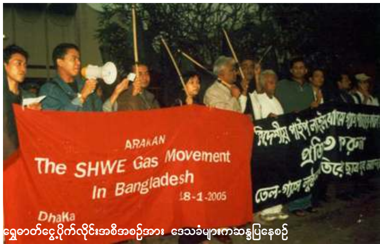
ရွှေစာတင်ငွေပိုက်လိုင်းအစီအစဉ်အား ဒေသသမားကဆန္ဒပြနေစဉ်

မြန်မာနိုင်ငံမှ ဓာတ်ငွေ့နှင့် တရုတ်နိုင်ငံမှ ချေးငွေလဲလှယ်အစီအစဉ်ကို ဆက်လက်ဆောင်ရွက်မည်ဟု နအဖက မတ်လ (၂၇) ရက်နေ့တွင် အတည်ပြုပြောသည်။ အိန္ဒိယနိုင်ငံတွင်ထုတ်ဝေသော (The Times) သတင်းစာအရ မြန်မာနိုင်ငံ အနောက်ဘက်အခြမ်း၊ ရခိုင်ကမ်းလွန်ဒေသမှ တရုတ်နိုင်ငံ ယူနန်ပြည်နယ်သို့ (၂၃၈၀) ကီလိုမီတာရှည်သော ဓာတ်ငွေ့ပိုက်လိုင်း တည်ဆောက်ရန် တိုင်းတာမှုများ ပြီးဆုံးသွားပြီ ဟုဆိုသည်။