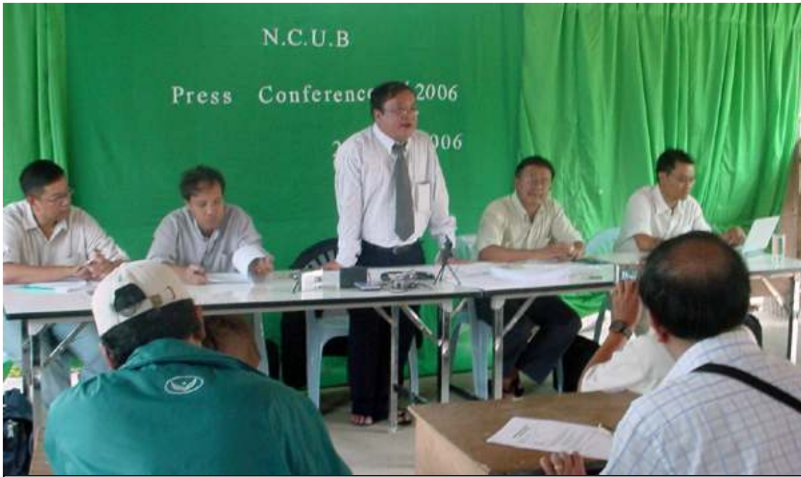
ထိုင်း-မြန်မာနယ်စပ်တနေရာတွင်ကျင်းပသော အိန္ဒိယဘူတို၏ သတင်းစာရှင်းလင်းပွဲ (၁/၂၀၀၆)

ပြည်သူလူထုကြားတွင် အဲဒီအယ်လ်ဒီ အရေးပေါ်မရှိတော့ဟူသော နအဖ၏အခြေ မမြစ်မရှိသောပြောဆိုချက်သည် အမှန်တရား ကို အကြောက်တရားဖြင့် ငြင်းဆန်နေခြင်း သာဖြစ်ကြောင်း ပြည်ထောင်စုမြန်မာနိုင်ငံ အမျိုးသားကောင်စီက မတ်လ (၂၉) ရက် နေ့တွင် တုံ့ပြန်ပြောဆိုလိုက်သည်။