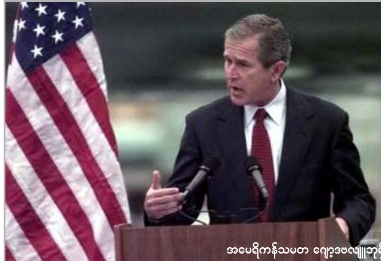
အမေရိကန်သမ္မတ ဂျော့ဗလူဘူဂ်

ထို့အပြင် တရုတ်ခေါင်းဆောင်များအနေဖြင့် တရုတ်ပြည်သူများ၏ လွတ်လပ်မှု၊ တည်ငြိမ်ရေးနှင့် ချမ်းသာကြွယ်ဝမှုအတွက်