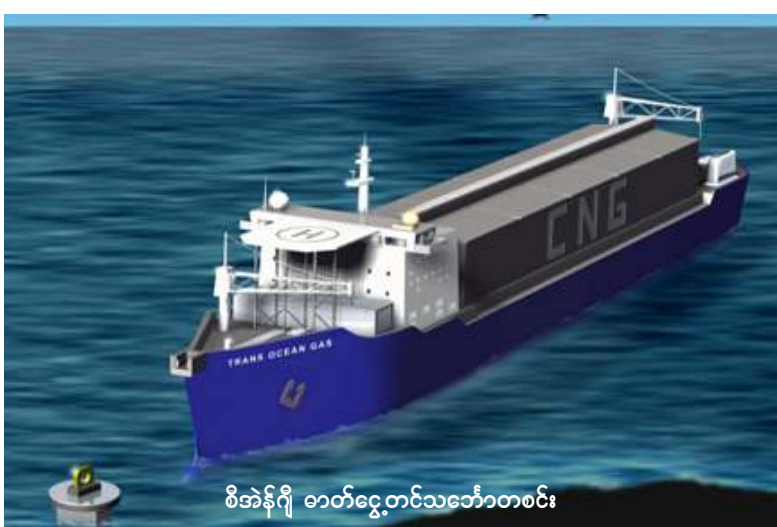
စီအဲန်ဂျီ ဓာတ်ငွေ့တင်သင်္ဘောတစင်း

ဘင်္ဂလားဒေ့ရှ်နိုင်ငံကိုဖြတ်၍ အိန္ဒိယသို့ ဓာတ်ငွေ့ ပိုက်လိုင်းကိုသွယ်တန်းရမည်ဖြစ်သဖြင့် ပိုက်လိုင်းအတွက် ငွေကြေးအမြောက်အမြားရင်းနှီးရမည်ဖြစ်သည်။