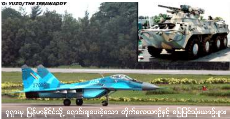
ရုရှားမှ မြန်မာနိုင်ငံသို့ ရောင်းချပေးခဲ့သော တိုက်လေယာဉ်နှင့် ပြေပြင်သုံးယာဉ်များ

လွန်ခဲ့သော (၃) နှစ်ကျော်က မော်စကိုသည် တရုတ်၊ အိန္ဒိယနှင့် ယူကရိန်းနိုင်ငံများနည်းတူ မြန်မာနိုင်ငံသို့ (Mi G-29) အမျိုး