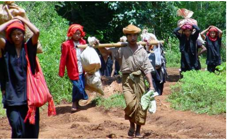
နအဖတပ်၏ ဖြတ်လေးဖြတ် စစ်ဗျူကြောင့် ရှမ်းပြည်နယ်နယ်အတွင်းမှ ဒေသခံများ၏နေ့စဉ်ဘဝများ၊ အသက်အိုးအိမ်များ လုံခြုံမှုမရှိကြရှာတော့

ရှမ်းပြည်အရှေ့ပိုင်း မိုင်းဖြတ်နှင့် မိုင်း ဆတ်မြို့နယ်အတွင်းရှိ ကျေးရွာ (၁၀) ရွာ ကျော်ကို နအဖစစ်တပ် ဗိုလ်မှူးကြီး ခမရ (၅၇၉) တပ်ရင်းက ဖေဖော်ဝါရီလ (၂၀) ရက်နေ့ နောက်ဆုံးထားရွှေ့ပြောင်းရန် အမိန့်ထုတ်ခဲ့ကြောင်းသိရှိရသည်။