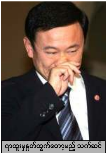
ရာထူးမှနှုတ်ထွက်တော့မည့် သက်ဆင်

ဤအတောအတွင်း ထိုင်းနိုင်ငံတောင် ပိုင်း နရတ်ဝ ခရိုင်ရှိ မဲရုံးသုံးခုအနီးတွင်မဲပေး အပြီး မိနစ်ပိုင်းအတွင်း ဗုံး (၃) လုံး ပေါက် ကွဲခဲ့ပြီး စစ်သား (၄) ဦးနှင့် ရဲအရာရှိတဦး သေဆုံးခဲ့သည်။ ဘန်ကောက်မြို့တော်တွင် ရွေးကောက်ပွဲဆန္ဒကျင့်သူများ၏ ဝန်ကြီး ချုပ် တက်ဆင်ရာထူးမှဆင်းပေးရေးတောင်း သောလှုပ်ရှားမှုများ အရှိန်မပျက် ဆက်လက် ရှိဆဲဖြစ်သည်။