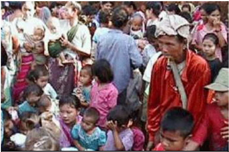
သံလွင်မြစ်ကမ်းဘက်သို့ အိုးအိမ်စွန့် ထွက်ပြေးလာကြသော ကရင်ရွာသားများ

ထိုင်းဘက်ကလည်း ဒုက္ခသည်များထွက် ပြေးလာသည့်အကြောင်းရင်းကို မသိရသေး