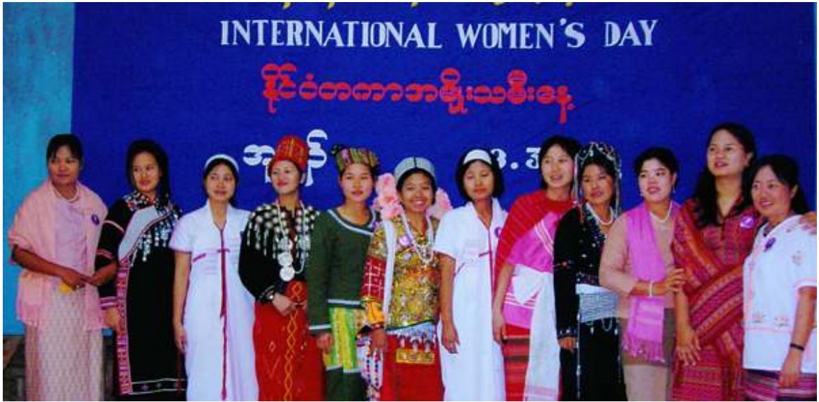
နိုင်ငံတကာအမျိုးသမီးနေ့တွင် တွေ့မြင်ရသော အမျိုးသမီးခေါင်းဆောင်များ

အမျိုးသမီးများ၏ လူမှုရေးစုဆိုင်ရာ အခွင့်အရေး၊ ယဉ်ကျေးမှုဆိုင်ရာအခွင့်အရေး၊ စီးပွားရေးနှင့် နိုင်ငံရေးဆိုင်ရာအခွင့်အရေး လှုပ်ရှားမှုများကို အသိအမှတ်ပြုသည့်အနေ