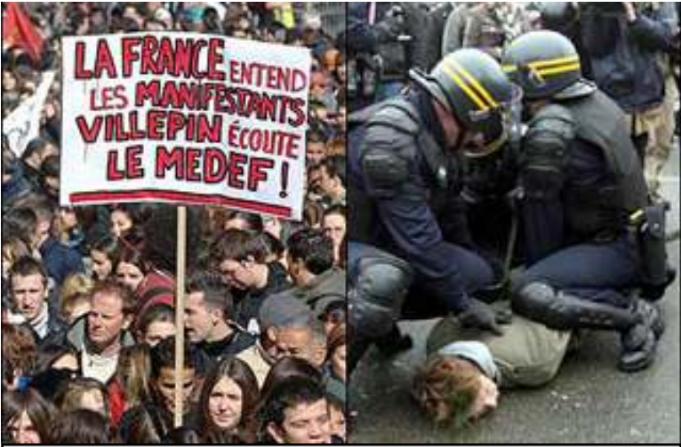
ပြင်သစ်အလုပ်သမားဥပဒေသစ်ကို ဆန္ဒပြသူများနှင့် ရဲများပဋိပက္ခဖြစ်ပွားစဉ်

(၂၀၀၆) ခုနှစ်၊ မတ်လကုန်ထိ ကျဆုံးသွားသော အမေရိကန်နှင့်ညွှန်ပေါင်းတပ်ဖွဲ့များမှ အတည်ပြုပြီးစစ်သားဦးရေမှာ စုစုပေါင်း (၂,၅၃၃) ဦးရှိသွားပြီဖြစ်ပြီး အမေရိကန်စစ်သား (၂,၃၂၆)၊ ဗြိတိသျှစစ်သား (၁၀၃) ဦး၊ ဘူဂေးရီးယားစစ်သား (၁၃)ဦး၊ ဒိန်းမတ်စစ်သား (၃) ဦး၊ ဒတ်ချ်စစ်သား (၂) ဦး၊ အက်စ်တိုနီးယားစစ်သား (၂) ဦး၊ ဟန်ဂေရီစစ်သား (၁) ဦး၊ အီတလီစစ်သား (၂၆) ဦး၊ ဂါဇက်စစ်သား (၁) ဦး၊ လတ်ဗီယန်စစ်သား (၁) ဦး၊ ပိုလန်စစ်သား (၁၇) ဦး၊ ဆာဗေးဗီးစစ်သား (၂) ဦး၊ ဆလိုဗက်စစ်သား (၃) ဦး၊ စပိန်စစ်သား (၁၁) ဦး၊ ဩစတေးလျ (၁) ဦး၊ ထိုင်းစစ်သား (၂) ဦး၊ ဖိဂျီစစ်သား (၁) ဦးနှင့် ယူကရိန်းစစ်သား (၁၈) ဦးတို့ဖြစ်ကြသည်။ ပင်တဂွန်သတင်းဌာနအရ စစ်ပွဲအတွင်း ဒဏ်ရာရရှိသော အမေရိကန်စစ်သားများမှာ (၁၇,၂၆၉) ဦးရှိပြီဖြစ်သည်။❖