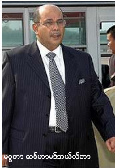
မစ္စတာ ဆစ်ဟာမဒ်အယ်လ်ဘာ

မြန်မာနိုင်ငံ၌ မတ်လ (၂၅)ရက်နေ့ အထိနေထိုင်ရန်ယခင်က စီစဉ်ထားခဲ့သော်လည်း မလေးရှားနိုင်ငံခြားရေးဝန်ကြီး မစ္စတာအယ်လ်ဘာသည် နအဖဝန်ကြီးချုပ် ဗိုလ်ချုပ်စိုးဝင်းနှင့် မိနစ် (၂၀) ကြာ တွေ့ဆုံအပြီး မတ်လ (၂၄) ရက်နေ့ ညနေက လေဆိပ်သို့ ရုတ်တရက်ထွက်ခွာသွားသဖြင့် ရန်ကုန်သံတမန်များနှင့် နိုင်ငံရေးအသိုင်းအဝိုင်းက တအံ့တကြဖြစ်နေကြသည်။