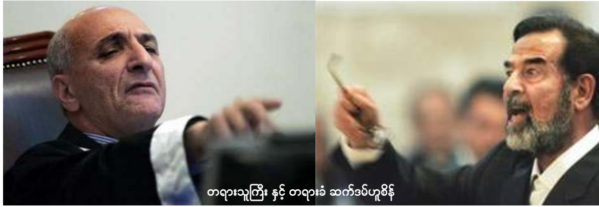
တရားသူကြီး နှင့် တရားခံ ဆက်ဒမ်ဟူမိန်