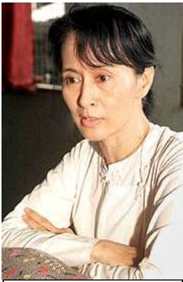
မြန်မာ့ဒီမိုကရေစီခေါင်းဆောင် ဒေါ်အောင်ဆန်းစုကြည်

အင်္ဂလန်နိုင်ငံ ရှက်ဖီးလ်မြို့တော်ကောင်စီက မြန်မာ့ဒီမိုကရေစီခေါင်းဆောင် ဒေါ်အောင်ဆန်းစုကြည်ကို မြို့တော်၏ အမြင့်ဆုံးဂုဏ်ထူးဆောင် လွတ်မြောက်ရေးဆုကို ချီးမြှင့်လိုက်ကြောင်း သိရှိရသည်။ ဆုပေးပွဲအခမ်းအနားကို နိုင်ငံတကာ အမျိုးသမီးများနေ့ဖြစ်သော မတ်လ (၈) ရက်နေ့တွင် ကျင်းပခဲ့ပြီး၊ အခမ်းအနားသို့ မြန်မာနိုင်ငံသား (၁၀၀) အပါအဝင်၊ စုစုပေါင်း ပရိသတ် (၃၀၀) ကျော် တက်ရောက်ခဲ့သည်။ ရှက်ဖီးလ်မြို့တော်ကောင်စီ အရာရှိချုပ် ဆာဘော့ကားစလိတ်နှင့် ရှက်ဖီးလ်မြို့တော်ဝန် ချော်ဂျာဒေဗစ်ဆင်တို့က ပူးတွဲချီးမြှင့်ပြီး အကျယ်ချုပ်ကျခံနေရသော ဒေါ်အောင်ဆန်းစုကြည်ကိုယ်စား သူမ၏ ကွယ်လွန်သူခင်ပွန်းမိုက်ကယ်လ်အဲရစ်၏အစ်ကိုတော်သူ အန်ထော်နီအဲရစ်စက လက်ခံရယူခဲ့သည်။ ရှက်ဖီးလ်မြို့တော်ဝန်က ချီးမြှင့်သောဆုကို ယခင်ကလည်း ကမ္ဘာတဝှမ်းက လွတ်