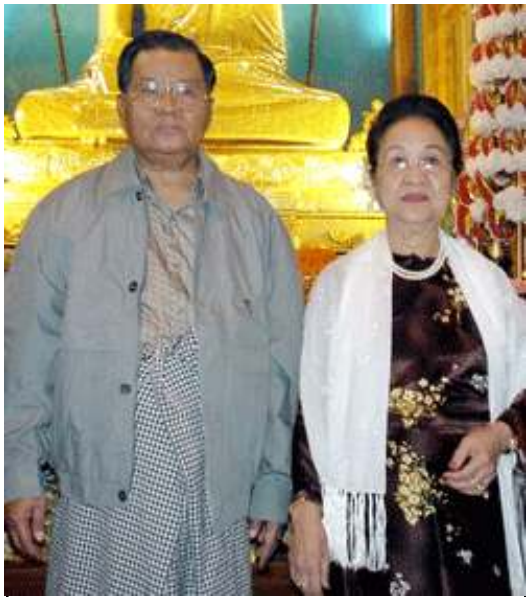
ဗိုလ်ချုပ်မှူးကြီးသန်းရွှေနှင့် ဇနီး ဒေါ်ကြိုင်ကြိုင်

ထိုင်းနိုင်ငံ၊ ဘန်ကောက်မြို့တွင် မတ်လ (၂၉) ရက်နေ့က ပြုလုပ်ခဲ့သော သတင်းစာရှင်းလင်းပွဲ၌ နအဖဗိုလ်ချုပ်ကြီးများ ရန်ကုန်မှ ဆုတ်ခွာရခြင်းအကြောင်းအရင်းများအနက် အဓိကမှာ ဗိုလ်ချုပ်မှူးကြီးသန်းရွှေ၏ဇနီး၊ ဒေါ်ကြိုင်ကြိုင်၏ အိပ်မက်