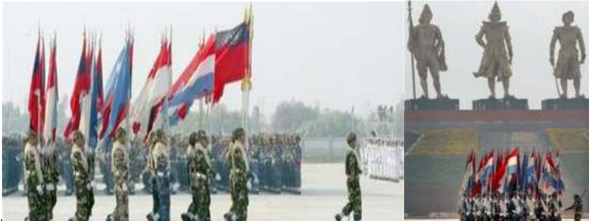
ပျဉ်းမနား ကြပ်ပေးတွင် ကျင်းပသော (၆၁) နှစ်မြောက် တော်လှန်ရေးနေ့အခမ်းအနား စစ်ရေးပြပြင်ကွင်း

ပျဉ်းမနား ကြပ်ပေးတွင် မတ်လ (၂၇) ရက်နေ့က ကျင်းပသော ‘(၆၁) နှစ်မြောက် တပ်မတော်နေ့အခမ်းအနား’ စစ်ရေးပြ စစ်ကြောင်းများတွင် အောင်ဆန်းစစ်ကြောင်းကို ပြုတ်ပစ်လိုက်ကြောင်းသိရှိရသည်။