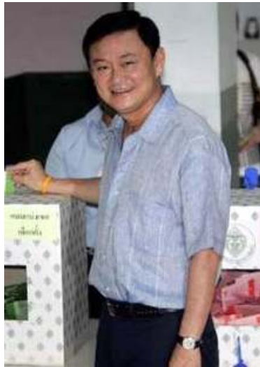
ရွေးကောက်ပွဲနေ့တွင် ပြုစုခွင့်စွာ မဲပေးနေသော ဝန်ကြီးချုပ် သက်ဆင်

ထိုင်းနိုင်ငံတွင် မဲပေးနိုင်သူအရေအတွက် (၄၅ ဒသမ ၂) သန်းရှိပြီး မဲဆန္ဒရှင်များ သည် ကိုယ်စားလှယ်များကို မကြိုက်လျှင် မဲမပေးခွင့်ရှိသည်။ အစောပိုင်းတွင် တက္ကသိုလ် (၄၁) ခုမှ ကထိက (၆၀၀) ခန့်က မဲမပေး ရေးအတွက် လူထုကိုတိုက်တွန်းခဲ့သည်။ ၎င်းတို့က မဲမပေးခြင်းသည် တက်ဆင်