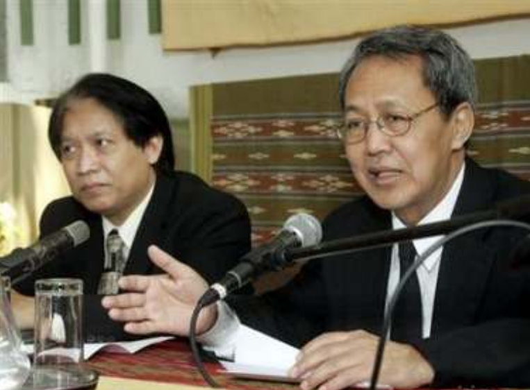
ဝန်ကြီးချုပ်ဒေါက်တာစိန်ဝင်းဦးနှင့် ကုလသမဂ္ဂရေးရာ တာဝန်ခံ ဒေါက်တာသောင်းထွန်း

ပြီးခဲ့သည့် ပြည်ထောင်စုနေ့က အဲန်အယ်လ်ဒီ၏လွှတ်တော်ခေါ်ယူပေးရေး ကမ်းလှမ်းချက်ကို နအဖဘက်က မလိုက်လျောလျှင် ကုလသမဂ္ဂလုံခြုံရေးကောင်စီက မြန်မာ့အရေးကို ကြားဝင်ဖြေရှင်းရန် အခြေအနေနှင့်ပို၍နီးလာနိုင်သည်ဟု ပြည်ထောင်စု မြန်မာနိုင်ငံအမျိုးသားညွန့်ပေါင်းအစိုးရ (အဲန်စီဂျီယူဘီ) ၏ ကုလသမဂ္ဂရေးရာတာဝန်ခံက မတ်လဆန်းပိုင်းတွင် ပြောဆိုလိုက်သည်။ “ဧပြီ (၁၇) ရက် ရောက်လို့မှ နအဖဘက်က မတုံ့ပြန်ဘူးဆိုရင် မြန်မာ့အရေးဟာ လုံခြုံရေးကောင်စီအထိတက်ဖို့ ပိုနီးလာတဲ့သဘောပါပဲ” ဟု အဲန်စီဂျီယူဘီကုလသမဂ္ဂရေးရာတာဝန်ခံ ဒေါက်တာသောင်းထွန်းက ဥရောပခရီးစဉ်၌ ဒီဗီဘီသို့ပြောကြားလိုက်သည်။ အမေရိကန်ပြည်ထောင်စုကသာ စိတ်ပါလက်ပါလုပ်သွားမည်ဆိုလျှင် မြန်မာ့အရေးသည် လုံခြုံရေးကောင်စီတွင် မဖြစ်မနေဆွေးနွေးစရာကိစ္စတစ်ခုဖြစ်လာနိုင်ကြောင်း၊ ယင်းကိစ္စပေါ် တရုတ်၏ကန့်ကွက်မှုရှိလာနိုင်သော်လည်း လက်တွေ့တွင် တရုတ်သည် မြန်မာ့ကိစ္စအပေါ် စိုးရိမ်နေမှုများရှိနေသလို၊ အမေရိကန်ကလည်း တရုတ်ကိုဖျောင်းဖျားချသွားရန် ဆုံးဖြတ်ထားသည်ဟု ၎င်းက ထပ်မံပြောဆိုသည်။ အမေရိကန်ပြည်ထောင်စု၏ ဦးဆောင်