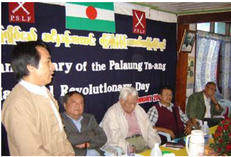
ပလောင်အမျိုးသားနေ့အခမ်းနားမြင်ကွင်း

ခရစ်သက္ကရာဇ် (၂၀၀၆) ခုနှစ်၊ ဇန်နဝါရီလ (၁၂) ရက်နေ့သည် ပလောင်အမျိုးသားအပေါင်းတို့၏ (၄၃) နှစ်ပြည့်မြောက်သော အမျိုးသားတော်လှန်ရေးနေ့ဖြစ်သည်။ ပလောင်အမျိုးသားတို့သည် ဗိုလ်ချုပ်မှူးကြီး ဦးစောဝင်းတို့၏ နှစ်စဉ်အစဉ်အဆက် မတရားဖိနှိပ်၊ ညှဉ်းပန်းရက်စက်၊ သတ်ဖြတ်မှုကို မခံနိုင်သည့်အခါမှစ၍ ရဲရင့်လက်နက်ကိုင်တိုက်ပွဲများ ပလောင်အမျိုးသားလွတ်မြောက်ရေးအတွက် အထူးဂုဏ်ယူဖွယ်ရာ အမျိုးသားတော်လှန်ရေးစတင်သည့် နေ့ထူးနေ့ဖြစ်ပေသည်။ ထိုသို့ ပလောင်အမျိုးသားတော်လှန်ရေးကို ပလောင်ပြည်နယ်လွတ်မြောက်ရေးတပ်ဖွဲ့ (PSLO) က (၁၉၆၃)ခုနှစ်မှ (၁၉၉၁) ခုနှစ်ထိ (၂၈) နှစ်တိုင်ဦးဆောင်လာခဲ့ရာတွင် အခက်အခဲမျိုးစုံဖြင့်ဖြတ်သန်းလာခဲ့သော်လည်း အမျိုးသားဒီမိုကရေစီတပ်ပေါင်းစု (NDF) နှင့်လက်တွဲပြီးပလောင်အမျိုးသားထုတရပ်လုံးကို တည်ဆောက်မှုနှင့်စွာဦးဆောင်နိုင်ခဲ့ကြောင်း တွေ့ရှိရပေသည်။ သို့သော် နဝတဖက်စစ်အုပ်စုသည် (၁၉၉၀) ၊ (၁၉၉၁) ခုနှစ်အတွင်း ပလောင်တော်လှန်ရေးအဖွဲ့နှင့် ပြည်သူလူထုများအပေါ် ဖြတ်လေးဖြတ်စနစ်ဖြင့် ရက်စက်စွာဖိနှိပ်ညှဉ်းပန်းသတ်ဖြတ်လာခဲ့ရာ ပြည်သူလူထုများ မခံမရပ်နိုင်သည့်အခါမှစ၍ ရဲရင့်လက်နက်ကိုင်တိုက်ပွဲများ ပလောင်အမျိုးသားတော်လှန်ရေးအဖွဲ့အစည်းများ ပြည်သူလူထုအပေါ် ရပ်တည်နေသော (PSLO) သည်လည်း မလွဲမချောင့်သာဘဲ နိုင်ငံရေးပြဿနာ နိုင်ငံရေးဖြင့်တော့ဆုံဆွေးနွေးမည်ဟုစိတ်ကူးယဉ်မိကာ နဝတ၊ နအဖ၏ ဒေသဖွံ့ဖြိုးရေးလုပ်ငန်း၊ စီးပွားရေးလုပ်ငန်းကျောကွင်းထဲသို့ ကျရောက်သွားကြောင်း တွေ့ရှိရပေသည်။ (PSLO) သည် ဖက်ဆစ်စစ်အုပ်စုနှင့် (၂၈) နှစ်ကာလပတ်လုံး တိုက်ပွဲမျိုးစုံရင်ဆိုင်လာခဲ့ရာမှာ ပလောင်ပြည်သူလူထု၏ထောက်ခံမှုအပြည့်အဝရရှိခဲ့သော်လည်း နဝတ၊ နအဖနှင့်အပစ်အခတ်ရပ်စဲထားသည့် (၁၅) နှစ်ကာ