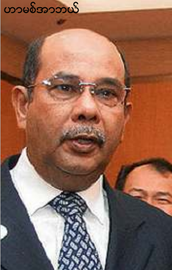
ဟာမစ်အာဘယ်

အရေးယူမှုများနှင့်ရင်ဆိုင်ရဖွယ်ရှိသည်ဟု သတိပေးထားသည်။ အာဆီယံနှင့် ဒေသတွင်းနိုင်ငံများ အကြားတွင် မြန်မာနိုင်ငံ ဒီမိုကရေစီပြုပြင် ပြောင်းလဲရေးတွက် ဖိအားပြင်းထန်နေချိန် တွင် တောင်ကိုးရီးယားသမ္မတဟောင်း ငြိမ်း ချမ်းရေးနီဗယ်ဆူရှင် ကင်ဒေးဂျီကလည်း မြန်မာနိုင်ငံတွင် နိုင်ငံရေးမျှော်လင့်ချက် အသစ်ဖြစ်ပေါ်လာရန်အတွက် ဒေါ်အောင် ဆန်းစုကြည်နှင့် တခြားနိုင်ငံရေးအကျဉ်း သားများကိုလွှတ်ပေးရန် နအဖကို တိုက် တွန်းသော ကြေညာချက်တစောင် ထုတ်ပြန် ထားသည်။ ❖