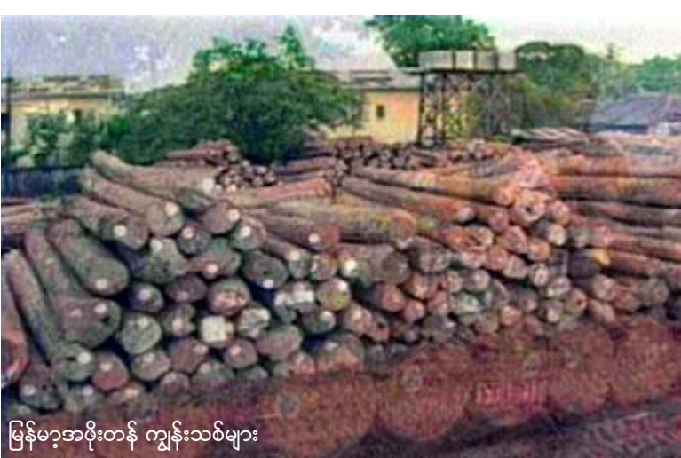
မြန်မာ့အစိုးရက ကျွန်းသစ်များ

မစ္စဇူဇန်ကမ်ဘာက “အရင်ကတော့နယ်စပ်ဒေသတွေက အပြည့်အဝမထိန်းချုပ်နိုင်လို့ သစ်ခိုးတာတွေဖြစ်နေတာပါလို့ နအဖကဆင်ခြေပေးတယ်။ အခုတော့ ထိန်းချုပ်နိုင်နေပြီပဲ။ ဒါပေမယ့် သစ်ခိုးထုတ်တာလည်း ဆက်ရှိနေတုန်းပဲ”ဟုဆိုသည်။