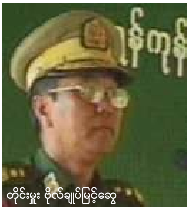
တိုင်းမှူး ဗိုလ်ချုပ်မြင့်ဆွေ

ရန်ကုန်တိုင်း တိုင်းမှူးဗိုလ်ချုပ်မြင့်ဆွေနေရာတွင် တပ်မ (၁၁) တပ်မမှူး ဗိုလ်မှူးချုပ်လှဌေးဝင်းဖြင့် အစားထိုးခန့်အပ်လိုက်ကြောင်း စစ်တပ်နှင့်နီးစပ်သော သတင်းရပ်ကွက်များ