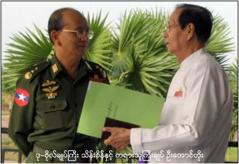
ဗု-ဗိုလ်ချုပ်ကြီး သိန်းစိန်နှင့် တရားသူကြီးချုပ် ဦးအောင်တိုး

နအဖ၏ ညောင်နှစ်ပင်ညီလာခံရပ်ဆိုင်းလိုက်သည့်အပေါ် ပြည်ပရောက် သိပ်ကမ်းမြို့နယ် ပြည်သူ့လွှတ်တော်ကိုယ်စားလှယ် ဒေါ်စန်းစန်းက ဒါက သက်သက်အချိန်ဆွဲတာပဲ။ ဘာဖြစ်လို့လဲဆိုတော့ မူကြမ်းက ပြီးနေပြီ။ ပညာရှင်တွေနဲ့ ဥပဒေဖြစ်လာအောင်လုပ်ဖို့ (Technical) အပိုင်းကလည်း (၁၀)လ လောက်အချိန်မလိုဘူး။ ဘာဖြစ်လို့အချိန်ဆွဲနေတာလဲဆိုရင် သူတို့မှူးမိုင်ခိုင်ရေးအရလုပ်စရာဆိုလို့ဒီတခုတည်းရှိတယ်။ နောက်တခုက အခြေခံဥပဒေပြီးရင် လူထုဆန္ဒခံယူပွဲတို့၊ ရွေးကောက်ပွဲလုပ်ရမယ်။ နအဖက အဲ့ဒါ