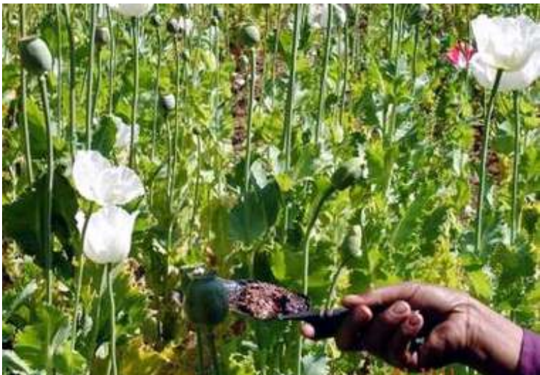
မြန်မာပြည်ရှိ ဘိန်းစိုက်ခင်းတခု

မူးယစ်ထိန်းချုပ်ရေးအဖွဲ့များသည် (၂၀၀၅) ခုနှစ်အတွင်း ဘိန်းဖြူ(၇၇၂ ဒဿမ ၇)ကီလိုဂရမ်၊ ဟိရိုအင်း (၈၁၁ ဒဿမ ၇)၊ မက်သဖက်တမင်းအခဲ (၂၈၀ ဒဿမ ၃) ကီလိုဂရမ်၊ မာရီဂျူနာ (၁၂၆) ဒဿမ (၄) ကီလိုဂရမ်နှင့် ဆေးပြား (၃ ဒဿမ ၆) သိန်းကို ဖမ်းဆီးနိုင်ခဲ့ပြီး မူးယစ်ဆေးဝါးအမှု နှင့်ပတ်သက်သော အမျိုးသား (၃၈၈၈)ဦး