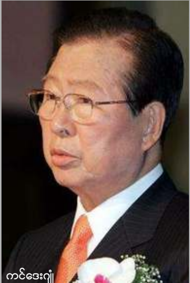
ကင်ဒေးဂျီ

ရိကန်နိုင်ငံအနေဖြင့်လည်း မြန်မာ့ဒီမိုကရေ စီရေးနှင့်လူ့အခွင့်အရေးကိစ္စများတွင် ဘယ် တော့မှလက်လျှော့မည်မဟုတ်ဟု ပြောဆို လိုက်သည်။ အမေရိကန်နိုင်ငံသည် မြန်မာနိုင်ငံတွင် ဒီမိုကရေစီစနစ်တည်ဆောက်ရန် အစဉ် တစိုက်ဦးဆောင်ကြိုးပမ်းလျက်ရှိပြီး၊ မကြာ သေးခင်ကပင် အမေရိကန်လက်ထောက် နိုင်ငံခြားရေးဝန်ကြီး၊ ခရစ္စတိုဖာဟေး၏ အာရှခရီးစဉ်အတွင်း ဗီယက်နမ်၊ ကမ္ဘောဒီးယားနှင့် မလေးရှားနိုင်ငံများနှင့် မြန်မာ့ အရေးဆွေးနွေးခဲ့သည်။ အလားတူ မြန်မာ့ဒီမိုကရေစီအရေး အတွက်ကြိုးပမ်းမှုအဖြစ် အင်ဒိုနီးရှားသမ္မတ ဆူဆီလိုဘန်ဘန်းယူဒိုယိုနိုသည် ဖေဖော်ဝါ