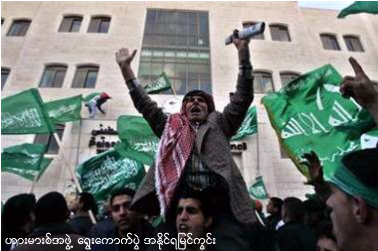
ဟားမားစ်အဖွဲ့ ရွေးကောက်ပွဲ အနိုင်ရမြင်ကွင်း

အစ္စလာမ်စစ်သွေးကြွအဖွဲ့ဖြစ်သည့် ဟားမားစ်အဖွဲ့ ပါလက်စတိုင်းရွေးကောက်ပွဲ၌ မဲအပြတ်အသတ်ဖြင့်အနိုင်ရရှိခဲ့ခြင်းက ကမ္ဘာကြီးအားသွေးဖျက်တုန်လှုပ်စေခဲ့သည်။ အကျင့်ဖျက်ခြစားမှုများဖြင့် ပြည့်နေသည့် ဖာတာပါတီ၏ ဆယ်စုနှစ်လေးစုမျှ အုပ်ချုပ်ခဲ့မှုအဆုံးသတ်သွားခဲ့ပြီး အရှေ့အလယ်ပိုင်းဒေသငြိမ်းချမ်းရေးမျှော်လင့်ချက်မှာလည်း ပို၍နည်းလာခဲ့သည်။