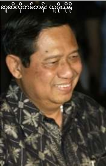
ဆူဆီလိုဘန်ဘန်း ယူဒိုယိုနို

ရိကန်နိုင်ငံအနေဖြင့်လည်း မြန်မာ့ဒီမိုကရေ စီရေးနှင့်လူ့အခွင့်အရေးကိစ္စများတွင် ဘယ် တော့မှလက်လျှော့မည်မဟုတ်ဟု ပြောဆို လိုက်သည်။ အမေရိကန်နိုင်ငံသည် မြန်မာနိုင်ငံတွင် ဒီမိုကရေစီစနစ်တည်ဆောက်ရန် အစဉ် တစိုက်ဦးဆောင်ကြိုးပမ်းလျက်ရှိပြီး၊ မကြာ သေးခင်ကပင် အမေရိကန်လက်ထောက် နိုင်ငံခြားရေးဝန်ကြီး၊ ခရစ္စတိုဖာဟေး၏ အာရှခရီးစဉ်အတွင်း ဗီယက်နမ်၊ ကမ္ဘောဒီးယားနှင့် မလေးရှားနိုင်ငံများနှင့် မြန်မာ့ အရေးဆွေးနွေးခဲ့သည်။ အလားတူ မြန်မာ့ဒီမိုကရေစီအရေး အတွက်ကြိုးပမ်းမှုအဖြစ် အင်ဒိုနီးရှားသမ္မတ ဆူဆီလိုဘန်ဘန်းယူဒိုယိုနိုသည် ဖေဖော်ဝါ