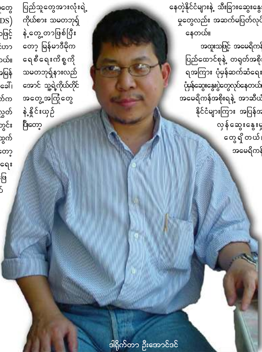
ဒါရိုက်တာ ဦးအောင်ဒင်

နေတဲ့နိုင်ငံများနဲ့ သီးခြားဆွေးနွေးမှုတွေလည်း အဆက်မပြတ်လုပ်နေတယ်။ အထူးသဖြင့် အမေရိကန်ပြည်ထောင်စုနဲ့ တရုတ်အစိုးရအကြား ပုံမှန်ဆက်ဆံရေး၊ ပုံမှန်ဆွေးနွေးပွဲတွေလုပ်နေတယ်။ အမေရိကန်အစိုးရနဲ့ အာဆီယံနိုင်ငံများကြား အပြန်အလှန်ဆွေးနွေးမှုတွေရှိတယ်။ အမေရိကန်