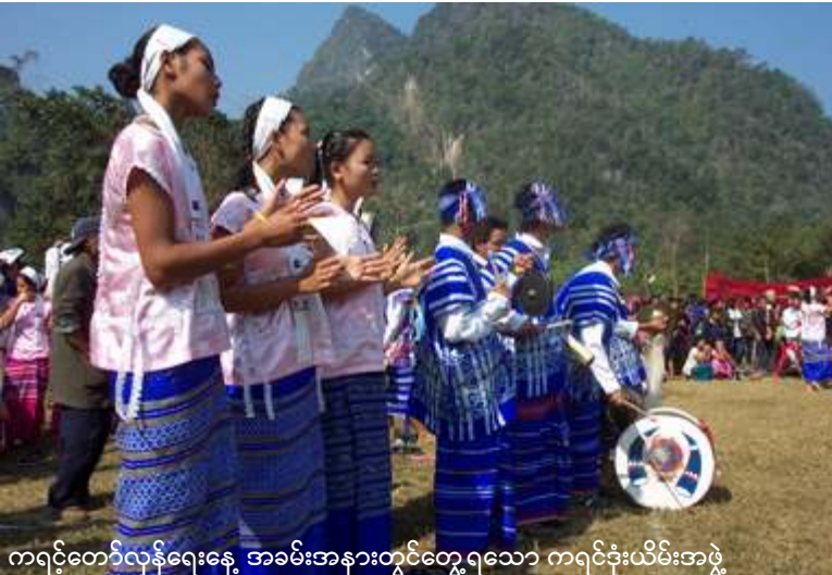
ကရင့်တော်လှန်ရေးနေ့ အခမ်းအနားတွင်တွေ့ရသော ကရင့်ဒုးယိမ်းအဖွဲ့