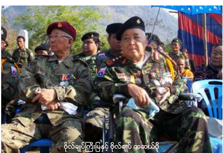
ဗိုလ်ချုပ်ကြီးမြနှင့် ဗိုလ်ချုပ် ကဆယ်ဒို တော်လှန်စစ်ကို ဆက်လက်ဆင်နွှဲနေကြရဦး မည်”ဟုဆိုသည်။ ကရင့်အမျိုးသားအစည်းအရုံး (ကေ တခုဖြစ်သည်။ နအဖနှင့် ကေအဲန်ယူအကြား (၂၀၀၄) ခုနှစ်တတည်းက ရပ်တန့်နေသော တွေ့ဆုံ

ရောက်လာသော ကရင့်အမျိုးသားများ၏ သီချင်းသံပြိုင်သီဆိုသံနှင့် ကရင့်တော်လှန် ရေးနေ့အထိမ်းအမှတ် ပစ်ဖောက်လိုက်သော သေနတ်သံသည် တောင်ကြောတလျှောက် ပွဲတင်ထပ်သွားသည်။ (၅၇) နှစ်မြောက် ကရင့်တော်လှန်ရေး နေ့အခမ်းအနားသို့ပေးပို့သော ကေအဲန်ယူ ဥက္ကဋ္ဌကြီးစောဘဝသစ်စိန်၏မိန့်ခွန်းတွင် ခုခံ စစ် (၅၇) နှစ်၊ သင်ခန်းစာအရ နိုင်ငံရေး ပြဿနာကို စစ်ရေးနည်းထက် တွေ့ဆုံဆွေး နွေးနည်းဖြင့် အဖြေရှာရန်ဆန္ဒရှိကြောင်း၊ “တပတ်ကလည်း လက်နက်ကိုင်ပဋိပက္ခကို ရပ်စဲကာ နိုင်ငံရေးအရတွေ့ဆုံဆွေးနွေး အဖြေရှာရေးကို လက်တွေ့မလုပ်ဆောင်နိုင် သမျှကာလပတ်လုံး ကရင့်အမျိုးသားများ သည် ကိုယ့်ဘဝတည်တံ့ခိုင်မြဲရေးအတွက်