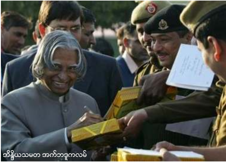
အိန္ဒိယသမ္မတ အက်ဘဒူလ် ကမ်

အိန္ဒိယနိုင်ငံသမ္မတ အေပီဂျေအက်ဘဒူလ် ကမ် (A.P.J. Abdul Kalam) သည် လာမည့် မတ်လအတွင်း မြန်မာနိုင်ငံသို့ သွားရောက် ရန်စီစဉ်ထားကြောင်း အိန္ဒိယနိုင်ငံထုတ် သတိပို့ (The Hindu) သတင်းအရ သိရှိ ရသည်။ ဇန်နဝါရီ (၁) ရက်နေ့ထုတ် သတိပို့ သတင်းအရ သခင်ဦးစဉ်အတွက် မြန်မာနိုင်ငံ မှတရားဝင်ဖိတ်ကြားချက်ကို အိန္ဒိယနိုင်ငံက လက်ခံရရှိထားပြီးဖြစ်သော်လည်း၊ ခရီးစဉ် အတွက် အတိအကျ ရက်မသတ်မှတ်သေးဟု ဆိုသည်။ မတ်လအတွင်းဖြစ်နိုင်ဖွယ်ရှိသော အိန္ဒိ