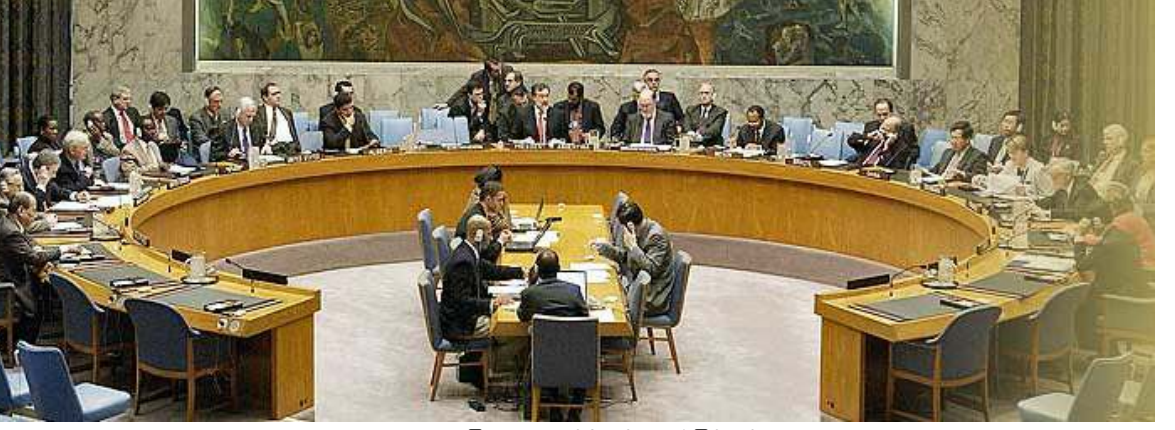
ကုလသမဂ္ဂလုံခြုံရေးကောင်စီစည်းဝေးပွဲမြင်ကွင်း

စိုက်လာစေရန် အမေရိကန်၏ကြိုးပမ်းမှုကို တရုတ်နှင့်ရုရှတို့က မြန်မာနိုင်ငံအရေးသည် နိုင်ငံတကာငြိမ်းချမ်းရေးနှင့် လုံခြုံရေးအတွက် လုပ်ပိုင်ခွင့်အာဏာပေးအပ်ထားသော လုံခြုံရေးကောင်စီ၏ လုပ်ပိုင်ခွင့်ဘောင်အပြင်ဖက်တွင်ရှိသည်ဆိုကာ ခါးခါးသီးသီးပယ်ချခဲ့သည်။ ယခုနိုဝင်ဘာ (၂၉) ရက်တွင် မစ္စတာ