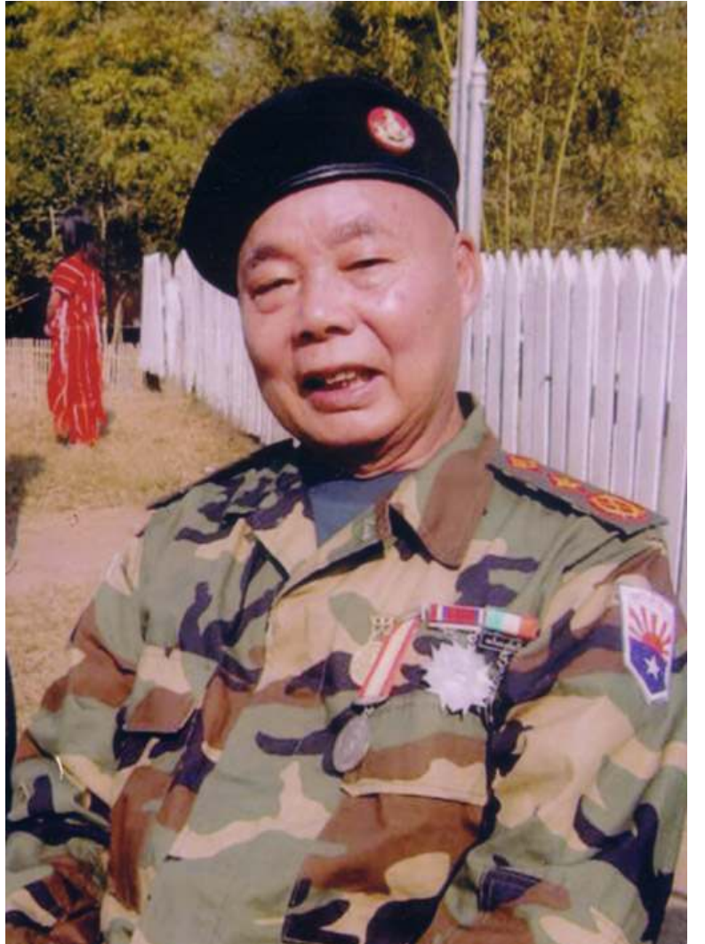
ကေအဲန်အယ်လ်အေစစ်ဦးစီးချုပ် ဒု-ဗိုလ်ချုပ်ကြီး စောမူတူး

ဖြေ။ ။ ဒါကတော့ လုပ်သွားရမှာပေါ့ နော်။ တွေ့ဆုံဆွေးနွေးရေးကို ဒါပေမယ့် မဟုတ်မကန့်ပြောသလိုပေါ့ ကျနော်တို့ကနုတ် ဆက်ဖို့ လက်ကမ်းပေမယ့်သူတို့က လက်သီး ဆုတ်ထားပြီးတော့ နောက်မှာဖွက်ထားတယ် ဆိုရင် ဘယ်အဆင်ပြေနိုင်တော့မလဲ ဒါပေ မယ့် ကျနော်တို့ဘက်တော့ အခုမှမဟုတ်ပဲ ကရင်နော်လှန်ရေးစကတည်းက စိန်ကမ္ဘာ ယံမှာ အကြီးအကျယ်တိုက်ပွဲဖြစ်တယ်။ ပြဿနာပြေလည်အောင်ဆွေးနွေးဖို့ ဥက္ကဋ္ဌ စောဘဦးကြီးကိုခေါ်တွေ့တာ၊ ဥက္ကဋ္ဌ စော ဘဦးကြီးတို့ မန်းကျင်စုအောင်တို့ ရန်ကုန် အင်းစိန်တိုက်ပွဲ အပြင်းအထန်ဖြစ်နေတဲ့ အချိန်မှာ ကိုယ်တိုင်သွားပြီးတော့ တွေ့ဆုံကြ တာပဲ။ အဲဒီသမိုင်းကတော့ ကျနော်တို့ဘက် ကတော့ ပြဿနာကို ကျနော်တို့ ဒီလိုနိုင်ငံ ရေးပြဿနာကို နိုင်ငံရေးနည်းနဲ့ဖြေရှင်း သွားဖို့ဆန္ဒအပြတမ်းရှိတယ်။ အိမ်ဆောင့် အစိုးရတုန်းကလည်း လျှို့ဝှက်ပြီးလာခေါ်တာ ပါပွန်မှာလေ။ အဲဒီတုန်းက ကျနော်တို့က ချာတိတ်ပဲရှိသေးတာ၊ အိမ်စောင့်အစိုးရ အချိန်မှာပေါ့။ သူတို့ပြောတာက လက်နက် ချဖို့ပေါ့။ စတိအနေနဲ့ပေါ့ ၊ တပ်တွေကိုလည်း ခေါ်စစ်မယ်လို့ပြောတာပဲ။ အဲဒီအချိန်မှာ ကျနော်တို့တပ်တွေကိုပြန်ကြည့်တော့လည်း စိုးရိမ်သွားကြတယ် အဲဒီအချိန်မှာသွားကြတဲ့ သူတွေကိုလည်းရေးယူပြီး သတ်ပစ်ရင်လည်း ဘယ်သူမှ သိမှာမဟုတ်ဘူး။ ဒါပေမယ့် ကျနော်တို့ဘက်ကသွားတယ်၊ (၆၃) ခုနှစ် ကြတော့လည်း တပြည်လုံးအပစ်အခတ်ရပ် စဲထားဖို့ တရားဝင်ကြေညာထားတာကို။ ကျနော်တို့ကလည်း စစ်မြေပြင်မှာတယောက် နဲ့တယောက်ပစ်ခတ်ကြတာကို ပထမဆင့် အနေနဲ့မလုပ်ကြတော့ဘူး။ အဲဒီ အပစ်အ ခတ်ရပ်စဲရေးကတဆင့် နိုင်ငံရေးစားပွဲ ပေါ်မှာ ပြဿနာကိုဖြေရှင်းဖို့ လက်နက်နဲ့ မဟုတ်ဘဲ နိုင်ငံရေးအရဖြေရှင်းဖို့ ဒီသဘော ထားနဲ့ အဲဒီအလုပ်ကိုလုပ်တာဟာ အကြမ်း