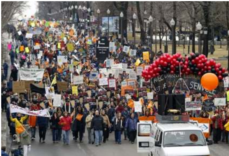
ကမ္ဘာကြီးပူဇွေးလာမှုကြောင့် လူချွန်သောင်းကျော် ဆန္ဒပြခြင်းကွင်း

ဒီဇင်ဘာ (၃) ရက်နေ့က ကနေဒါနိုင်ငံ၊ မွန်ထရီရယ်မြို့လယ်ရှိလမ်းမ၌ ကမ္ဘာကြီးပူဇွေးလာမှုအပေါ် ချက်ချင်းအရေးယူဆောင်ရွက်ရေးအတွက် လူချွန်သောင်းကျော်ခန့် ဆန္ဒပြတောင်းဆိုခဲ့ကြောင်းသိရှိရသည်။