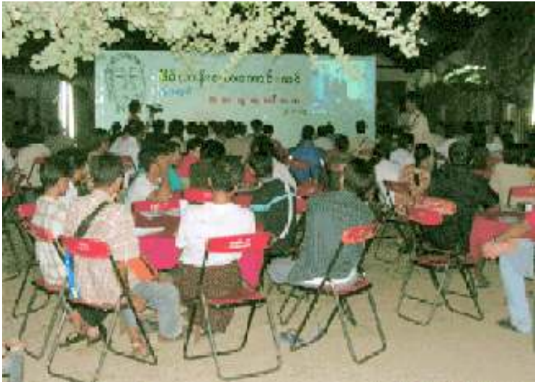
လူထုဒေါ်အမာမွေးနေ့ စိမ်းလန်းသောကောင်းကင်အခမ်းအနားကျင်းပစဉ်

အဝေးရောက်နေသော သားသမီးများ သို့ အမေလူထုဒေါ်အမာက “ငါ့သား ငါ့ သမီးအားလုံး ချစ်ချစ်ခင်ခင်လက်ထွဲပြီးလုပ် စရာရှိတာတွေလုပ်ရမှာ၊ မင်းတို့အပြင်မှာ ရှိတဲ့သူတွေကလည်း အပြင်အလိုက်လုပ်ရ မှာဘဲ၊ အထဲမှာရှိတဲ့သူကလည်း အထဲက အလိုက် လုပ်ရမှာပဲ။ ဒါပေမယ့် ဒို့အထဲက ရှိတဲ့သူတွေ ဘာမှလုပ်လို့မဖြစ်ဘူး။ အမျိုး မျိုးခြောက်လှန့်၊ ဖိနှိပ်ခြိမ်းခြောက်ခံနေရ တယ်။ ဒါကြောင့် အပြင်ဘက်မှာရှိတဲ့ သား တို့သမီးတို့က အမေတို့အတွက်ပိုပြီး လုပ်ပေး ကြကွယ်လို့ အမေက မေတ္တာရပ်ခံချင်တယ်။ အမေတို့နဲ့ အမြန်ဆုံးပြန်ပြီးတော့နေရပါ စေလို့ ဆုတောင်းလိုက်ပါတယ်”ဟု ဗွီအိုအေ မှတဆင့်ပြောကြားခဲ့သည်။❖