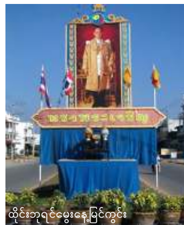
ထိုင်းဘုရင်မွေးနေ့မြင်ကွင်း

ထိုင်းဘုရင်ကြီးက ထိုင်းနိုင်ငံသည် ပြည်သူတို့အတွက် လုံလောက်ပြည့်စုံသော စီးပွားရေးစနစ်လိုအပ်လျှက်ရှိနေသည်ကို ထောက်ပြပြောဆိုပြီး ယင်းကိစ္စကို အကောင်အထည်ဖော်ဆောင်ရွက်ရန်အတွက် ဝန်ကြီးချုပ်အားကတိဘိဇ္ဇာအား လမ်းညွှန်ရန်တိုက်တွန်းပြောဆိုခဲ့သည်။ ယင်းကိစ္စအား လက်ထောက်ဝန်ကြီးချုပ်များက လုပ်ဆောင်နေ