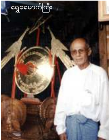
ရွှေမောက်ကြီးတလုံးကိုသွန်းလုပ်ခဲ့ပြီး (၂၀၀၂) ခုနှစ်၊ အမျိုးသားနေ့တွင် ဒေါ်

အောင်ဆန်းစုကြည်ထံ အခမ်းအနားဖြင့် ပို့ဆောင်ရန်ကြိုးစားစဉ် ဖမ်းဆီးခြင်းခံခဲ့ရသောရွှေမောက် ကိုရွှေမောင်သည် နိုဝင်ဘာ (၇) ရက်နေ့က မန္တလေးထောင်မှပြန်လည်လွတ်မြောက်လာခဲ့သည်။ ထိုရွှေမောက်ကြီးသွန်းလုပ်မှုကြောင့် ကိုရွှေမောင်သည် ထောင် (၃) နှစ် ကျခဲ့ရသည်။ လွတ်ရက်စေ့သော်လည်း မလွတ်ပဲဆက်လက်ဖမ်းဆီးထားသောကြောင့် အစာငတ်ခံဆန္ဒပြခဲ့သောသူ့ကို ထောင်အာဏာပိုင်များက ရေပါဖြတ်လိုက်ပြီး သတ်လစ်မေ့မျောသွားသည်ထိ ဝိုင်းဝန်းရိုက်နှက်ခဲ့ကြသည်ဟု ကိုရွှေမောင်က ပြန်လည်ပြောပြသည်။ ထောင်တွင်းနေခဲ့သည့်ကာလတလျှောက် ထောင်