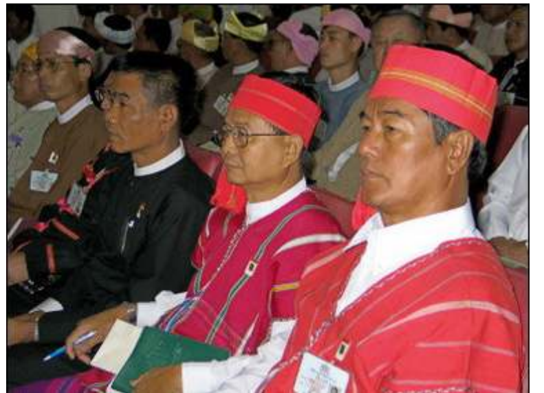
အမျိုးသားညီလာခံသို့ တက်ရောက်လာသော တိုင်းရင်းသားကိုယ်စားလှယ်များ

အက်စ်အက်စ်အေမြောက်ပိုင်း ခေါင်းဆောင်များ၏ လက်တလောပြုလုပ်လိုက်သော အစည်းအဝေးက ယခုနှစ်ကုန်တွင် ပြန်လည်ကျင်းပမည့်ညီလာခံကို ပြန်လည်တက်ရောက်မည်ဟု ဆုံးဖြတ်ခဲ့ကြသည်။ အက်စ်အက်စ်အေမြောက်ပိုင်းအဖွဲ့သည် ဥက္ကဋ္ဌ ဗိုလ်ချုပ်ဆေထင်အားဖမ်းဆီးပြီးနောက် မေလပိုင်းတွင် နအဖညီလာခံကို ကျော့ခိုင်းထွက်ခွာခဲ့သည်။ ယခုညီလာခံသို့ ပြန်လည်တက်ရောက်ရခြင်းမှာ ဗိုလ်ချုပ်ဆေထင်အား ဖမ်းဆီးထားခြင်းမှ တစ်တရားလျှော့ပေါ့လာနိုင်ရန် ဖြစ်သည်ဟု အက်စ်အက်စ်အေမြောက်ပိုင်း