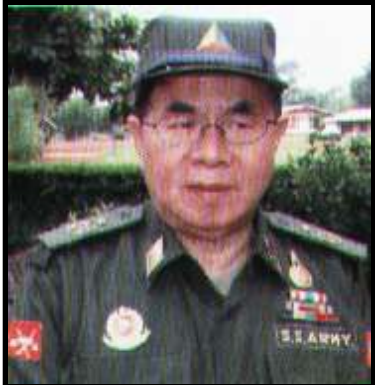
ဗိုလ်ချုပ်ဆေထင်(SSA)

လူ့ဘောင်သစ်ပါတီကို ၁၉၈၈ တွင် ဖွဲ့စည်းခဲ့ပြီး အမျိုးသားဒီမိုကရေစီအဖွဲ့ချုပ် ပြီးလျင်ဒုတိယ အကြီးဆုံးပါတီအဖြစ် ရပ်တည်ခဲ့သည်။ စစ်အစိုးရ၏ဖိနှိပ်မှုများကြောင့် ၁၉၉၁ တွင် ထိုင်း-မြန်မာနယ်စပ်သို့ ပြောင်းရွှေ့အခြေစိုက်ခဲ့သည်။ ❖