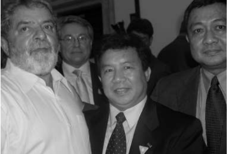
ဘရာဇီးသမတနှင့် အတူတွေ့ရစဉ်

လေ့လာထားပါတယ်။ ဒါကိုလဲ သူတို့ ဆက်လက်ပြီးတော့ ကုလသမဂ္ဂမှာ တာဝန်ခံတဲ့