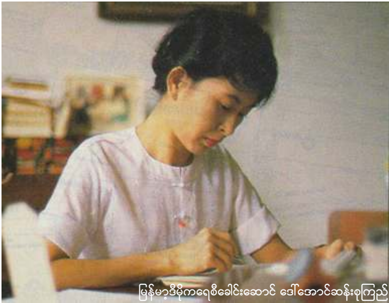
မြန်မာ့ဒီမိုကရေစီခေါင်းဆောင် ဒေါ်အောင်ဆန်းစုကြည်

မြန်မာ့ ဒီမိုကရေစီခေါင်းဆောင်ဒေါ်အောင်ဆန်းစုကြည်အား နေအိမ်၌ အကျယ်ချုပ်ချထားခြင်းသည် ဥပဒေနှင့်ကိုက်ညီမှု လုံးဝမရှိကြောင်း အမျိုးသားဒီမိုကရေစီအဖွဲ့ချုပ်က အောက်တိုဘာ (၂၄) ရက်က