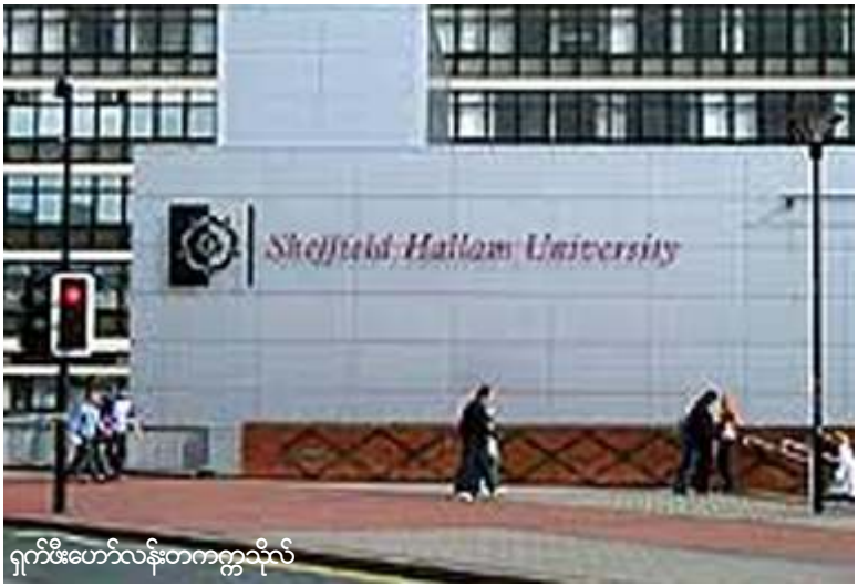
ဂုဏ်ထူးဆောင်လန်းတက္ကသိုလ်

မြန်မာ့ဒီမိုကရေစီခေါင်းဆောင် ဒေါ်အောင်ဆန်းစုကြည်အား ဘူမိ၏ ထူးခြားထင်ရှားသည့် ဒီမိုကရေစီရေး ကြိုးပမ်းအားထုတ်မှုများကို ဂုဏ်ပြုသည့်အနေဖြင့် အင်္ဂလန်နိုင်ငံ ဂုဏ်ထူးဆောင်လန်းတက္ကသိုလ်က ဂုဏ်ထူးဆောင်ဒေါက်တာဘွဲ့ပေးရန် ဆုံးဖြတ်ခဲ့ကြောင်း အောက်တိုဘာ (၂၄) ရက်နေ့က ကြေညာလိုက်သည်။ ဂုဏ်ထူးဆောင်လန်းတက္ကသိုလ်၏ ဒုတိယအဓိပတိ မစ္စတာဖီးလစ်ဂါလန်က “ဒေါ်အောင်ဆန်းစုကြည်ဟာ ၁၉၉၁ က နီဗယ်လ်ငြိမ်းချမ်းရေးဆုရှင်ဖြစ်တဲ့အပြင် အကျဉ်းကျခံနေရတဲ့ တဦးတည်းသော နီဗယ်လ်ဆုရှင်တဦးလည်းဖြစ်ပါတယ်။ ဂုဏ်ထူးဆောင်လန်းတက္ကသိုလ်အနေနဲ့ ဒေါ်အောင်ဆန်းစုကြည်ရင်ဆိုင်နေရတဲ့ အကျပ်အတည်းကို နိုင်ငံတကာက ပိုမိုအာရုံစူးစိုက်စေချင်ပါတယ်။ နိုင်ငံတကာက ပိုမိုအားပေးကြဖို့ အားပေးစေချင်ပါတယ်။ ဂုဏ်ထူးဆောင်လန်းတက္ကသိုလ်