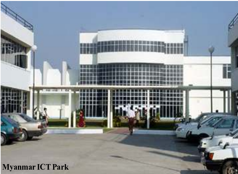
Myanmar ICT Park

အင်္ဂလန်၊ အမေရိကန်နှင့် ကနေဒါ အခြေစိုက် နာမည်ကျော်တက္ကသိုလ်များမှ သုတေသီများနှင့် ပူးပေါင်းဖွဲ့စည်းထားသော (Open Net Initiative) အဖွဲ့က မြန်မာ စစ်အစိုးရသည် အင်တာနက်ကို ကန့်သတ် ထိန်းချုပ်မှု အများဆုံးနိုင်ငံတခုဖြစ်ကြောင်း အောက်တိုဘာ (၁၃) ရက်နေ့က ထုတ်ပြန်သည့် (Internet Filtering In Burma) ၂၀၀၅ အစီရင်ခံစာတွင် ဖော်ပြထားသည်။ စာမျက်နှာ (၂၅) မျက်နှာပါ အစီရင်ခံစာတွင်မြန်မာနိုင်ငံသည် အင်တာနက်နှင့်ပတ်သက်၍ ကန့်သတ်ထိန်းချုပ်မှု အများဆုံးနိုင်ငံတခုဖြစ်ကြောင်း၊ ထိန်းချုပ်မှုများလျော့နည်းသွားမည့်လက္ခဏာလည်း မမြင်သေးကြောင်း ဖော်ပြထားသည်။ မြန်မာနိုင်ငံတွင် ကွန်ပျူတာဈေးနှုန်းနှင့် အင်တာနက်သုံးစွဲမှု ကုန်ကျစရိတ်သည် လူအများစုမလိုက်နိုင်သည့် အခြေအနေတွင်ရှိနေပြီး အင်တာနက်သုံးစွဲသူ