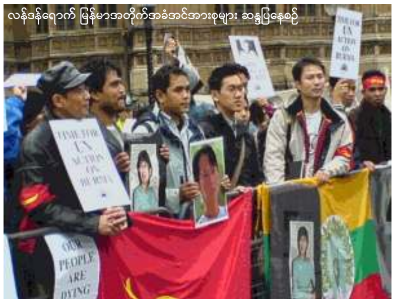
လန်ဒန်ရောက် မြန်မာအတိုက်အခံအင်အားစုများ ဆန္ဒပြနေစဉ်

ဒေါ်အောင်ဆန်းစုကြည် အကျယ်ချုပ်ကျခံရခြင်း (၁၀) နှစ်ပြည့် အထိမ်းအမှတ် ဖယောင်းတိုင်ထွန်း ဆုတောင်းပွဲများ၊ ဟောပြောပွဲများကျင်းပခဲ့သည်ဟု သိရသည်။ ထို