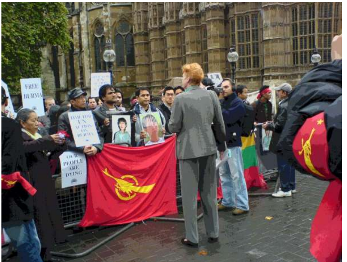
ဒေါ်အောင်ဆန်းစုကြည် နေအိမ်အကျယ်ချုပ်မှ ပြန်လွတ်ပေးရေးတောင်းဆိုသည့် ဆန္ဒပြပွဲကို လန်ဒန်၌တွေ့ရစဉ်

အင်္ဂလန်ရောက် မြန်မာ့ဒီမိုကရေစီအင်အားစုများက ဒေါ်အောင်ဆန်းစုကြည်အမြန်ဆုံးလွတ်မြောက်လာရေးအတွက် အင်္ဂလန်အစိုးရမှ ဖိအားပေးရန် ပါလီမန်ရှေ့သို့ သွားရောက်ဆန္ဒပြတောင်းဆိုခဲ့ကြသည်။ အမေရိကန်၊ နယူးယောက်ရှိကုလသမဂ္ဂ ရုံးချုပ်ရှေ့တွင်လည်း ပြည်ပရောက် မြန်မာ့ဒီမိုကရေစီရေးလှုပ်ရှားသူများ၊ အမေရိကန်အမျိုးသမီးအဖွဲ့အစည်းများ၊ အမေရိကန်မြန်မာအရေးလှုပ်ရှားမှု အဖွဲ့များက ကုလသမဂ္ဂနှစ် (၆၀) ပြည့်၊ ဒေါ်အောင်ဆန်းစုကြည် ထိန်းသိမ်းခံထားရခြင်း (၁၀) နှစ်ပြည့်မြောက်သည့်နေ့တွင် ဒေါ်အောင်ဆန်းစုကြည်နှင့် နိုင်ငံရေးအကျဉ်းသားများ လွတ်မြောက်ရေး၊ မြန်မာ့ဒီမိုကရေစီရေးအတွက် ကုလသမဂ္ဂမှ ထိထိရောက်ရောက်ဆောင်ရွက်ပေးရန် ဆန္ဒပြတောင်းဆိုခဲ့ကြသည်။ အလားတူ ပြင်သစ်၊ အိုင်ယာလန်၊ ဩစတေးလျ၊ ကနေဒါ၊ နော်ဝေတို့တွင်လည်း