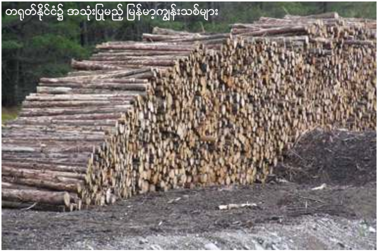
တရုတ်နိုင်ငံ၌ အသုံးပြုမည့် မြန်မာ့ကျွန်းသစ်များ

ကချင်ပြည်နယ်ရှိ အစိုးရတပ်သစ်တော်များသည် ဒေသတွင်း ထိန်းချုပ်ထားသော လူမျိုးစုလက်နက်ကိုင်များက တရားမဝင်အဓမ္မ ခုတ်လှဲခံနေရကြောင်း ဂလိုဘယ်ဝစ် နက်စ် (ခေါ်) မြေကမ္ဘာစောင့်ကြည့်လေ့လာရေး အဖွဲ့မှ ထောက်ပြပြောဆိုလိုက်ပြီး ပီကင်း အစိုးရအနေဖြင့် ထိုကိစ္စကို အဆောတလျင် ဝင်ရောက်ဖြေရှင်းသင့်ကြောင်း တောင်းဆိုလိုက်သည်။