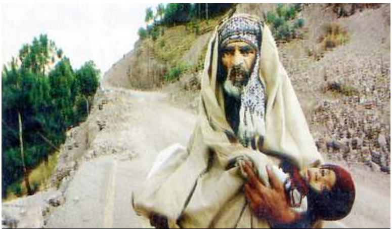
ဒဏ်ရာရနေသောသားငယ်အား ချိုးပျံ့သယ်ယူလာသည့် ငလျင်ဒဏ်ခံရသည့် ဖခင်တဦး

ထောင်ပေါင်းများစွာသော အီရန်လူငယ်များသည် တီဟီရန်ရှိ ယခင်အမေရိကန်သံရုံးဟောင်းဝန်းကျင်တွင် စုရုံးကြပြီး အမေရိကန်ကျဆုံးပါစေဟု ကြွေးကြော်သံများကို ဟစ်အော်ကြသည်။ လွန်ခဲ့သော (၂၅) နှစ်က အီရန်ရှိ အမေရိကန်သံရုံးအား ဝင်ရောက်စီးနင်းမှု အထိမ်းအမှတ်အဖြစ် ကျင်းပခြင်းဖြစ်သည်ဟု ဆန္ဒပြသူများ၏အဆိုအရသိရှိရသည်။ ❖