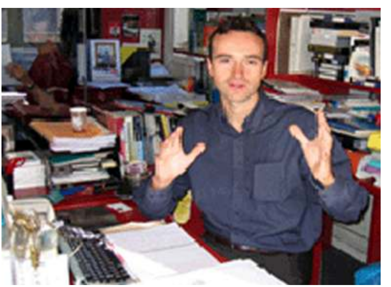
နယ်ခြားမဲ့သတင်းထောက်များအဖွဲ့ အာရှနှင့်ပစိဖိတ်ရေးရာတာဝန်ခံ ဗန်းဆင့်ဘရော်ဆယ်

ယမန်နှစ်က မြန်မာနိုင်ငံသည် (၁၆၅) နေရာတွင်ရှိပြီး ယခုနှစ် (၁၆၃) အဆင့်သို့ ရောက်လာခြင်းမှာ သတင်းစာလွတ်လပ်ခွင့် တိုးတက်လာ၍မဟုတ်ဘဲ အိန္ဒိယနှင့် တာ့ခ်မင်နစ္စတန်က မြန်မာနိုင်ငံအခြေအနေထက် ပိုဆိုးဝါးလာသောကြောင့်ဖြစ်သည်ဟု ပြင်သစ်နိုင်ငံအခြေစိုက် နယ်စည်းမခြားသတင်းထောက်များအဖွဲ့ အာရှနှင့်ပစိဖိတ်ရေးရာတာဝန်ခံ ဗန်းဆင့်ဘရော်ဆယ်က ဘီဘီစီသို့ ပြောကြားသည်။ ၎င်းက “မြန်မာနိုင်ငံမှာ နာရေးကြေညာတောင် ဆင်ဆာတင်ရပါတယ်။ လူသေတာတောင် ပွင့်ပွင့်လင်းလင်း၊ လွတ်လွတ်လပ်လပ် သတင်းထုတ်လို့မရဘူးဆိုတာထင်ရှားပါတယ်။ မြန်မာနိုင်ငံမှာ လူမှု