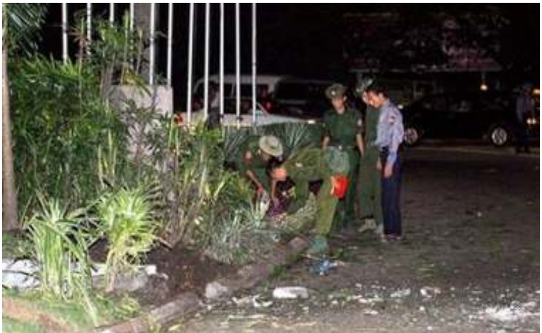
ကုန်သည်ကြီးများဟိုတယ်ရှေ့ ပုံးပေါက်ကွဲရာနေရာအား တာဝန်ရှိသူများ စစ်ဆေးကြည့်ရှုနေသည်ကို တွေ့ရစဉ်

အောက်တိုဘာ (၂၁) ရက် ညနေ (၆) နာရီ (၄၅) မိနစ်ခန့်တွင် ရန်ကုန်မြို့ ထရိုက်ဒါးဟိုတယ်အနီး၌ ပုံးပေါက်ကွဲမှုတခု ဖြစ်ပွားခဲ့သည်။ ဆူးလေဘုရားလမ်းနှင့် ဗိုလ် ချုပ်အောင်ဆန်းလမ်းထောင့်ရှိ ထရိုက်ဒါး ဟိုတယ်ဆိုင်ဘုတ်အနီး၌ ပေါက်ကွဲမှုဖြစ်ပွား ခဲ့ခြင်းဖြစ်ပြီး ဆူးလေဘုရားလမ်းကို လက် နက်ကိုင်စစ်သားများ၊ လုံခြုံရေးတပ်ဖွဲ့များနှင့် ပိတ်ထားလိုက်သည်ဟု သိရသည်။ ပုံးပေါက် ကွဲမှုကြောင့် ထိခိုက်ဒဏ်ရာရသူ၊ သေဆုံးသူ မရှိဟု ရဲများကဆိုသော်လည်း စုံစမ်းတွေ့ရှိ မှုများနှင့်ပတ်သက်၍ တစုံတရာသုံးသပ်ချက် ပေးရန် ရဲအရာရှိများက ငြင်းဆိုခဲ့သည်။ မျက်မြင်သက်သေတဦးက ဟိုတယ်ရှေ့မှ ကား ဖြတ်မောင်းသွားစဉ် နားကွဲမတတ် ပေါက်ကွဲ သံတခု ကြားခဲ့ရသည်ဟုဆိုသည်။