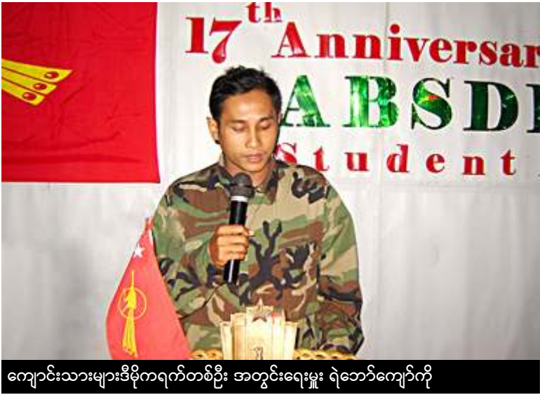
ကျောင်းသားများဒီမိုကရက်တစ်ဦး အတွင်းရေးမှူး ရဲဘော်ကျော်ကို

(၁၉၀၀) နိုဝင်ဘာ (၁) ရက်နေ့က စတင်ဖွဲ့စည်းခဲ့သော ကျောင်းသားတပ်မတော်၏လက်နက်ကိုင်တိုက်ပွဲဝင်နေရခြင်းနှင့်ပတ်သက်၍ (မကဒတ) ဥက္ကဋ္ဌ ကိုသိခဲက “လက်နက်ကိုင်တိုက်ပွဲဟာ ကျနော်တို့ ဆန္ဒနဲ့မဆိုင်ပါဘူး။ စစ်အာဏာရှင်တွေရဲ့ ဖိနှိပ်မှုနဲ့သာဆိုင်ပါတယ်။ သူတို့ပြောနေတဲ့ အပစ်အခတ်ရပ်စဲရေးဆိုတာဟာ နိုင်ငံရေးပြဿနာရဲ့ အဆက်ဖြစ်ပါတယ်။ အပစ်အခတ်ရပ်စဲရေးအလုံးစုံငြိမ်းချမ်းသွားဖို့ဆိုတာ နိုင်ငံရေးပြဿနာတွေဖြေရှင်းနိုင်မှ ဖြစ်ပါလိမ့်မယ်။ ဒီလိုမဟုတ်ရင် အပစ်အခတ်ရပ်စဲရေးက အချိန်မရွေးပေါက်ထွက်သွားနိုင်ပါတယ်။ ဒါကြောင့်မို့ ကျနော်တို့ရဲ့ဘဝဟာ ငြိမ်းငြိမ်းချမ်းချမ်းတွေ့ဆုံဖြေရှင်းရေးဆိုတဲ့ တောင်းဆိုချက်ကလာပါတယ်။ ငြိမ်းငြိမ်းချမ်းချမ်း ဆန္ဒပြမှုကလာပါတယ်။ သို့သော်လည်းပဲ ဒီနေ့အခြေအနေအောက်မှာ လက်နက်ကိုင်ထားခြင်းဟာ စစ်အာဏာရှင်တွေဆိုးမြတ်ချက်နဲ့ အများ