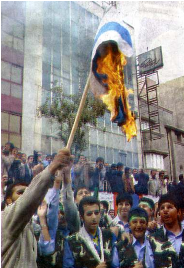
တီဟီရန်ရှိ ဗြိတိသျှဆန်ကျင်ရေးဆန္ဒပြပွဲ

ဟု စွပ်စွဲထားသည်။ ဒုတိယကမ္ဘာစစ်ကြီးအပြီး စတင်ခဲ့သောစစ်အေးတိုက်ပွဲ (Cold War) အပြီးတွင် မဟာအင်အားကြီးနှစ်နိုင်ငံဖြစ်သော ရုရှား (ယခင်ဆိုဗီယက်ယူနီယံ) နှင့် အမေရိကန်ပြည်ထောင်စုတို့၏ စီးပွားရေး၊ နိုင်ငံရေး၊ စစ်ရေးတည်ဆောက်မှုသည် နယ်ပယ်အသီးသီး၌ အကြီးအကျယ်ပြိုင်ဆိုင်ခဲ့သည်။ ၁၉၆၂ နှစ် ကျူးဘားအရေးအခင်းနှင့်ပတ်သက်၍ ဆိုဗီယက်ခေါင်းဆောင် ခရုရှားနှင့် အမေရိကန်သမ္မတ ကနေဒီလက်ထက်တွင် စစ်ဖြစ်လုနီးပါးအခြေအနေဆိုင်ရောက်ခဲ့ရသည်။ ထိုအချိန်က ကုလသမဂ္ဂအတွင်းရေးမှူးချုပ် ဦးဆောင်၍ ဖြေရှင်းမှုကြောင့် ပြေလည်သွားခဲ့သည်။ ၁၉၉၁ ခုနှစ်တွင် ဆိုဗီယက်ယူနီယံ ပြိုကွဲပြီးနောက်ပိုင်းတွင် အမေရိကန်သည် တဦးတည်းပြိုင်ဘက်မရှိ ဟိုက်ပါဝါဖြစ်လာသည်။ ယခင်ကွန်မြူနစ်နိုင်ငံဟောင်း ရုရှားသည် တံခါးဖွင့် စီးပွားရေးစနစ်ကို ကျင့်သုံးလာသော်လည်း နိုင်ငံတကာပြဿနာများကို ဖြေရှင်းရာ၌ တထပ်တည်းမကျဘဲ သဘောထားကွဲလွဲဆဲဖြစ်သည်။ ၂၀၀၃ ခုနှစ်တွင်လည်း လုံခြုံရေးကောင်စီတွင် ရုရှား၊ ပြင်သစ်နှင့် တရုတ်တို့က သဘောမတူသောကြောင့် အီရတ်စစ်ပွဲကို အမေရိကန်၏ ကုလသမဂ္ဂမှတိုက်ပွဲဝင်သည့် အခြေအနေမျိုးဖန်တီးမှုမှာ မအောင်မြင်ခဲ့ပေ။ ❖