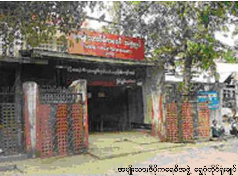
အမျိုးသားဒီမိုကရေစီအဖွဲ့ ရွှေဝိုင်းရုံးချုပ်

အမျိုးသားဒီမိုကရေစီအဖွဲ့ချုပ်၏ ဗဟိုအလုပ်အမှုဆောင်အဖွဲ့ဝင်များနှင့် ပြည်နယ်၊ တိုင်းကိုယ်စားလှယ်များ၏ (၃) ရက်ကြာဆွေးနွေးပွဲကို ရန်ကုန်၊ ရွှေဝိုင်းရုံးချုပ်၌ အောက်တိုဘာ (၂၄) ရက်မှ စတင်ကျင်းပခဲ့သည်။ ဆွေးနွေးပွဲတွင် နိုင်ငံရေး၊ လူမှုရေး၊ ပညာရေးနှင့် ကျန်းမာရေးကိစ္စများကို ကဏ္ဍအလိုက် ဆွေးနွေးခဲ့ကြသည်ဟု သိရသည်။