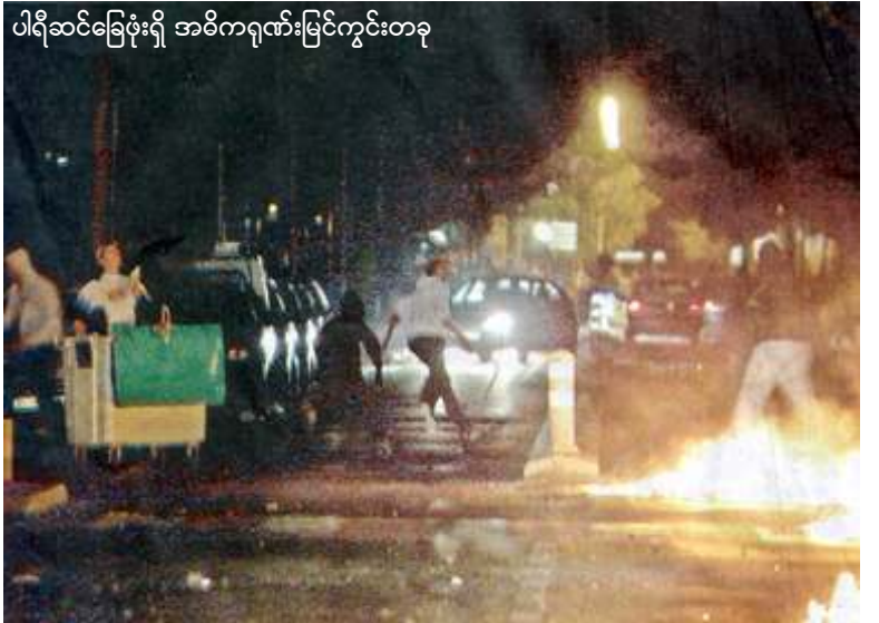
ပါရီဆင်ခြေဖုံးရှိ အဓိကရုဏ်းမြင်ကွင်းတခု

ခရီးစဉ်ကိုဖျက်သိမ်းလိုက်ရသည်။ ယခုအခါ အနည်းဆုံးလူ (၈၀) ကျော် အဖမ်းခံနေရပြီး (၂) ဒါဇင်မျှသော ပုလိပ်အရာရှိများ ဒဏ်ရာအနာတရရှိခဲ့ကြသည်။ အပစ်ပယ်ခံရသည်ဟု စိတ်တွင်ခံစားနေရခြင်း၊ နိုင်ငံခြားသားများ တရားမဝင်ဝင်ရောက်နေထိုင်မှုနှင့် အလုပ်လက်မဲ့နှုန်းထားမြင့်မားလာနေခြင်းတို့က ယင်းကဲ့သို့သော အဓိကရုဓါးများဖြစ်ပေါ်လာစေသည်ဟု ဝေဖန်သူတို့က ထုတ်ဖော်ပြောကြားသည်။ ❖