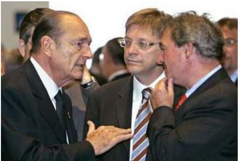
(ဝဲမှ ယာ) ပြင်သစ်သမ္မတ ဂျက်ရှာရက်၊ ဘယ်လ်ဂျီယံ ဝန်ကြီးချုပ် နှင့် လူဇင်ဘက်နိုင်ငံခြားရေးဝန်ကြီးတို့ကို အတူတကွတွေ့မြင်ရစဉ်

ပေါ်ပေးသွင်းရမည့်ငွေနှဲ့ ပက်သက်ပြီး ပြော စရာတွေ အများကြီးရှိနေတုန်းပါပဲ”ဟု ဆိုသည်။ ပြင်သစ်သမ္မတက ဗြိတိန်အစိုးရ၏ အလျှော့မပေးမှုကြောင့် သမဂ္ဂသည် ထွက် ပေါက်မရှိသည့် အခြေအနေသို့ ရောက်ရ သည်ဟု ဗြိတိန်အားအပြစ်ဖို့သည်။ သမဂ္ဂသို့ ထည့်ဝင်ရမည့်ငွေကို လျှော့ ချရန်တောင်းဆိုသော ဗြိတိန်နှင့် နယ်သာ လန်ကို ထိပ်သီးအစည်းအဝေးမပြေမလည် ပျက်ပြားမှုအတွက် တာဝန်ရှိသည်ဟု ဂျာမနီ အဓိပတိ ဂါဟတ်ရှူဒါးက ယိုးစွပ်သည်။ ဗြိတိန်ဝန်ကြီးချုပ် တိုနီဘလဲကလည်း အီးယူသည် ၎င်း၏ လယ်ယာ အမတ်ကြီး အစီအစဉ်ကို ပြန်လည်ပြုပြင်မည်ဆိုလျှင် လျော့သွင်းရမည့် ငွေကိစ္စနှင့်ပတ်သက်၍