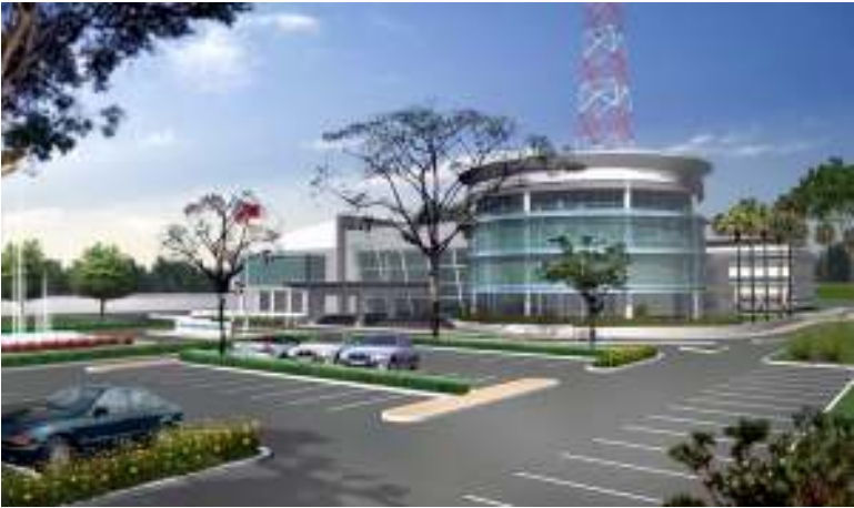
နအဖလက်ထက်တွင် သစ်ဖွင့်လှစ်လိုက်သော (MRTV-3) အဆောက်အဦး

စစ်ရုံးချုပ်နှင့် ဝန်ကြီးဌာန (၅)ခုကို မန္တလေးတိုင်း၊ ပျဉ်းမနားမြို့အနောက်ဘက် (၄)မိုင်ခန့်အကွာတွင်ရှိသော ကြပ်ပြေးအရပ်သို့ပြောင်းရွှေ့ရန် သက်ဆိုင်ရာဝန်ကြီးဌာနများကို ဇွန်လ (၁၄) ရက်နေ့ကတည်းက ဗဟိုမှ ညွှန်ကြားချက်ထုတ်ပြန်ထားကြောင်း သတင်းများအရ သိရှိရသည်။ ယင်းစီမံချက်ကို ၂၀၀၁ ခုနှစ်က လျှို့ဝှက်ဖော်ဆောင်ခဲ့ခြင်းဖြစ်ပြီး၊ စစ်ရုံးချုပ်အပါအဝင်၊ စိုက်ပျိုးရေးဝန်ကြီးဌာန၊ စွမ်းအင်ဝန်ကြီးဌာန၊ ပြန်ကြားရေးဝန်ကြီးဌာနနှင့် ပြန်ကြားရေးဝန်ကြီးဌာနလက်အောက်ခံမှ မြန်မာသတင်းစဉ်နှင့် မြန်မာရုပ်မြင်သံကြားဌာနတို့ကို အောက်တိုဘာလ နောက်ဆုံးထား၍