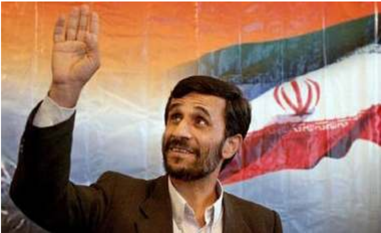
သဘောထားတင်းမာသည်ဟု ထင်ကြေးပေးခံရသူ အီရန်သမ္မတသစ် အာမက်အိနဂျစ်

လုပ်ငန်းစဉ်ကို ကြီးကြပ်သူ “ကာကွယ်ရေး ကောင်စီ” ပြောခွင့်ရပုဂ္ဂိုလ်တယောက်၏ အဆိုအရ ရေတွက်ပြီးစီးတဲ့ စုစုပေါင်းမဲအရေ အတွက် (၈၅)ရာခိုင်နှုန်းတွင် အာမက်အိနဂျစ် က (၆၁.၈)ရာခိုင်နှုန်းနဲ့ ဦးဆောင်နေပြီး၊ ရာခမ်ဆန်ဂျာနီက (၃၅.၇) ရာခိုင်နှုန်းရရှိနေ