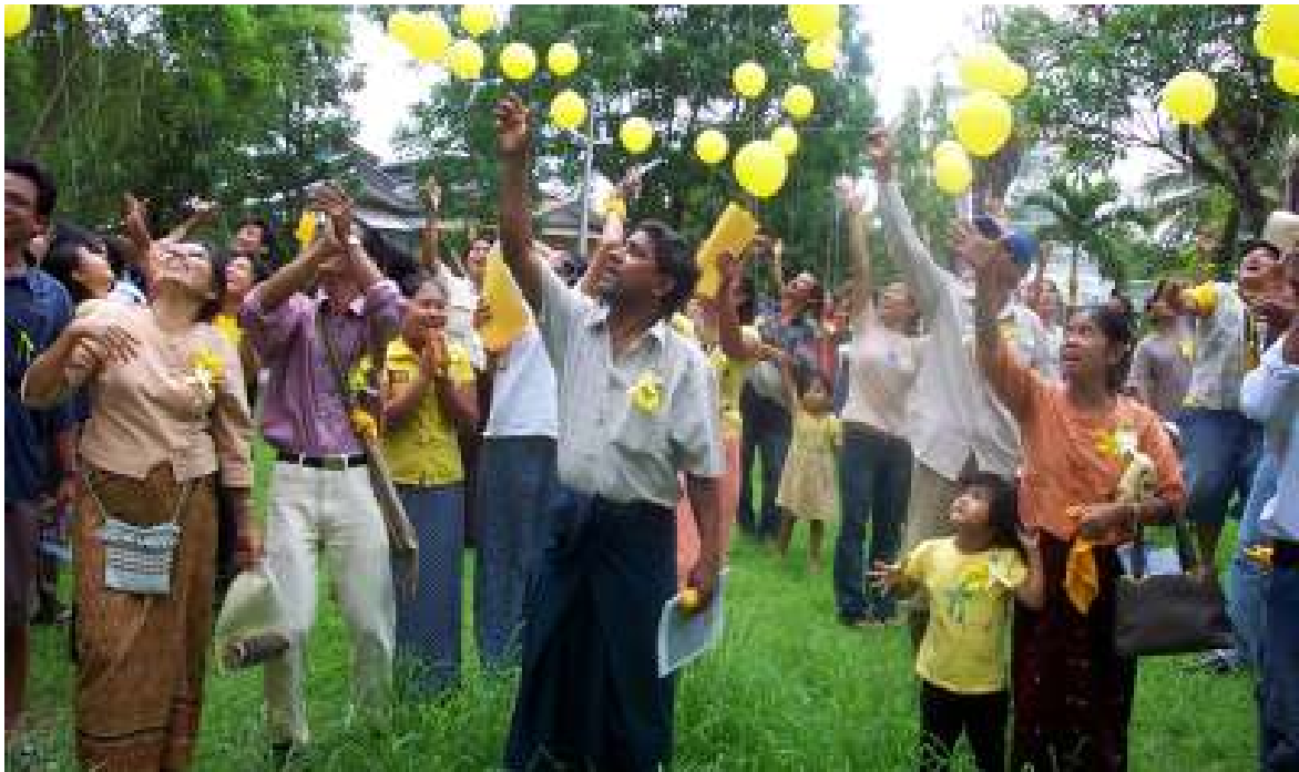
ထိုင်းမြန်မာနယ်စပ်တနေရာတွင် ကျင်းပနေသော ဒေါ်အောင်ဆန်းစုကြည်မွေးနေ့အခမ်းအနား မြင်ကွင်း