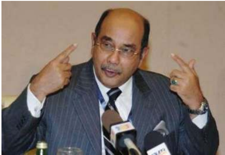
မလေးရှားနိုင်ငံခြားရေးဝန်ကြီး ဟာမက်အယ်ဘာ

အာဆီယံအလှည့်ကျ ဥက္ကဋ္ဌမည် အဖွဲ့ကြီး၏ စည်းဝေးပွဲများကို ကမကထ တာဝန်ယူကျင်းပပြီး အဖွဲ့၏လုပ်ငန်းစဉ်များနှင့် ပတ်သက်၍ အဆုံးအဖြတ်ပေးသည့် အစဉ်အလာ