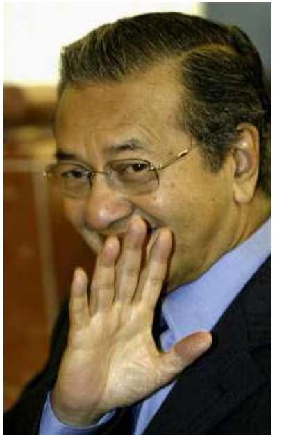
မလေးရှားဝန်ကြီးချုပ်ဟောင်း မဟာသီ

ဖြင့်လည်း ပြည်တွင်းပြည်ပမှ လူထု၏ဆန္ဒအမြင်ကို အလေးထားပြီး ဒီမိုကရေစီခေါင်းဆောင် ဒေါ်အောင်ဆန်းစုကြည်အား ပြန်လွှတ်ပေးသင့်ကြောင်း ပြုပြင်ပြောင်းလဲမှုများဆောင်ရွက်လိုလျှင် ဖြစ်ပေါ်လာမည့် အကျိုးရလဒ်များကို ကြောက်ရွံ့နေ၍ မသင့်ကြောင်း မဟာသီဟာက တိုက်တွန်းထားသည်။