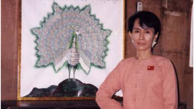
အမျိုးသားဒီမိုကရေစီအဖွဲ့ချုပ် အထွေထွေအတွင်းရေးမှူး ဒေါ်အောင်ဆန်းစုကြည်

တာဝန်ရှိမှု ရှိရမယ်။ Transparency ပွင့်လင်းမှု ရှိရမယ်။ နောက်ပြီးတော့ လွတ်လွတ်လပ်လပ် ထိန်းကွပ်နိုင်ရမယ်။ နောက်အပြင်ကနေပြီးတော့ ဒီလို လုပ်ငန်းတွေ ဒီလို အကူညီပေးနေတဲ့ အစီစဉ်တွေကို လွတ်လွတ်လပ်လပ် စိစစ်ပိုင်ခွင့်ရှိရမယ်။ ကြည့်ပိုင်ခွင့်ရှိရမယ်။ နိုင်ငံတကာက ဒီလို ဆွေးနွေးပွဲတွေ ဖြစ်စေချင်တယ်ဆိုတာဟာ နိုင်ငံတကာက နားလည်လို့ပေါ့။ ဆွေးနွေးပွဲဆိုတာ ဒီနိုင်ငံအတွက်တင် မဟုတ်ဘူး။ ကမ္ဘာအတွက် အကောင်းဆုံးလမ်းပဲ။ အဲဒါကြောင့်ပို့ နိုင်ငံတကာကနေပြီးတော့ ဆွေးနွေးပွဲတွေ ဖြစ်စေချင်တယ်လို့ ပြောတာဟာ ဒီလူသားတွေရဲ့ယဉ်ကျေးမှုနဲ့ ကိုက်ညီတဲ့ တိုက်တွန်းချက်ပဲလို့ အန်တီတို့က ဒီလိုယူဆပါတယ်”။ [(၂၀၀၃) ခုနှစ်၊ မေလ (၁၄) ရက် ဒေါ်အောင်ဆန်းစုကြည်နှင့် ဒီဗွီဘီနှင့် မေးမြန်းခန်းမှ]