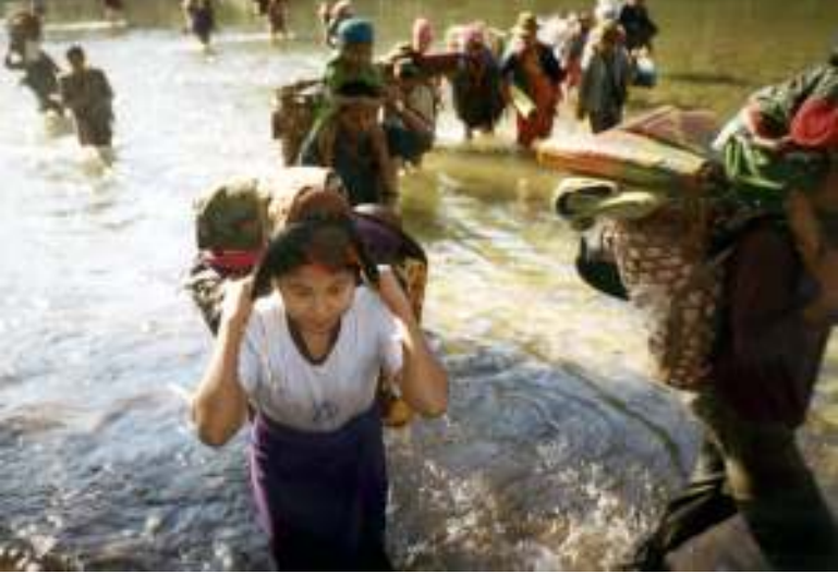
ရွှေ့ပြောင်းအခြေချနေထိုင်နေကြရသော ကရင်ဒုက္ခသည်များ

နအဖတပ်များနှင့် တိုင်းရင်းသားလက်နက်ကိုင်တပ်များအကြား ဖြစ်ပွားသော တိုက်ပွဲများကြောင့် မြန်မာနိုင်ငံတွင် ရွှေ့ပြောင်းပုန်းရွှေ့ရသော ဒုက္ခသည်များ၏ အခြေအနေသည် ပိုမိုဆိုးရွားနေဆဲဖြစ်ကြောင်း နော်ဝေအခြေစိုက် ဒုက္ခသည်များဆိုင်ရာကောင်စီ၏ ဇွန်လ (၂၇)ရက်နေ့ထုတ်အစီရင်ခံစာတွင် ဖော်ပြထားသည်။