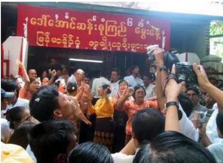
ဒေါ်အောင်ဆန်းစုကြည်၏ အသက် (၆၀) ပြည့် မွေးနေ့အခမ်းအနားကို အဲန်အယ်လ်ဒီဒီချုပ်က ကျင်းပနေစဉ်

မြန်မာ့ဒီမိုကရေစီခေါင်းဆောင် ဒေါ်အောင်ဆန်းစုကြည်၏ အသက် (၆၀)ပြည့် မွေးနေ့အခမ်းအနားကို မြန်မာနိုင်ငံအနှံ့ အပြားနှင့် ကမ္ဘာအရပ်ရပ်တွင် ဒီမိုကရေစီ မြတ်နိုးသူများနှင့် နိုင်ငံအသီးသီးမှ ကျော်ကြားသော ပုဂ္ဂိုလ်များက ဦးဆောင်၍ အောင်မြင်စွာ ကျင်းပခဲ့ကြောင်းသိရှိရသည်။