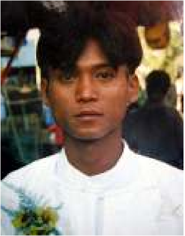
ကိုအောင်လှိုင်ဝင်း

နအဖအနေဖြင့် စစ်ကြောရေးစခန်း နှင့် အကျဉ်းထောင်များတွင် ပြုလုပ်နေသော ညှဉ်းပန်းနှိပ်စက်မှုများကို ရပ်တန့်ပြီး၊ နှိပ် စက်ညှဉ်းပန်းနှိပ်စက်မှု မပြုလုပ်ရန် တားမြစ် ထားသည့် နိုင်ငံတကာသဘောတူညီချက် တွင် လက်မှတ်ထိုးရန် နိုင်ငံရေးအကျဉ်းသား ကူညီစောင့်ရှောက်ရေးအသင်းက တောင်း ဆိုလိုက်သည်။ နိုင်ငံတကာ နှိပ်စက်ညှဉ်းပန်းမှု တိုက် ဖျက်ရေးနေ့ဖြစ်သော ဇွန်လ (၂၆)ရက် နေ့က ထုတ်ပြန်သော အေအေပီပီ၏ ကြေ ညာချက်တွင် ဗိုလ်ချုပ်မှူးကြီးသန်းရွှေ ဦးဆောင်သော စစ်အုပ်စုသည် နိုင်ငံရေး လှုပ်ရှားဆောင်ရွက်သူများကို လူမဆန် သော ကြောက်မက်ဖွယ်ရာနှိပ်စက်မှု နည်းနာ များကို အသုံးပြုညှဉ်းပန်းခွင့်ဖြင့် အကျဉ်း ထောင်များနှင့် စစ်ကြောရေးစခန်းများတွင် နိုင်ငံရေးအကျဉ်းသား (၉၄)သေဆုံးခဲ့ရ ကြောင်းဖော်ပြထားသည်။ ကြေညာချက်တွင် မေလက ရန်ကုန် စားသောက်ဆိုင်တဆိုင်တွင် ညစာ စား သောက်နေစဉ် အဖမ်းခံခဲ့ရပြီးနောက် စစ်