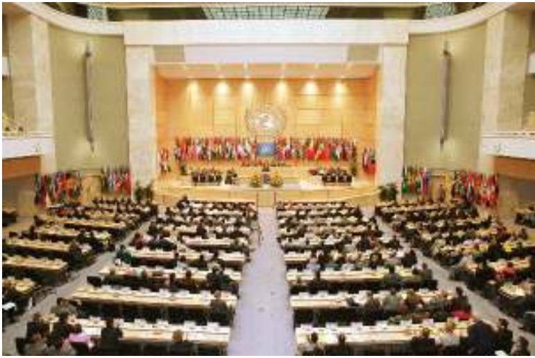
ကမ္ဘာ့အလုပ်သမားအဖွဲ့ချုပ် (အိုင်အယ်လ်အို) အစည်းအဝေးကျင်းပနေစဉ်

ဇွန်လဆန်းပိုင်းက ကျီနီဖာတွင်ကျင်းပသော အိုင်အယ်လ်အိုညီလာခံက မြန်မာနိုင်ငံတွင် အဓမ္မလုပ်အားပေးခိုင်းစေခြင်းများ ဆက်လက်လုပ်ဆောင်နေသည့် နအဖအပေါ် ပိုမိုပြင်းထန်သော အရေးယူမှုများပြုလုပ်ရန် ဆုံးဖြတ်လိုက်ကြောင်း သိရှိရသည်။ ယခုဆုံးဖြတ်ချက်အရ အိုင်အယ်လ်အို၏ ယခင်ဆုံးဖြတ်ချက်ဖြစ်သော မြန်မာနိုင်ငံကို အိုင်အယ်လ်အို ပုဂံ (၃၃)ဖြင့် အရေးယူရေးအပြင် နိုင်ငံခြားရင်းနှီးမြှုပ်နှံမှုနှင့် ပတ်သက်၍ သက်ဆိုင်ရာနိုင်ငံအစိုးရများနှင့် အဖွဲ့