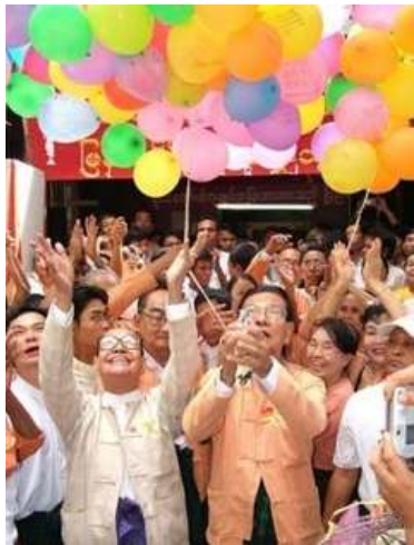
ဒေါ်အောင်ဆန်းစုကြည်၏ အသက်(၆၀)ပြည့် မွေးနေ့အခမ်းအနားကို အဲန်အယ်လ်ဒီဒီချုပ်က ကျင်းပစဉ်

ဝါရင့်နိုင်ငံရေးသမားကြီး သခင်သိန်းဖေ၏နေအိမ်တွင်လည်း ဒေါ်အောင်ဆန်းစုကြည်မွေးနေ့နှင့် သခင်သိန်းဖေ အသက် (၈၆)နှစ်ပြည့်မွေးနေ့ပွဲကို ပူးတွဲကျင်းပခဲ့ပြီး၊ ဝါရင့်နိုင်ငံရေးသမားများက တိုင်းပြည်အကျိုးအတွက် တွေ့ဆုံဆွေးနွေးရေး အကောင်အထည်ဖော်ရန် တိုက်တွန်းထားသောစာကို နအဖဥက္ကဋ္ဌထံသို့ ပေးပို့ခဲ့ကြောင်းသိရှိရ