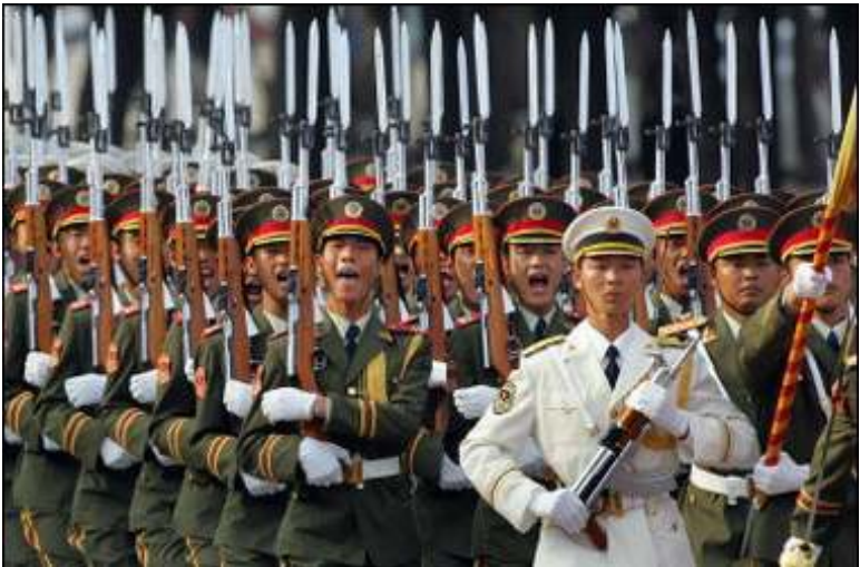
လက်နက်အပြည့်အစုံတပ်ဆင်ထားသော တနိုတ်တပ်မတော် စစ်ရေးပြနေစဉ်