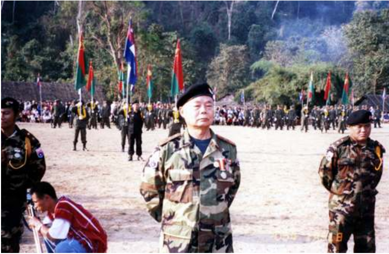
ကေအဲန်အယ်လ်အေ စစ်ဦးချုပ် ဒုဗိုလ်ချုပ်ကြီး စောမူတူးစေးဖိုး

မချသရွေ့ ကရင်တော်လှန်ရေး ဘယ်တော့မှ မရှုံး ”ဟူသော စောဘဦးကြီး၏ မိန့်မှာချက်ကို ကိုးကား၍ ဒီမိုကရေစီအင်အားစုများနှင့် နီးကပ်စွာ ပူးပေါင်းဆောင်ရွက်သွားမည်ဖြစ်ကြောင်း ပြောကြားသွားသည်။ ထူးခြားချက်မှာ နာမကျန်းဖြစ်နေသည်ဆို၍ ကရင်တော်လှန်ရေးလှုပ်ရှားမှုမြင်ကွင်းမှ အတန်ကြာ ပျောက်ကွယ်နေသော ကေအဲန်အယ်လ်အေ ကာကွယ်ရေးဌာနတာဝန်ခံ ဗိုလ်ချုပ်ကြီး စောဘိုမြကို စစ်ဝတ်စုံအပြည့်ဖြင့် မိန့်ခွန်းပြောကြားသွားသည်ကို တွေ့မြင်ရခြင်းပင်ဖြစ်သည်။ ဗိုလ်ချုပ်ကြီးက တော်လှန်ရေးအား တန်ဖိုးထားရန်၊ သစ္စာရှိရန် တောင်းဆိုလိုက်ပြီး ဆက်လက်တိုက်ပွဲဝင်သွားရန် ကရင်အမျိုးသားလုံးအား နှိုးဆော်ခဲ့သည်။ ယင်းအခမ်းအနားတွင် စစ်ဦးစီးချုပ် ဒုဗိုလ်ချုပ်ကြီး စောမူတူးစေးဖိုးက ဂုဏ်ပြုခံတပ်ဖွဲ့အား လိုက်လံစစ်ဆေးခဲ့ကြောင်းသိရှိရသည်။