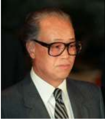
တရုတ်ပြည်တွင်းမြို့နယ်ပေါ်တိုက်ခိုက်မှုများ ဆက်တိုက်ပေါ်တိုက်ခိုက်မှုများ ကျောက်ကျိယန်