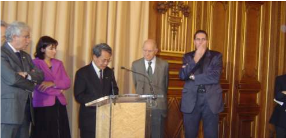
ပါရီမြို့တော်သုဆုရီးမြင့်ပွဲအခမ်းအနားတွင် ပြည်ထောင်စုမြန်မာနိုင်ငံညွန့်ပေါင်းအစိုးရဝန်ကြီးချုပ် ဒေါက်တာစိန်ဝင်းက ဒေါ်အောင်ဆန်းစုကြည်ကိုယ်စား ဆုလက်ခံရယူနေစဉ်

ရေးသိက္ခာဆိုတာလည်း ဗလနတ္တိဖြစ်က ရောပေ။ ဓမ္မကို အန္တရာယ်ပြုကြတော့ ဒင်း တို့တတွေ မိစ္ဆာတံခွန်ထူတဲ့ ဓမ္မအန္တရာယ် ရယ်တွေ ဖြစ်ကုန်ကြတာပဲပေါ့။ တရားတဲ့မင်း မရှိလေတော့ တရားဆိတ်တဲ့ တိုင်းပြည်ဖြစ် လာရတော့တာပါပဲ။ မိုက်မဲခြင်းမောဟ ဖိုး လွှမ်းလာတော့ လောဘ၊ ဒေါသတွေနဲ့ အ သက်ရှင်နေထိုင်ရတော့တာပါပဲ။ သူတပါး အကျိုးကျေးဇူးကို အလေးမထားတတ်တဲ့ ကိုယ့်အကျိုးကိုယ့်စီးပွားကိုသာကြည့်တတ်တဲ့ ကိုယ်ကျိုးရှာတဲ့နေရာမှာသာ တတ်ကျွမ်း လာတဲ့သတ္တဝါတွေ ဖြစ်လာကြရတော့တယ်။ ကိုယ့်ဘာသာကိုခန့်ထားတဲ့ ဗိုလ်ချုပ်လုပ်စား သူတွေပဲ ဖြစ်လာတော့တာပါပဲ။ အဓမ္မမာန် မာနနဲ့အာဏာသိမ်းထားပြီး၊ စစ်အာဏာရှင်