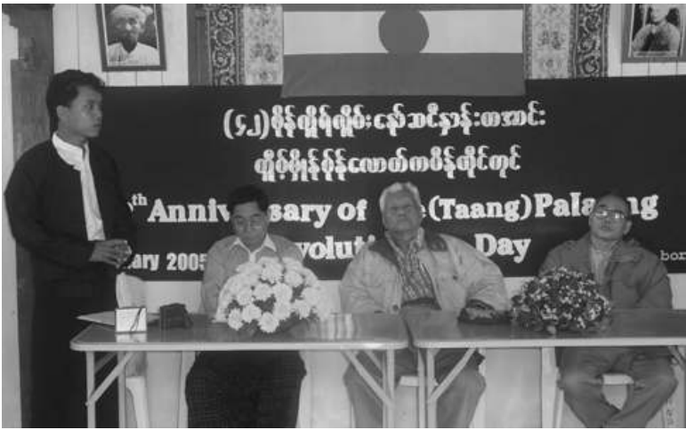
(၄၂) ကြိမ်မြောက် ပလောင်အမျိုးသားတော်လှန်ရေးနေ့ အခမ်းအနားကို ပလောင်ပြည်နယ်ပြည်သူ့လွှတ်မြောက်ရေးတပ်ဦးဌာနချုပ်၌ကျင်းပနေစဉ်

သက္ကရာဇ် ၂၀၀၅၊ ဇန်နဝါရီလ (၁၂) ရက်နေ့၌ကျရောက်သော ပလောင်အမျိုးသားတော်လှန်ရေးနေ့ (၄၂)ကြိမ်မြောက် အခမ်းအနားကို လွတ်မြောက်နယ်မြေတနေ့ ရာ၌ကျင်းပရာ ဥက္ကဋ္ဌ ဗိုလ်ချုပ်ကြီးတာမ လာဘောဦးဆောင်သော အမျိုးသားကောင်စီမှအဖွဲ့ဝင်များ၊ ဒီအေဘီ၊ အနီလီဒီအက်ဖ်နှင့် အန်အယ်လီဒီ အယ်လ်အေတို့မှ ပုဂ္ဂိုလ်များ စုံညီစွာတက်ရောက်သည်ကို တွေ့ရှိရသည်။