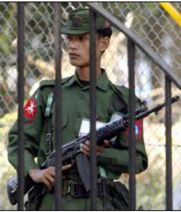
နအဖ စစ်သားတစ်ဦး