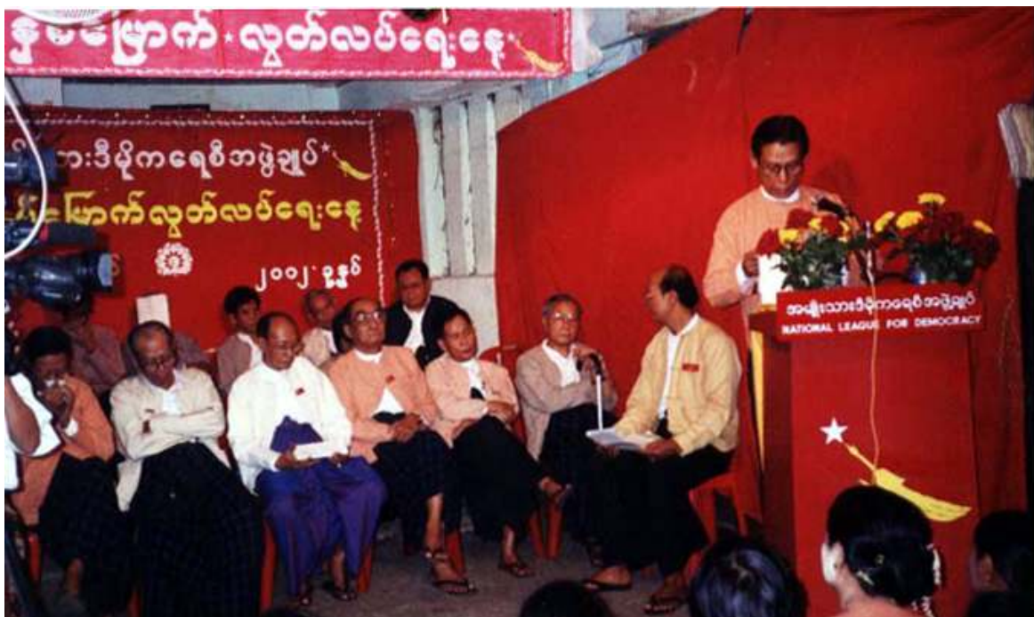
၂၀၀၂ ခုနှစ်၊ (၅၄)ကြိမ်မြောက် မြန်မာ့လွတ်လပ်ရေးနေ့ အခမ်းအနားကို အဖွဲ့ချုပ်၌ ကျင်းပခဲ့စဉ်က

ယင်း နိုင်ငံရေးပတ်ဝန်းကျင်အခြေအနေများမှာ (၁)အကျဉ်းကျခံနေရသော နိုင်ငံရေးသမားများနှင့် နေအိမ်များတွင် အကျယ်ချုပ်ကျခံနေရသော နိုင်ငံရေးသမားများကို ယနေ့မှစ၍ ခြွင်းချက်မရှိ အမြန်ဆုံးလွတ်ပေးရေး၊ (၂) လွတ်ငြိမ်းချမ်းသာခွင့်ပေးခဲ့ပြီးသော နိုင်ငံရေးအကျဉ်းသားများအပေါ်တွင် ပြုလုပ်ထားသည့် ခံဝန်ချက်များကို ပယ်ဖျက်ပေးရေး၊ (၃) နိုင်ငံရေးယုံကြည်ချက်ရှိသူများအပေါ် ဖမ်းဆီးချုပ်နှောင်ရန် ယခင်အစိုးရများက ပြဋ္ဌာန်းခဲ့သည့် မလိုလားအပ်သောဥပဒေများ (ဥပမာ- ပုဒ်မ ၅/ည) အပါအဝင် ၁၉၅၀ ပြည့်နှစ်၊ အရေးပေါ်စီမံမှုအက်ဥပဒေ ပုဒ်မ ၁၀(က)/(ခ)တို့ ပါဝင်သော ၁၉၇၅ခုနှစ်၊ နိုင်ငံတော်အား နှောင့်ယှက်ဖျက်ဆီးလိုသူများ၏ ဘေးအန္တရာယ်မှ ကာကွယ်စောင့်ရှောက်မှုဥပဒေတို့ကို ပြန်လည်ရုတ်သိမ်းပေးရေး၊ (၄) နိုင်ငံသားများ