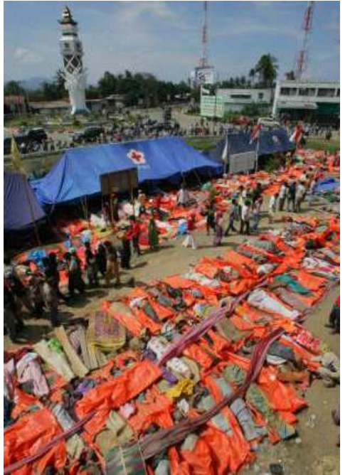
အင်ဒိုနီးရှားနိုင်ငံ၊ အာချီးမြို့တော်တွင် ဆူနာမီရေလှိုင်းဒဏ်ကြောင့် သေဆုံးခဲ့ရသူတို့၏ ရုပ်အလောင်းများ

ကုလသမဂ္ဂပညာရေး၊ သိပ္ပံနှင့်ယဉ်ကျေးမှု (UNESCO) အဖွဲ့ကဦးဆောင်ပြီး ဂျပန်၊ အီးယူ၊ အမေရိကန်၊ ဂျာမနီနှင့် အခြားနိုင်ငံများက နည်းပညာနှင့် ငွေကြေးဒေါ်လာသန်းပေါင်း အကုန်ကျခံတည်ဆောက်မည်ဖြစ်ပြီး သမုဒ္ဒရာအောက်ကြမ်းပြင်၏ လှုပ်ရှားမှုကြောင့် ဖြစ်ပေါ်လာနိုင်သော ရေဘေးအန္တရာယ်ကို ကမ်းရိုးတန်းဒေသတွင်းရှိ