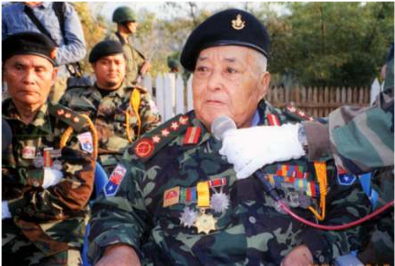
ကေအဲန်အယ်လ်အေ ကာကွယ်ရေးဌာနတာဝန်ခံ ဗိုလ်ချုပ်ကြီး စောဘိုမြ မိန့်ခွန်းပြောကြားစဉ်

(၅၆)ကြိမ်မြောက် ကရင်တော်လှန်ရေး အခန်းအနားကို ဇန်နဝါရီလ (၃၁)ရက်နေ့၌ ကော်သူလေးပြည်နယ်အနီးအနားရှိ တပ်မဟာအသီးသီး၌ စည်ကားသိုက်မြိုက်စွာ ကျင်းပခဲ့သည်ဟု သိရှိရသည်။ ကရင်အမျိုးသား အစည်းအရုံးဗဟိုဌာနချုပ်၏ ဗဟိုလုပ်အမှုအဆောင်အဖွဲ့မှ ကရင်တော်လှန်ရေးနေ့နှင့် စပ်လျဉ်း၍ ကြေညာချက်တစောင်ထုတ်ပြန်ရာ၌ “ကရင်တော်လှန်ရေးသည် အချိန်ကြာမြင့်စွာကတည်းကပင် အုပ်စိုးသူအဆက်ဆက်၏ အလုံးစုံချေမှုန်းသတ်သင်ရေးပေါ်လစီကို ရင်ဆိုင်ခဲ့ရကြောင်း၊ ယခုလက်ရှိ နအဖအစိုးရသည်လည်း ကရင်အမျိုးသားများအပေါ် ဆင်နွှဲနေသည့် ယင်းအလုံးစုံချေမှုန်းရေးမူဝါဒအား စွန့်လွှတ်ခြင်းမရှိသေးကြောင်း၊ သို့ပါ၍ နအဖအား ယင်းပေါ်လစီကို စွန့်လွှတ်ရန်တောင်းဆိုလိုက်ပြီး တနိုင်ငံလုံးအပစ်အခတ်ရပ်စဲရေး၊ နိုင်ငံရေးအကျဉ်းသားအား လုံး လွတ်မြောက်ရေး၊ အဓိပ္ပာယ်ရှိသော နိုင်ငံရေးတွေ့ဆုံဆွေးနွေးပွဲများကို နှောင့်နှေးမှု