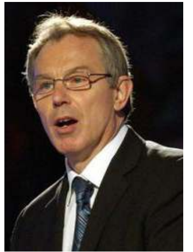
ဗြိတိန်ဝန်ကြီးချုပ် တိုနီဘလဲ

BC-UK၏ ယခုကမ္ဘာလှည့်လှုပ်ရှားတောင်းဆိုမှုသည် အသားအရောင်ခွဲခြားရေးစနစ်