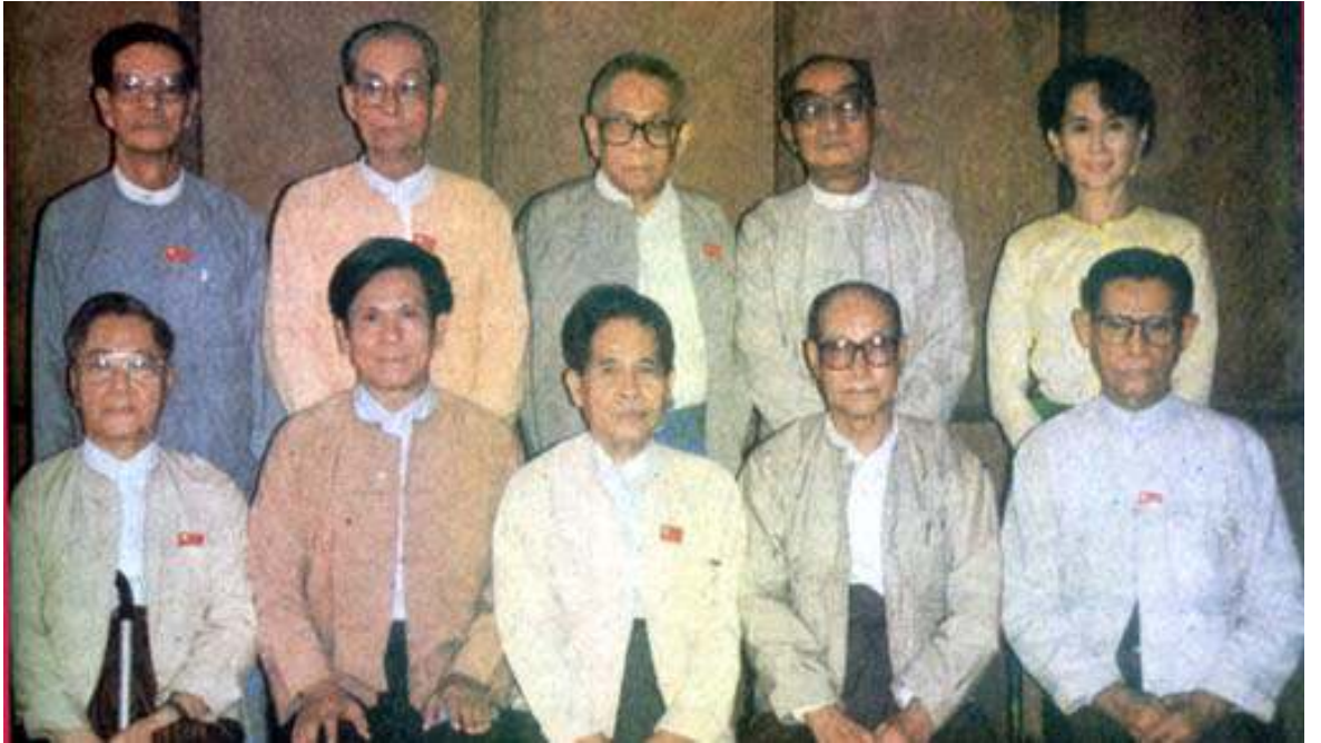
ပြည်သူ့လွှတ်တော်ကိုယ်စားပြုကော်မတီ အဖွဲ့ဝင်များ

(၃) လွှတ်တော်၏သက်တမ်းကို အများပြည်သူတို့ကလက်ခံနိုင်ပြီး ဒီမိုကရေစီမူများနှင့် ကိုက်ညီသော ဖွဲ့စည်းအုပ်ချုပ်ပုံအခြေခံဥပဒေတရပ်ကို ဤလွှတ်တော်က အတည်ပြုပြဋ္ဌာန်းပြီး