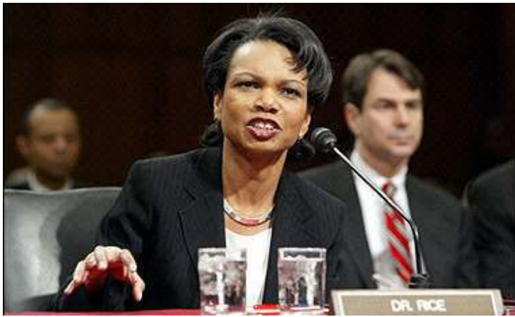
အမေရိကန်နိုင်ငံခြားရေးဝန်ကြီးသစ်ဖြစ်သူ မစ္စ ကွန်ဂရက်အစည်းအဝေး

ကမ္ဘာတဝှမ်းလုံး လွတ်လပ်ရေးရေသံသို့ရောက်ရှိသည့် သမတဒဗလျူဘွန်၏ ရဲရင့်သော အစီအစဉ်အားတိုးမြှင့်လုပ်ဆောင်နေသည့် အမေရိကား၏သံအမတ်များအား ကူညီမည့် အာမခံချက်ဖြင့်အတူ ဇန်နဝါရီလ (၂၇)ရက်နေ့တွင် ကွန်ဂရက်အစည်းအဝေးတွင် နိုင်ငံခြားရေးဝန်ကြီးအဖြစ် စတင်တာဝန်ယူခဲ့သည်။ “လွတ်မြောက်မှုနဲ့ လွတ်လပ်ရေးအတွက် အမေရိကားက ရပ်တည်ပါမယ်”ဟု သူမက ကြေညာခဲ့သည်။ ရိုက်ကန်သည် (၂၀၀၀)ခုနှစ် လှုပ်ရှားမှုများနှင့် ပထမအကြိမ်သက်တမ်းကာလတလျှောက်လုံးသမတဘုရား၏ အရင်းနှီးဆုံးနိုင်ငံခြားရေးဝန်ကြီးအဖြစ်အဖြစ် စစ်အေးခတ်ကာလအား အထူးပြုလေ့လာခဲ့သည့်ပညာရှင်လည်းဖြစ်သည်။ နိုင်ငံခြားရေးဝန်ကြီးအဖြစ်သို့ရောက်ရှိလာသည့် ဦးစီးဌာနအဖြစ်အဖြစ် အမျိုးသမီးဖြစ်ပြီး၊ ပထမဆုံးလူမည်းအမျိုးသမီးလည်းဖြစ်သည်။ ယခင်က၎င်း၏လက်ထောက်ဖြစ်သူ စတင်ဖက်ဟက်ဒလေသည် ယခင်သူမတာဝန်ယူခဲ့သည့် အမျိုးသားလုံခြုံရေးအကြံပေးဖြစ်လာသည်။ ၎င်းသည် နိုင်ငံခြားရေးဌာနတွင်လုပ်ခဲ့သည့်မှာ ဤအကြိမ်သည် ပထမဆုံးအကြိမ်မဟုတ်ကြောင်း (၁၉၇၇) ခုနှစ် သမတဂျင်မီကာတာလက်ထက်က ပညာရေးနှင့်ယဉ်ကျေးမှုရေးရာဌာနတွင် အလုပ်သင်အဖြစ်လုပ်ခဲ့ဖူးကြောင်း ထုတ်ဖော်ပြော