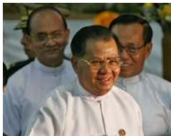
သဘောထားကွဲလွဲမှုများကြားက အားပြိုင်နေသည့် နအဖ စစ်ခေါင်းဆောင်များ