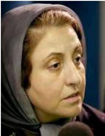
အီရန်နိုဘယ်လ်ဆူရှင် ရှိရင်အီဘာဒီ

၂၀၀၃ ခုနှစ်၊ နိုဘယ်လ်ဆူရှင် ရှိရင်အီဘာဒီအားဖမ်းဆီးရန် ခြိမ်းခြောက်ခဲ့ခြင်းကို ဇန်နဝါရီလ(၁၇)ရက်နေ့ကအီရန်တရားရေးဌာနက ပြန်လည်ရုတ်သိမ်းခဲ့ပြီး သူမကို ပေးပို့ခဲ့သည့် တရားရုံး၏ဆင့်ခေါ်စာမှာ အုပ်ချုပ်ရေးဌာန၏ အမှားတခုသာဖြစ်ကြောင်း ပြောကြားခဲ့သည်။ “သမ္မန်စာရေးတဲ့စာရေးက အတောအကြိုသိပ်မရှိသေးတော့ သမ္မန်စာမှာ ဘာအကြောင်းအရာဖော်ပြရမယ်ဆို