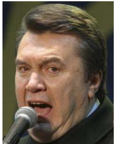
ဗစ်တာယာနူကိုဗစ်ချ်

ဒီဇင်ဘာ ၂၆ ရက်က ကျင်းပခဲ့သည့် သမ္မတရွေးကောက်ပွဲတွင် ဒုတိယမဲအများဆုံးရခဲ့သည့် ဗစ်တာယာနူကိုဗစ်ချ်သည် ရွေးကောက်ပွဲရလဒ်လက်မခံဘဲ ဆန့်ကျင်သည့် နောက်ဆုံးလျှောက်ထားချက်ကို တရားရုံးတွင် ရင်ဆိုင်ခဲ့သည်။ ရွေးကောက်ပွဲကော်မရှင်၏အဆိုအရ ယာနူကိုဗစ်ချ်သည် အတိုက်အခံခေါင်းဆောင် ဗစ်တာယူချင်ကိုအား မဲပေါင်း (၂)သန်းကျော်ဖြင့် ရှုံးနိမ့်ခဲ့သည်။ ရွေးကောက်ပွဲပြန်လည်ကျင်းပရန် ယာနူကိုဗစ်ချ်၏ အကြိမ်ကြိမ်လျှောက်လဲချက်ကို တရားရုံးက ပယ်ချခဲ့ပြီးဖြစ်သည်။ တရားဥပဒေကြောင်းအရ စိန်ခေါ်မှုများ ပြီးဆုံးသည့်တိုင်