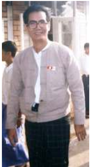
ဇိုမီးအမျိုးသားကွန်ဂရက်ဥက္ကဋ္ဌ ပုကုဉ်ရှင်းထန်

စီအာရ်ပီပီကို ၁၉၉၈ ခု စက်တင်ဘာ ၁၆ ရက်နေ့တွင် အဲန်အယ်လ်ဒီက ဦးဆောင် ဖွဲ့စည်းခဲ့ပြီး တိုင်းရင်းသားပါတီများနှင့် ပြည်