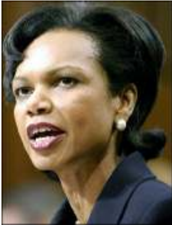
အမေရိကန်နိုင်ငံခြားရေးဝန်ကြီး ကွန်ဒိုလီဇာရိုင်

ထိုအတူ ဇန်နဝါရီလ(၂၀) ရက်နေ့က သမ္မတဘူရှ်၏ ကျမ်းသစ္စာ ကိုယ်စီဆိုသည့်ပွဲတွင် လည်း သမ္မတဘူရှ်က အမေရိကန်နိုင်ငံ၏