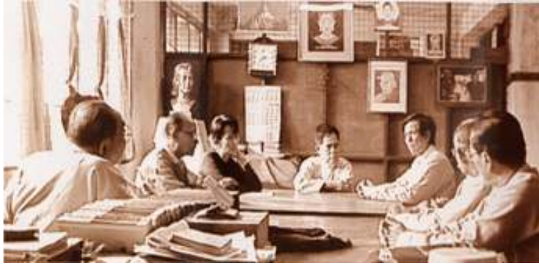
ပြည်သူ့လွှတ်တော်ကိုယ်စားပြုကော်မတီ အစည်းအဝေးတခုကျင်းနေစဉ်

နှိုင်းယှဉ်ချက်အရ ပြည်တွင်းပြည်ပ အခြေအနေအရပ်ရပ်အရသော် လည်းကောင်း၊ ယနေ့ကာလမတူ ထူးခြားချက်များအရသော်လည်းကောင်း၊ သဏ္ဌာန်အရမတူညီသော်လည်း အနှစ်သာရအရဆိုလျှင် စီအာရ်ပီပီသည်ဖဆပလ ကဲ့သို့ပင် နိုင်ငံရေးအရခွန်အားရှိသည့် ပြည်သူတရပ်လုံးကထောက်ခံသည့် တပ်ပေါင်းစုကြီးဖြစ်ပါသည်။ ယနေ့ကာလ တပ်ဦးအလံကို စီအာရ်ပီပီတပ် ပေါင်းစုကြီးသည် သူ၏သမိုင်းတာဝန်ကို ကျေပွန်မည်၊ မကျေပွန်မည်ကို မဝေး ကွာလှတော့သည့်ကာလတွင် အဖြေထွက်လာတော့မည်ဖြစ်ပါကြောင်း ....❖