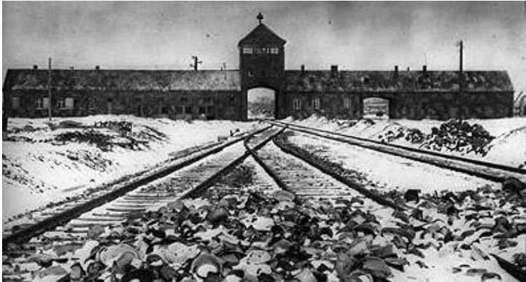
ဒုတိယကမ္ဘာစစ်အတွင်းက လူပေါင်း (၁၃သမဂ္ဂ)သန်းအသတ်ခံခဲ့ရသည့် နာဇီတို့၏ အောင်စွာကျဉ်းစခန်း

နှင့်မုန်တိုင်းများကျနေသည့် ရေခဲမှတ်အောက်အေးနေသည့် လေဟာပြင်၌ ဆိတ်ငြိမ်စွာ ထိုင်နေခဲ့ကြသည်။ အခမ်းအနားမှာ (၃)နာရီ ကြာမြင့်ပြီး ယခင်က အကျဉ်းသားများအားသယ်ဆောင်လာသည့် ရထားတွဲများ ဤစခန်းသို့ ဆိုက်ရောက်လာချိန်၌ အချက်ပေးခရာသံဖြစ်သည့် ခြောက်ခြားဖွယ်ရာသင်္ကေတဖြစ်သည့် စူးစူးရှရှုစိစိသံမှတ်ကာ အခမ်းအနားကိုရုတ်သိမ်းခဲ့ကြ