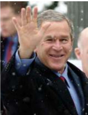
အမေရိကန်သမ္မတ ဂျော့ဗုရှား