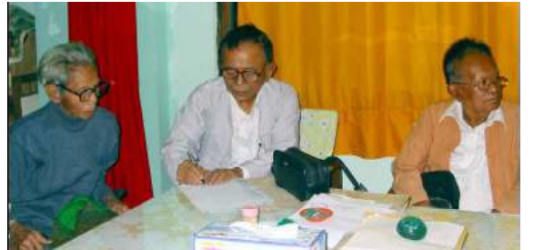
ဝါရင့်နိုင်ငံရေးသမားကြီးများ ဦးမင်းလွင် လက်မှတ်ရေးထိုးနေစဉ်။

ဩဂုတ်လ(၁၀)ရက်နေ့က ဝါရင့်နိုင်ငံရေးသမားကြီးများ အရေးပေါ်အစည်းအဝေး တရပ်ကျင်းပ၍ ကြေညာချက်တစ်ရပ်ထုတ်ပြန်ခဲ့ရာ ယင်းကြေညာချက်တွင် ဒေါ်အောင်ဆန်းစုကြည်၊ ဦးတင်ဦး အပါအဝင် အဖမ်းအသီးခံနိုင်ငံရေးအကျဉ်းသားများ လွတ်မြောက်ရေးနှင့် မေလ(၃၀)ရက်နေ့မှစ၍ အပိတ်ခံနေရသည့် အဖွဲ့ချုပ်ဝန်ထမ်းများ တနိုင်ငံလုံး ပြန်လည်ဖွင့်ခွင့်ရရှိရေးကို လက်မှတ်ရေးထိုး တောင်းဆိုလျက်ရှိသည့် အဖွဲ့ချုပ်၏ တနိုင်ငံလုံးအတိုင်းအတာဖြင့် လက်မှတ်ရေးထိုးသည့် ဆန္ဒပြလှုပ်ရှားမှုအား ထောက်ခံကြောင်း ဖော်ပြထားသည်။