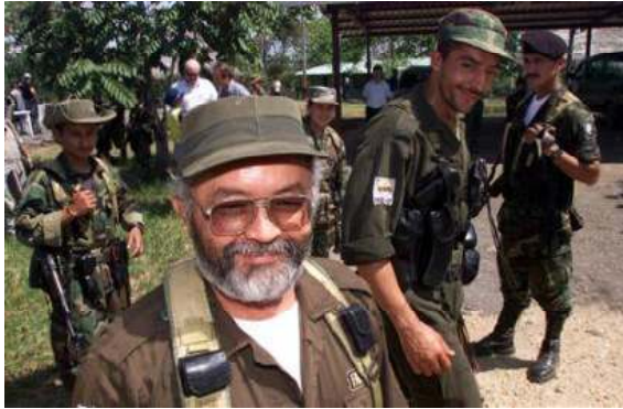
ကိုလံဘီယာ လက်နက်ကိုင်တော်လှန်ရေးတပ်ဖွဲ့တစ်ဖွဲ့ကို တွေ့မြင်ရစဉ်။

ပြန်ပေးဆွဲခံရသည့် နိုင်ငံရေးသမားများ၊ စစ်သားများ၊ အမေရိကန် ကန်ထရိုက်လုပ်ငန်းရှင်များအား အကျဉ်းထောင်တွင်းရှိ ပြောက်ကျားများနှင့်ဖလှယ်ရန် အစိုးရ၏ အဆိုပြုချက်အား ကိုလံဘီယာ၏ အဓိက သူပုန်အုပ်စုကြီးက ဝေဖန်ခဲ့သည်။ သို့သော် နှစ်ဖက်စလုံးအနေဖြင့် နောက်ဆုံးတွင် ဖလှယ်ရေးပုံစံအချို့အတွက် တူညီသည့် အခြေခံကို ရှာဖွေနိုင်လိမ့်မည်ဟု မျှော်လင့်ကြောင်း ကိုလံဘီယာ လက်နက်ကိုင်တော်လှန်ရေးအဖွဲ့(FARC)က ပြောကြားခဲ့သည်။ အကျဉ်းထောင်မှ လွတ်ပေးလိုက်သည့် ပြောက်ကျားများသည် တိုင်းပြည်မှထွက်သွားမည်လား (သို့မဟုတ်) အစိုးရမှ ကမကထဆောင်ရွက်သည့်လုပ်ငန်းစဉ်အောက်တွင် လူ့အဖွဲ့အစည်းအတွင်းသို့ ပြန်လည်ဝင်ရောက်မည်လားဆိုသည့် သမတ အယ်ဗာဒိုယူရိုဘဲ ၏ အစိုးရအဖွဲ့က ကြေညာခဲ့သည့် အဆိုပြုချက်တခုကို သူပုန်အဖွဲ့က ဝေဖန်ခဲ့သည်။ သူပုန်အဖွဲ့က အဆိုပြုချက်အား ပယ်ချခြင်းကို ၎င်းအနေဖြင့် စိတ်ပျက်မိကြောင်း ဒု သမတ ဖရန်စစ္စတိုဆန်းတော့စ်က ပြောကြားခဲ့သည်။ အကျဉ်းထောင်ထဲရှိ သူပုန် (၅၀)နှင့် သူပုန်များဖမ်းဆီးထားသည့် ၎င်းတို့အပေါ် နိုင်ငံရေးဝေးစားမှုများကို အရေအတွက် တူညီစွာဖလှယ်ရန် အစိုးရ