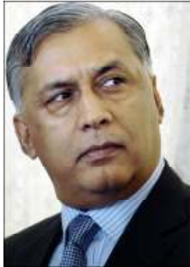
မစ္စတာ အဇစ်

ကြားဖြတ်ရွှေ့ကောက်ပွဲ၌ ပါကစ္စတန်၏ နောက်တက်မည့် သမတအဖြစ် လက်ရှိ သမတမူရှာရပ်စဲက ရွေးချယ်ထားသည့် မစ္စတာအဇစ်က အနိုင်ရခဲ့သည်ဟု အရာရှိများက ပြောဆိုသည်။ လက်ရှိဘဏ္ဍာရေးဝန်ကြီးဖြစ်သူ မစ္စတာ အဇစ်သည် ဗိုလ်ချုပ်ကြီး မူရှာရပ်စဲ၏ မဟာမိတ်တဦးဖြစ်ပြီး ဇာဟာရ်လာခန်ဂျဟာလီအား အစားထိုးရန် စီစဉ်ထားသည်။ ၎င်းသည် ဇွန်လက လွှတ်တော်ကိုယ်စားလှယ်အဖြစ် နှုတ်ထွက်ခဲ့သည်။ မစ္စတာအဇစ် အရွေးခံသည့်ခရိုင် (၂)ခုမှာ တောင်ပိုင်း ဆင်းပြည်နယ်ရှိ သာပါကာခရိုင်နှင့် အလယ်ပိုင်း ပန်ဂျပ် ပြည်နယ်ရှိ အက်တော့ခရိုင် တို့ဖြစ်သည်။ မစ္စတာအဇစ်သည် ဤမဲဆန္ဒနယ်(၂)ခုစလုံးတွင် အဓိက မဲအများစုကို ရရှိခဲ့သည်ဟု ပါကစ္စတန် သတင်းအေဂျင်စီက ပြောကြားခဲ့သည်။ အက်တော့ခရိုင်တွင် ယခင်ဘက်အရာရှိဖြစ်သူ မစ္စတာအဇစ်က ၎င်း၏ပြိုင်ဖက်အား မဲပေါင်း (၇)သောင်းကျော်ဖြင့် အပြတ်အသတ်အနိုင်ရခဲ့သည်။ မစ္စတာအဇစ်သည် နောက်အပတ်တွင် အရေးကြီးသော ဖွဲ့စည်းလိမ့်မည်