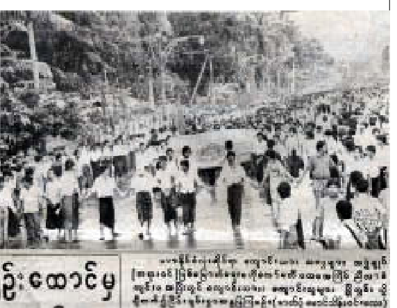
ဦးထောင်မှ

ကျောင်းသား သမဂ္ဂဖွဲ့ရေး စည်းဝေးခြင်း မြို့နယ်အချို့တွင် ဟောပြောပွဲ ကျင်းပခြင်း ရန်ကုန် ဩဂုတ် ၂၈ ဗမာ နိုင်ငံလုံး ဆိုင်ရာ ကျောင်းသားများသမဂ္ဂကို ပြန်လည်ဖွဲ့စည်းရာ မိုးသီးဇွန် အတွင်းရေးမှူးအဖြစ် ရွေးချယ်။ ကျောင်းသား သမဂ္ဂ ဖွဲ့စည်းပုံ အခြေခံဥပဒေကို ချမှတ်ကြောင်း ကြေညာခြင်း