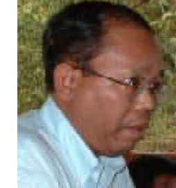
ဝန်ကြီးချုပ်ရုံးဝန်ကြီး ခေါက်တာ စန်းအောင်

အရှေ့တီမောတွင် မြန်မာ့ဒီမိုကရေစီရေးကိုထောက်ခံသည့် လွတ်တော်အမတ်များအဖွဲ့ ပွဲစဉ်းရေးကိစ္စ၌ဆောင်ရွက်နေပြီဖြစ်ပြီး မကြာမီပွဲစဉ်းနိုင်တော့မည်ဟု ပြည်ထောင်စု မြန်မာနိုင်ငံ အမျိုးသားညွန့်ပေါင်းအစိုးရအဖွဲ့ ဝန်ကြီးချုပ်ဝန်ကြီး ခေါက်တာစန်းအောင်က ဩဂုတ်လ(၁၀)ရက်နေ့က ထုတ်ဖော်ပြောကြားခဲ့သည်။ မလေးရှားပါလီမန်၌ မြန်မာအရေးလိုလားသော လွတ်တော်အမတ်များအဖွဲ့ကို ပြီးခဲ့သည့်ဇန်နဝါရီလတွင် ပွဲစဉ်းပြီးနောက်၊ ဖိလစ်ပိုင်၊ ကမ္ဘောဒီးယား၊ ထိုင်း၊ အင်ဒိုနီးရှား တို့တွင် ထပ်မံပွဲစဉ်းနိုင်ရေးကို စီစဉ်ဆောင်ရွက်နေကြောင်း သတင်းရရှိသည်။ ယင်း လွတ်တော်အဖွဲ့များ ပေါ်ပေါက်လာပြီးပါက ပူးပေါင်းဆောင်ရွက်နိုင်ရေးကို ကြိုးပမ်းမည်