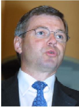
နော်ဝေဝန်ကြီးချုပ် ရှယ်မိုနာဘိုနာပစ်

နော်ဝေဝန်ကြီးချုပ် ရှယ်မိုနာဘိုနာပစ် က ခေါင်းဆောင် ဒေါ်အောင်ဆန်းစုကြည်နှင့်စစ်အုပ်စု တို့အကြားဆွေးနွေးပွဲများ ဖြစ်ပေါ်လာစေ ရန် နိုင်ငံတကာအသိုင်းအဝိုင်းက နအဖစစ် အုပ်စုအပေါ် ပိုမိုဖိအား ပေးသင့်ကြောင်း ယခုလ(၂၆)ရက်နေ့ကအေစီအေအိုင် ပြုလုပ် သည့် လူ့အခွင့်အရေးဆိုင်ရာအဆောက် အဦတခုဖွင့်ပွဲ အခမ်းအနားတွင် တိုက်တွန်း ပြောကြားလိုက်သည်။