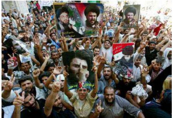
ဘာသာရေးခေါင်းဆောင် မိုတာဒါဆားအား ထောက်ခံသူများအားတွေ့ရစဉ်

ကပ်ပိုင်းရဲထားသည်ဟု အယ်လ်ဟော်ဇာ၏ ပြောရေးဆိုခွင့်ရှိသူက ပြောဆိုသည်။ ထိုဒေသရှိ စစ်ဆွေးကြမ်းများနှင့် အမေရိကန်တပ်မှူးများ တိုက်ခိုက်ကြရာ အမျိုးသမီး (၁)ဦး သေဆုံးပြီး အခြားပြည်သူ (၃)ဦး ဒဏ်ရာရခဲ့သည်။ ဩဂုတ်-၅။ အယ်လ်ဟော်ဇာ၏ ပြည်သူ့စစ်များက (၁၉၂၀)ခုနှစ် နဂါးရဲတပ်မှ ရေးရင်ပြင်ရှိ ရဲစခန်းအား မော်တာများ၊ နှုံးလောင်ချာများဖြင့် တိုက်ခိုက်ရာ အမေရိကန်တပ်များက ရဲအင်အား တိုးချဲ့သွားခဲ့သည်။ ထိုမှစ၍ ငြိမ်းတန်သည် တိုက်ပွဲများ ရက်ဆယ့်ပတ်ပေါင်းများစွာ စတင်ဖြစ်ပေါ်