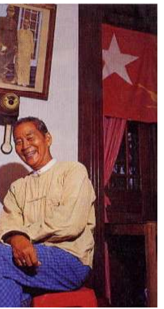
ရန်ကုန်တိုင်း၊ ဗဟန်းမြို့နယ် မဲဆန္ဒနယ်အမှတ်(၂) ပြည်သူ့လွှတ်တော်ကိုယ်စားလှယ် ဦးကြည်မောင်

ဥက္ကဋ္ဌ ဦးအောင်ဆန်းလက်အောက်တွင်လည်းကောင်း ဆက်လက်၍ သမဂ္ဂ ဥက္ကဋ္ဌ ဦးလှရွှေနှင့်လည်းကောင်း သမဂ္ဂအလုပ်အမှုဆောင်တဦးအဖြစ် ဆောင်ရွက်ခဲ့ပါသည်။ ဘီအေနောက်ဆုံးနှစ်အထိ သင်ကြားခဲ့သည်။ ၁၉၄၁ ခုနှစ်၊ ဧပြီလတွင် ဘီအိုင်အေတပ်သို့ ဝင်ရောက်ခဲ့ပြီး၊ မင်္ဂလာဒုံ ပထမ အပတ်ဗိုလ်သင်တန်းတက်ရောက်ခဲ့သည်။ ၁၉၄၃ ခုနှစ်မှ ၁၉၄၅ ခုနှစ်အထိ၊ ဂျပန်ပြည် ဘူမိတပ်မတော် စစ်တက္ကသိုလ်သင်တန်း အမှတ်(၅၇) တက်ရောက်၍ အောင်မြင်ပြီးနောက် ၁၉၄၇ ခုနှစ် ဒီဇင်ဘာလတွင် ဗမာ့တပ်မတော် တပ်ရင်း(၅)တွင် ပြန်ထမ်းဝင် အရာရှိအဖြစ် အမှုထမ်းခဲ့ပါသည်။ (၁၉၄၇)ခုနှစ်တွင် အင်္ဂလန်ပြည်တွင် သင်တန်းတက်ခဲ့ပြီး ၁၉၅၅ - ၅၆ ခုနှစ်တွင် အမေရိကန်ပြည် ဗိုလ်ဗင်ဇင်ဝပ်ရှီ ကွပ်ကဲမှုနှင့် စစ်ဦးစီးတက္ကသိုလ်တွင် ပညာသင်ခဲ့ဖူးသည်။ မြောက်ပိုင်းတိုင်း စစ်ဌာနချုပ် တိုင်းမှူး(၁၉၅၈-၆၀)၊ အနောက်တောင်တိုင်း စစ်ဌာနချုပ်တိုင်းမှူး (၁၉၆၁-၆၃)အဖြစ် အမှုထမ်းခဲ့ပြီး ၁၉၆၃ ခုနှစ် ဖေဖော်ဝါရီလ