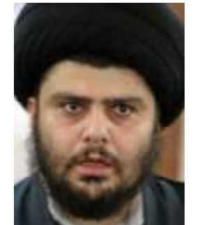
ဘာသာရေးခေါင်းဆောင် မိုတာဒါဆားအီ

သိမ်းပိုက်ထားသည်။ လက်နက်မဲ့လူအုပ်ကြီးက ဘာသာရေးအထွတ်အမြတ်နေရာအား လူသားပိုင်းအဖြစ် ကာကွယ်ထားသည်။ ထို့ပြင် မဒီတပ်မတော်သည် အထွတ်အမြတ်နေရာနှင့် နဂါးရဲရှိမြို့အား ဆက်လက်ခိုက်ခတ်ကွယ်သွားမည်ဖြစ်ပြီး အမေရိကန်များအား နဂါးရဲရှိမြို့အတွင်းသို့ အဝင်ခံမည်မဟုတ် ဟု ဆားဒ်၏ ပြောခွင့်ရပုဂ္ဂိုလ် ရှိတ်အာမက် အယ်လ်ဂေဟာနီက ပြောကြားလိုက်သည်။❖