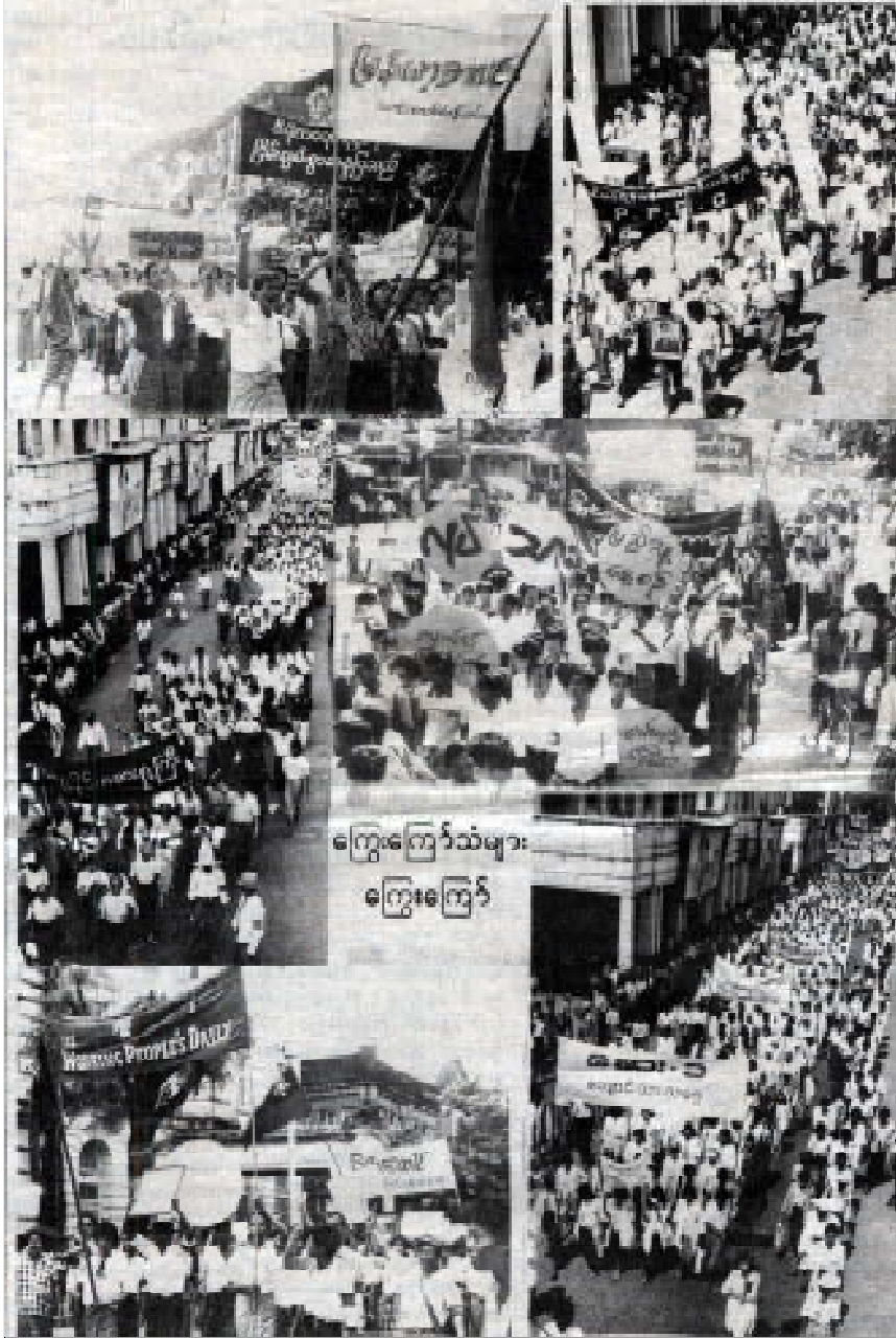
ကြေးမုံကြီးသံများ ကြေးမုံကြီး

နိုင်ငံတကာ လူ့အခွင့်အရေးအဖွဲ့များနှင့် လုံခြုံစိတ်ချရသော ရှေ့ဆောင်တန်းဖွဲ့များကောင်စီမှ ထုတ်ပြန်။ ကျောင်းသားများနှင့် အစိုးရကြား ဓမ္မစပ်ညှိနှိုင်းပေးမည့် ပြည်သူ့အတိုင်ပင်ခံကော်မတီ ဖွဲ့စည်းပေးရန် ခေါ်အောင်ဆန်းစုကြည်က အကြံပြု။ ဦးနု၊ မန်းဝင်းမောင်အပါအဝင် နိုင်ငံရေးသမားကြီးများက ထောက်ခံ။