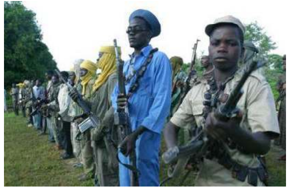
ဆူဒန်နိုင်ငံရှိ လက်နက်ကိုင်သူပုန်တပ်ဖွဲ့တို့အားတွေ့ရစဉ်

ဩဂုတ်-၂၅။ အယ်လ်စစ္စတန်နီသည် အီရတ်ရှိနေအိမ်သို့ ပြန်လာသည်။ အတိုက်အခိုက်ရပ်ရန် ကြိုးပမ်းမှုဖြစ်သည်ဟု ကိုယ်ရံတော်များက ပြောဆိုသည်။ ❖