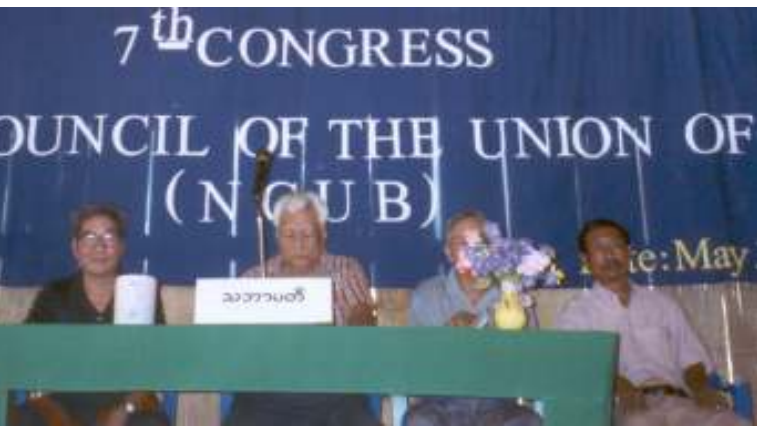
ရွေးချယ်တင်မြှောက်ခံရသော အဲဒီစီယူဘီ သဘာပတိအဖွဲ့

ပြည်ထောင်စုမြန်မာနိုင်ငံ အမျိုးသားကောင်စီ၏ သတ္တမအကြိမ်ညီလာခံကြီးကို လွတ်မြောက်နယ်မြေတနေရာတွင် (၃-၅-၂၀၀၄)ရက်နေ့မှ (၁-၅-၂၀၀၄ )ရက်နေ့အထိကျင်းပခဲ့ရာ ထိုညီလာခံမှနေ၍ “သုံးပွင့်ဆိုင်ဆွေးနွေးပွဲပေါ်ထွန်းရေးနှင့် ၁၉၉၀-ပြည့် ရွေးကောက်ပွဲရလဒ်အား အခြေခံသည့် ပြည်သူ့လွှတ်တော်ခေါ်ယူရေး”ကို လက်တလော မဟာဗျူဟာလုပ်ငန်းစဉ်ရည်မှန်းချက်အဖြစ် ချမှတ်အကောင်အထည်ဖော်ရန် ဆုံးဖြတ်ခဲ့ကြောင်းသိရသည်။