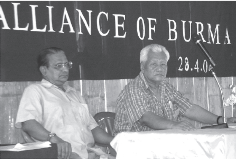
ဒီမိုကရက်တစ်မဟာမိတ်အဖွဲ့ချုပ်၏ ဥက္ကဋ္ဌ နှင့် ဒုတိယ ဥက္ကဋ္ဌတို့ကို တွေ့မြင်ရစဉ်။