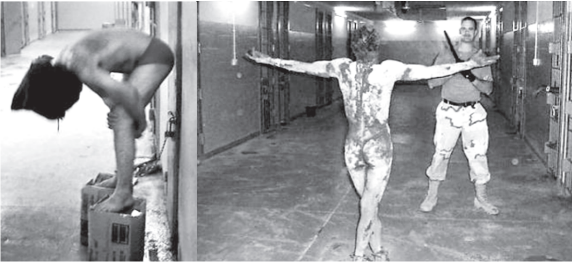
(ဝဲဘက်ပုံ) နာရီပေါင်းများစွာ အတင်းအကျပ် မတ်မတ်ရပ်စေခြင်းဖြင့် လည်းကောင်း၊ ဖူးကွေးကာ တဝက်ထိုင်တဝက်ရပ်အနေအထားညှဉ်းပန်းပုံ၊ (ယာဘက်ပုံ) ရက်ပေါင်းများစွာအိပ်မရဘဲ အစဉ်နီးနေစေရန် ပြုလုပ်ခြင်း)