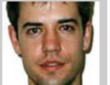
အိုင်အယ်လ်အို အရာရှိ ရစ်ချဒ်ဟော်ဆေး

အိုင်အယ်အိုကို သတင်းပေးသည်ဆိုပြီး ထောင်ချထားသူ (၃)ဦးအနက်မှ (၂)ဦးကို သေဒဏ်မှထောင်ဒဏ် (၃)နှစ်ကျန်(၁)ဦးကို တသက်တကျွန်းချမှတ်လိုက်ခြင်း ကိစ္စအား စစ်အာဏာပိုင်တို့မှ ချက်ချင်းဖြေရှင်းရန် ရစ်ချဒ်ဟိုင်းဆေးက တောင်းဆိုထားသည်။