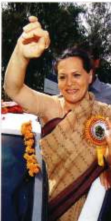
အိန္ဒိယအမျိုးသားကွန်ဂရက်ပါတီခေါင်းဆောင် ဆိုနီယာဂန္တီ

ယခင်အာဏာရပါတီဖြစ်သည့် ဘာရာတီရာဇာနာတပါတီ (BJP)သည် (၃၆၄) ယောက် ဝင်ရောက်အရွေးခံရ (၁၃၀) ယောက် အနိုင်ရရှိခဲ့သည်။ ထို့ပြင် လက်ဝဲပါတီများနှင့် မဟာမိတ်များက အမတ်နေရာ (၁၃၆)နေရာရရှိကာ ပါလီမန်တွင်း အဓိကအားကောင်းသော အတိုက်အခံများ ဖြစ်လာခဲ့သည်။ မဲပေးနိုင်သူ (၈၇၁)သန်းကျော်ရှိရာတွင် (၆၆၇)သန်း ကျော်မဲပေးခဲ့ကြသည်။ တရားဝင်မဲအရေအတွက်မှာ (၃၈၇)သန်း ကျော်ရှိခဲ့ရာ ပယ်မဲသန်း (၃၀၀)နီးပါးရှိခဲ့သည်။ ❖