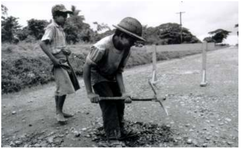
နအဖမှ အဓမ္မလုပ်အားစေခိုင်းခံနေရသော ပြည်သူများ