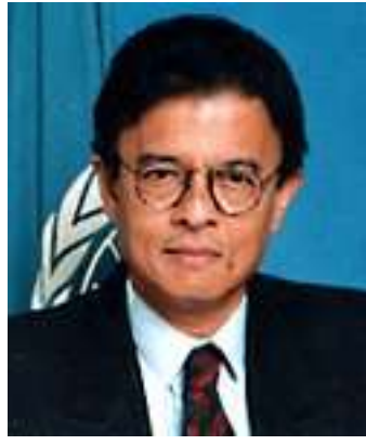
ကုလအထူးသံ ရာဇာလီအစ္စမေးလ်