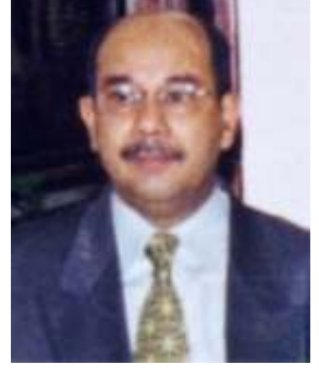
မလေးရှားနိုင်ငံခြားရေးဝန်ကြီး ဟာမစ်အယ်လ်ဘာ