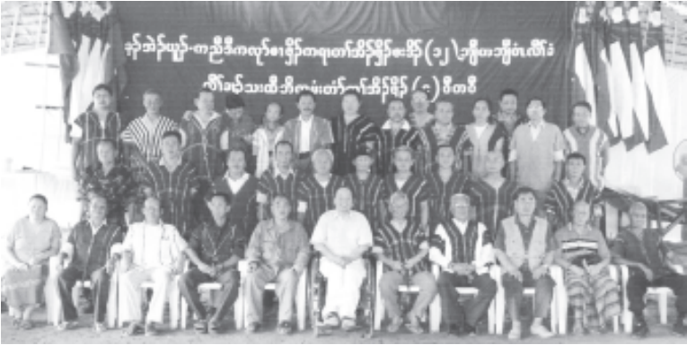
ကော့ဒ်ယူဗဟိုကော်မတီဝင်များအား အစည်းအဝေးအပြီးတွေ့မြင်ရစဉ်

မေလ (၁၇)နေ့မှ (၂၅)ရက်နေ့အထိ ကျင်းပခဲ့သော ကော့ဒ်ယူဗဟိုကော်မတီ အစည်းအဝေးမှနေ၍ (၁၃)ကြိမ်မြောက် ကော့ဒ်ယူကွန်ဂရက်ကို တနှစ်ရွှေ့ဆိုင်း လိုက်ကြောင်း ဆုံးဖြတ်လိုက်သည်ဟု သိရသည်။