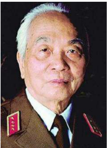
ဗိုလ်ချုပ်ကြီး ဗိုလ်ချုပ်ချုပ်

ဒီနံဘင်ဖူးသည် လာအိုနှင့် ဗီယက်နမ် နယ်စပ်ချိုင့်ဝှမ်းထဲ၌တည်ရှိပြီး ဗီယက်ကောင်းတပ်ဖွဲ့များက လာအိုနှင့် ဗီယက်နမ်