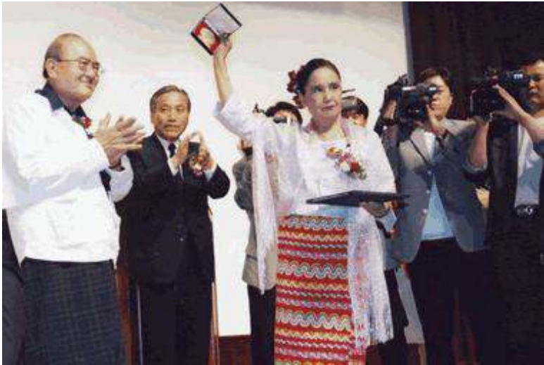
ဂွမ်ဂျူး လူ့အခွင့်အရေးဆုချီးမြှင့်ပွဲအခမ်းအနား၌ အန်အယ်ဒီအယ်လ်အေ ဥက္ကဋ္ဌနှင့် အတွင်းရေးမှူးတို့ ဆုလက်ခံရယူအပြီးတွေ့ရစဉ်

မေလ (၁၈)ရက်နေ့က တောင်ကိုရီးယားနိုင်ငံ ဆိုးလ်မြို့တွင်ကျင်းပသည့် ဂွမ်ဂျူး လူ့အခွင့်အရေးဆု ချီးမြှင့်ပွဲအခမ်းအနားသို့ ဆုရရှိသူ ဒေါ်အောင်ဆန်းစုကြည်ကိုယ်စား ရန်ကုန်တိုင်း ဆိပ်ကမ်းမြို့နယ် ပြည်သူ့