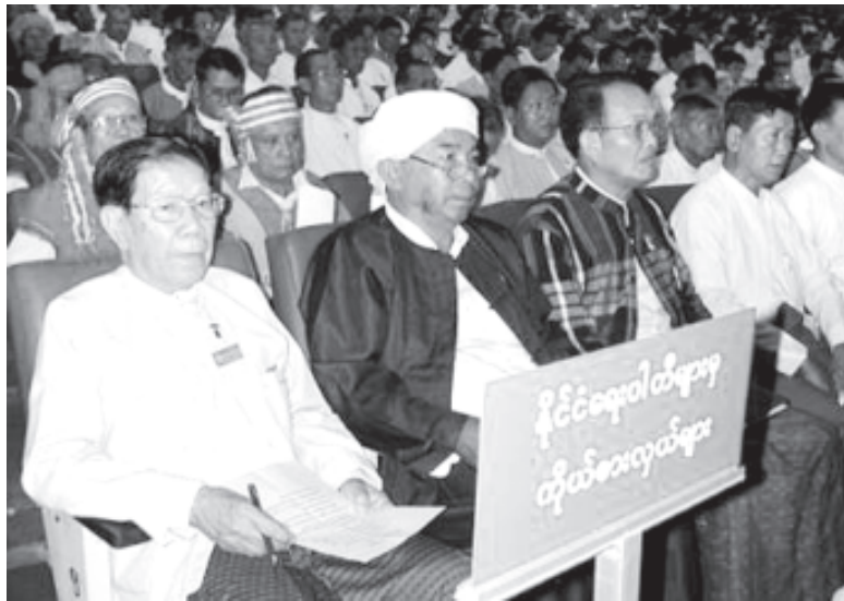
နအဖညီလာခံတက်ရောက်နေသော နိုင်ငံရေးပါတီများမှ ကိုယ်စားလှယ်များ

ကာကွယ်ရေးနှင့်လုံခြုံရေးကဏ္ဍ၊ နိုင်ငံခြားရေးကဏ္ဍ၊ ဘဏ္ဍာရေးနှင့်စီမံကိန်းကဏ္ဍ၊ စီးပွားရေးကဏ္ဍ၊ စိုက်ပျိုးရေးနှင့်မွေးမြူရေးကဏ္ဍ၊ စွမ်းအင်၊ လျှပ်စစ်၊ သတ္တုနှင့်သစ်တောကဏ္ဍ၊ စက်မှုလက်မှုကဏ္ဍ၊ ပို့ဆောင်ဆက်သွယ်ရေးကဏ္ဍ၊ လူမှုရေးကဏ္ဍ၊ စီမံခန့်ခွဲရေးကဏ္ဍနှင့် တရားစီရင်ရေးကဏ္ဍတို့ကို ဆွေးနွေးခဲ့ကြကြောင်း သိရသည်။ ❖