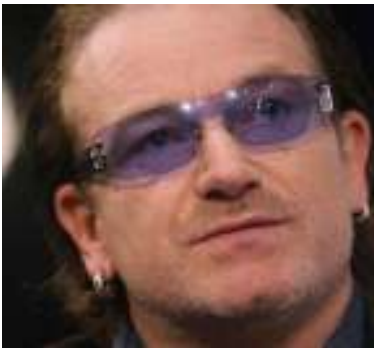
ကမ္ဘာ့နာမည်ကြီး ယူတူးတီးဝိုင်းမှ အဆိုတော် ဘိုနို

၎င်းက မြန်မာ့ဒီမိုကရေစီရေးနှင့် ပတ်သက်ပြီး ဗြိတိန်ဝန်ကြီးချုပ် တိုနီဘလဲက အတိုင်းအတာတခုအထိ လုပ်ဆောင်ခဲ့သော်