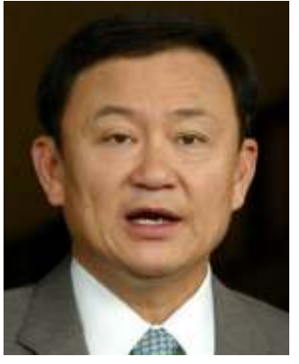
ထိုင်းနိုင်ငံ ဝန်ကြီးချုပ် ထပ်ဆင့်ရှိနှာဝပ်

အလားတူ မလေးရှား အတိုက်အခံပါတီခေါင်းဆောင် လင်မ်ကစီယမ်က မြန်မာနိုင်ငံကို အာမိတ်မရှိစေရန် အတိုက်အခံပေးရန် တောင်းဆိုသည်။ ၎င်းက နအဖ၏ ညီလာခံသည် အတုအယောင် အမျိုးသားညီလာခံသာဖြစ်သည်ဟု ဆိုခဲ့သည်။ ❖