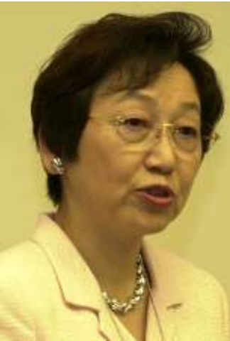
ဂျပန်နိုင်ငံခြားရေးဝန်ကြီး ကာဝါဂူချို