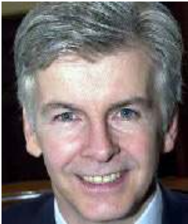
ဗြိတိန် နိုင်ငံခြားရေးရုံးဝန်ကြီး မိုက်အိုဘာရိုင်ယန်

စောစောပိုင်း ရက်များကလည်း ကွန်ဂရက်လွှတ်တော်အမတ် မစ်ချဲမက္ကောနား က မြန်မာ့အရေးကို ကုလသမဂ္ဂလုံခြုံရေးကောင်စီကိုင်တွယ်ဖြေရှင်းသင့်ပြီးဟု ပြောဆိုခဲ့သည်။ ❖