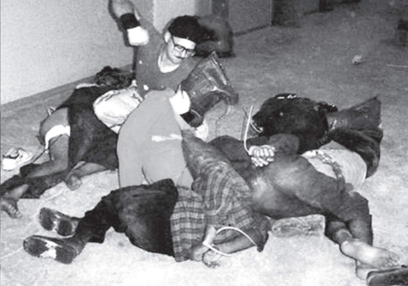
ရက်ရက်စက်စက် ကန်ကျောက်နှိပ်စက်နေပုံ