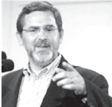
အမေရိကန်နိုင်ငံခြားရေးဝန်ကြီး ဂျာနာပြောခွင့်ရ ရပ်ချတ်ဘောက်ချာ