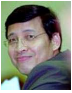
အင်ဒိုနီးရှားနိုင်ငံခြားရေးဝန်ကြီး ဟာဆမ်းဝီရာယုဒါ