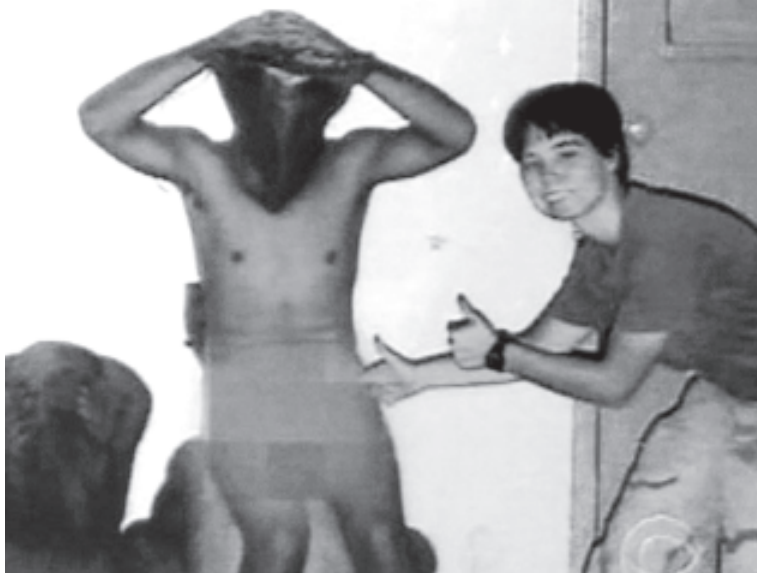
အဝတ်များချွတ်ပစ်ပြီး မဖွယ်မရာ ပြုလုပ်နေပုံ