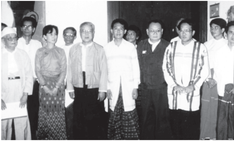
ဒေါ်အောင်ဆန်းစုကြည်အား တိုင်းရင်းသားခေါင်းဆောင်များနှင့်အတူတွေ့ရစဉ်