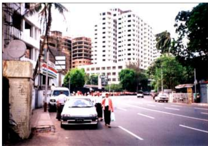
နှစ်ဆန်း(၁)ရက်နေ့က အင်းယားကန်တွင် ပြုလုပ်သော ငါးလွှတ်ပွဲဆီသို့ အဖွဲ့ချုပ်ဝင်များ ကမ္ဘာအေးဘုရားလမ်းအတိုင်း ချီတက်လာစဉ်

စစ်အာဏာရှင်တို့က မည်မျှပင် ဖိနှိပ်စေကာမူ အလံမလွှဲစတမ်းစိတ်ဓာတ်ဖြင့် အမျိုးသားဒီမိုကရေစီအဖွဲ့ချုပ် အဖွဲ့ဝင်များသည် အစွမ်းကုန်ကိုယ်ကျိုးစွန့် အနစ်နာခံလျက် ပိုင်းဖြတ်သောစိတ်ဓာတ်ဖြင့် ပြည်သူလူထုအကျိုးကို မဆုတ်မနစ် ကြိုးပမ်းလျက်ရှိသည်မှာ အနာဂတ် မျိုးဆက်သစ်များအတွက် ဂုဏ်ယူဖွယ်ရာ၊ အတုယူဖွယ်ရာ သမိုင်းဝင်ပုံရိပ်များဖြစ်သည်။ လမ်းဆုံလမ်းခွဲသို့ ရောက်ရှိနေသော ယနေ့ကာလ မြန်မာ့နိုင်ငံရေးအခြေအနေတွင် ဖိနှိပ်မှုကြီးလေလေ၊ တန်ပြန်တွန်းလှန်မှု ကြီးမားလေလေဖြစ်သည်ကို အမျိုးသားဒီမိုကရေစီအဖွဲ့ချုပ် အဖွဲ့ဝင်များ၏ လုပ်ရပ်က သက်သေထူနေသည်။ တဟုန်ထိုးအားကောင်းလာသော ပြည်တွင်းလှုပ်ရှားမှုများကို ပိုမိုသိမြင်နားလည်စေရန် ရည်ရွယ်၍ ဧပြီလအတွင်း အဖွဲ့ချုပ်အဖွဲ့ဝင်များ၏ လှုပ်ရှားမှုပုံရိပ်ကို မိုးကြိုးစာဖတ်ပရိတ်သတ်သို့ တင်ဆက်အပ်ပါသည်။ အယ်ဒီတာ အဖွဲ့