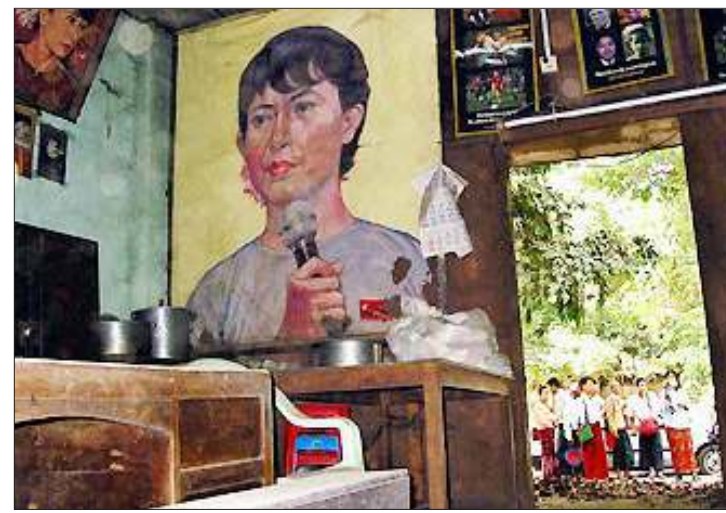
(၁၀)လကြာ မိတ်ပင်ထားခံရသော ဌာနချုပ်ရုံးသို့ အဖွဲ့ချုပ်ဝင်များ စုရုံးရောက်ရှိလာကြစဉ်