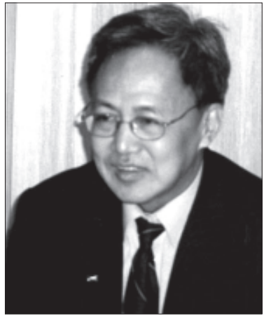
ဒေါက်တာစိန်ဝင်း

ထိုဆုံးဖြတ်ချက်များတွင် ဒေါ်အောင်ဆန်းစုကြည်အား ဆက်လက်ဖမ်းဆီးထားပြီး အဲဒီအယ်လ်ဒီကို ညီလာခံတက်ခွင့် မပေးပါက အီးယူအနေနှင့် အဓိကထွက်ကုန်များ တင်ပို့ခွင့် ပိတ်ပင်မည်ဖြစ်ကြောင်း၊ တဆက်တည်းတွင် ဤပြဿနာကို ကုလသမဂ္ဂလုံခြုံရေးကောင်စီထံ တင်ပြဆွေးနွေးရန်နှင့် လာမည့်