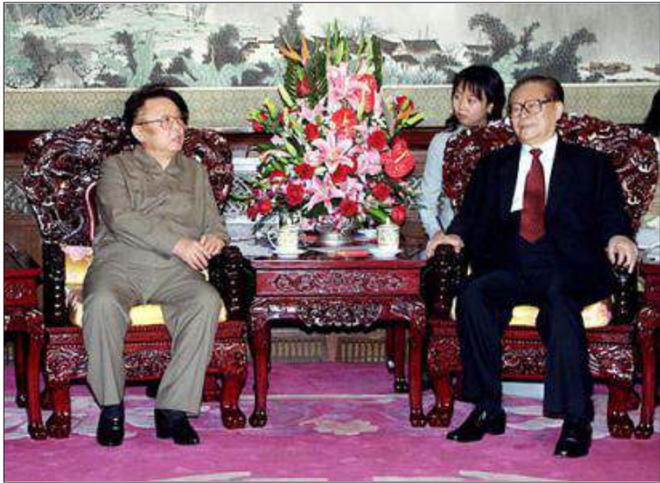
မြောက်ကိုရီးယားခေါင်းဆောင် ကင်ဂျူအိနှင့် တရုတ်သမ္မတဟောင်း ကျန်ဇီမင်း

အကြပ်အတည်းဖြေရှင်းရေးအား ရည် ရွယ်သည့် (၆)နိုင်ငံဆွေးနွေးပွဲအား နှစ်ဖက်