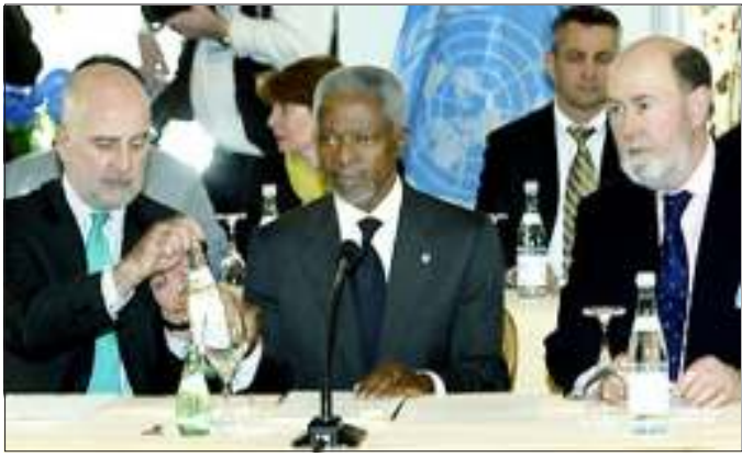
ဆိုက်ပရပ်စ်ပြန်လည်ပေါင်းစည်းရေးအစည်းအဝေး