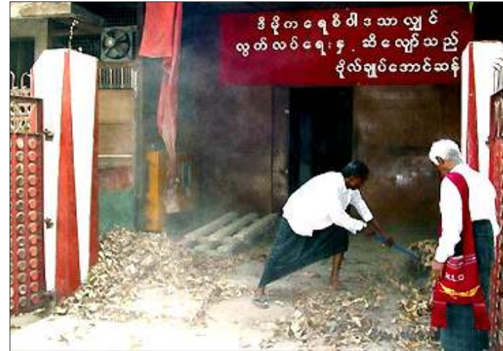
(၁၀)လကြာ မိတ်ပင်ထားခံရသော ဌာနချုပ်ရုံးအား အဖွဲ့ချုပ်ဝင်များမှ ဝိုင်းဝန်းရှင်းလင်းနေစဉ် (၁)

စစ်အာဏာရှင်တို့က မည်မျှပင် ဖိနှိပ်စေကာမူ အလံမလွှဲစတမ်းစိတ်ဓာတ်ဖြင့် အမျိုးသားဒီမိုကရေစီအဖွဲ့ချုပ် အဖွဲ့ဝင်များသည် အစွမ်းကုန်ကိုယ်ကျိုးစွန့် အနစ်နာခံလျက် ပိုင်းဖြတ်သောစိတ်ဓာတ်ဖြင့် ပြည်သူလူထုအကျိုးကို မဆုတ်မနစ် ကြိုးပမ်းလျက်ရှိသည်မှာ အနာဂတ် မျိုးဆက်သစ်များအတွက် ဂုဏ်ယူဖွယ်ရာ၊ အတုယူဖွယ်ရာ သမိုင်းဝင်ပုံရိပ်များဖြစ်သည်။ လမ်းဆုံလမ်းခွဲသို့ ရောက်ရှိနေသော ယနေ့ကာလ မြန်မာ့နိုင်ငံရေးအခြေအနေတွင် ဖိနှိပ်မှုကြီးလေလေ၊ တန်ပြန်တွန်းလှန်မှု ကြီးမားလေလေဖြစ်သည်ကို အမျိုးသားဒီမိုကရေစီအဖွဲ့ချုပ် အဖွဲ့ဝင်များ၏ လုပ်ရပ်က သက်သေထူနေသည်။ တဟုန်ထိုးအားကောင်းလာသော ပြည်တွင်းလှုပ်ရှားမှုများကို ပိုမိုသိမြင်နားလည်စေရန် ရည်ရွယ်၍ ဧပြီလအတွင်း အဖွဲ့ချုပ်အဖွဲ့ဝင်များ၏ လှုပ်ရှားမှုပုံရိပ်ကို မိုးကြိုးစာဖတ်ပရိတ်သတ်သို့ တင်ဆက်အပ်ပါသည်။ အယ်ဒီတာ အဖွဲ့