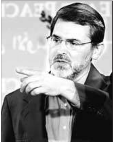
ရစ်ချစ်ဘောက်ချာ

အဖွဲ့ချုပ်ဥက္ကဋ္ဌ ဦးအောင်ရွှေနှင့် အတွင်းရေးမှူးဦးလွင်တို့ ဧပြီလ(၁၃)ရက်နေ့က ပြန်လည်လွှတ်မြောက်လာမှုကို ကြိုဆိုသော်လည်း မြန်မာနိုင်ငံ၏ ဖွဲ့စည်းအုပ်ချုပ်ပုံအခြေခံဥပဒေ အောင်မြင်စွာ ရေးဆွဲနိုင်ရေးအတွက် နိုင်ငံရေးပါတီများအားလုံးနှင့် တိုင်းရင်းသားများအားလုံး လွတ်လပ်စွာ ပါဝင်ရေးဆွဲခွင့်ရှိရမည်ဟု နိုင်ငံခြားရေးဌာန ပြောခွင့်ရပုဂ္ဂိုလ် ရစ်ချစ်ဘောက်ချာက ပြောဆိုလိုက်သည်။ အခြား မတရားဖမ်းဆီး