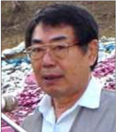
ပဒိုစောဒေးဗစ်ထောက

ဆက်လက်၍ နအဖ၏ ယခင်ဖိတ်ခေါ်ပြီး ပြန်လည်ကျင်းပမည့် အမျိုးသားညီလာခံနှင့် စပ်လျဉ်း၍ “မူလအတိုင်းပဲ ဆက်သွားမယ် ဆိုရင်တော့ အရင်ညီလာခံအတိုင်း ထောက်ခံ