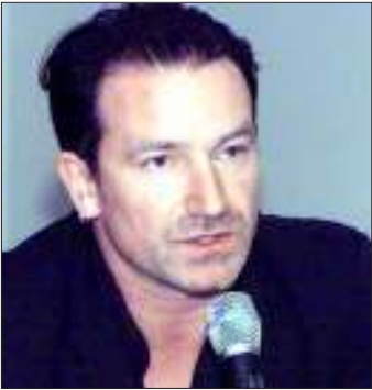
ကမ္ဘာကျော် ယူတူးအဆိုတော်ဘီနို