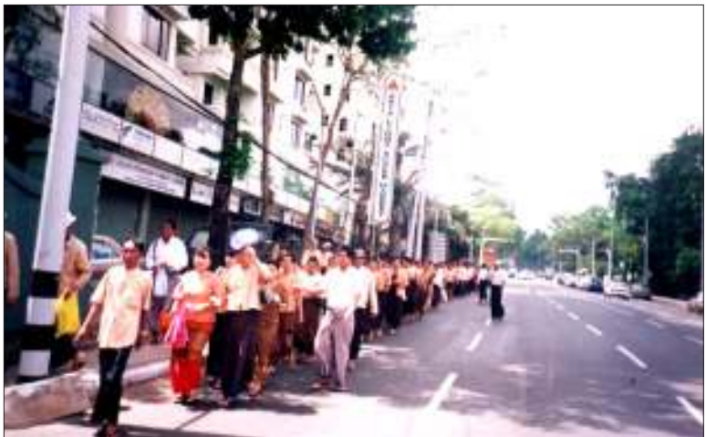
အဖွဲ့ချုပ်ဝင်များ ကမ္ဘာအေးဘုရားလမ်းတလျှောက် အင်းယားကန်သို့ ချီတက်လာစဉ်

ဘူး၊ တဖြည်းဖြည်းနဲ့ ခေတ်ကပြောင်းသွားပြီ။ အစိုးရအနေနဲ့ ဒါသတိထားဖို့ ကောင်းတယ်။ ဘယ်လိုလုပ်ရတိုင်ရရင် ကောင်းမလဲဆိုတာ စိတ်သဘောထားကြီးကြီးနဲ့ စဉ်းစားပြီးတော့ လုပ်ကြဖို့ ကောင်းတယ်”ဟု ငါးလွှတ်ပွဲနှင့် စပ်လျဉ်း၍ အခြေအနေအရပ်ရပ်ကို မှတ်ချက်ချပြောဆိုခဲ့သည်။