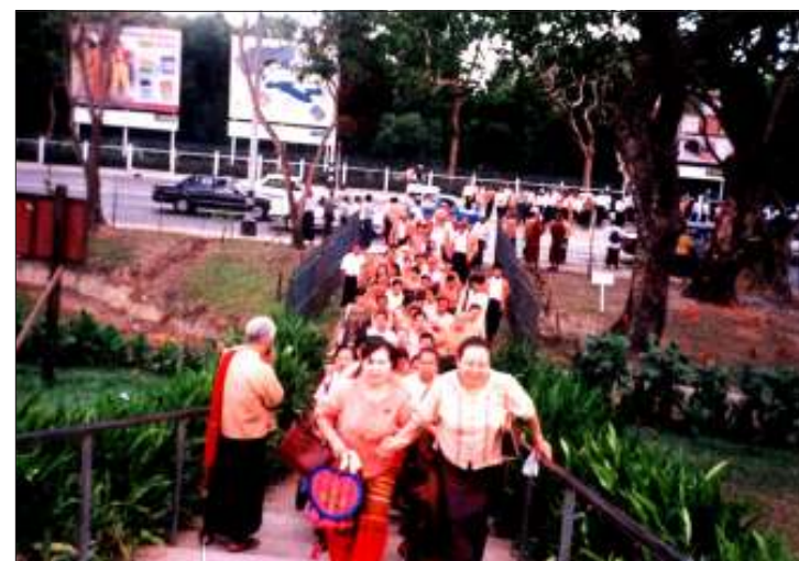
နှစ်ဆန်း(၁)ရက်နေ့က အင်းယားကန်တွင် ပြုလုပ်သော ငါးလွှတ်ပွဲသို့ ချီတက်လာသော အဖွဲ့ချုပ်ဝင်များ အင်းယားကန်သို့ ဝင်ရောက်လာစဉ်