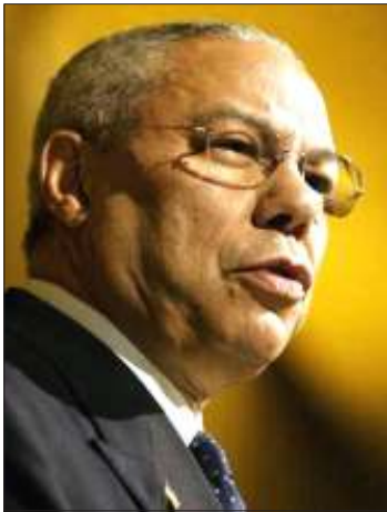
အမေရိကန်နိုင်ငံခြားရေးဝန်ကြီး ကောလင်းပါဝဲလ်

မတ်လ(၃၁)ရက်နေ့က အမေရိကန်လွှတ်တော်တွင် နအဖအစိုးရကို ဆက်လက်၍ စီးပွားရေးပိတ်ဆို့ အရေးယူရန် အထက်လွှတ်တော်အမတ် မစ်ချဲမဟောနယ်လ်၏ တင်ပြတောင်းဆိုချက်ကို အမေရိကန်နိုင်ငံခြားရေးဝန်ကြီး ကောလင်းပါဝဲလ်ကလည်း ထောက်ခံခဲ့ပြီး ဧပြီလလကုန်ပိုင်း၌ အမေရိကန်လွှတ်တော်ကလည်း ဆုံးဖြတ်