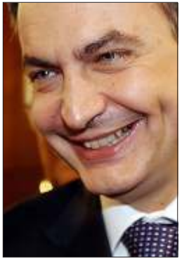
စပိန်ဝန်ကြီးချုပ်သစ် ဇာပါတာရို

အီရတ်မှ စပိန်စစ်သားများ အမြန်ရုပ်သိမ်းရန် မတ်လ(၁၄)ရက်နေ့ အထွေထွေရွေးကောက်ပွဲ၌ အနိုင်ရရှိခဲ့သည့် စပိန်ဝန်ကြီးချုပ်သစ် ဇာပါတာရို (၁၀)ရက်နေ့က အမိန့်ထုတ်ပြန်ခဲ့သည်။ ကုလသမဂ္ဂက စစ်ရေး၊ နိုင်ငံရေးအရ ထိန်းချုပ်နိုင်ခြင်း မရှိခဲ့လျှင် ၎င်းတို့၏ လုပ်ပိုင်ခွင့်ကုန်ဆုံးသည့် ဇွန်(၃၀)ရက်နေ့ နောက်ဆုံးထား၍ အီရတ်ရှိ စစ်သည်(၁၃၀၀)အား ပြန်လည်ခေါ်ယူရန် အာမခံခဲ့သည်။ နောက်ဆုံးမဲပေးပွဲ၌ စပိန်နိုင်ငံသား (၇၂)က စစ်သားများ ပြန်လည်ဆုတ်ခွာရန် ဖော်ပြခဲ့ကြသည်။ စပိန်အစိုးရအနေဖြင့် အီရတ်တည်ငြိမ်ရေး၊ ဒီမိုကရေစီ ပြုပြင်ပြောင်းလဲရေး၊ နယ်မြေတည်တံ့ခိုင်မြဲရေးနှင့် ပြန်လည်တည်ဆောက်ရေးတို့ကို ဆက်လက်ကူညီထောက်ပံ့သွားမည်။ ထို့ပြင် ကုလသမဂ္ဂနှင့် ဥရောပသမဂ္ဂတို့၏ အီရတ်နိုင်ငံ ပြန်လည်နာလန်ထူရေး ကြိုးပမ်းမှုများကိုလည်း ကူညီသွားမည်ဖြစ်သည်။ ❖