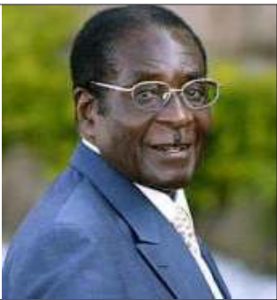
ဇင်ဘာလအတွက် ဇာဘတ်မူဂါဘီ