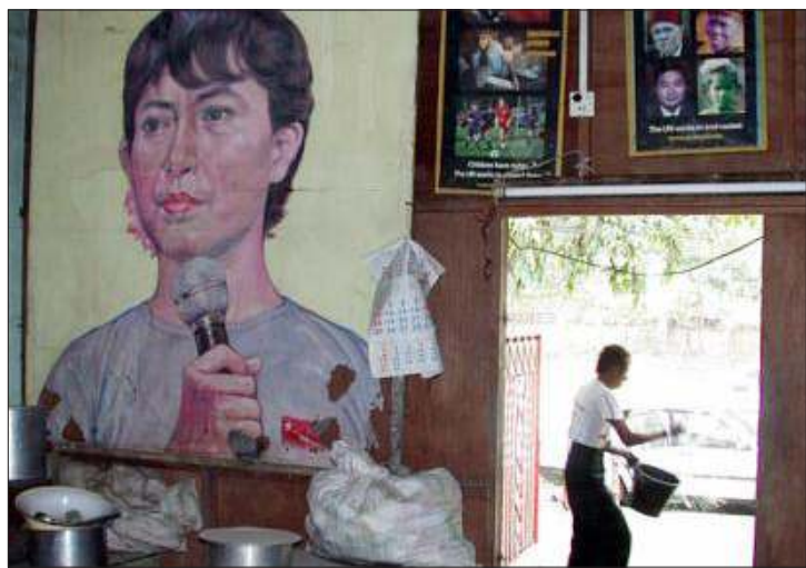
(၁၀)လကြာ မိတ်ပင်ထားခံရသော ဌာနချုပ်ရုံးအား အဖွဲ့ချုပ်ဝင်များမှ ဝိုင်းဝန်းရှင်းလင်းနေစဉ် (၃)