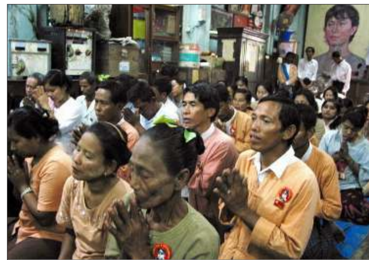
အဖွဲ့ချုပ် အဖွဲ့ဝင်များ ဒေါ်အောင်ဆန်းစုကြည်နှင့် နိုင်ငံရေးအကျဉ်းသားများ လွတ်မြောက်ရေး ဆုတောင်းဆန္ဒပြနေစဉ်