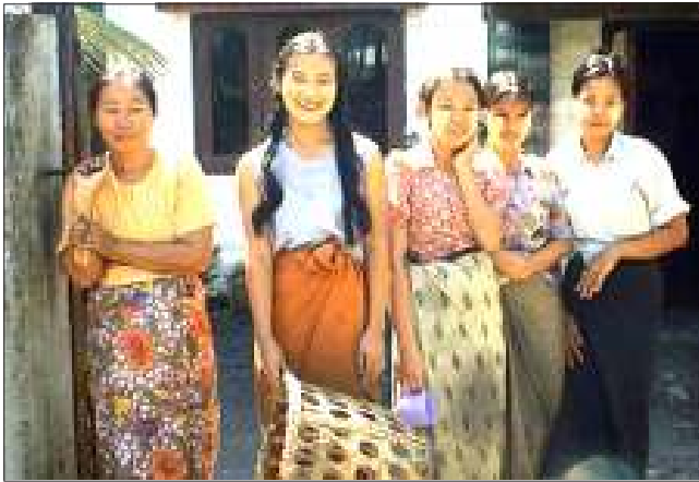
မြန်မာနိုင်ငံတွင်း စက်ရုံတစ်ခုမှ အလုပ်သမားများ

အလုပ်သမားများအပေါ် ဖိနှိပ်မှု အဆိုးဝါးဆုံး နိုင်ငံများတွင် မြန်မာနိုင်ငံအပါအဝင် တရုတ်နှင့် ဆော်ဒီ အာရေဗီးယားနိုင်ငံတို့ ပါဝင်ကြောင်း လူ့အခွင့်အရေးကာကွယ် စောင့်ကြည့်ရေးအဖွဲ့ကြီး၏ အစီရင်ခံစာ၌ ဖော်ပြထားကြောင်း သတင်းရရှိသည်။ ❖