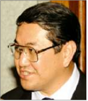
မစ္စတာစူရကီရတ်

ထိုဆွေးနွေးပွဲသို့ နအဖနိုင်ငံခြားရေး ဝန်ကြီး ဦးဝင်းအောင်အား ဖိတ်ကြားထား သော်လည်း စိတ်ပါဝင်စားဟန် မရှိကြောင်း