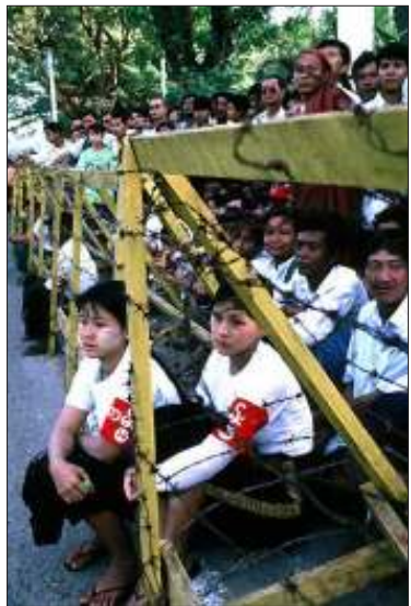
အဖွဲ့ချုပ်အမျိုးသမီးအဖွဲ့ဝင်များ

အောင်ဆန်းစုကြည်နှင့် နိုင်ငံရေးအကျဉ်း သားများအား လွှတ်ပေးရန် နာဖဝန်ကြီး ချုပ်ထံ စာရေးတောင်းဆိုထားကြောင်း သိရှိရသည်။ ထို့ပြင် တနင်္သာရီတိုင်း ထားဝယ်မြို့ နယ် အဖွဲ့ချုပ်ဝင်များကလည်း ယနေ့အမျိုး သမီးထုကြီး၏ ငြိမ်းချမ်းရေးနှင့် ဒီမိုကရေစီ ရေးစွမ်းဆောင်ချက်များကို ကမ္ဘာကြီးက မျက်ကွယ်ပြု၍မရတော့ကြောင်း၊ ထို့ကြောင့် မြန်မာအမျိုးသမီးထုကြီးအနေဖြင့် မြန်မာ လူ့ဘောင်ငြိမ်းချမ်းရေး၊ ဖွံ့ဖြိုးတိုးတက်ရေး အတွက် အစွမ်းကုန် ကြိုးစားဆောင်ရွက်ရန် နှင့် အဖွဲ့ချုပ်ခေါင်းဆောင် ဒေါ်အောင်ဆန်း စုကြည် အပါအဝင် နိုင်ငံရေးအကျဉ်းသား အားလုံး ခြွင်းချက်မရှိ အမြန်ဆုံး ပြန်လွတ် ကာ နိုင်ငံတော်ကြီး ငြိမ်းချမ်းစည်ပင်လာ အောင် လွတ်လပ်စွာ လှုပ်ရှားခွင့်ပြုရန် မတ် လ (၈)ရက်နေ့က ကြေညာချက် ထုတ်ပြန် တောင်းဆိုခဲ့သည်။ ရခိုင်ပြည်နယ်တခုလုံးကိုယ်စား အဖွဲ့