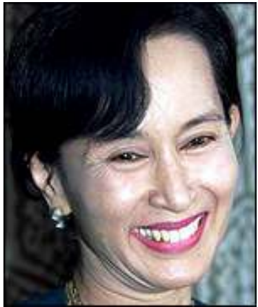
မြန်မာဒီမိုကရေစီခေါင်းဆောင် ဒေါ်အောင်ဆန်းစုကြည်

မြန်မာဒီမိုကရေစီခေါင်းဆောင်၊ အမျိုးသားဒီမိုကရေစီအဖွဲ့ချုပ် အထွေထွေအတွင်းရေးမှူး ဒေါ်အောင်ဆန်းစုကြည်အား တောင်