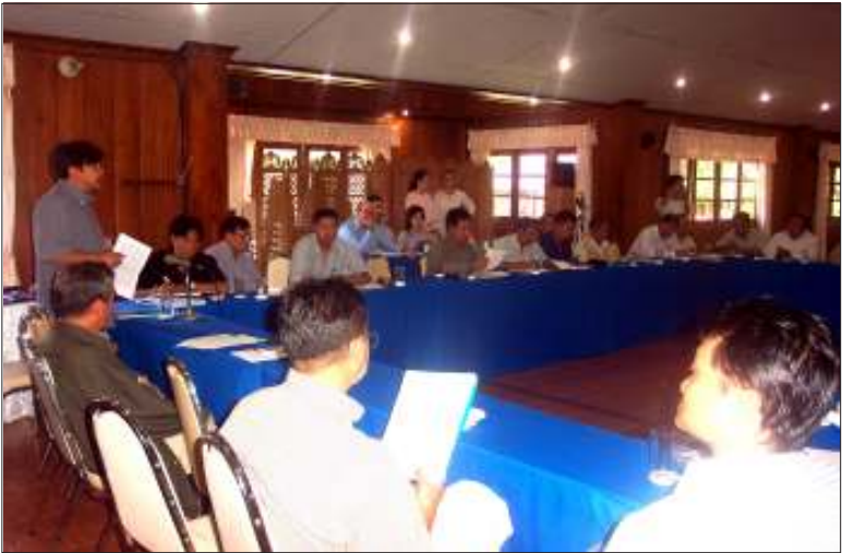
အလုပ်ရုံဆွေးနွေးပွဲကျင်းပနေစဉ်

“ကျနော်တို့ အခြေအနေက လမ်းဆုံလမ်းခွကဲ့ ရောက်နေပြီ။ အခုကာလမှာ အင်အားစုအားလုံးပါနိုင်တဲ့ လုပ်ငန်းအစီအစဉ်တွေ ချမှတ်ဖို့ဟာ အရေးကြီးပါတယ်”ဟု မိုးကြိုးသတင်းစဉ်သို့ ထုတ်ဖော်ပြောကြားခဲ့သည်။❖