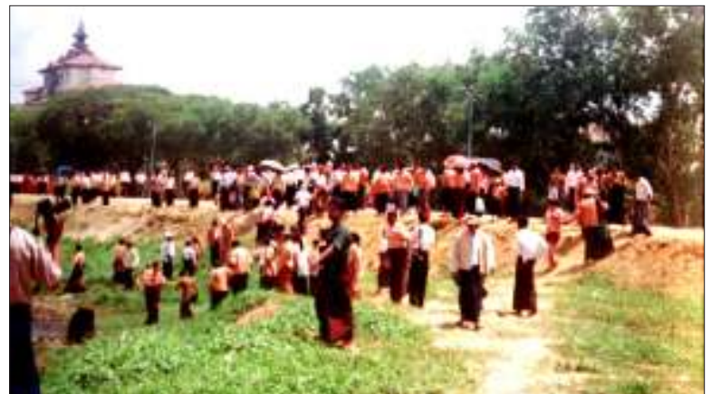
အင်းယားကန်အတွင်း ငါးလွှတ်ပွဲကျင်းပနေစဉ်