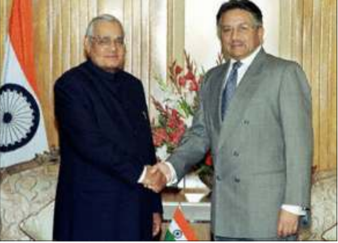
အိန္ဒိယဝန်ကြီးချုပ်နှင့် ပါကစ္စတန်သမ္မတ