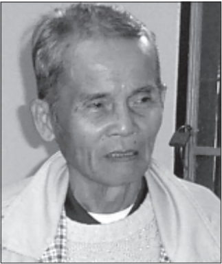
မန်းအောင်သန်းလေး