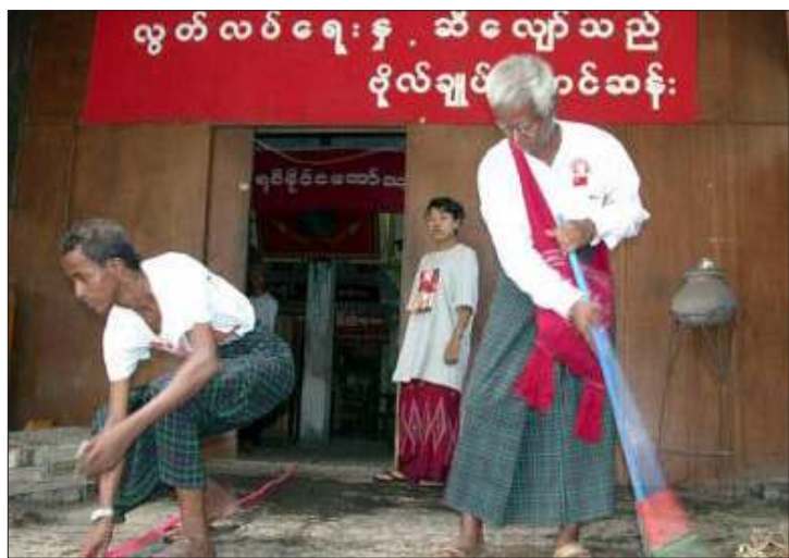
(၁၀)လကြာ မိတ်ပင်ထားခံရသော ဌာနချုပ်ရုံးအား အဖွဲ့ချုပ်ဝင်များမှ ဝိုင်းဝန်းရှင်းလင်းနေစဉ် (၂)