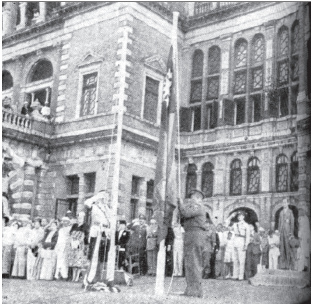
ဘုရင်ခံအိမ် လွတ်လပ်ရေးနေ့ အလံ အပြောင်းအလွဲ အခမ်းအနား