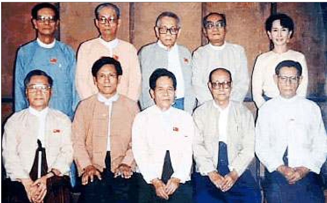
ဒုတိယအမျိုးသားလွတ်မြောက်ရေးတိုက်ပွဲ ဦးဆောင်အဖွဲ့ဝင်များ

ငါတို့နိုင်ငံတော်ကြီးသည် မည်သူတို့တယောက် တဖွဲ့တည်း၏ အမွေအနှစ်မဟုတ်၊ မည်သူတို့တယောက် တဖွဲ့တည်း၏ ပုဂ္ဂလိကပိုင်ပစ္စည်းမဟုတ်၊ မည်သူတို့တယောက် တဖွဲ့တည်းက ချုပ်ကိုင်အနိုင်ယူ အကျိုးခံစားအပ်သော နိုင်ငံမဟုတ်၊ အတိတ်ကာလကလည်းကောင်း၊ ယခုမျက်မှောက်တွင်လည်းကောင်း၊ နောင်လာလတ္တံ့သော အနာဂတ်ကာလ၌လည်းကောင်း၊ ငါတို့ပြည်ထောင်စုကြီးအတွင်း၌ မှီတင်းနေထိုင်ကြသော ကြီးငယ်ဝေးနီး ကျားမ မခြား သစ္စာတော်ခံ နိုင်ငံသားဟူသရွေ့ ဒို့၏ အမွေအနှစ်ပိုင် ပစ္စည်းအကျိုးခံစားရာ ဖြစ်သည်ဟူသော လူ့ဘာသာ လူတရားနှင့်အညီ ကမ္ဘာဦးကာလ လူတို့၏ စည်းရုံးမှု၌ လူအပေါင်းတို့၏ သဘောဆန္ဒအရ လူ့အဖွဲ့အစည်း၏ အကျိုးကို ကောင်းစွာ ဆောင်ရွက်နိုင်အံ့သောပုဂ္ဂိုလ်ကို ရွေးကောက်၍ သမ္မတ တင်မြှောက်ကြသော မဖောက်မပြန်မစွန့်မငြိ ပကတိသန့်ရှင်း ဖြူစင်သောမူလ လူဝါဒနှင့် လျော်ညီစွာ စည်းကမ်းဥပဒေ သေချာထင်ရှားစွာ ပိုင်းခြားသတ်မှတ် တူညီသောတရား၊ တူညီသောအခွင့်အရေး၊ တူညီသော အဆင့်အတန်းအားဖြင့် ကမ္ဘာအရှည်တည်စိမ့်ငှာ လူအပေါင်းတို့၏ ဆန္ဒသာလျှင် အဓိကဖြစ်သော သမတမြန်မာနိုင်ငံတော်တည်တံ့မှု သမ္မတအဖြစ်ကို လက်ဆုပ်ကိုင် ငါတို့အပိုင်ရပြီ။