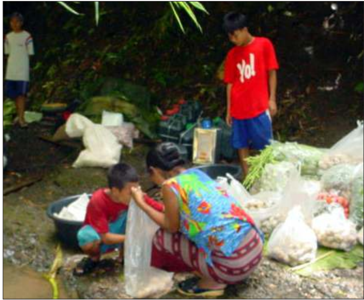
နယ်စပ်သို့ ထွက်ပြေးရောက်ရှိလာသော ကရင်ဒုက္ခသည်တခု

ထားသဖြင့် ယခုထိ တပ်မဟာဌာနချုပ်တွင်းသို့ နာမည်တပ်များ ဝင်ရောက်နိုင်ခြင်း မရှိသေးကြောင်း တပ်မဟာ(၇)အထူးတပ်ရင်း (၁၀၁) တပ်ရင်းမှူး ဒုဗိုလ်မှူးကြီးဖောဒိုက ဆိုသည်။ ယခုလို နာမည်တပ်များ ကေအန်ယူထိန်းချုပ်နယ်မြေကို (၂)လကျော် ထိုးစစ်ဆင်ခဲ့သည့်အတွက် လွန်ခဲ့သောလအတွင်းက မဲပလက်ဒေသရှိ ရွာသား(၁၀၀)ကျော် ထိုင်းမြန်မာနယ်စပ်သို့ ထွက်ပြေးတိမ်းရှောင်လာခဲ့ရသည်။ အဆိုပါ ထွက်ပြေးလာသူများအား ထိုင်းမြန်မာနယ်စပ်ရှိ ဒုက္ခသည်စခန်းများသို့ ပို့ဆောင်ပေးနိုင်ခဲ့သော်လည်း အချို့ ကျန်ရှိနေသူများမှာ ထိုင်းနယ်စပ်ဂိတ်များ၏ တင်းကျပ်သည့် ပိတ်ဆို့မှုများကြောင့် အခက်ကြုံနေရဆဲဖြစ်သည်ဟု ကရင်ဒုက္ခသည် စောင့်ရှောက်ရေးအဖွဲ့ (ကေအာရ်စီ)က ပြောကြားခဲ့သည်။ ❖