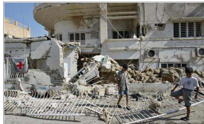
အီရတ်ရှိ အပြည်ပြည်ဆိုင်ရာ ကြက်ခြေနီအဖွဲ့၏ ဌာနချုပ်အား ဗုံးခွဲခံရပြီးတွေရစဉ်

အပြည်ပြည်ဆိုင်ရာ ကြက်ခြေနီအဆောက်အဦးအား တိုက်ခိုက်မှုတွင် (၁၂)ဦး သေဆုံးပြီး ဤအထဲတွင် အီရတ်လုံခြုံရေး ရဲ(၂)ဦးနှင့် အနီးအနားမှ ဖြတ်သွားသူများ ပါဝင်သည်ဟု ပြောရေးဆိုခွင့်ရသူက ပြောဆိုခဲ့သည်။ သေဆုံးသူများထဲတွင် ဗုံးများ တင်ဆောင်မောင်းနှင်လာသည့် ကားမှ ကားမောင်းသူပါသည်ဟု မျက်မြင်သက်သေတဦးက ပြောကြားခဲ့သည်။ ဤဗုံးခွဲမှုသည် ရက်စက်မှုကြီးဖြစ်သည်ဟု အပြည်ပြည်ဆိုင်ရာ ကြက်ခြေနီအဖွဲ့မှ ပြောကြားလိုက်သည်။ ❖