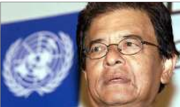
ကုလသမဂ္ဂ အထူးကိုယ်စားလှယ် မစ္စတာရာဇာလီအစ္စမေးလ်