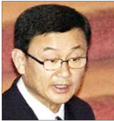
ထိုင်းဝန်ကြီးချုပ် မစ္စတာထပ်ဆင့်ရှိနာဝပ်