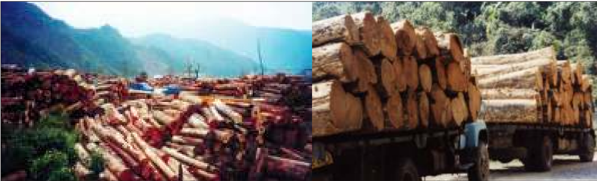
ကချင်ပြည်နယ်ဒေသအတွင်း ခုတ်ယူထုတ်နေသော မြန်မာ့အစိုးရတန်သစ်များ

၎င်းက “မြန်မာနိုင်ငံက သစ်တောပြုန်းတီးမှုအကြောင်း ကျနော်တို့ ပြောနေတာက သစ်တောထိန်းသိမ်းဖို့တခုတည်းမဟုတ်ပါဘူး။ မြန်မာ့သဘာဝအရင်းအမြစ်ပြုန်းတီးရတာဟာ လက်ရှိနိုင်ငံရေး ပဋိပက္ခတွေကြောင့်ဖြစ်ပါတယ်။ ကျနော်တို့ အဓိကမီးမောင်းထိုးပြချင်တာက ကချင်ပြည်နယ်က သစ်ပင်တွေ ခုတ်လိုက်လို့ ကချင်ဒေသခံတွေဘာမှ အကျိုးမဖြစ်လာတဲ့ကိစ္စပါ။ ဒီကိစ္စကို အချိန်မနှောင်းခင် ဖြေရှင်းဖို့ လိုမယ်လို့ ယူဆပါတယ်”ဟု သတိပေး ပြောကြားသွားသည်။ ❖