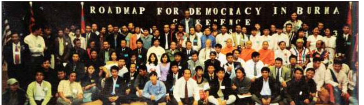
ဖိုဝိန်းညီလာခံသို့ တက်ရောက်လာကြသူများ

ထိုအစည်းအဝေးသို့ မြန်မာနိုင်ငံ အမျိုးသားညွန့်ပေါင်းအစိုးရနှင့် မြန်မာနိုင်ငံ အမျိုးသားကောင်စီတို့မှ ခေါင်းဆောင်များ၊ ပြည်ပရောက်အတိုက်အခံများ၊ ဩစတြေး လျ၊ ဂျပန်၊ ထိုင်း၊ ကနေဒါနိုင်ငံတို့မှ မြန်မာ့ အရေးလှုပ်ရှားနေသူများနှင့် အမေရိကန် ပြည်ထောင်စုတဝှမ်းရှိ ဒီမိုကရေစီအဖွဲ့ အစည်းများမှ စုစုပေါင်း လူ(၃၀၀)ကျော်တို့ တက်ရောက်ခဲ့ကြကြောင်း သိရသည်။