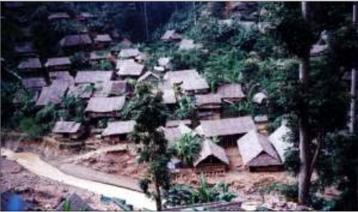
ပြောင်းရွှေ့ခံရတော့မည့် မဲခေါင်ခါး (ခေါ်) ဇလားဒုက္ခသည်စခန်း တစ်ဝိုက်တဒေသ