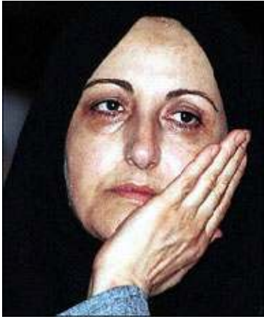
ငြိမ်းချမ်းရေးနိုဗယ်လ်ဆုရှင် ရှီရင်အက်ဘာဒီ