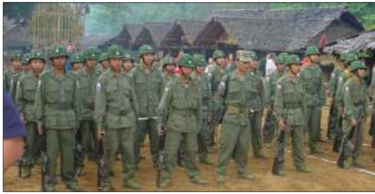
အမျိုးသားလွတ်မြောက်ရေးတိုက်ပွဲဝင်နေသော ကေအဲန်အယ်လ်အေ တပ်သားများ