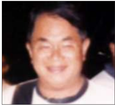
ရှမ်းပြည်တပ်မတော်မှ ဗိုလ်ချုပ်ဆောင်

ဤအဖွဲ့(၃)ဖွဲ့သည် မဆလ စစ်အစိုးရ လက်ထက်မှစ၍ ယနေ့ထိတိုင် တိုင်းရင်း သားအခွင့်အရေးများအတွက် အနှစ်(၃၀) ကျော်ကြာ လက်တွဲတိုက်ပွဲဝင်ခဲ့သည့် တိုင်း