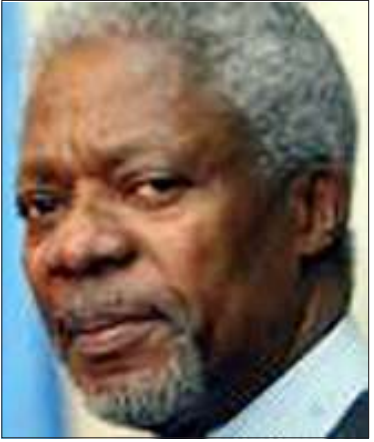
မစ္စတာကိုဖီအာနန်

၂၀၀၆ ခုနှစ်မတိုင်မီ မြန်မာနိုင်ငံကို ဒီမိုကရေစီစနစ် ပြောင်းလဲရေးအတွက် ကုလသမဂ္ဂအဖွဲ့ကြီးနှင့်အတူ ကမ္ဘာ့နိုင်ငံများအားလုံး လက်တွဲဆောင်ရွက်ကြရန် အထွေထွေအတွင်းရေးမှူးချုပ် ကိုဖီအာနန်က ကုလသမဂ္ဂအထွေထွေညီလာခံကြီးသို့ စက်တင်ဘာ(၃၀)ရက်နေ့က ပေးပို့ခဲ့သည့် အစီရင်ခံစာတွင် တိုက်တွန်းလိုက်သည်။