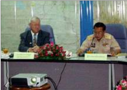
မယ်တော်ဆေးခန်းသို့ ရောက်ရှိလာသော အမေရိကန်သံအမတ်ကြီးနှင့် ထိုင်းအာဏာပိုင်တဦး

မယ်တော်ဆေးခန်းကို ဒေါက်တာစင် သီယာမောင်က ၁၉၈၉ ခုနှစ်တွင် စတင် ထူထောင်ခဲ့ပြီး နောက်ပိုင်းတွင် ကူးစက် ရောဂါ ကာကွယ်ရေးလုပ်ငန်းများကို ထိုင်း ကျန်းမာရေးဌာနနှင့် ပူးပေါင်း၍ ဆောင် ရက်နေလျက်ရှိသည်။ ❖