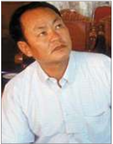
ဝ တပ်ဖွဲ့ခေါင်းဆောင် ပေါက်ယူချန်း

အဆိုပါပုဂ္ဂိုလ်၏ ပြောဆိုချက်ကို ကိုးကား၍ ဩဂုတ်လ (၁၃)ရက်နေ့ထုတ်သည့်နေ့ရင်းသတင်းစာ၏ သတင်းတပုဒ်တွင် နိုင်ငံတကာဖိအားများ အာရုံပြောင်းစေရေးအတွက် နအဖက 'ဝ' တပ်ဖွဲ့ကို တိုက်ခိုက်ရန် ပြင်ဆင်နေကြောင်း ရေးသားထားပြီး နအဖအဖွဲ့အတွင်း အပစ်အခတ်ရပ်စဲရေးအဖွဲ့များကို ထောက်ခံအားပေးနေသည့် ဗိုလ်ချုပ်ခင်ညွန့်နှင့် သဘောထားတင်းမာသူ နအဖ ဒုတိယအကြီးအကဲ ဒုဗိုလ်ချုပ်မှူးကြီးမောင်အေးအကြား စိတ်ဝမ်းကွဲမှုများ ရှိနေသောကြောင့် 'ဝ'တပ်ဖွဲ့ကို တိုက်ခိုက်ရန် ပြင်ဆင်နေခြင်းဖြစ်ကြောင်း ထုတ်ဖော်ရေးသားခဲ့သည်။ ထိုသတင်းနှင့်ပတ်သက်၍ အမည်မဖော်လိုသူ နအဖအရာရှိတဦးက မဟုတ်မမှန်ကြောင်း ငြင်းဆိုခဲ့ကြောင်း ရန်ကုန်အခြေစိုက် အေပီသတင်းက ဆိုသည်။ သို့ရာတွင် 'ဝ'တပ်ဖွဲ့နှင့် နအဖအကြား ဆက်ဆံရေးအခြေအနေကိုမူ အဆိုပါ အရာရှိက ထုတ်ဖော်ပြောဆိုခဲ့ခြင်း မရှိခဲ့ကြောင်း သိရသည်။ ❖