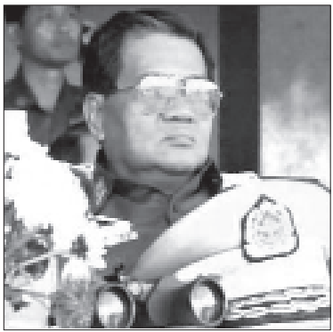
နအဖ ဗိုလ်ချုပ်မှူးကြီး သန်းရွှေ