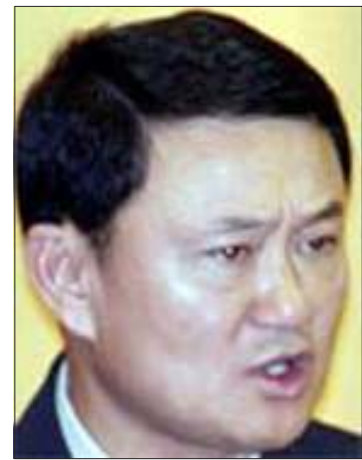
ထိုင်းဝန်ကြီးချုပ် ထပ်ဆင့်ရှိနာဝပ်ထရာ

လွတ်မြောက်သွားခဲ့သည်ဟု ထိုင်းရဲတပ်ဖွဲ့အကြီးအကဲက ဆိုသည်။