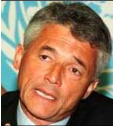
ဗဲးပေါက်ကွဲမှုတွင် သေဆုံးခဲ့ရသော မစ္စတာ ဗီရိုရာဒီမိလ်လို

အီရတ်ရှိ အမေရိကန်စစ်တပ်များ၏ ပြောဆိုချက်အရ ယခုတိုက်ခိုက်မှုသည် မူဆလင်စစ်ဆွေးကြွများနှင့် ဆက်သွယ်မှုစွာခံများက စီစဉ်ခဲ့ခြင်းဖြစ်နိုင်ကြောင်း၊