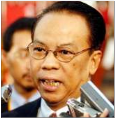
နအဖ နိုင်ငံခြားရေးဝန်ကြီး ဦးဝင်းအောင်

ဆက်လက်၍ မိမိတို့အစိုးရက မြေအောက်လှုပ်ရှားသူနှင့် အကြမ်းဖက်သမား (၁၂)ဦးကို ဖော်ထုတ်ဖမ်းဆီးထားကြောင်း၊ မိမိတို့သည် မင်းမဲ့စရိုက်အပြုအမူများကြောင့် တိုင်းပြည်တစ်ဝှမ်း ပြိုကွဲပျက်စီးသွားသည့်အခြေအနေမျိုးကို ကြုံတွေ့ခဲ့ဖူးသည့်အတွက် ထိုအခြေအနေမျိုး ထပ်မံ မဖြစ်