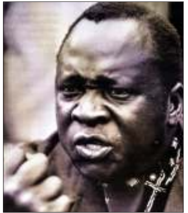
ယူဂန္ဒာနိုင်ငံ အာဏာရှင်ဟောင်း အိုင်ဒီအာမင်

နီးယားသို့ ဝင်ရောက်ကျူးကျော်ရာမှ ယင်းတပ်များနှင့် ပြည်ပရောက်ယူဂန္ဒာ အတိုက်အခံများက ၎င်းအား ပြန်လည်ဖြုတ် ချခဲ့ကြရာ ၁၉၇၉ ဧပြီလတွင် ဆော်ဒီ အာရေဗီးယားနိုင်ငံသို့ ထွက်ပြေးခဲ့ရသည်။ အစ္စလာမ်ဘာသာ ကိုးကွယ်သူ အိုင်ဒီအာမင် အား ဆော်ဒီအစိုးရက ဘာသာရေးအခွင့် အရေးတရပ်အဖြစ် ခိုလှုံခွင့်ပေးခဲ့သည်။ အာဒီအာမင်သည် ၎င်း၏ ဇနီး(၄)ဦးနှင့် အတူ သေဆုံးချိန်အထိ ဆော်ဒီအာရေဗီး ဗီးယားနိုင်ငံမှာပင် ဆော်ဒီအစိုးရ၏ ထောက်ပံ့စရိတ်ဖြင့် မထင်မရှား နေထိုင် သွားခဲ့သည်။ ❖