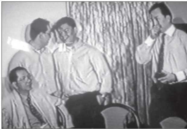
မြန်မာပြည်ကို ဆင်းရဲတွင်းထဲ ပို့ဆောင်ခဲ့သူ ဦးနေဝင်း၏ သားမက်နှင့် မြေး(၃)ဦး

၁၉၆၂ ခု မတ်လ စစ်အာဏာသိမ်းပွဲမှ ၁၉၈၀ ခုအထိ တိုင်းပြည်ကို အာဏာစက်