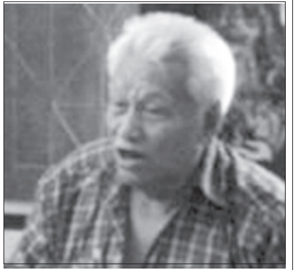
ကရင်အမျိုးသားလွတ်မြောက်ရေးတပ်မတော် ဗဟိုစစ်ဦးစီးဌာနချုပ် ဗိုလ်ချုပ်ကြီးတာမလာဘော

ဗိုလ်ချုပ်အောင်ဆန်း စတင်ဖွဲ့စည်းတည်ထောင်တဲ့ ဗမာ့တပ်မတော်ဟာ တိုင်းပြည်ကာကွယ်ရေးတာဝန်ကို သီးသီးသန့်သန့် လုပ်ဆောင်ဖို့ ရည်ရွယ်ချက်ဖြင့် ဖွဲ့စည်းတည်ထောင်ထားတာဖြစ်သည်။ ထိုအချိန်မှာ ဗမာ့တပ်မတော်ဟာ ပြည်သူအတွက် ဖွဲ့စည်းတည်ထောင်ထားတဲ့အတွက် ပြည်သူရဲ့ ချစ်ခင်လေးစားမှုကို ခံခဲ့ရတယ်။ တပ်က နိုင်ငံရေးမှာ ဝင်ရောက်စွက်ဖက်တာ ဗိုလ်ချုပ်အောင်ဆန်း လုံးဝ မလိုလားပါ။ တကယ်လည်း ဒီအတိုင်းပဲ ဖြစ်ရမယ်။ ဗိုလ်ချုပ်အောင်ဆန်းကိုယ်တိုင်က တပ်ကနေထွက်ပြီး နိုင်ငံရေးသို့ ခြေစုံပစ်ဝင်ရောက်တာဟာ တပ်ဆိုသည်မှာ နိုင်ငံရေးနဲ့ ကင်းကင်းရှင်းရှင်းနေရမယ်လို့ မီးမောင်းထိုးပြလိုက်ခြင်းဖြစ်တယ်။