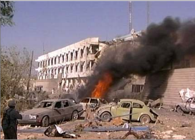
ကုလသမဂ္ဂ ရုံးချုပ် အသေခံပုံးခွဲထရပ်ကားဖြင့် တိုက်ခိုက်ခံရပြီးနောက်

ယခု တိုက်ခိုက်မှုသည် ဂျမားအစ္စလာမ် မိရာ အကြမ်းဖက်အဖွဲ့အနေဖြင့် အင်ဒို နီးရှားနိုင်ငံတွင် ခိုင်ခိုင်မာမာ အမြစ်တွယ်နေ သည်ကို ပြသနေပြီး ဒေသတခုလုံးကို ခြိမ်း ခြောက်နေသည်ဟု လေ့လာသုံးသပ်သူများ ကဆိုသည်။ ဤတိုက်ခိုက်မှုသည် နောက်ထပ် တိုက်ခိုက်လာနိုင်မှုများအတွက်ရှေ့ပြေးအဖြစ် ပြသနေပြီး အရှေ့တောင်အာရှဒေသတွင်းရှိ မည်သည့်နေရာတွင်မဆို အထူးသဖြင့် ထိုင်း နိုင်ငံ၊ ဖိလစ်ပိုင်နိုင်ငံ၊ မလေးရှားနိုင်ငံနှင့် စင်္ကာပူနိုင်ငံတို့၌ ဂျမားအစ္စလာမ်မိရာအဖွဲ့ က တိုက်ခိုက်နိုင်သည်ဆိုသည်ကို ပြသနေ ကြောင်း သုံးသပ်နေကြသည်။ ❖