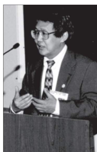
ပြည်ထောင်စုမြန်မာနိုင်ငံ အမျိုးသားညွန့်ပေါင်းအစိုးရ ဝန်ကြီးချုပ် ဒေါက်တာစိန်ဝင်း

မြန်မာနိုင်ငံညွန့်ပေါင်းအစိုးရ ဝန်ကြီး ချုပ်ဒေါက်တာစိန်ဝင်းက “ထိုင်းနိုင်ငံ တနိုင်ငံ ထဲနှင့် ပြီးပြည့်စုံခြင်း မရှိဘဲ၊ နိုင်ငံတကာက ပါဝင်ပတ်သက်ရန် လိုကြောင်း၊ ကုလသမဂ္ဂ နှင့် နိုင်ငံတကာက ထောက်ခံမှုရပြီး ပေါ် ပေါက်လာသည့်အခြေအနေမျိုးကိုသာ လိုလား ကြောင်း၊ Road Map တွင် အဆင့်၊ အချိန် ကန့်သတ်မှုရှိသည့် အဆင့်အမျိုးမျိုးထားရန် လိုအပ်ကြောင်း၊ ထိုကာလများအတွင်း အမျိုး သားရင်ကြားစေ့ရေး၊ နိုင်ငံရေးအကျဉ်း သားများအားလုံး လွှတ်ပေးရေးနှင့် နိုင်ငံ ရေး လွတ်လပ်မှုများ အကောင်အထည်