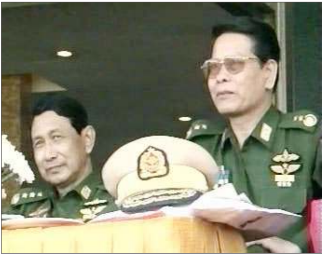
ဗိုလ်ချုပ်ကြီးနှစ်ဦး အာဏာလွန်ဆွဲပွဲ ဘယ်သူအနိုင်ရမလဲ

ယခုလို ဘိန်းချက်စခန်းများအား ဝင်ရောက်တိုက်ခိုက်ခြင်းသည် နအဖအနေဖြင့် မူးယစ်ဆေးဝါးနှိမ်နင်းရေးကြောင်း ဝါဒဖြန့်ရန် ဟန်ပြလုပ်ဆောင်သည့် သဘောသဘာဝဖြစ်ပြီး နိုင်ငံတကာဖိအားများ အာရုံပြောင်းသွားစေရေးကို အဓိကထား လုပ်ဆောင်ခြင်းဖြစ်ကြောင်း ရှမ်းသတင်းအေဂျင်စီ