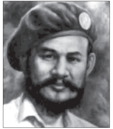
ကရင်အမျိုးသားအာဇာနည်ခေါင်းဆောင် စောဘဦးကြီး