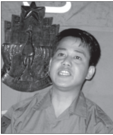
မြန်မာနိုင်ငံလုံးဆိုင်ရာ ကျောင်းသားများ ဒီမိုကရက်တစ်တပ်ဦး ဥက္ကဋ္ဌ ကိုသံခဲ

မြန်မာနိုင်ငံလုံးဆိုင်ရာ ကျောင်းသားများ ဒီမိုကရက်တစ်တပ်ဦးမှ ဦးစီးကျင်းပသော ရှစ်လေးလုံးလူထုအရေးတော်ပုံ (၁၅)နှစ်မြောက် အခမ်းအနားများကို မကဒတဗဟိုဌာနချုပ် (ဒေါင်းဝွင်)နှင့် တပ်ရင်းတပ်ဖွဲ့အသီးသီးတွင် ကျင်းပခဲ့ကြပါသည်။ တပ်ရင်း (၈) ဝါးရုံပင်စခန်းတွင် ကျင်းပသည့် အခမ်းအနားသို့ မကဒတ တပ်ဖွဲ့ဝင်ရဲဘော်များ၊ မဟာမိတ် ကရင်အမျိုးသားအစည်းအရုံး (KNU)မှ ခေါင်းဆောင်များ၊ ရဲဘော်များ၊ ဗကသများအဖွဲ့ချုပ် (နိုင်ငံခြားရေး ကော်မတီ)၊ နိုင်ငံရေးအကျဉ်းသားများ ကူညီစောင့်ရှောက်ရေးအသင်း (မြန်မာနိုင်ငံ)တို့မှ ကိုယ်စားလှယ်များ တက်ရောက်ကြသည်။ အဆိုပါအခမ်းအနားတွင် “ရှစ် လေးလုံးစိတ်ဓာတ်ဆိုတာ ဘာလဲ”၊ “ရှစ်လေးလုံးစိတ်ဓာတ်ကို ဘာကြောင့် ဆွဲကိုင်တိုက်ပွဲဝင်သွားသင့်ပါသလဲ”ဆိုသော အမြင်များနှင့် “ယနေ့ကာလသည် ရှစ်လေးလုံးစိတ်ဓာတ်နှင့် သမိုင်းအစဉ်အလာ ကြီးမားသော လူထုတိုက်ပွဲဝင်စိတ်ဓာတ်ကို ဒုတိယအကြိမ် ပြသ