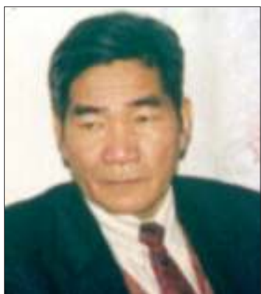
ပြည်ထောင်စုမြန်မာနိုင်ငံအမျိုးသားကောင်စီ နှုခင်း (၂) ဦးတင်အောင်