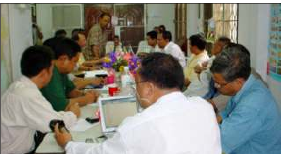
ပြည်ထောင်စုမြန်မာနိုင်ငံအမျိုးသားကောင်စီနှင့် ပြည်ထောင်စုမြန်မာနိုင်ငံအမျိုးသားညွန့်ပေါင်းအစိုးရတို့ ပူးတွဲအစည်းအဝေး ကျင်းပနေစဉ်

ရောက်ကြပြီး လက်ရှိဖြစ်ပေါ်နေသော မြန် မာနိုင်ငံရေးအခြေအနေများကို သုံးသပ် လျက် NCUB-NCGUB ပူးတွဲလုပ်ငန်းစဉ် များကို ချမှတ်ခဲ့ကြသည်ဟု သတင်းရရှိသည်။