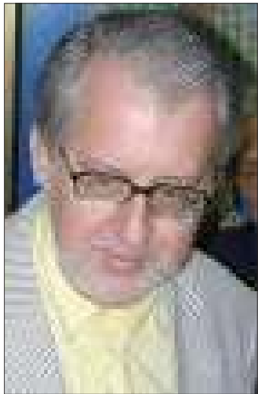
မြန်မာပြည်ဆိုင်ရာ ကုလသမဂ္ဂ လူ့အခွင့်အရေးဆိုင်ရာ အထူးသံတမန် မစ္စတာပေါ်လိုဆာဂျီပင်ဟေးရိုး