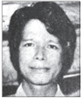
ဦးတင်မြင့်