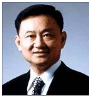
ထိုင်းဝန်ကြီးချုပ် မစ္စတာထပ်စင်ရှီနာပါထရာ

“ငြိမ်းချမ်းရေးနဲ့ပတ်သက်ပြီး ပြောနေတဲ့ နိုင်ငံတနိုင်ငံအနေနဲ့ တကယ်တော့ လက်တွေ့မှာ မလုပ်ပါဘူး”ဟု အမေရိကန် ဦးဆောင်ဆင်နွှဲသော အီရတ်စစ်ပွဲအား ကိုးကားရည်ညွှန်းပြီး ပြောဆိုခဲ့သည်။