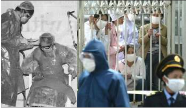
ဆာစ် (SARS) ရောဂါ ကူးစက်ခံရသူများကို ဆေးရုံများ၌ အခြားသူများအား ကူးစက်ပျံ့နှံ့မှုမှ ကာကွယ်နိုင်ရန် တသီးတခြားထားသည်