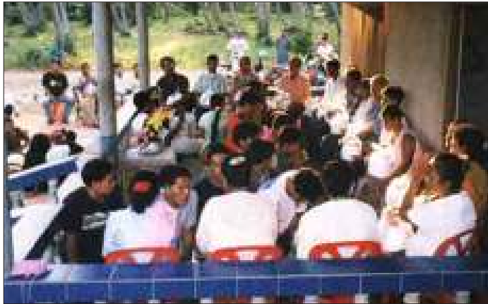
ထိုင်းနိုင်ငံ ပကျွတ်ခရိုင်ရှိ မြန်မာအလုပ်သမားများ၏ ပထမအကြိမ်မြောက် သက်ကြီးပူဇော်ပွဲ

သက်ကြီးပူဇော်ပွဲတွင် အဖိုးအဖွား (၁၇)ဦးတို့အား ခေါင်းလျှော်ပေးခြင်း၊ လက် သည်းခြေသည်းများ ညှပ်ပေးခြင်း စသည့် အမှုတို့ကို မြန်မာ့ရိုးရာဓလေ့ထုံးစံနှင့်အညီ ပြုလုပ်ပေးခဲ့ကြသည်။ အဖိုးအဖွားတို့အဆို အရ ထိုင်းနိုင်ငံသို့ရောက်သည်မှာ (၁၀)နှစ် ကျော်ပြီဖြစ်သော်လည်း ဒီဒေသရောက်မှ သက်ကြီးပူဇော်ပွဲဆိုသည်ကို အခုလို လုံးဝ မမျှော်လင့်ဘဲ ကြုံရသည့်အတွက် ဝမ်းသာ ပီတိဖြစ်ရကြောင်း ပြောကြားသွားကြသည်။ အဆိုပါအခမ်းအနားသို့ မြန်မာနိုင်ငံ သား (၅၀၀)ကျော် ပါဝင်ဆင်နွှဲခဲ့ကြရာ မြန်မာသင်္ကြန်အစားအစာ စတုဒီသာ စုံလင် စွာဖြင့် နှစ်ဆကျေးဇူးခံကြောင်း သိရသည်။ ❖ ❖ ❖