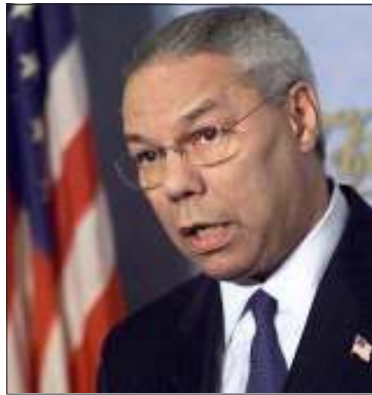
အပေရိကန်နိုင်ငံခြားရေးဝန်ကြီး မစ္စတာ ကောလင်းပါဝယ်လ်

မစ္စတာပါဝယ်လ်က စစ်အစိုးရ၏ သဘောထားကို ပြောင်းလဲရန် ခက်ခဲကြောင်း၊