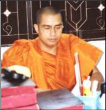
မြန်မာနိုင်ငံလုံးဆိုင်ရာ ရဟန်းပျိုသမဂ္ဂ ဥက္ကဋ္ဌ အရှင်ဓမ္မစာရ