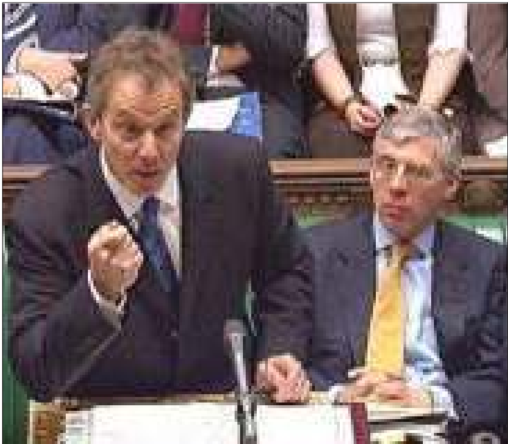
ဗြိတိန်ဝန်ကြီးချုပ် မစ္စတာတိုနီဘလဲနှင့် နိုင်ငံခြားရေးဝန်ကြီး မစ္စတာဂျက်စထရော