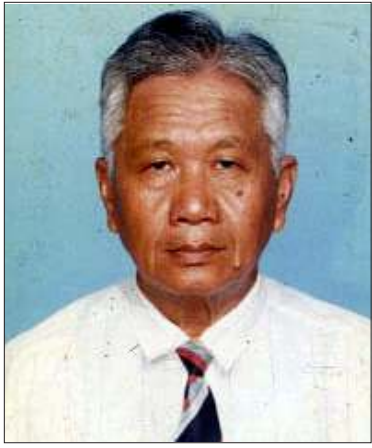
ရေဆင်း စိုက်ပျိုးရေးတက္ကသိုလ် အငြိမ်းစားကျောင်းအုပ်ကြီး ပါမောက္ခချုပ်ဟောင်း အစာငတ်ခံဆန္ဒပြ