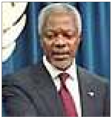
ကုလသမဂ္ဂ အထွေထွေအတွင်းရေးမှူးချုပ် မစ္စတာကိုဖီအာနန်