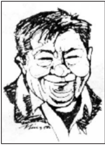
ကဗျာဆရာကြီးတင်မိုး

□ ဆရာကြီးအနေနဲ့ ၁၉၈၈ ခုနှစ် ဒီမိုကရေစီရေးလှုပ်ရှားမှုကနေစပြီး နိုင်ငံရေးလှုပ်ရှားမှုတွေမှာ ကဗျာဆရာကြီးတင်မိုး အဖြစ် ပါဝင်လာခဲ့တာဆိုတော့ ပြည်တွင်း ပြည်ပက လတ်တလော တောင်းဆိုနေတဲ့ အမျိုးသားရပ်ကြားစေရေး တွေ့ဆုံဆွေးနွေးပွဲ ပြုလုပ်ရေးဆိုတဲ့ နိုင်ငံရေးအခြေအနေတွေအပေါ်မှာရော ဆရာ့အမြင် ဘယ်လိုရှိပါသလဲ။