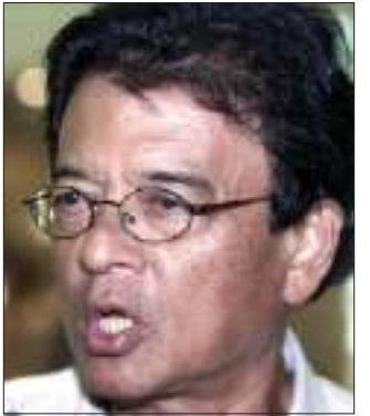
မစ္စတာရာဇာလီအစ္စမေးလ်

နှင့် မြန်မာနိုင်ငံအပေါ် လူသားချင်းစာနာသည့် အကူအညီများပေးရေးကိစ္စများကို အဓိက ဆွေးနွေးလိုသည့် ဆန္ဒရှိသည်ဟု ဆိုသည်။ ရာဇာလီက မိမိအနေဖြင့် မြန်မာနိုင်ငံသို့ အမြန်ဆုံး သွားရောက်နိုင်ရန် အရေးတကြီးလိုအပ်နေကြောင်း ယခုလ (၂၁)ရက်နေ့က ထုတ်ဖော်ပြောဆိုခဲ့သော်လည်း နအဖက အကြောင်းအမျိုးမျိုးပြကာ ခရီးစဉ်ကို ရက်ရွှေ့ဆိုင်းနေခဲ့သဖြင့် “ဒီအဖြစ်ကတော့ အနုတ်လက္ခဏာဆောင်သည့် ဦးတည်ဘက်ကို သွားနေသည့်သဘောဖြစ်ကြောင်း” ပြောဆိုခဲ့သည်။ သို့ရာတွင် ရာဇာလီက နအဖ အနေဖြင့် ပြုပြင်ပြောင်းလဲမှုများအတွက် နှောင့်နှေးကြန့်ကြာနေရန် တမင်လုပ်ဆောင်နေကြောင်း ပြောဆိုချက်မှများကို ပယ်ချခဲ့ပြီး “ကျနော်အနေနဲ့ အစိုးရကို ပြောချင်တာကတော့ သူတို့တတွေ လူသိရှင်ကြား ပြောဆိုထားတဲ့အတိုင်း သူတို့တွေဟာ နောက်ဆုံး