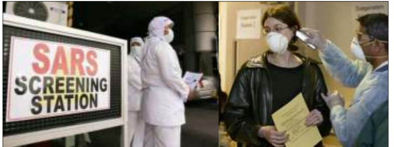
ခရီးသွားလုပ်ငန်းများနှင့် လေဆိပ်များတွင် ဆားစံရောဂါ စစ်ဆေးရေးဌာနများ ထားရှိသည်

ဆောင်များက အချက် (၆)ချက်ပါ စီမံကိန်းအား မူကြမ်း ချမှတ်ခဲ့ကြကြောင်းလည်း သိရှိရသည်။ နောက်ဆုံးသတင်းများအဆိုအရ တရုတ်ပြည်တွင် ယခုအခါ ဆားစံရောဂါကြောင့် သေဆုံးသူပေါင်းမှာ (၁၄၈)ဦးရှိပြီဖြစ်ပြီး ရောဂါဖြစ်ပွားသူပေါင်းမှာ (၃,၃၀၀) ရှိကြောင်းနှင့် ကျန်းမာရေးကျွမ်းကျင်သူများ အဆိုအရ တရုတ်ပြည်တွင် ယခုစာရင်းထက် မြင့်မားနိုင်ကြောင်း ခန့်မှန်းပြောဆိုနေကြသည်။