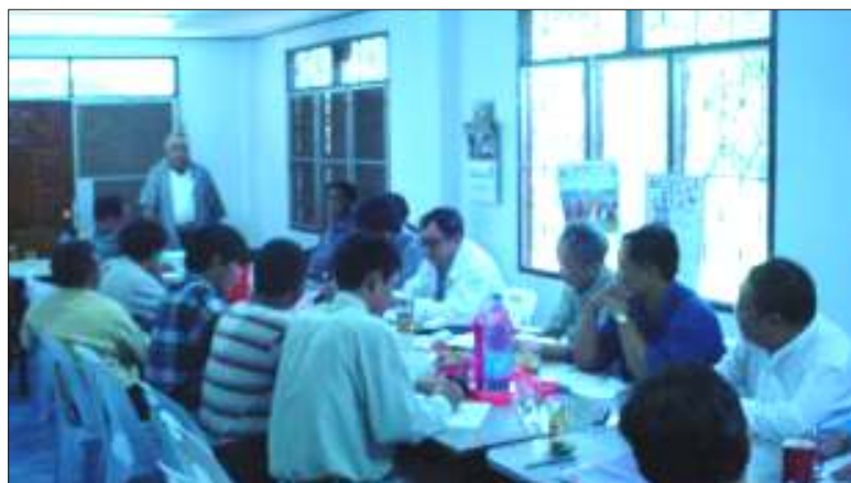
အစည်းအဝေးဖွင့်ပွဲနေ့တွင် သဘာပတိ ဗိုလ်ချုပ်ကြီးစောဘိုမြမှ အဖွင့်မိန့်ခွန်းပြောကြားနေစဉ်

ထိုအစည်းအဝေးသို့ ပြည်ထောင်စု မြန်မာနိုင်ငံအမျိုးသားကောင်စီ (NCUB)၊ SSA (ရှမ်းပြည်တောင်ပိုင်း)၊ တိုင်းရင်းသား ပေါင်းစုံသွေးစည်းညီညွတ်ရေးနှင့် ပူးပေါင်း ဆောင်ရွက်မှုကော်မတီ (ENSCC)၊ ပြည် ထောင်စုတိုင်းရင်းသားလူမျိုးများဒီမိုကရေစီ အဖွဲ့ချုပ်-လွတ်မြောက်နယ်မြေ (UNLD-LA)၊ ပြည်ထောင်စုမြန်မာနိုင်ငံအမျိုးသား ညွန့်ပေါင်းအစိုးရ(NCGUB)၊ ကရင်နီအမျိုး