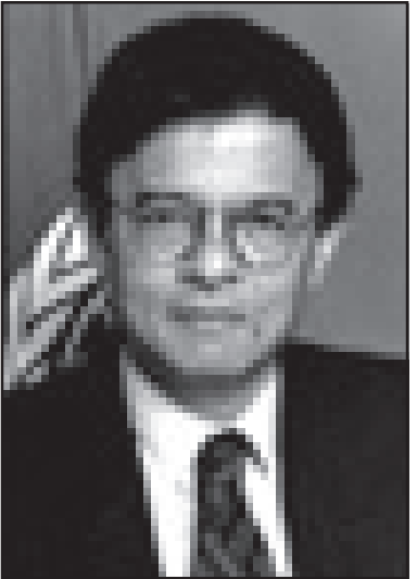
ကုလသမဂ္ဂ အထူးကိုယ်စားလှယ် မစ္စတာ ရာဇာလီ အစွဲမေး

နှစ်ပေါင်းများစွာ စစ်အုပ်ချုပ်ရေးစနစ် ကျင့်သုံးခဲ့သော မြန်မာနိုင်ငံတွင် (၂၂)နှစ်အတွင်း ဒီမိုကရေစီစနစ် ပြန်လည်ထွန်းကားလာနိုင်ကြောင်း မြန်မာ့အရေး ကြားဝင်ဆောင်ရွက်ပေးနေသူ ကုလသမဂ္ဂ အထူးကိုယ်စားလှယ် မစ္စတာ ရာဇာလီအစွဲမေးလ်က ဒေါ်အောင်ဆန်းစုကြည် နေအိမ်အကျယ်ချုပ်က လွတ်မြောက်လာသည်မှာပင် ခန့်မှန်းပြောဆိုလိုက်ပါသည်။ ဒေါ်အောင်ဆန်းစုကြည် ပြန်လည်လွတ်မြောက်လာမှုသည် စစ်အုပ်စုနှင့် အမျိုးသားဒီမိုကရေစီအဖွဲ့ချုပ်တို့အကြား တွေ့ဆုံဆွေးနွေးနေသည့် အမျိုးသားပြန်လည်သင့်မြတ်ရေးလုပ်ငန်းစဉ်ကို အရှိန်မြှင့်တင်ပေးသလို ဖြစ်လိမ့်မည်ဟုလည်း မစ္စတာရာဇာလီက ပြောဆိုခဲ့ပါသည်။