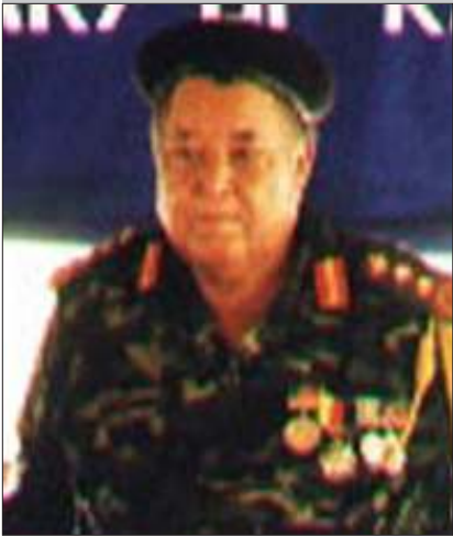
ဗိုလ်ချုပ်ကြီး ဇော်ဘိုမြ ဒုဥက္က ကရင်အမျိုးသားအစည်းအရုံး

“သူလွတ်လာတာ ကောင်းတာပေါ့။ နိုင်ငံရေးလုပ်ပိုင်ခွင့် ရှိတာပေါ့။ အဲဒါကို ကရင်အမျိုးသားအစည်းအရုံးအနေနဲ့ ထောက်ခံပါတယ်။ ဒါပေမယ့် သူလွတ်လာတာ လုပ်ပိုင်ခွင့် ဘယ်လောက်ရှိတယ် ဆိုတာ ကျနော်တို့က ကြည့်ရအုံးမယ်။ အဓိကက ဒေါ်အောင်ဆန်းစုကြည်ကို အာဏာလွှဲပြောင်းရေး လုပ်မလား၊ မလုပ် ဘူးလား။ မလုပ်ဘူးဆိုရင်တော့ သိပ်ပြီးတော့ အကျိုးမရှိဘူး။ မလုပ်ဘူးဆိုရင် စစ်အာဏာရှင်ကပဲ တိုင်းပြည်ကို ဆက်လက်ပြီး အုပ်ချုပ်နေမှာပဲလို့ ကျနော်တို့က ထင်တယ်။ ဒါပေမယ့် ခုနေ့တော့ သေသေချာချာတော့ မပြောတတ်ဘူး။ ကျနော်တို့ ဆက်လက်ကြည့်ရအုံးမယ်။”