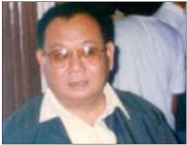
ရှမ်းတိုင်းရင်းသားများဒီမိုကရေစီအဖွဲ့ချုပ် ဥက္ကဋ္ဌ ဦးခွန်ထွန်းဦး

သုံးပွင့်ဆိုင်ဆွေးနွေးပွဲအဆင့်သို့ တက် လှမ်းနိုင်ပါက တိုင်းရင်းသားလူမျိုးစုများ၏ သဘောထားအမြင်များ တထပ်တည်း တူညီ နိုင်ရေးအတွက် စစ်အုပ်စုအနေဖြင့် လက်နက် ကိုင်အဖွဲ့အစည်းများနှင့် အပစ်အခတ်ရပ်စဲ ထားရန် လိုအပ်ကြောင်း ရှမ်းအမျိုးသားဒီမို ကရေစီအဖွဲ့ချုပ် (SNLD) ဥက္ကဋ္ဌ ဦးခွန် ထွန်းဦးက မေလ(၁၅)ရက်နေ့တွင် ထုတ် ဖော်ပြောကြားလိုက်သည်။