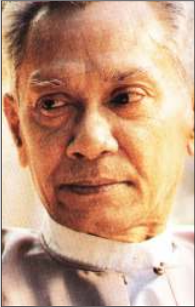
ဆရာ တက္ကသိုလ်ဘုန်းနိုင် (ဒေါ်) ဦးခင်မောင်တင့်

၈၈၈၈ ပြည်သူ့အရေးတော်ပုံကြီးတွင် ဒီမိုကရေစီကို ထောက်ခံသည့်အနေဖြင့် ရန်ကုန်တက္ကသိုလ်ဓမ္မာရုံကြီး၌ မိန့်ခွန်းပြောကြားခဲ့သူ၊ ထိုမိန့်ခွန်းကြောင့် စစ်အုပ်စုက ရန်ညှိုးဖွဲ့၍ ပညာရေးတက္ကသိုလ် ပါမောက္ခချုပ်အဖြစ်မှ နှုတ်ပယ်ခြင်းခံခဲ့ရသူ၊ လှပစွဲနှစ်စွာ အဖွဲ့အနွဲ့များဖြင့် စာဖတ်ပရိသတ်တို့၏ အာရုံကို ဖမ်းစားဆွဲဆောင်နိုင်ခဲ့သူ အမျိုးသားစာပေဆုရ စာရေးစာရာကြီး တက္ကသိုလ်ဘုန်းနိုင်သည် မေလ(၁၀)ရက် သောကြာနေ့ နံနက် (၇း၀၀)နာရီအချိန်တွင် သံလျင်မြို့ရှိ ၎င်း၏နေအိမ်တွင် ကွယ်လွန်သွားပြီဖြစ်ကြောင်း သတင်းရရှိသည်။