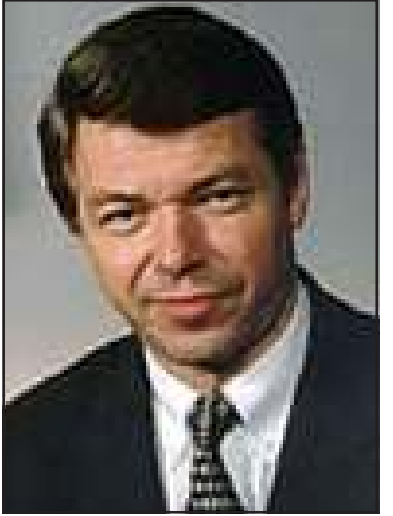
နော်ဝေနိုင်ငံဝန်ကြီးချုပ် မစ္စတာ ဘိုနာဗစ်

ပြောတယ်ဆိုပြီး ကျနော်တို့ ကြားထားရပါတယ် ခင်ဗျာ။