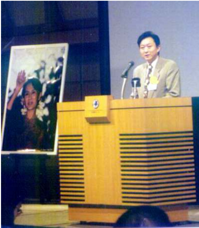
ဂျပန်ဒီမိုကရက်တစ်ပါတီဥက္ကဋ္ဌ Mr Yukio Hatoyama မှမြန်မာ့ဒီမိုကရေစီနှင့်အမျိုးသားရေး ခေါင်းဆောင်ဒေါ်အောင်ဆန်းစုကြည်ကို ထောက်ခံကြောင်းမိန့်ခွန်းပြောကြားနေသည့်ပုံ