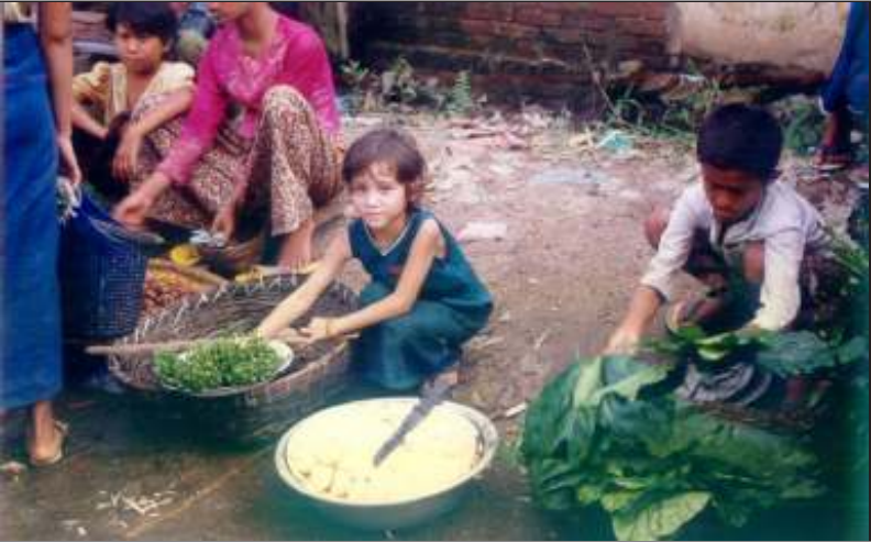
လူမမယ်အရွယ်လေးက လမ်းဘေးဈေးရောင်း

ဗိုလ်ချုပ်အောင်ဆန်းသည် မြန်မာ့လွတ်လပ်ရေးကြီးကို ဗြိတိသျှအစိုးရနှင့် ငြိမ်းချမ်းစွာတွေ့ဆုံဆွေးနွေးညှိနှိုင်းခြင်းမှ တဆင့်အရယူပေးခဲ့ခြင်းဖြစ်ကြောင်းကို အလေးအနက်ထား မှတ်သားကြရမည်ဖြစ်ပေသည်။ ထိုအချိန်ကအချို့အင်အားစုများသည်လွတ်လပ်ရေးဆိုသည်မှာတောင်းယူ၍မရကြောင်း၊ တိုက်ယူမှစစ်မှန်သောလွတ်လပ်ရေး ရရှိနိုင်မည်ဖြစ်ကြောင်း