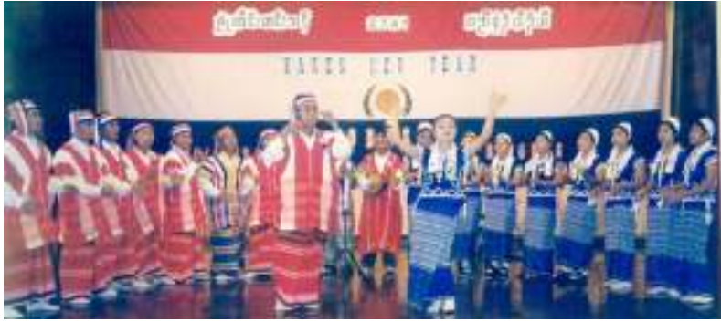
ဘန်ကောက်မြို့တွင်ကရင်နှစ်သစ်ကူးပွဲတော်ကျင်းပနေစဉ်

အရေးချိုးဖောက်နေမှုများကြောင့် မိမိတို့၏ နေရင်းဒေသများမှ အိုးပစ်အိမ်ပစ် ထွက်ပြေးလာကြရသည့် ကရင်တိုင်းရင်းသားများမှာ ထောင်သောင်းချီပြီးရှိနေကြောင်း၊ မိမိတို့အနေ