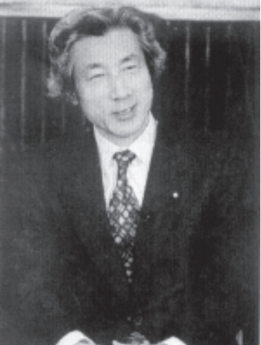
ဂျပန်ဝန်ကြီးချုပ်ဂျူနီချိရှိကိုအိဇုမိ

၁၉၈၈ ခုနှစ်အတွင်း ငြိမ်းချမ်းစွာဖြင့် ဒီမိုကရေစီတောင်းဆိုနေသူများ အားစစ်တပ်က ပစ်ခတ်သတ်ဖြတ်အာဏာသိမ်းခဲ့ပြီးနောက်ပိုင်း ဂျပန်အစိုးရက မြန်မာနိုင်ငံကိုပေးနေသည့် အိုဒီအေနှင့် အခြားထောက်ပံ့မှုများကို ရပ်ဆိုင်း ပစ်ခဲ့သည်။ သို့ရာတွင် ၁၉၉၄ ခုနှစ်မှစ၍လူသား ချင်း စာနာထောက်ထားသည့် အကူအညီများ