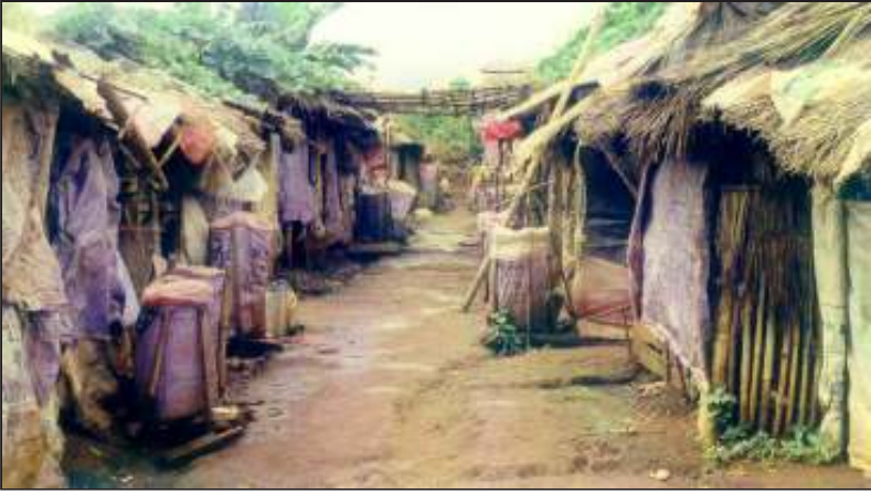
စစ်ဒဏ်စစ်ဘေးကပြေးလာသူတွေက သည်လိုနေ