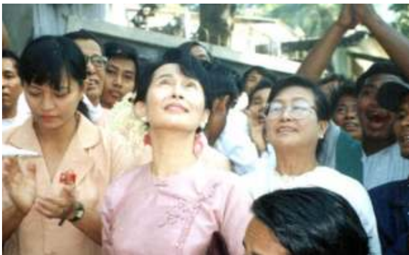
(၅၂)နှစ်မြောက်လွတ်လပ်ရေးနေ့ ကျင်းပခဲ့စဉ်က

၂၀၀၂ ခုနှစ်ဇန်နဝါရီ(၄)ရက်သောကြာ နေ့တွင်ကျရောက်သည့် ၅၄ နှစ်မြောက် လွတ်လပ်ရေးနေ့အထိမ်းအမှတ် အခမ်းအနား ကို ရန်ကုန်မြို့ ရွှေဂုံတိုင်းလမ်းရှိ အမျိုးသား ဒီမိုကရေစီအဖွဲ့ချုပ်ရုံးတွင် ထိုနေ့ နေ့လည် (၁၂)နာရီခန့်က ကျင်းပပြုလုပ်ခဲ့ကြောင်း နိုင်ငံ တကာသတင်းဌာနများ၌ ဖော်ပြပါရှိသည်။ အဆိုပါအခမ်းအနားသို့ မြန်မာဒီမို ကရေစီရေးခေါင်းဆောင်ဒေါ်အောင်ဆန်းစုကြည် တက်ရောက်နိုင်ခဲ့ခြင်းမရှိသော်လည်း အမျိုးသား ဒီမိုကရေစီအဖွဲ့ချုပ် ဥက္ကဋ္ဌဦးအောင်ရွှေနှင့် ဒုဥက္ကဋ္ဌဦးတင်ဦး အပါအဝင်အဖွဲ့ချုပ်အဖွဲ့ဝင် များ တိုင်းရင်းသားပါတီ(၆)ပါတီတို့မှ