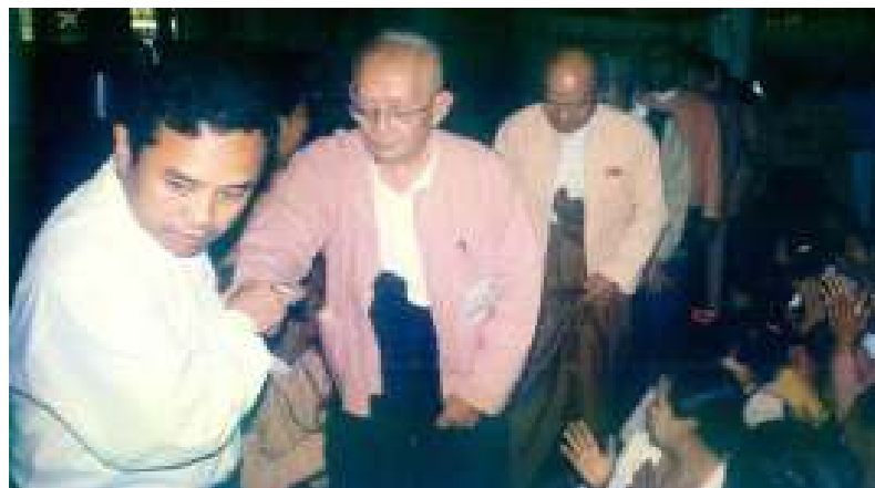
ဝါရင့်နိုင်ငံရေးသမားကြီးများလည်းတက်ရောက်ခဲ့ကြ။

ကိုယ်စားလှယ်တော်များ၊ လွတ်လပ်ရေးတိုက်ပွဲ ဝင် ဝါရင့်နိုင်ငံရေးသမားကြီးများ၊ နိုင်ငံခြား သံတမန်များနှင့် ပြည်သူလူထု(၆၀၀)ကျော်တို့ တက်ရောက်ခဲ့ကြကြောင်းသိရှိရသည်။