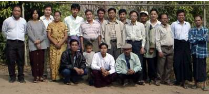
ညီလာခံသို့တက်ရောက်လာကြသော ညီလာခံကိုယ်စားလှယ်များအား အမှတ်တရတွေ့ရစဉ်

အမျိုးသားဒီမိုကရေစီအဖွဲ့ချုပ် (လွတ်မြောက်နယ်မြေ)၏ တတိယအကြိမ်ဗဟိုကော်မတီအစည်းအဝေးတရပ်ကို ထိုင်း-မြန်မာနယ်စပ်တနေရာတွင် ၂၀၀၂ခုနှစ် ဇန်နဝါရီ(၃)ရက်နေ့မှ (၁၂)ရက်နေ့ထိ ကျင်းပပြုလုပ်ခဲ့ကြောင်း သတင်းရရှိသည်။