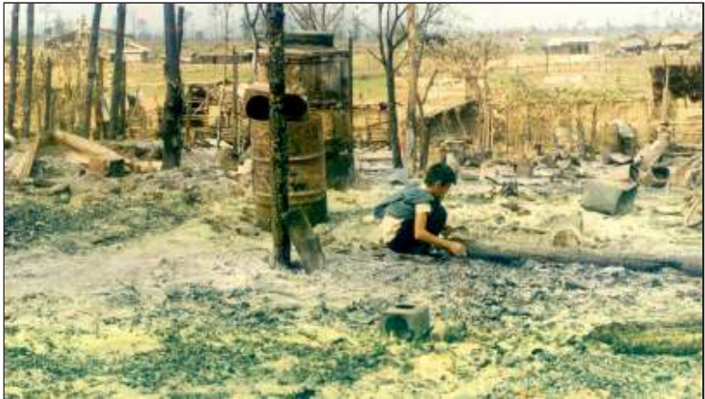
မိလောင်မြေထဲ ငြိမ်းချမ်းရေး တစပြန်ရှာရသလို