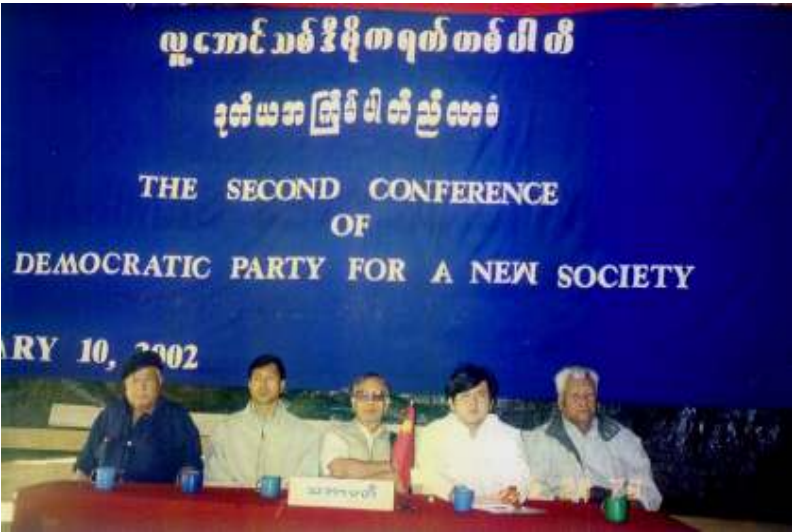
ညီလာခံသဘာပတိများ

အဆိုပါကြေညာချက်၌ အမျိုးသား ဒီမိုကရေစီအဖွဲ့ချုပ်နှင့် နအဖစစ်အစိုးရတို့ ကြား စစ်မှန်သောနိုင်ငံရေးဆွေးနွေးပွဲတရပ် ဖြစ်ပေါ်လာရေးအတွက် ဒေါ်အောင်ဆန်းစုကြည် အပါအဝင် နိုင်ငံရေးအကျဉ်းသားအားလုံး ချွင်းချက်မရှိလွှတ်ပေးရန်၊ NLD အပါအဝင် နိုင်ငံရေးပါတီအားလုံး လွတ်လပ်စွာစည်းရုံး လှုပ်ရှားခွင့်ပြုရန်၊ တိုင်းရင်းသားဒေသများ၌