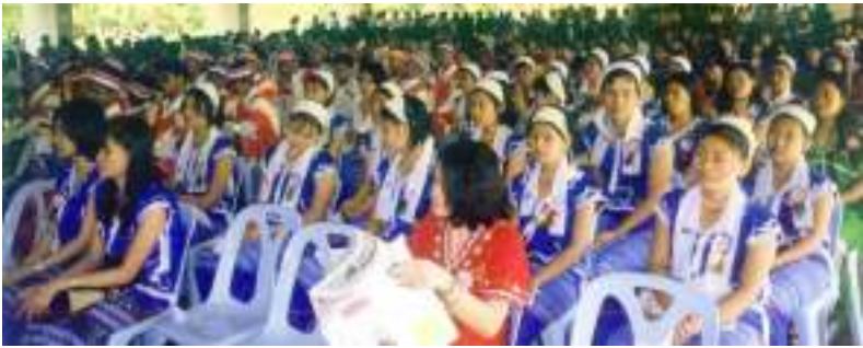
ကရင်နှစ်သစ်ကူးပွဲတော်သို့တက်ရောက်လာကြသောဧည့်ပရိတ်သတ်များ

တွင်လည်း ကရင်နှစ်သစ်ကူးပွဲတော်အခမ်းအနားကျင်းပပြုလုပ်ခဲ့ရာ အဆိုပါအခမ်းနား၌ ကရင်ပြောက်ကျားအထူးတပ်ရင်းမှူး ဗိုလ်မှူးကြီးဖောသူက KNU ဥက္ကဋ္ဌကြီးဖဒိုစောဘသင်မှ ပေးပို့လိုက်သည့် နှစ်သစ်ကူးမိန့်ခွန်းကို တက်ရောက်လာကြသည့် ကရင်လူထုများနှင့်ဧည့်သည်တော်များအား ဖတ်ကြားပြခဲ့ရာမိန့်ခွန်း၌ ကရင်အပါအဝင် လူမျိုးစုံပြည်သူများသည် စစ်တပ်၏ ကျေးကျွန်များသဖွယ်ကျရောက်နေပြီး တတိုင်းတပြည်လုံးသည် ကျေးကျွန်စခန်းကြီးပမာဖြစ်နေရကြောင်း နအဖစစ်အုပ်စု၏ လူမဆန်စွာနှိပ်စက်သတ်ဖြတ်မှုများအပါအဝင် လူ့အခွင့်