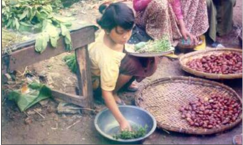
တို့ကတဖုံ ဤသို့နှင့် ကျွန်ုပ်တို့၏