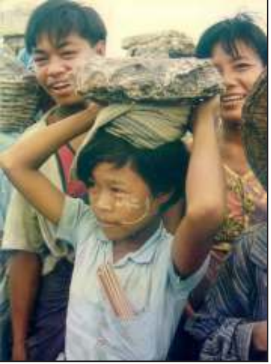
အရွယ်မရောက်သေးသူတွေက အလုပ်ကြမ်းဝင်လုပ်