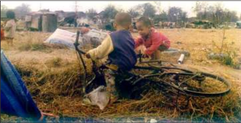
လွတ်လပ်ရေးဆိုတာ ဘာကိုခေါ်တာလဲတဲ့။

၁၉၀၆ ခုနှစ်တွင်“ဝိုင်အမ်ဘီအေ”ခေါ် ဗုဒ္ဓဘာသာကလျာဏယုဝအသင်းကြီးကို မြန်မာ တို့၏ ဗုဒ္ဓဘာသာယဉ်ကျေးမှုရှင်သန်ထွန်းကား စေရန်ထူထောင်ခဲ့သည်။ ၎င်းအသင်းကြီးမှ ပညာတတ်လူငယ်အချို့သည် ကမ္ဘာ့နိုင်ငံရေးအား တစေ့တစောင်းလှမ်းမြော်ထောက်ရှုကာ မိမိတို့ အတွေးအခေါ်များသည် ပဒေသရာဇ်ဘုရင်