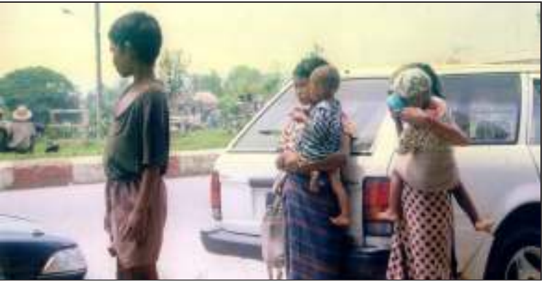
လှုပ်ရှားမြှုပ်နေရသည့် အခြေအနေတွင် တောင်းစားသူ