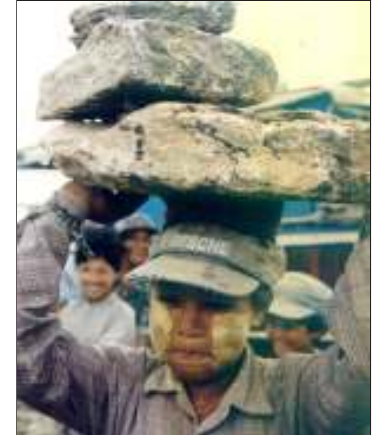
အနှစ် ၅၀ ကျော် လွတ်လပ်ရေးကြီးကား ခါးသီးလှပေစွ။