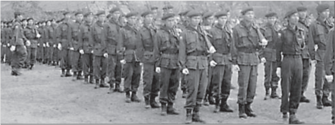
၂၀၀၁ ခုနှစ်၊ ဒီဇင်ဘာလအတွင်း ကေအဲန်ယူ နယ်မြေအတွင်း ဖြစ်ပွားခဲ့သောတိုက်ပွဲများ။

၂၊ ၁၂၊ ၂၀၀၁ ရက်နေ့တွင်ပွေးရှမ်းရွာကြား ပြောက်ကျားပစ်ခတ်ရာ ဒီကေဘီအေ ၂ ယောက်သေ၊ ၁ ယောက်ဒဏ်ရာရ။ ပစ္စတို ၁ လက်၊ ၎င်းကျည် ၁၃၀၊ မိုင်း ၁ လုံး၊ လက်ပစ်ဗုံး ၁ လုံး၊ စက်တိုင်တို ၂ ချောင်း၊ ဟေးမားစက် ၁ လုံး ကိုသိမ်းဆည်းရမိခဲ့သည်။