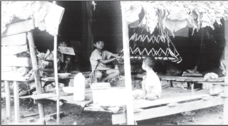
အနာဂတ်ရေး မရေမရာနှင့် သည်ကလေးတွေ သည်အခြေက