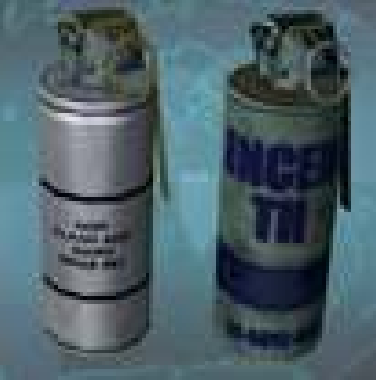
ချိန်ကိုက်လောင်ချာဗုံးများ

လေယာဉ်ပြေးလမ်းမကို တည့်တည့်ချိန် ရွယ်ထားသည့် အဆိုပါလောင်ချာဗုံး နှစ်လုံးကို (၆-၁-၂၀၀၂) တနင်္ဂနွေနေ့က မပေါက်ကွဲမီ အချိန်လေးအတွင်း အချိန်မီဖမ်းဆီးနိုင်ခဲ့ခြင်း ဖြစ်ကြောင်း အဆိုပါကြေညာချက်၌ဖော်ပြထား ပြီး အဆိုပါကိစ္စနှင့်ပတ်သက်၍ မည်သည့်အဖွဲ့က ထောင်ထားသည်ကို အတိအကျဖော်ထုတ် ပြောဆိုခြင်းမရှိသော်လည်း ထိုလက်နက်