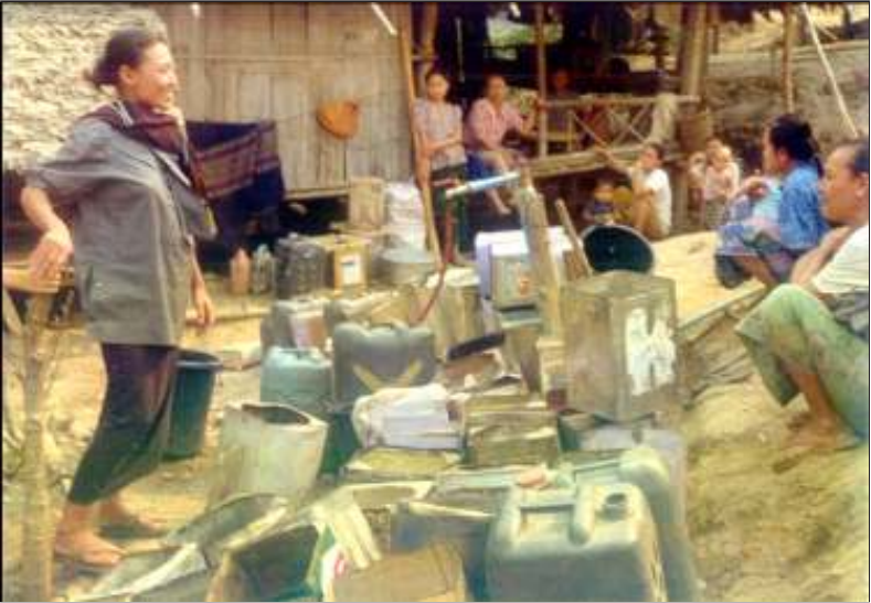
မရေမရာ မသေချာလှသော်လည်း