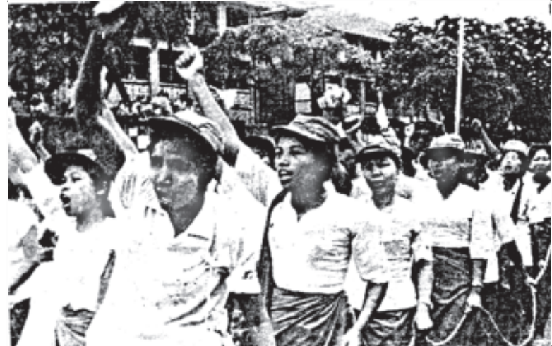
တပါတီအာဏာရှင်စနစ်ဖျက်သိမ်းရေး ဟစ်ကြွေးတောင်းဆိုနေကြစဉ်

ပညာရေးမှာဆိုရင် ကျွန်တော်တို့ ကျောင်းဟာ အလယ်တန်းကျောင်းဖြစ်ပါတယ်။ ဆရာ၊ ဆရာမတွေ မလိုလောက်မှုကြောင့် ကျွန်တော်တို့ ကျေးရွာတွေကနေ စပါးကောက်ခံပြီး ဆရာတယောက်ကို စာသင်နှစ်တနှစ်အတွက် စပါးတင်း (၁၀၀) ပေးပြီး နှစ်ယောက်ငှားထားရပါတယ်။ နောက်ကျောင်းသုံးစာအုပ်ဆိုလည်း အပြင်ကနေ အားလုံးဝယ်သုံးနေရတယ်။ ဒီတော့ အလယ်တန်းကျောင်းသားတယောက် ကျောင်းနေခိုင်းဖို့ ဆရာအတွက် စပါးလည်းပေးရ၊ ကျောင်းဝတ်စုံလည်း အပြင်ကဝယ်ရ၊ စာအုပ်၊ ဘောပင်၊ ခဲတံကအစ အပြင်ကပဲ ဝယ်နေရတာကြောင့် တော်ရုံ လယ်သမားသားသမီးတဦးအဖို့ အလယ်တန်းပညာသင်ယူခိုင်းဘို့ဆိုတာ အလွန်ခဲယဉ်းပါတယ်။ ဒီတော့ ကလေးတွေ မူလတန်းအောင်ရင် ကျောင်းထွက်ခိုင်းပြီး မိရိုးဖလာ တောင်ယာအလုပ်ကိုသာခိုင်းကြပါတော့တယ်။ သေစာရှင်စာ ဖတ်တတ်ရင် ပြီးတာပဲ။ သူတို့ကို တက္ကသိုလ်အထိ မထားနိုင်မယ့် အတူတူ အိမ်အလုပ်ခိုင်းတာကမှ ပိုကောင်းတဲ့မယ်၊ ဘွဲ့ရလည်း တနှစ်လုံးလုပ်မှ စပါးတရာနဲ့ညီမျှ တဲ့ ငွေကြေးရတာ၊ ဘာမှမထူး