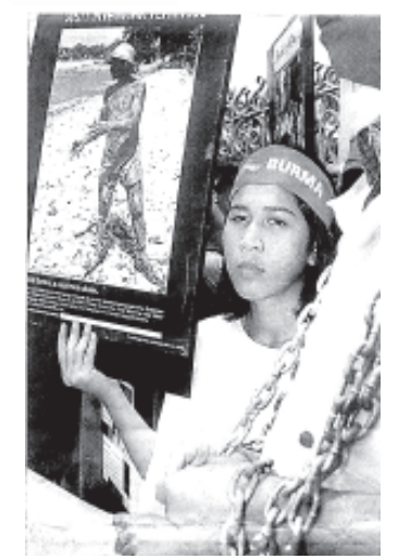
မိမိကိုယ်ကို သံကြိုးဖြင့်ချည်၍ ထိုင်းကျောင်းသားများ ဆန္ဒပြခဲ့

ထိုင်းပြည်သူတို့က မကျေမနပ်ဖြစ်ခဲ့ကြကြောင်းကိုလည်း ထိုင်းဘာသာနှင့်ထုတ်ဝေသည့် ‘မတီရီ’သတင်းစာတွင် ရေးသားဖော်ပြထားသည်။ ထိုင်းပြည်သူများ၏အဆိုအရ ယနေ့ ထိုင်းနိုင်ငံသည် ဖွံ့ဖြိုးတိုးတက်ဆဲ ဒီမိုကရေစီနိုင်ငံတနိုင်ငံဖြစ်ပြီး လူ့အခွင့်အရေးများ ချိုးဖောက်၍ ပြည်သူလူထုအပေါ် လူမဆန်စွာ ရက်ရက်စက်စက်ဖိနှိပ်နေသည့် စစ်အာဏာရှင်များအပေါ် ထိုင်းအစိုးရက ပျူပျူငှာငှာကြိုဆိုခဲ့ခြင်းကို ထိုင်းပြည်သူတရပ်လုံးက စက်ဆုပ်စွာ ရှုတ်ချကြောင်းဖြင့် ထိုင်းဝန်ကြီးချုပ်ထံသို့ စာတစောင်ပေးပို့ခဲ့ကြောင်း သတင်းစာတွင် ဖော်ပြပါရှိသည်။