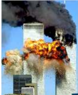
New York မြို့ရှိ World Trade Center ကို အကြမ်းဖက်သမားများက လေယာဉ်ဖြင့် ဝင်တိုက်ပျက်ဆီးနေပုံ