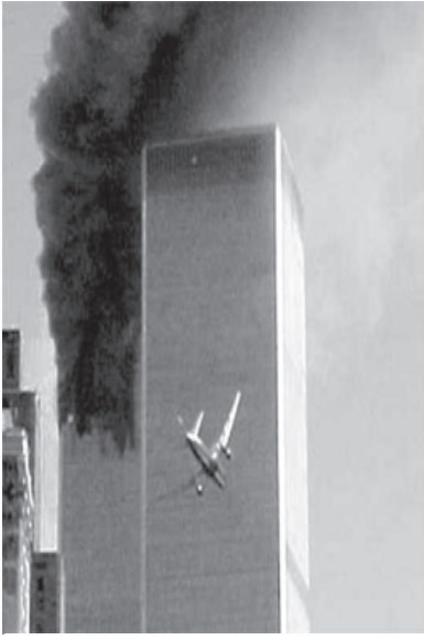
နောက်တစ်ဖန် ထပ်တိုက်ပြန်ပြီ

အမှတ် Flight 11 ဖြစ်ပြီး လေယာဉ်အမှုထမ်းများအပါအဝင် စုစုပေါင်း လူ(၉၂)ဦးကို တင်ဆောင်လာခဲ့သည်။ ဒုတိယလေယာဉ်သည် United Airlines ကုမ္ပဏီပိုင် အမှတ် Flight 175 ဖြစ်ပြီး စုစုပေါင်း လူ(၅၆)ဦးတင်ဆောင်ကာ ဘော့စ