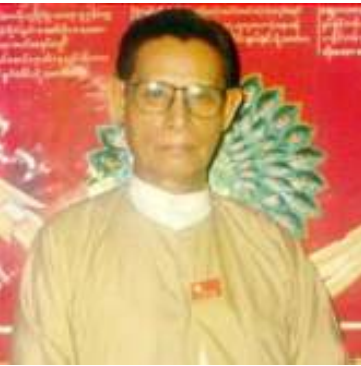
ဥက္ကဋ္ဌ ဦးအောင်ရွှေ