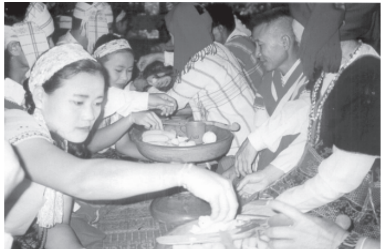
ကရင်ရိုးရာ ချည်ဖြူဖွဲ့ ပွဲတော်ကျင်းပနေစဉ်

ထိုပွဲတော်တွင် ကရင်ရိုးရာလက်ချည်ပွဲ အပြင် ကရင်ရိုးရာ တေးသီချင်းပြိုင်ပွဲ၊ ကရင် ရိုးရာဝတ်စားဆင်ယင်မှုပြိုင်ပွဲများနှင့် အားကစား ပြိုင်ပွဲများအဖြစ် ဘော်လုံးနှင့် ပိုက်ကျော်ခြင်း ပြိုင်ပွဲတို့လည်းပါဝင်ကြောင်းသိရှိရပြီး တက် ရောက်ဆင်နွှဲကြသော ဧည့်ပရိတ်သတ်များအား စားသောက်ဖွယ်များအပြင် ကရင်ဦးယိမ်းအက ဖြင့်လည်း ဖျော်ဖြေခဲ့ကြောင်း သတင်းရရှိပါသည်။