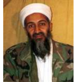
ထိုခြောက်ခြားဖွယ်ရာအကြမ်းဖက်မှုကြီးကို Osama bin Laden ပင် ဦးဆောင်ခဲ့လေသလော

ယောင်ချိုင့်ယု၏ ဖိတ်ကြားချက်အရ နအဖစစ်အုပ်စုအတွင်း ဩဇာအာဏာအရှိဆုံးဖြစ်သည့် ဗိုလ်ခင်ညွန့်သည် အဖွဲ့ဝင်များလိုက်ပါလျက် စက်တင်ဘာလ(၃)ရက်နေ့ နံနက်ပိုင်းက ထိုင်းနိုင်ငံသို့ ရောက်ရှိလာခဲ့ကြောင်း “နေရှင်း” သတင်းစာတွင် ဖော်ပြပါရှိသည်။ ထိုနေ့နံနက်ပိုင်းမှာပင် ဗိုလ်ခင်ညွန့်နှင့်အဖွဲ့သည် ထိုင်းဝန်ကြီးချုပ် ထပ်ဆင့်ရှင်နဝပ်နှင့် အစိုးရအိမ်တော်တွင် သွားရောက်တွေ့ဆုံခဲ့ကြရာ ၎င်းတို့ တွေ့ဆုံပြောဆိုနေချိန်အတွင်း ထိုင်းကျောင်းသားများသမဂ္ဂနှင့် မြန်မာနိုင်ငံဒီမိုကရေစီရရှိရေးလှုပ်ရှားမှုကော်မတီတို့မှ ဆန္ဒပြသူများသည် “ခင်ညွန့် အလိုမရှိ” ဟူသော နဖူးစည်းစာတန်းများကိုင်ဆောင်လျက် အစိုးရအိမ်တော်သို့ ချီတက်ရောက်ရှိလာခဲ့ကြသည်။ ထိုသို့ ဆန္ဒပြသူ ထိုင်းကျောင်းသားတို့သည် မြန်မာကျောင်းဝတ်စုံ(အဖြူအစိမ်း) ကိုတူညီဝတ်ဆင်လျက် ခွပ်ဒေါင်းရုပ်ပါသော အနီရောင်ခေါင်းစည်းများကို နဖူးတွင် ချည်နှောင်ထားကြပြီး “မြန်မာပြည်အတွက် လွတ်လပ်မှု”ဟူသော စာတန်းများလည်း ကိုင်ဆွဲယူဆောင်လာခဲ့ကြောင်း သတင်း၌ ဖော်ပြထားသည်။ ထိုသို့ ဗိုလ်ခင်ညွန့်နှင့် စစ်အုပ်စုအဖွဲ့ဝင်များ ထိုင်းနိုင်ငံသို့ ရောက်ရှိလာခြင်းနှင့် ပတ်သက်၍ ထိုင်းဒီမိုကရက်တစ်ပါတီနှင့်