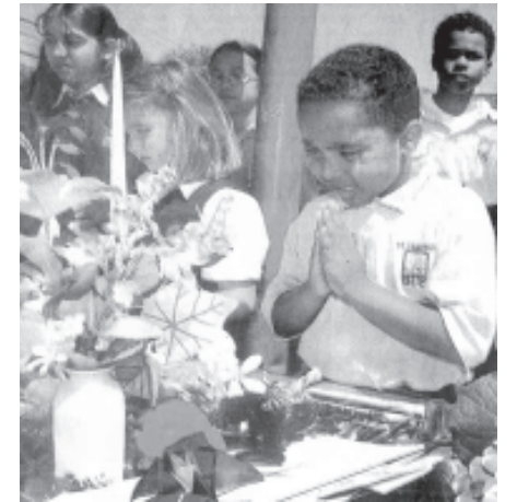
သူတို့လေးတွေတောင် မျက်ရည်လည်၍ ဆုတောင်းနေရဲ့

ကိုင်ရန် ဆော်ဒီအာရေးဗီးယားသို့ပြန်လာခဲ့သည်။ သို့ရာတွင် ၁၉၉၁ ခုနှစ်တွင် ဆော်ဒီအစိုးရကိုဆန့်ကျင်သော သူ့လုပ်ရပ်များကြောင့် ပြည်နှင့်ဒဏ်ပေးခြင်းခံခဲ့ရသည်။ ၁၉၉၁ ခုနှစ်မှ ၁၉၉၆ ခုနှစ်အထိ ဆူဒန်နိုင်ငံတွင် နေထိုင်ခဲ့သည်။ သို့သော် အမေရိကန်အစိုးရက သူ့အားလက်မခံရန် ဆူဒန်အစိုးရကို ပြင်းပြင်းထန်ထန် ဖိအားပေးလာသောအခါ ဘင်လာဒင်သည် အာဖဂန်နစ္စတန်နိုင်ငံသို့ ပြန်လည်ထွက်ခွာလာခဲ့ရတော့သည်။ “သမ္မတနဲ့ သူ့ရဲ့အကြံပေးပုဂ္ဂိုလ်တွေဟာ လိုအပ်တဲ့ အရေးယူဆောင်ရွက်မှုတွေစီစဉ်နေချိန်မှာ ကျမတို့ကလည်း အတူတကွ ရပ်တည်ပေးရမယ်။ အမေရိကန်ပြည်ထောင်စုအနေနဲ့ အကြမ်းဖက်သမားတွေကို အရေးယူဖို့ကြိုးစားနေချိန်မှာ ကျမသေသေချာချာ ပြောချင်တာကတော့ ဒီအကြမ်းဖက်သမားတွေကို ခိုလှုံခွင့်ပေးထားသူတွေကိုသာမကဘဲ ဘယ်လိုအကူအညီမျိုးဘဲဖြစ်ဖြစ် အကူအညီပေးသူတွေအားလုံးကိုပါ ကျမတို့နိုင်ငံရဲ့ ဒေါသအမျက် ချောင်းချောင်းထွက်တာကိုခံကြရပါလိမ့်မယ်”ဟု နယူးယောက်ပြည်နယ် ဆီးနိတ်လွှတ်တော်အမတ် ဟီ(လ်)လာရီကလင်တန်ကပြောကြားခဲ့သည်။ သူပြောခဲ့သလိုပင် ကမ္ဘာကြီးတခုလုံးကိုကိုင်လှုပ်လိုက်သည့် မိနစ်(၇၀)၏ အဓိက