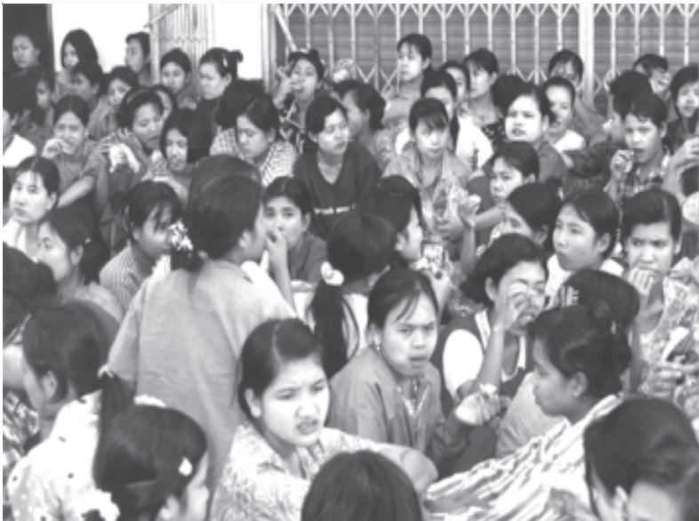
ကိုယ့်တိုင်းပြည်ဟန်မကျလို့ တိုင်းတပါးရောက်တော့လည်း အဖမ်းခံရပြန်ပြီ

လက်ရှိ ထိုးနှက်ဝိုင်းရိုက်ကြပါတယ်။ ရိုက်လို့ အားရမှ အချုပ်ဗူးခန်းထဲ ထည့်လိုက်ပါတယ်။ အချုပ်ထဲဝင်တဲ့ တံခါးအဝင်ဝ၊ အချုပ်သားတွေ ဖိနှပ်ချွတ်တဲ့နေရာ၊ အကျယ်က သုံးပေပတ်လည်လောက်ရှိပါတယ်။ အချုပ်ခန်းထဲဝင်ဘို့ တံခါးနှစ်ခုရှိပါတယ်။ ပထမတံခါးကိုဖွင့်ပြီး လူကို အချုပ်အဝင်ဗူးခန်းထဲမှာထည့်ပြီး ပြန်ပိတ်လိုက် ပါတယ်။ နောက် အတွင်းတံခါးကိုဆွဲဖွင့်ပြီးမှ အချုပ်ခန်းတွင်းဝင်ရတဲ့နေရာမှာ (ထိုင်ရင်တောင် ဖူးနှစ်ချောင်းထောင်ပြီး ထိုင်ရတဲ့နေရာမှာထားပြီး) အချုပ်တွင်းက လူတွေနဲ့ စကားမပြောဘို့နဲ့ အချုပ်ထဲက လူတွေကလည်း စကားမပြောဘို့ ညာဘာယာနဲ့ တန်းစီးတွေကိုမှာပြီး ပြန်ထွက်သွားပါတယ်။ ကျနော် ဗူးထဲရောက် တဲ့အချိန်ဟာ ညနှစ်နာရီလောက်ရှိပြီး တကိုယ်လုံးနာကျင်ကိုက်ခဲနေပြီး