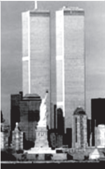
လှလှပပ WTC ညီနောင်နှစ်ဖော်

“ဒီအဖြစ်အပျက်ဟာ ပုလဲဆိပ်ကမ်းမှာဖြစ်ခဲ့တာမျိုး နောက်တကြိမ်ထပ်ဖြစ်တာပါ။ ဒါ ကျနော်တို့အနေနဲ့ ပုံကြီး ချဲ့ပြောတာမဟုတ်ပါဘူး”ဟု အမေရိကန်ဆီးနိုတ်လွှတ်တော် အမတ်တဦးဖြစ်သူ ချတ်(က်)ဟေဂယ်(လ်)(Chuck Hagel)