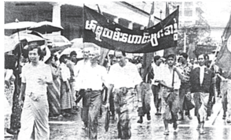
စစ်မှုထမ်းဟောင်းကြီးများလည်း စစ်အာဏာရှင်စနစ် ဖျက်သိမ်းပေးရန်ဆန္ဒပြ

လား။ ဒီ ထီးချိုင့်တို့၊ တွန်းဇံတို့ဆိုတာကို တခြားလူတွေ မကြားဘူးကြဘူးဗျာ။ မဖွံ့ဖြိုး၊ မတိုးတက်တဲ့ မြို့သူမြို့သားအချင်းချင်းတွေ၊ တမြေထဲနေ၊ တရေထဲသောက်သူတွေပါ။ ဒီတော့ လူလူချင်း ဒီလောက်ကြောက်နေစရာ မလိုပါဘူးဗျာ။ သူလည်း ခင်ဗျားတို့၊ ကျနော်