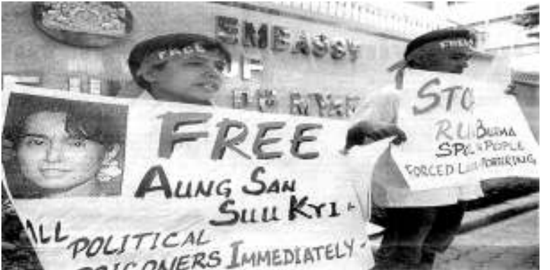
ထိုင်းနိုင်ငံ ဘန်ကောက်မြို့ရှိ မြန်မာသံရုံးရှေ့တွင် ဆန္ဒပြနေကြစဉ်

မြန်မာနိုင်ငံတပါတီစနစ် ဖျက်သိမ်း ရေးနှင့် ဒီမိုကရေစီစနစ် ထွန်းကားလာရေး တို့အတွက် တောင်းဆိုဆန္ဒပြခဲ့ကြသည့် ရှစ်လေးလုံးအရေးတော်ပုံကြီးအား စစ်တပ် မှ အကြမ်းဖက်ဖိနှိပ်ခံခဲ့ရပြီးနောက် အာဏာ သိမ်းယူခဲ့သည့် (၁၃)နှစ်မြောက် နှစ်ပတ် လည်နေ့ဖြစ်သည့် စက်တင်ဘာလ(၁၀)ရက် နေ့တွင် လန်ဒန်မြို့အပါအဝင် အခြားနိုင်ငံရှိ မြို့ကြီးများ၌ ဆန္ဒပြတောင်းဆိုမှုများနှင့် ကျဆုံးခဲ့ရသူများအားရည်စူး၍ ဆုတောင်း အမျှပေးဝေပွဲများပြုလုပ်ခဲ့ကြောင်း သတင်း ရရှိသည်။