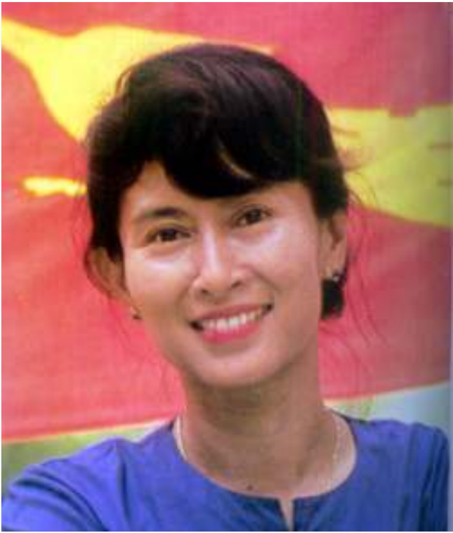
၁၉၉၁ ခုနှစ် နိဗ္ဗာန်ငြိမ်းချမ်းရေးဆုရှင် ဒေါ်အောင်ဆန်းစုကြည်

ကြည့်ပြီး ကျနော်တို့ရွေးတာပါ။ နောက်တချက်ကတော့ သူတို့ လက်ရှိလုပ်ကိုင်နေတဲ့ အချက်အလက်တွေကိုကြည့်ပါတယ်။ ဒေါ်အောင်ဆန်းစုကြည်ဟာ အင်မတန်မှအရေးပါတဲ့ နိဗ္ဗာန်ဆုရှင်တဦးဖြစ်ပါတယ်။ သူ့ရဲ့ ဒီမိုကရေစီရေးပြတ်သားမှုတွေကို အားပေးချင်တာကြောင့်