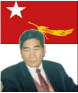
ဦးတင်အောင် ဥက္ကဋ္ဌ NLD (L.A)

မိုးတီး ▶ NLD ဥက္ကဋ္ဌဦးတင်အောင်ရွှေနဲ့ ဦးတင်ဦးတို့ နေအိမ်မှာထိန်းသိမ်းခံရခြင်းမှ လွတ်မြောက်လာတဲ့အပေါ် ဥက္ကဋ္ဌရဲ့ သဘောထားအမြင်ကို သိပါရစေ။