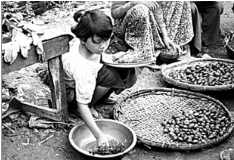
နဝတ ခေတ်ရောက်တော့ လူမမယ်လေးတွေက လမ်းဘေးဈေးသည်

နောက်ကနေ သေနတ်မောင်းတင်သံ ကြားလိုက်ပါတယ်။ အားလုံးလည်း အရက်နဲ့ တထောင်းထောင်းနဲ့ မူးနေပုံရတယ်။