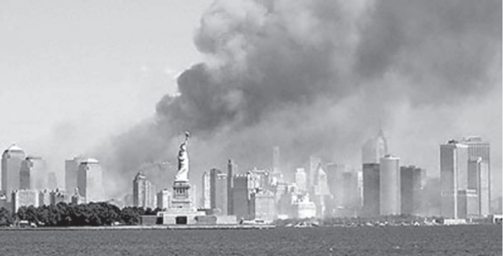
လေဘာတီရပ်တုကြီး၏နောက်တွင် မီးဟုန်းဟုန်းတောက်နေသည့် နယူးယောက်မြို့ကြီး