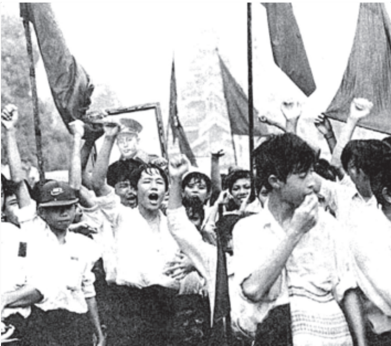
ကျောင်းသားငယ်လေးတွေမှအစ အရေးတော်ပုံကြီးမှာ ပါဝင်လာကြပြီ

ဝိုင်းအူကြည့် ကြရအောင်”လို့ ပြောလိုက်တယ်။ အားလုံးက သဘောတူတာနဲ့ တညတော့ ခွေးသူခိုးအနားကိုသွားပြီး ဝိုင်းအူလိုက်ကြတယ်။ ရုတ်တရက်ဆိုတော့ ခွေးသူခိုးလည်းလန့်ပြီး လိုက်အူဖို့ ပြင်လိုက်တယ်။ ဒါပေမယ့်ချက်ချင်း သတိရလိုက်ပြီး မအူမိအောင် ထိန်းထားလိုက်တယ်။ သူ အူလိုက်ရင် ဇာတိရပ်ပေါ်ပြီး ရာဇပလ္လင်ပေါ်က ခွေးပြေးပြေးရမယ်ဆိုတာကို သူက သိနေတာကိုး။ ခွေးတွေ အားရအောင်အူပြီးသွားတဲ့အခါ သူတို့နေရာသူတို့ ပြန်သွားကြတယ်။ ခွေးသူခိုးကိုလည်း ခြင်္သေ့လို့ပဲ ယုံသွားပြီးခွေးအိုကြီးရဲ့စကားကို မယုံကြတော့ဘူး။ ဒါပေမယ့် ခွေးအိုကြီးကတော့ လက်မလျှော့သေးဘူး။ ဒီတော့ ခွေးမှန်ရင် မအူဘဲမနေနိုင်တဲ့ တော်သလင်းလရောက်ရင်တော့ အကြောင်းသိရမယ်ဆိုပြီး တော်သလင်း လပြည့်နေ့ည ခွေးသူခိုးအိပ်မောကျနေတဲ့ အချိန်မှာ အနားကပ်ပြီး ဝိုင်းအူလိုက်တာ ခွေး သူခိုးအိပ်ရာကလန့်နိုးပြီး သတိလက်လွှတ် လိုက်အူမိပါတော့တယ်။ အဲဒီမှာတင် ဇာတိရပ်ပေါ်လာတာကြောင့် ခွေးသူခိုးဟာ ခွေးပြေးပြေးခဲ့ရတယ်။ အဲဒီအချိန်ကစပြီး ‘ခွေးပြေး