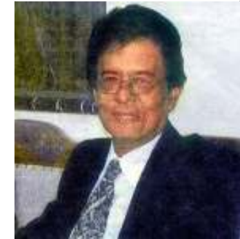
မစ္စတာရာဇာလီအစ္စမေးလ်

ထိုခရီးစဉ်အတွင်း မစ္စတာရာဇာလီသည် နအဖစစ်ခေါင်းဆောင် ဗိုလ်ခင်ညွန့်အပါအဝင် နိုင်ငံခြားရေးဝန်ကြီး ဦးဝင်းအောင်နှင့် တွေ့ဆုံခဲ့ပြီး အတိုက်အခံများဘက်မှ မြန်မာ့ဒီမိုကရေစီ ခေါင်းဆောင် ဒေါ်အောင်ဆန်းစုကြည်နှင့် နှစ်ကြိမ်တိုင်တိုင် ဆွေးနွေးခဲ့ကြောင်း၊ အခြားအမျိုးသားဒီမိုကရေစီအဖွဲ့ချုပ် ဗဟိုကော်မတီဝင် ခေါင်းဆောင်ကြီးများနှင့်လည်း သီးခြားဆွေးနွေးနိုင်ခဲ့ကြောင်း၊ ထို့နောက် တိုင်းရင်းသား လူမျိုးစုပါတီများမှ ခေါင်းဆောင်များနှင့်ပါ တွေ့ဆုံဆွေးနွေးခဲ့ကြောင်း သိရှိရသည်။ မစ္စတာရာဇာလီသည် လာမည့် နိုဝင်ဘာလအတွင်းတွင်လည်း မြန်မာနိုင်ငံသို့ ထပ်မံသွားရောက်ရန် စီစဉ်ထားပြီး ယခုဆွေးနွေးမှုများမှာ နှစ်ဘက်စလုံးမှ ရွေ့လုပ်ငန်းစဉ်များအပေါ် စိတ်အားထက်သန်မှုတွေ ရှိနေကြကြောင်း၊ ဩဂုတ်လ(၂၉)ရက်နေ့ညက