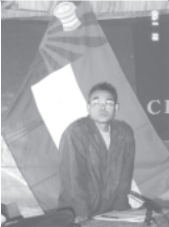
ကေအန်ယူအထွေထွေအတွင်းရေးမှူး ပဗိုမန်းရှာ

နဝတစ်အုပ်စုက ၎င်းတို့အား လက်နက် ကိုင် ဆန့်ကျင်နေသည့် တိုင်းရင်းသားအင်အား စုများနှင့် အမျိုးသားပြန်လည်သင့်မြတ်ရေး လုပ်ငန်းစဉ်များ စေ့စပ်ဆွေးနွေးလိုကြောင်း ယခုလစောစောပိုင်း၌ ထိုင်းနိုင်ငံ ပတ္တရားမြို့တွင် ကျင်းပခဲ့သည့် (၁၀)ကြိမ်မြောက် ထိုင်း-မြန်မာ နယ်စပ်ကော်မတီအစည်းအဝေးတွင် တရားဝင် ထုတ်ဖော်ပြောဆိုခဲ့သည်ဟု (Bangkok Post) သတင်းစာတွင် ဖော်ပြပါရှိသည်။