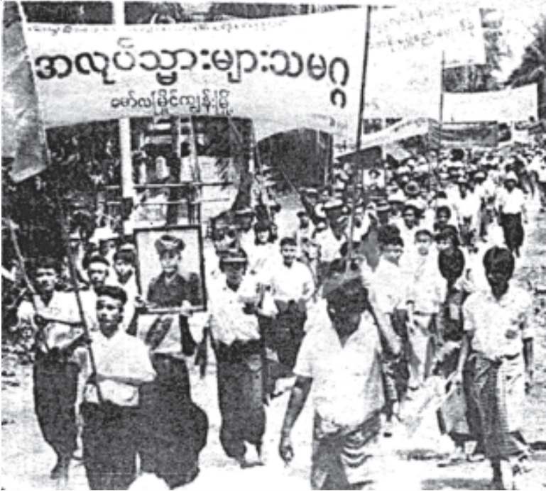
အလုပ်သမားသမဂ္ဂကြီးဖွဲ့စည်း၍အင်အားထူကြီးနှင့်ချီတက်

ဘူး၊ လယ်ထဲခိုင်းတာ အေးတယ်ဆိုပြီး ကျောင်းထွက်ခဲ့ကြရတဲ့ တပည့်တွေလည်း မနည်းတော့ပါဘူး။