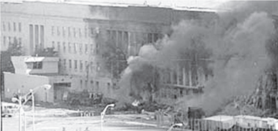
အပိုင်စီးခံရသည့်လေယာဉ်ဖြင့် တိုက်ခိုက်ခံရပြီးနောက် မီးလောင်နေသည့် ပင်တဂွန်စစ်ဌာနချုပ်

ယခုအခါ နယူးယောက်မြို့တော်၏ မင်(န်)ဟတ်တန်ရပ်ကွက်ကြီးတခုလုံးသည် ဟိုပြေးသည်လွှားနှင့် ပျားပန်းခတ်နေကြသည့် လှိုင်းလုံးကဲ့သို့ လူအုပ်ကြီးများ၊ တဝီဝီတဝေါ်ဝေါ်အော်မြည်၍ ဥဒဟို မောင်းနှင်နေသည့် လူနာတင်ယာဉ်များ၊ ကယ်ပါယူပါ တစာစာနှင့် အော်ဟစ်ငိုယိုနေသံများနှင့် မီးခိုးလုံးကြီးများကြောင့် အော်ဂလီဆန်စရာအတိဖြစ်နေတော့သည်။ အတ္တလန်တိတ်သမုဒ္ဒရာဘက် မိုင်ဝက်ခန့်ထွက်၍ သမင်လည်ပြန် ငှဲစောင်းကြည့်လိုက်သောအခါ Miss Liberty ရုပ်တုနောက်၌ မီးခိုးလုံးကြီးများ ဖုံးလွှမ်းလျက်ရှိသည့် မင်(န်)ဟတ်တန်ရပ်ကွက်ကြီးကို စိတ်မချမ်းမြေ့ဖွယ်မြင်တွေ့ရပြန်သည်။ ယခင်ကဆိုလျှင် ဘရူကလင်းရပ်ကွက်မှ လှမ်းမျှော်ကြည့်လိုက်ပါက မိုးပျံတိုက်ကြီးများဖြင့် လှချင်တိုင်းလှ၊ ခန့်ချင်တိုင်းခန့်နေသည့် မင်(န်)ဟတ်တန်ရပ်ကွက်ကြီးသည် အကြမ်းဖက်သမားတို့၏ လူဆန်သော ယုတ်မာရက်စက်မှုကြောင့် အရပ်ဆိုးအကျဉ်းတန်ခဲ့လေပြီ။