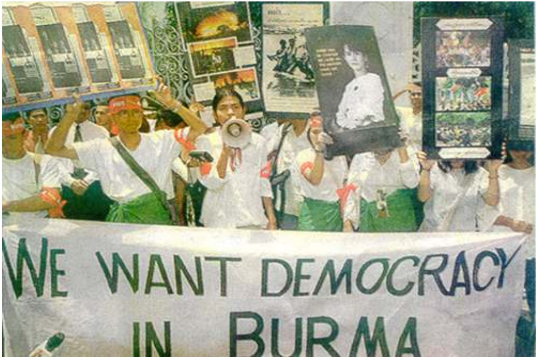
ထိုင်းကျောင်းသူကျောင်းသားများ အစိုးရအိမ်တော်ရှေ့၌ ဗိုလ်ခင်ညွန့်လာရောက်ခြင်းကို ဆန္ဒပြနေစဉ်

စက်တင်ဘာလ ပထမပတ်အတွင်း ထိုင်းနိုင်ငံသို့လာရောက်ခဲ့သည့် နအဖစစ်အုပ်စု၏ (၃)ရက်ကြာ ခရီးစဉ်အတွင်း ထိုင်းကျောင်းသားများနှင့် ထိုင်းပြည်သူများက ကန့်ကွက်ဆန္ဒပြမှုများပြုလုပ်ခဲ့ပြီး တောင်းဆိုချက် (၇)ရပ်ပါသည့် ကြေညာချက်တစောင်ကို ထုတ်ပြန်ခဲ့ကြောင်း သိရသည်။ နအဖစစ်ဗိုလ်ချုပ်ကြီးများနှင့် ပလဲနပ်သင့်သူ ထိုင်းကာကွယ်ရေးဗန်ကြီး ချာဗာလစ်