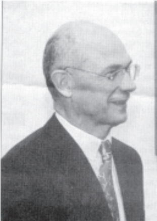
ဥရောပသမဂ္ဂ ၏ ကုန်သွယ်ရေးမင်းကြီး ပါစကယ် လာဗီ

ဥရောပသမဂ္ဂ၏ ယခုကဲ့သို့ ပြောဆိုမှုအား နအဖစစ်အုပ်စု ဝန်ကြီးဗိုလ်မှူးချုပ် ဒေးဗစ်အဘယ်လ်က “မြန်မာနိုင်ငံဟာ အာဆီယံအဖွဲ့ဝင်နိုင်ငံဖြစ်တယ်၊ဥရောပသမဂ္ဂ EU လာချင်လာ၊ မလာချင်နေ နအဖ ကိုယ်စားလှယ်ကတော့ တက်မှာပဲ” ဟု တုန့်ပြန်ပြောဆိုသည်။ သို့သော်လည်း အောက်တိုဘာလအတွင်း ထိုင်းနိုင်ငံ၊ ချင်းမိုင်မြို့တွင်ပြုလုပ်သော သတင်းစာ