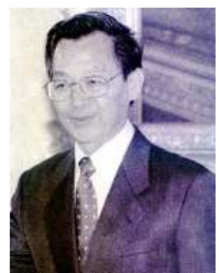
ထိုင်း ဝန်ကြီးချုပ် ချန်လီပိုင်

အလားတူ ကော့သောင်းမြို့နယ် ရဲအထူးသတင်းတပ်ဖွဲ့မှ တပ်ကြပ်ကြီး