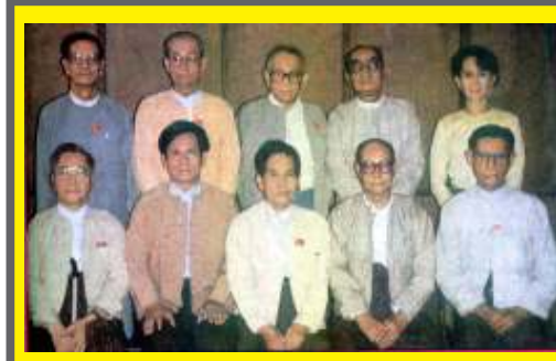
ပြည်သူ့လွှတ်တော် ကိုယ်စားပြုကော်မတီကို ထောက်ခံကြ