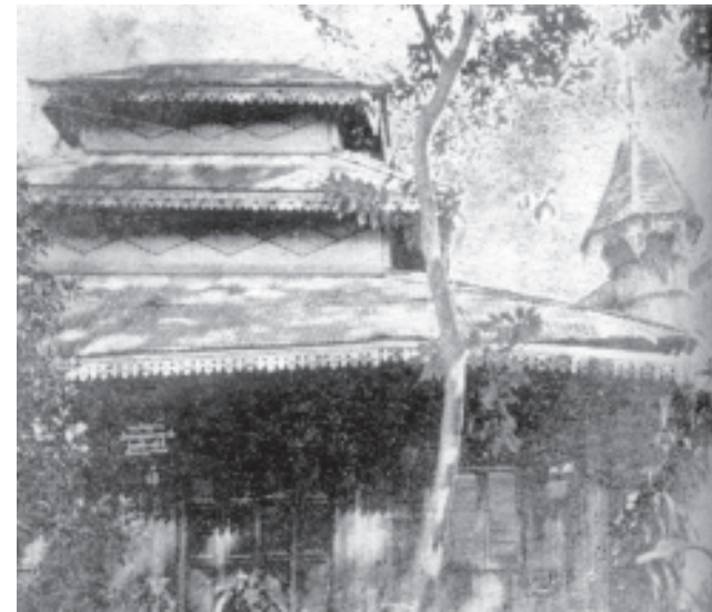
၁၉၂၀ သပိတ်မှောက်ကျောင်းသားများ တည်းခိုနေကြသော ဗဟန်းကြားတောရလမ်း ဦးအရိယ ကျောင်းတိုက်အတွင်းရှိ ဧရပ်များ

ခေတ်သမိုင်းအစဉ်ကို ဆစ်ပိုင်းရင်လူငယ်ဆိုတာ တက်ကြွတယ်၊ရဲရင့်တယ်၊တရားမမျှတမှုကို ရွံရှာမုန်းတီးပြီး တရားမျှတမှုကို လိုလားတယ်။ စွန့်လွှတ်စွန့်စားလိုတယ်။ဖိနှိပ်မှု အမျိုးမျိုးကို ဆန့်ကျင်လိုတယ်။ အမှန်တရားကို ရင်ဆိုင်ရတဲ့ လူငယ်တစုက ၁၂၇၂ ခုနှစ်တန်ဆောင်မုန်းလဆုတ် (၁၀)ရက် နေ့မှာစုပေါင်းဆန္ဒပြခဲ့ကြလို့