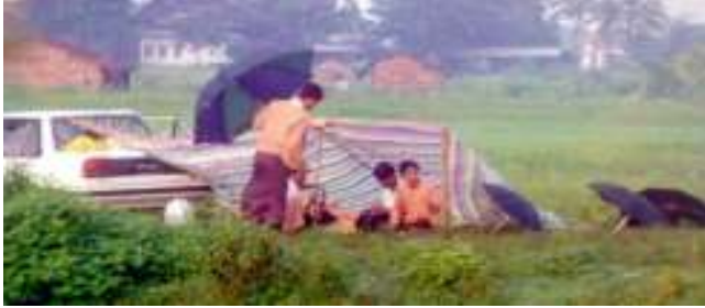
ဩဂုတ်လအတွင်းက ဒလမြို့တနေရာတွင် တားဆီးပိတ်ပင်ခြင်းခံနေရသော ဒေါ်အောင်ဆန်းစုကြည်နှင့်အဖွဲ့

ငန်းများကို ရှင်းလင်းပြောပြသွားသည်ဟု သိရသည်အပြင် အဆိုပါအစည်းအဝေးပြုလုပ် နေစဉ်တလျှောက်လုံး ပြည်ကြီးတံခွန်ရဲတပ်ဖွဲ့က လုံခြုံရေးအပြည့်အဝဖြင့် စောင့်ရှောက်ပေးနေကြောင်း ဒီမိုကရက်တစ်မြန်မာ့အသံက နိုဝင်ဘာ(၂၇)ရက်နေ့တွင်ပြောဆိုသွားသည်။