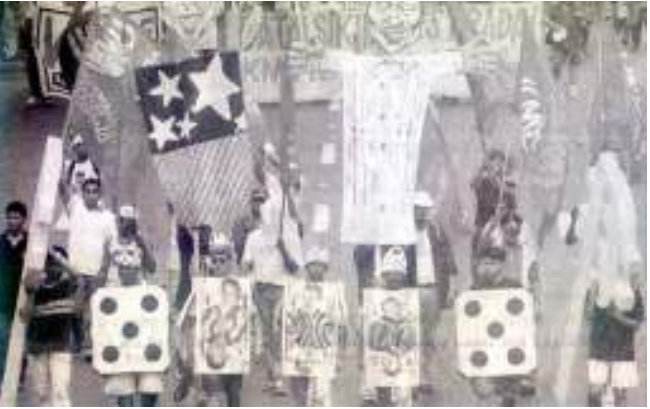
သမတ အက်စ်တာဒါး၏ လောင်းကစားဝိုင်းမှ လာဘ်ငွေယူမှုနှင့် ပတ်သက်ပြီး နှုတ်ထွက်ပေးရန်တောင်းဆိုနေကြသော ဖိလစ်ပင်းလူထု

လက်ဝဲအုပ်စုမျိုးစုံတွေကဖြစ်တယ်။ ဒီအသံတွေထဲမှာ အက်စ်တာဒါးကို နှုတ် ထွက်ပေးဖို့တောင်းဆိုတဲ့ အကျယ် လောင်ဆုံးအသံတွေကတော့ စီးပွား ရေးသမားကြီးတွေဖြစ်ပြီး အာရိုင်းရိုရဲ့ စီးပွားရေးအမြင်နဲ့ပတ်သက်တဲ့ အရည် အသွေးကိုရော သူမရဲ့မျိုးရိုးကိုပါ လေး စားနေတဲ့သူတွေဖြစ်ကြတယ်။ သူတို့က အက်စ်တာဒါးရဲ့ ပေါက်ကရလုပ်နေတဲ့ စီးပွားရေးမူတွေကို စိတ်ဝင်ကျနေတဲ့ သူတွေလည်းဖြစ်တယ်။