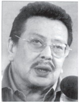
ဖိလစ်ပိုင် သမတ ဂျိုးဇက် အက်စ်တာဒါး

မာကာပိုလ်Diosdado Macapagal ဖြစ်တယ်။ ဒါပေမယ့် သူမရဲ့ အနေ အထားက အာကီနီတုန်းကလို သမတ လုပ်ကိုင်လုပ်ရတော့မယ်ဆိုတဲ့ ရှင်းလင်း တဲ့ အခြေအနေမျိုးတော့ မဟုတ်သေး ပါဘူး။ ၁၉၈၆ ခုနှစ် အာကီနီတုန်းက ထက်တော့ အခြေအနေတော်တော်များ