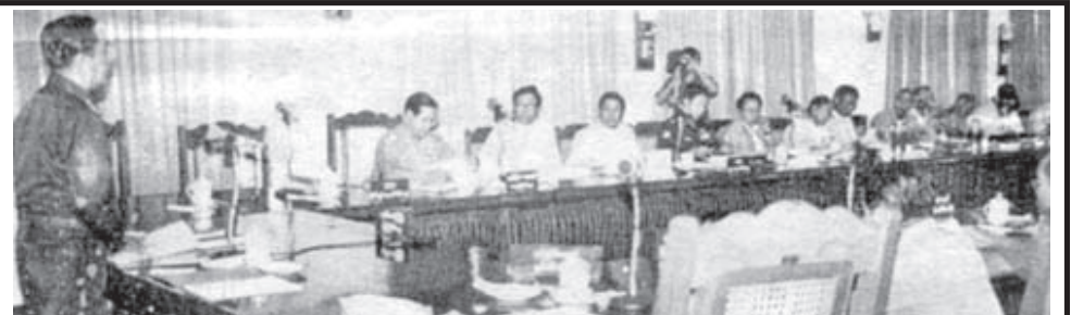
မြန်မာနိုင်ငံအတွင်း မူးယစ်ဆေးဝါးထိန်းချုပ်ရေးအတွက် မြောက်မြားလှစွာသော အစည်းအဝေးများကို ပြုလုပ်ခဲ့သော်လည်း အရာမရောက်ဖြစ်နေသဖြင့် ထိုအစည်းအဝေးများမှာ ဟန်ပြအဆင့်ပြုလုပ်သော အစည်းအဝေးများဟု တချို့က အမည်တပ်နေကြ၏

ပြည်သူ့လွှတ်တော်ကိုယ်စားပြုကော်မတီကို စတင်ဖွဲ့စည်းခဲ့သည့် ၁၉၉၈ခုနှစ်စက်တင်ဘာလ (၁၆)ရက်နေ့မှ ယခု (၂) နှစ်တာကာလအတွင်း နအဖ စစ်အုပ်စု၏ တင်းကျပ်သော၊ လူမဆန်သောအာဏာနုအတား အနှောင့်အယှက်များကို ခက်ခဲပင်ပန်းစွာဖြတ်သန်းနေရသည်ကြားမှ ဖွဲ့စည်းအုပ်ချုပ်ပုံအခြေခံဥပဒေသစ်အား ရေးဆွဲမည်ဟုကြေညာလိုက်ခြင်းသည် နအဖစစ်အုပ်စုအား ရဲဝံ့စွာစိန်ခေါ်ခြင်းဖြစ်ကြောင်း နိုင်ငံတကာရှိ အကဲခတ်သူတို့က ပြောဆိုနေကြပါသည်။ ❖