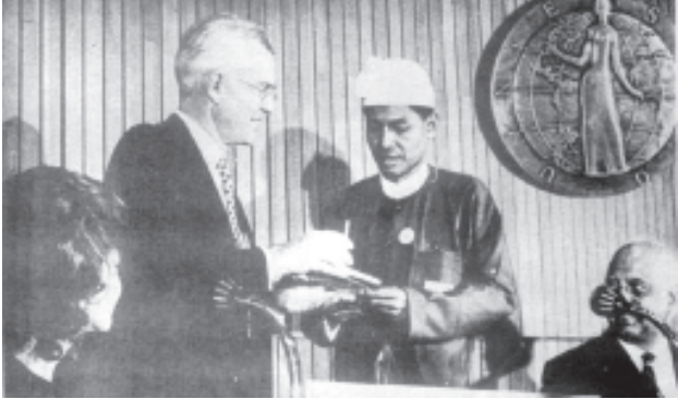
ကမ္ဘာ့ကုလသမဂ္ဂ ယူနက်စကိုအဖွဲ့မှ ချီးမြှင့်သည့် စာတတ်မြောက်ရေး မဟာမတ်ရောဂျားဗေဟဗီဆု ရရှိခဲ့စဉ်က

ဘူးဆိုတာ ကမ္ဘာ့ဘယ်အဖွဲ့အစည်းကမှ သတ်မှတ်လို့ မရပါဘူး။ မသတ်လဲ မသတ်မှတ်ကြပါဘူး။ ဖြစ်ချင်သူက ကိုယ့်ဟာကိုယ် လျှောက်ယူရတာပါ။ ကုလသမဂ္ဂကသတ်မှတ်တာ မဟုတ်ပါဘူး။ တိုင်းပြည်တပြည်ရဲ့ ဖွံ့ဖြိုးမှုအဆင့်အတန်းကို သတ်မှတ်တဲ့စံချိန်တွေအတော်များပါတယ်။ ခဏခဏလည်း ပြောင်းပါတယ်။ ဒါပေမယ့် မြန်မာနိုင်ငံ