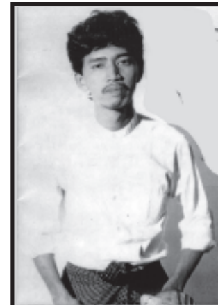
ထမ်းယူမဟနဲ့ သတင်းယူမဟနဲ့ မင်းကိုနိုင် ( ဥက္ကဋ္ဌ ) ဗမာနိုင်ငံလုံးဆိုင်ရာ ကျောင်းသားများသမဂ္ဂ