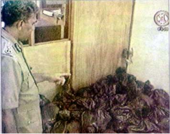
ဖိဂျီနိုင်ငံတွင် ဖမ်းဆီးရမိသော အမေရိကန်ဒေါ်လာသန်း(၁၅၀)ဘိုးရှိသော မြန်မာနိုင်ငံထွက် ဘိန်းဖြူများ

ကြောင်း၊ နယ်နိမိတ်သတ်မှတ်မှုများကို ဘေးဖယ်ပြီး၊ တရားဥပဒေစိုးမိုးမှုမရှိသေးသော ဖိဂျီနိုင်ငံနှင့်မြန်မာပြည်ရှိ အာဏာထိုင်တို့ လက်တွေ့ပူးပေါင်းဆောင်ရွက်ပါက ဘိန်းနှိမ်နှင်းရေးလုပ်ငန်း ပိုမိုအောင်မြင်ဖို့ရှိလာနိုင်ကြောင်းဘန်ကောက်ပို့စ်သတင်းစာ အယ်ဒီတာ့အာဘော်က ရေးသားတင်ပြထားသည်။ ❖