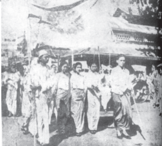
၁၉၃၆ ခုနှစ် တက္ကသိုလ်ကျောင်းသားများ သပိတ်မှောက်ရာတွင် ရန်ကုန်မြို့တွင်း၌ စီတန်းလှည့်လည်လာကြစဉ်

အတိုင်းပါ။ ထီးသုဉ်း၊ နန်းသုဉ်း၊ မြို့သုဉ်း သုဉ်းနဲ့ကျွန်ုပ်တို့အားလုံးတို့အားလုံးပင်လယ်မှာရေညိုခြောက်၊ ဆောင်ပလ္လင်မှာကွယ်ပြီး ရွှေဗဟိုရံ ပျောက်ခဲ့ရတယ်။ဗမာ့ဦးစွန်း အနောက်ကိုယွန်းပြီး နယ်ချဲ့ဖဝါးအောက် ပြားပြားမှောက်ရောက်ခဲ့တယ်။ မြားမှန်ထားတဲ့ ဥဒေါင်းငှက်ပမာ ထုထောင်းချက်နာပြီး ဗမာပြည်ဟာ အမျိုးသားရေးမှာ မှေးမှိန်သေးသိမ်ခဲ့တယ်။