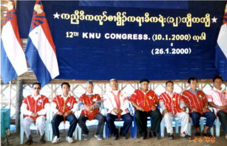
ကေအဲန်ယူ(၁၂)ကြိမ်မြောက် ကွန်ဂရက်မှ ရွေးကောက်တင်မြှောက်လိုက်သော ဗဟိုအလုပ်အမှုဆောင်အဖွဲ့