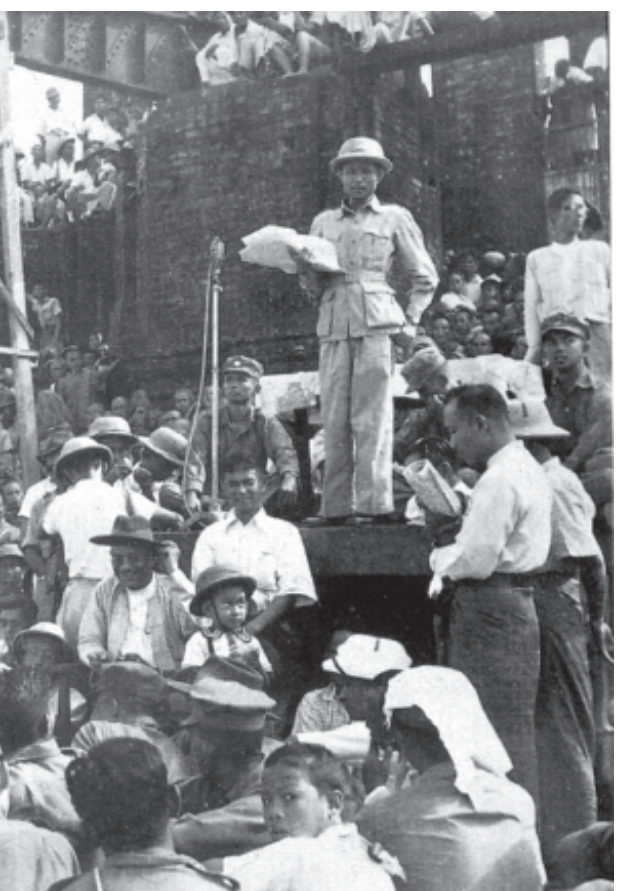
မြန်မာ့လွတ်လပ်ရေးမိသုကာကြီး တပ်မတော်၏ ဖခင်ကြီး ဗိုလ်ချုပ်အောင်ဆန်း ရွှေတိဂုံဘုရား အနောက်ဘက်စောင်းတန်းအဝတွင် တရားဟောပြောနေပုံ

ဘယ်လိုပြာသန့်တော့မလဲ။ ဒီတော့ ကျမတို့အားလုံးဟာ ညီ ညီညွတ်ညွတ်နဲ့ ဆက်ပြီးတော့ ကျမ တို့ ရသင့်ရထိုက်တဲ့ လူ့အခွင့်အရေး များ ရဖို့ အားလုံး ကြိုးစားကြပါ။ နောက်ပြီးတော့ ညီညွတ်မှုကို အဓိက ထားကြပါ။ ဘယ်တော့မဆို ကျမတို့ အခမ်းအနားတွေမှာဆိုလို့ရှိရင် ကျမ အခွင့်အခါ ရတိုင်းရတိုင်း ညီညွတ်မှုကို အဓိကထားပြီး ကျမ ပြောပါတယ်။ ဘာဖြစ်လို့လဲဆိုတော့ ဒါဟာ ကျမတို့ ရဲ့ နိုင်ငံသူ နိုင်ငံသားများရဲ့ အားနည်း ချက်လေးတခု ဖြစ်လို့ပါ။ ညီညွတ်မှု နည်းတယ်ဆိုတဲ့ အားနည်းချက်ကလေး နည်းနည်း ဘယ်လိုခေါ်မလဲ၊ ပုဂ္ဂိုလ် ရေးကို ရှေ့ထားတတ်တာတွေနည်း နည်း မနာလိုသဝန်တိုစိတ်ကလေးတွေ ရှိတတ်တာတွေ၊ သူများ သိပ်ပြီး ကောင်းစားလို့ရှိရင် သိပ်ပြီးတော့ မလို လားတတ်တာလေးတွေ အဲဒီဟာလေး တွေဟာ ကျမတို့ ဒါပုထုဇဉ်လူသား များရဲ့ အားနည်းချက်များလို့ ပြော နိုင်ပေမယ့်လည်း လူ့အသိုင်းအဝိုင်းနဲ့ လည်း ဆိုင်ပါတယ်။ လူမှုရေးစနစ်တွေ နဲ့လည်း အများကြီးဆိုင်ပါတယ်။ ကျမ တို့ရဲ့ လူမှုရေးစနစ်အရ ဒီအားနည်း ချက်ကလေးတွေဟာ ပိုပြီးတော့ရှိတယ် လို့ ကျမမြင်လာပါတယ်။ အထူးသဖြင့် ဒီဆယ်နှစ်ကျော်ကျော်အတွင်း နိုင်ငံ ရေးလုပ်တဲ့အခါမှာ ကျမတို့ရဲ့နိုင်ငံမှာ ညီညွတ်ရေးအားနည်းရတဲ့အကြောင်း အရင်းတွေဟာ ဒါတွေပဲ။ ပုဂ္ဂိုလ်ရေး များလို့ တဦးနဲ့တဦး တိုက်ချင်ခိုက်ချင် အတင်းပြောချင်တဲ့ စိတ်ကလေးတွေ က ရှိလို့ မနာလိုသဝန်တိုတဲ့စိတ်ဓာတ် ကလေးတွေက ရှိလို့၊ အဲတော့ အဲဒီ