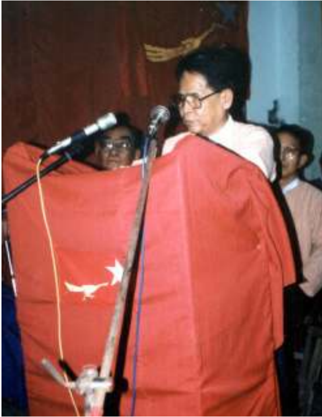
ပြည်သူ့လွှတ်တော်ကိုယ်စားပြုကော်မတီ ဥက္ကဋ္ဌနှင့် အမျိုးသားဒီမိုကရေစီအဖွဲ့ချုပ် ဥက္ကဋ္ဌကြီး ဦးအောင်ရွှေ လွတ်လပ်ရေးနေ့ မိန့်ခွန်းပြောကြားနေစဉ်

ထိုကြေညာချက်ထဲတွင် ထိုင်းနိုင်ငံ (ယခင်ယိုးဒယားနိုင်ငံ)တွင် ဖွဲ့စည်းသည့် ဗမာ့လွတ်လပ်ရေးတပ်မတော်ကြီးမြန် မာပြည်တွင်းသို့ ဝင်ရောက်တိုက်ခိုက် အံ့ဆဲဆဲတွင်တပ်မတော်ဖခင် ကြီး၊ လွတ် လပ်ရေးဗိသုကာကြီးအမျိုးသား အာ ဇာနည်ခေါင်းဆောင်ကြီး ဗိုလ်ချုပ်အောင် ဆန်းပြောကြားခဲ့သည့်“ရဲဘော် တို့ ..... ရဲဘော်တို့သည်မိမိတို့၏အသက်၊သား မယား၊အိုးအိမ်စည်းစိမ်၊ ဥစ္စာပစ္စည်း တို့ကိုစွန့်ပစ်ခဲ့ခွင့်ခံခြင်း မပြုနိုင်ကြ ပါလျှင် ဤဗမာ့လွတ်လပ်ရေးတပ်မ တော်အတွင်းအမှုထမ်းအဖြစ် မဝင် ရောက်စေလိုပါ။ ရဲဘော်တို့ငါတို့မှာစစ် တိုက်ရင်းစားသောက်ကြရန် စားနပ် ရိက္ခာအစားအစာဆိုလို့လုံးဝမရှိဝတ် ဆင်စရာအဝတ်ဆိုလို့လည်းတထည် တပိုင်းမျှမရှိပါကြောင်းမို့လို့ ရဲဘော်တို့ သည် စစ်ပွဲတလျှောက်မှာအိပ်ကြရဖို့ မြေကြီးစားသောက်စရာဆိုလို့ကျောက် ခဲနဲ့သလဲပဲရှိမယ်။ ဒါပဲငါတတ်နိုင်တယ်။ ဒီဗမာ့လွတ်လပ်ရေးတပ်မတော်အ တွင်းဝင်ရောက်စစ်မှုထမ်းကြခြင်း ဖြင့်ရာထူး စသည်အခွင့်အရေးရကြ လိမ့်မယ်၊သူဌေးသူကြွယ်ကြီးများဖြစ်