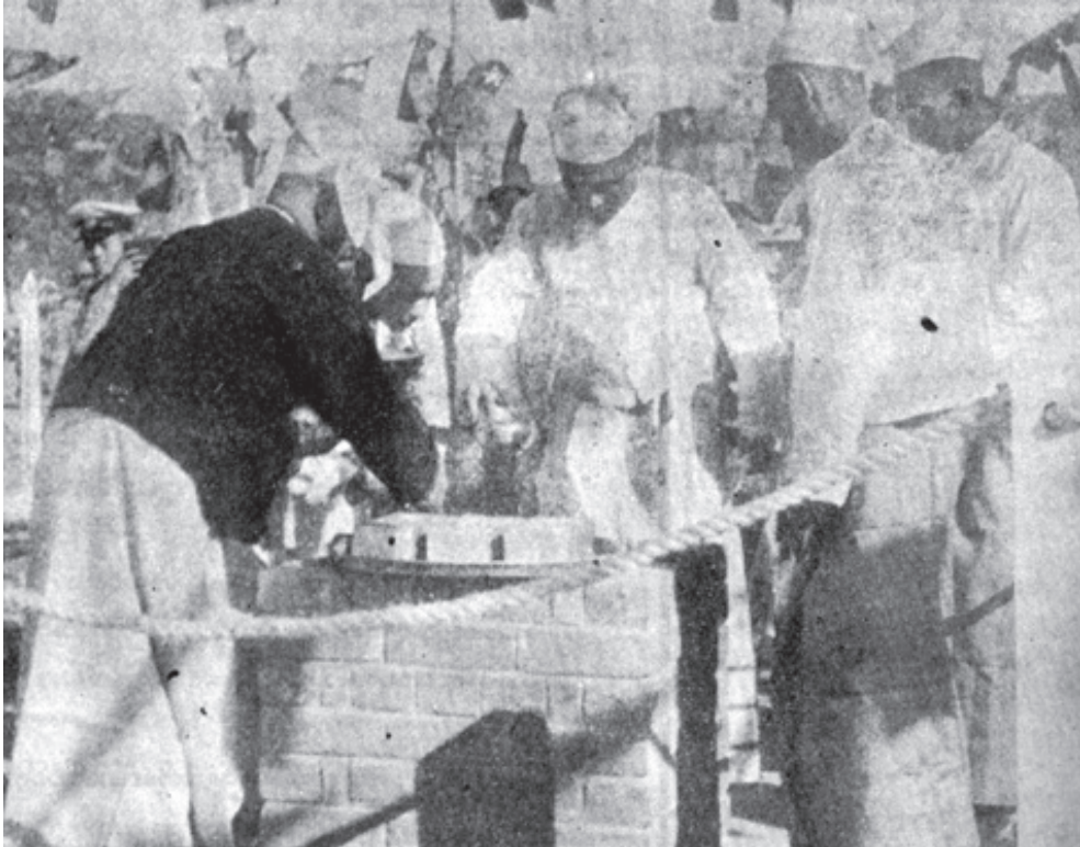
၁၉၄၈ ခုနှစ်၊ ဇန်နဝါရီလ(၄)ရက် တနင်္ဂနွေနေ့က ယခုရန်ကုန်မြို့တွင် ရှိသော မြန်မာ့လွတ်လပ်ရေးကျောက်တိုင်အား ဝန်ကြီးချုပ်ဦးနု အုတ်မြစ်ချခဲ့သည်

“ယနေ့ရရှိတဲ့ လွတ်လပ်ရေးဟာ လူမျိုးရေးတခုတည်းရဲ့လွတ်လပ်ရေး မဟုတ်၊ ပြည်ထောင်စုတခုလုံးမှာ ရှိတဲ့ ရှမ်း၊ ချင်း၊ ကချင်၊ ကရင်၊ ကရင်နီ၊ ကယား၊ ရခိုင်၊ မွန်၊ မြန်မာ အစရှိတဲ့ သွေးချင်းသားချင်း ပြည်ထောင်စုသားတိုင်းရင်းသားလူမျိုးစုအားလုံးတို့ စည်းစည်းလုံးလုံး ကြီးပမ်းခွဲသောကြောင့် ရရှိလာသော လွတ်လပ်ရေးဖြစ်တဲ့အတွက် ယခုလွတ်လပ်ရေးဟာ ရှမ်း၊ ကချင်၊ ကရင်၊ ကရင်နီ၊ ကယား၊ ရခိုင်၊ မွန်၊ မြန်မာအစရှိတဲ့ မွေးချင်းသားချင်း ပြည်ထောင်စုသားလူမျိုးစုအားလုံးရဲ့ လွတ်လပ်ရေး ဖြစ်တယ်”