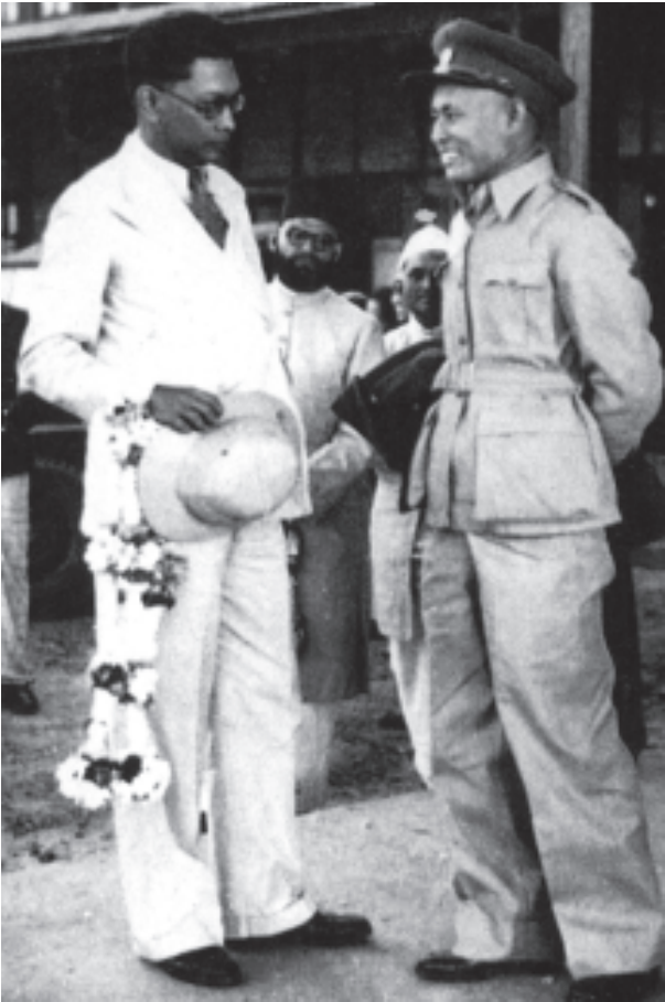
မြန်မာနိုင်ငံ လွတ်လပ်သည့် သတင်းအေဂျင်စီမှ ထုတ်ဝေသည့်

ကိုယ်ဟာ မေတ္တာထားတယ် ကိုယ်ဟာ ဂရုဏာထားတယ်။ ကိုယ်ဟာ သက်ညှာတယ်ဆိုတာကိုတော့ ကိုယ်တိုင်ပြောသင့်တဲ့ကိစ္စ မဟုတ်ပါဘူး။ ဒါဟာ ကျန်တဲ့သူတွေက ဆုံးဖြတ်မှာပါ။ ဒီတော့ ကျမတို့ဘက်ကတော့ ကျမတို့ကိုဘယ်သူကနေပြီးတော့ ကျေးဇူးတင်ရမယ်လို့ ကျမတို့ ပြောစရာ မဟုတ်ဘူး။ ကျမတို့ ကျေးဇူးတင်ထိုက်တဲ့သူတွေကိုသာ ကျေးဇူးတင်လိုက်မှာပါ။ ဒါကြောင့်မို့လို့ ကိုထွန်းဇော်ဇော်လို စိတ်ဓာတ်ခိုင်ခိုင်မာမာနဲ့ ကျမတို့ရဲ့ ဒီမိုကရေစီရေးအတွက် လုပ်ပေးနေတဲ့ လူငယ်တွေအထိ အားလုံးကို ကျေးဇူးတင်ပါတယ်။