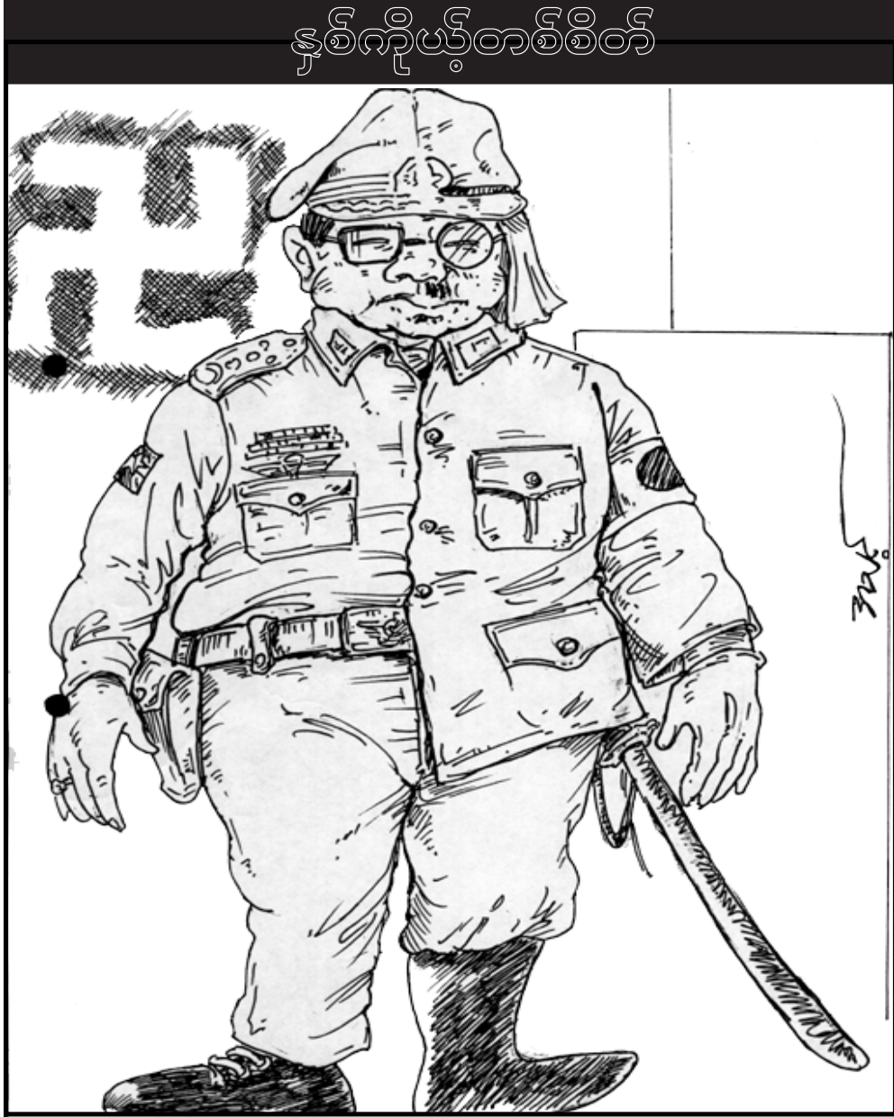
မြန်မာနိုင်ငံ လွတ်လပ်သည့် သတင်းအေဂျင်စီမှ ထုတ်ဝေသည်။

ကြီးစွာ ထား၍ ပန်ကြားအပ်ပါသည်။ ဤသို့ မွန်မြတ်လှသော အမျိုးသားပြန်လည်သွေးစည်းညီညွတ်ရေးအတွက် လက်တွေ့လုပ်ဆောင်ကြခြင်းသည်သာ စစ်မှန်သောပြည်ထောင်စုစိတ်ဓာတ်နှင့် မျိုးချစ်စိတ်ဓာတ် အစစ်အမှန် ဖြစ်ပါကြောင်း ထပ်လောင်း နှိုးဆော်အပ်ပါသည်။ ၁၁။ ဗုဒ္ဓ၏ နိပါတ်တော်တွင် ဘုရားလောင်း ဗုဒ္ဓသည် လောကုတ္တံလောသော မီးဘေးအန္တရာယ် တားဆီးကာကွယ်ရန်အတွက် မှန်ကန်သော သစ္စာစကားဆိုခြင်းဖြင့် အောင်မြင်စွာ တားဆီးခဲ့သော ထုံးကို နှလုံးမူ၍ ပြည်ထောင်စုမြန်မာနိုင်ငံတော်၏ အနာဂတ်ငြိမ်းချမ်းသာယာရေးနှင့် စီးပွားရေးဖွံ့ဖြိုး တိုးတက်ရေးအတွက် လည်းကောင်း၊ မကောင်းသောအနိဌာ ဘေးရန်အန္တရာယ်များမှ တားဆီးကင်းဝေးစေရန်အတွက်လည်းကောင်း၊ ကျွန်ုပ်တို့ နိုင်ငံရေးဝါရံသက်ကြီးပုဂ္ဂိုလ်များက အောက်ပါအတိုင်း မှန်ကန်သော သစ္စာစကားကို ရွတ်ဆို တိုင်တည်လိုက်ပါသည်။ “ယနေ့ပြည်ထောင်စု မြန်မာနိုင်ငံတော်၏ ကျပ်တည်းမှု ဒုက္ခအခက်အခဲများကို အောင်မြင်စွာ ကျော်လွှားဖြေရှင်းနိုင်ရန် တခုတည်းသော နည်းလမ်းမှာ (ဝါ) ထွက်ရပ်လမ်းမှာ အမျိုးသားချင်း ပြန်လည်သင့်မြတ်ရေးကို အခြေခံသည့် အမျိုးသားချင်း တွေ့ဆုံဆွေးနွေး ဖြေရှင်းရေးနည်းလမ်းဖြင့် အမျိုးသားသွေးစည်းညီညွတ်မှု ထူထောင်ရေးသည် မရှိမဖြစ်လိုအပ်သော အဓိက သစ္စာတရား ဖြစ်ပါသည်။ ထိုသစ္စာတရားကြီး အောင်မြင်စွာ အကောင်အထည်ဖော်နိုင်ရန်အတွက် ကျွန်ုပ်တို့သည် မည်သည့် ကိုယ်ကျိုးစီးပွားကိုမျှ မမျှော်လင့်ပဲ ရိုးသားတည်ကြည်စွာဖြင့် အမျိုးသားချင်း တွေ့ဆုံဆွေးနွေးရေးဖြစ်မြောက်ရန်အလို့ငှာ နိုင်ငံနှင့် ပြည်သူ့အကျိုး ရွေးရွဲလျက် ဆောင်ရွက်ခဲ့ကြခြင်း ဖြစ်ပါသည်။ ဤမှန်ကန်သော သစ္စာစကားကို အကျွန်ုပ်တို့ ရွတ်ဆိုတိုင်တည်ရသည့် အတွက် အမျိုးသားချင်း တွေ့ဆုံဆွေးနွေး ဖြေရှင်းပွဲကြီး အောင်မြင်စွာ ထွန်းပေါ်ပေစေတည်း။ ❖