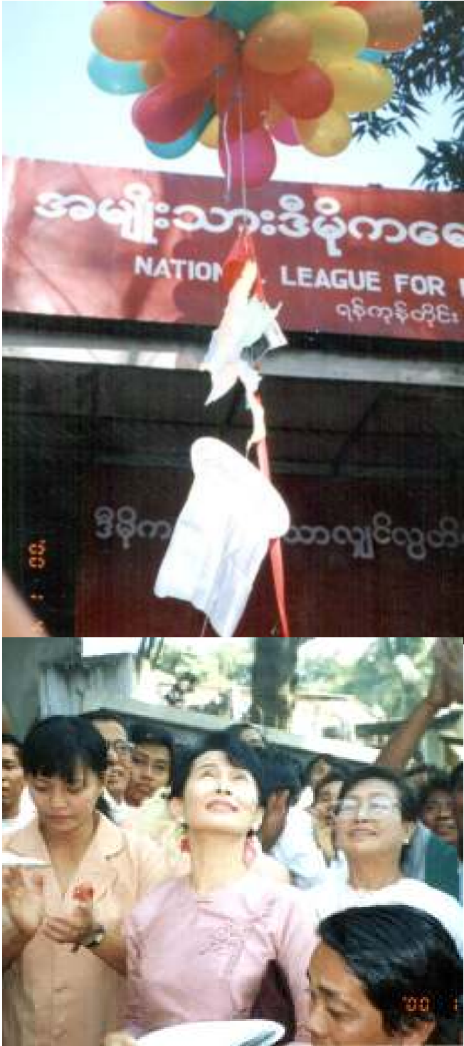
မြန်မာပြည် မြေပုံနှင့် အမျိုးသားဒီမိုကရေစီအဖွဲ့ချုပ် အလံတော်အား မိုးပျံပေါင်းများနှင့်အတူ အထွေထွေအတွင်းရေးမှူး ဒေါ်အောင်ဆန်းစုကြည်ကိုယ်တိုင် လွတ်လပ်ရေးနေ့က လွှတ်တင်နေစဉ်

ပြုရန်နိုင်ငံပိုင်လုပ်ငန်းများကို ပုဂ္ဂလိကလက်သို့လွှဲပြောင်းရန်၊ အစိုးရကဆက်လက်လက်ဝယ်ထားလိုသောလုပ်ငန်းများကိုပြုပြင်သွားရန်တို့ ဖြစ်ကြောင်း၊ ကမ္ဘာ့ဘဏ်စစ်တမ်းတွင်အရှေ့အာရှနိုင်ငံများ၏သက်တမ်းကိုတွက်ချက်ကြည့်ရာမှာ မြန်မာနိုင်ငံပြည်သူတို့၏သက်တမ်းသည်တိုးတက်မှုမရှိဘဲဆုတ်ယုတ်လာခြင်း၊ကလေးသူငယ်များ၏သက်တမ်းလျော့နည်းလာပြီး၊သေပျောက်မှုနှုန်းတိုးလာခြင်းကိုတွေ့ရသဖြင့်အရေးကြီးနေသောအခြေအနေဖြစ်ကြောင်း။ ယနေ့မြန်မာနိုင်ငံ၏ လက်ရှိအခြေအနေသည် ပြည်သူလူထုအတွင်းလူမှုဆက်ဆံရေးများပျက်ယွင်းကာ ယုံကြည်