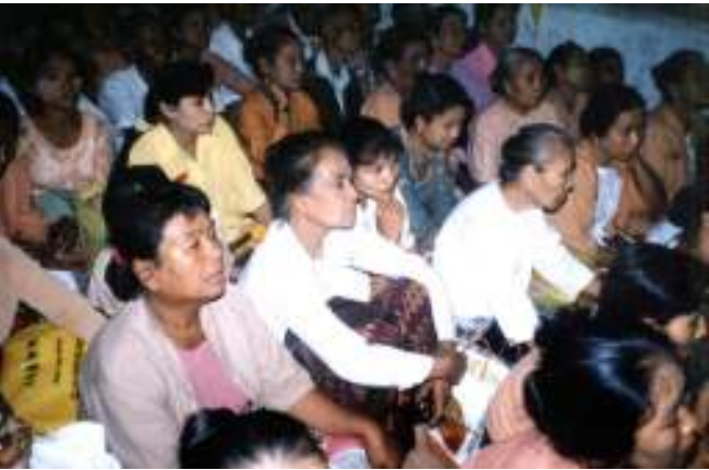
မြို့နယ်ပေါင်းစုံမှ အဖွဲ့ချုပ် အဖွဲ့ဝင်များ