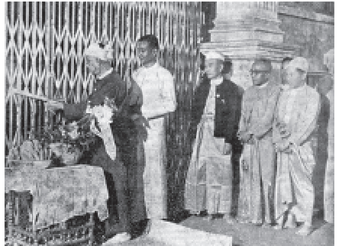
၁၉၅၃ ခု ဇန်နဝါရီလ(၃)ရက်နေ့က ရွှေတိဂုံဘုရား မြောက်ဘက်စောင်းတန်း တံခါးမသစ်ကြီးကို ပဉ္စမနှစ်ပတ်လည် လွတ်လပ်ရေးပွဲသဘင် ကျင်းပရေးကော်မတီ၏ ဒုတိယသဘာပတိ စကားစော်ဘွားကြီးက ဖွင့်လှစ်ပေးနေပုံ

တိုင်းပြည်လွတ်လပ်ခဲ့သော အသီးအပွင့်ကို လက်ဝါးကြီးအုပ်ထားပြီး၊ လူထုဘဝအား နင်းချေကာ ကျွန်တော်သွင်းနေသည့် စစ်အာဏာရှင်စနစ် အမြစ်ပြတ်ရေးအတွက် ကျွန်တော်တို့အားလုံး ဒုတိယလွတ်လပ်ရေးတိုက်ပွဲခရီးကို အမြန်ဆုံးနည်းဖြင့် ထမ်းရွက်ကြရဦးမည် မဟုတ်ပါလား။