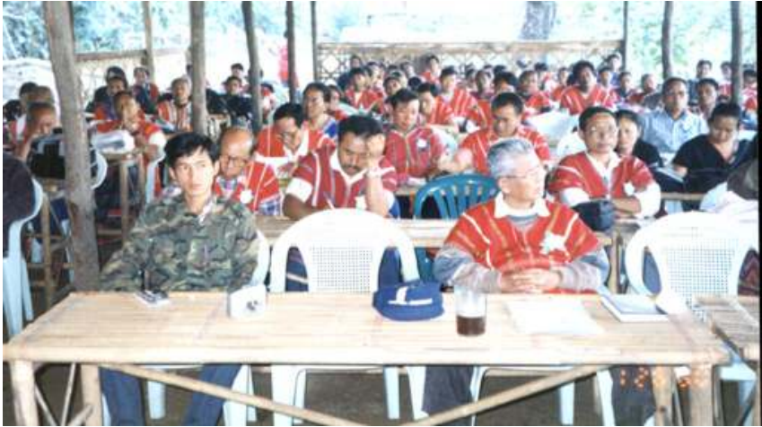
ကရင်အမျိုးသားအစည်းအရုံး(၁၂)ကြိမ်မြောက် ကွန်ဂရက်ကျင်းပနေစဉ်

ထို့ပြင် ယနေ့ကျင်းပသော (၁၂)ကြိမ်မြောက် ကရင်အမျိုးသားအစည်းအရုံးကွန်ဂရက်မှနေ၍ ကရင်အမျိုးသားထုတရပ်လုံး စည်းလုံးညီညွတ်ကြပြီး ကေအဲန်ယူနှင့်အတူ အဓိဌာန်ခိုင်မာစွာဖြင့် ဆက်လက်တိုက်ပွဲဝင်သွားကြရန် နှိုးဆော်လိုက်ပြီး နအဖ စစ်အုပ်စုအား ကရင်အမျိုးသားများအပေါ် ရက်စက်စွာ စစ်ဆင်နေခြင်းကို အမြန်ရပ်ဆိုင်း၍ ကေအဲန်ယူနှင့် အနှစ်သာရရှိသည့် တွေ့ဆုံဆွေးနွေးမှု ပြုလုပ်ရန် အလေးအနက် တိုက်တွန်းပါကြောင်း အဆိုပါကွန်ဂရက်၏ ထုတ်ပြန်ကြေညာချက်ထဲတွင် ဖော်ပြပါရှိပါသည်။ ❖