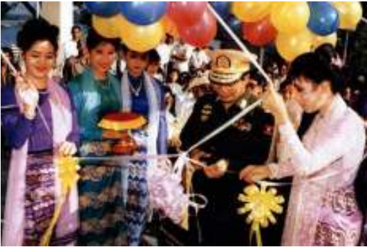
စားရိတ်စကကြီးမားစွာ၊ချွေရံသင်းပင်းများစွာဖြင့် တက္ကသိုလ်ဖွင့်ပွဲပြုလုပ်ခဲ့သော၊ပညာရေးကော်မတီဥက္ကဋ္ဌကြီး တက္ကသိုလ်ကျောင်းများဖွင့်ဖို့.မေ.နေပြီ