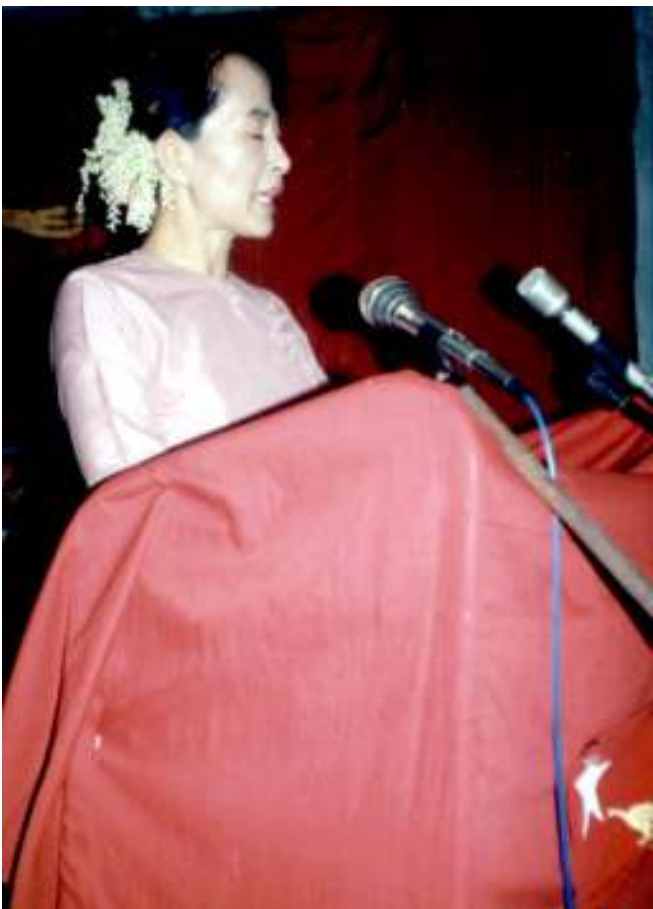
(၅၂)နှစ်မြောက် မြန်မာ့လွတ်လပ်ရေးနေ့တွင် အမျိုးသားဒီမိုကရေစီအဖွဲ့ချုပ် အထွေထွေအတွင်းရေးမှူး ဒေါ်အောင်ဆန်းစုကြည် မိန့်ခွန်းပြောကြားနေစဉ်

တမ်းတပ်မတော်ဖြစ်သောဗမာ့တပ်မတော်အဖွဲ့အစည်းပေါ်ပေါက်လာခြင်းအစရှိသည့်တိုက်ပွဲ အဆင့်ဆင့်ဖြင့်အပြင်းအထန်ရုန်းကန်ခဲ့ကြရကြောင်း။ ဖက်ဆစ်တော်လှန်ရေးကြီးကိုအောင်မြင်စွာ ဆင်နွှဲလိုက်နိုင်ခြင်းကြောင့် မြန်မာအမျိုးသားတို့၏ စွမ်းရည်သတ္တိကိုကမ္ဘာကမလွဲသာ မရှောင်သာဘဲလေးစားခန့်ငြားလာကြသည့်အပြင် ဗိုလ်ချုပ်အောင်ဆန်းသည်မြန်မာနိုင်ငံ၏ခေါင်းဆောင်စစ်စစ်ဖြစ်ကြောင်းအထင်အရှားသက်သေပြခဲ့ရာ ဗိုလ်ချုပ်အောင်ဆန်း၏ခေါင်းဆောင်မှုအောက်တွင် မြန်မာတမျိုးသားလုံး သွေးစည်းညီညွတ်စွာဖြင့် လွတ်လပ်ရေးအောင်ပန်းကိုဆွတ်လှမ်းရန်စိတ်ထက်သန်လျက်ရှိနေကြကြောင်း။ ဒုတိယကမ္ဘာစစ်ကြီးဒဏ်ကြောင့် ချိန့်နေသော ဗြိသိသျှနယ်ချဲ့သည်လက်အောက်ခံနိုင်ငံတို့အားနိုင်နင်းစွာ မအုပ်ချုပ်နိုင်တော့ရာ မြန်မာ့လွတ်လပ်ရေးအတွက်လက်နက်ကိုင်တိုက်ပွဲဝင်ရန်မလိုအပ်တော့ဘဲစေ့စပ်ဆွေးနွေးညှိနှိုင်းရေးလမ်းစဉ်ကို ရှေ့တန်းတင်ဆောင်ရွက်ရမည်ဟု ဗိုလ်ချုပ်အောင်ဆန်းနှင့် တကွခေါင်းဆောင်များသဘောပေါက်ကြပြီးလိုအပ်ပါက လက်နက်ကိုင်တိုက်ပွဲဆင်နွှဲရန်လည်း အဆင်သင့်ရှိခဲ့ကြောင်း။ ၁၉၄၅ နှစ်တွင် “နေသုဇိန်”လူထုအစည်းအဝေးကြီးခေါ်ယူ၍ဗြိတိသျှတို့၏စက္ကူဖြူစိမ့်ကိန်းကိုကန့်ကွက်ဟန့်တားပြီးရွှေတိဂုံအလယ်ပစ္စယံ၊ ကန်တော်မင်္ဂလဒ်မြို့ လူထုအစည်းအဝေး