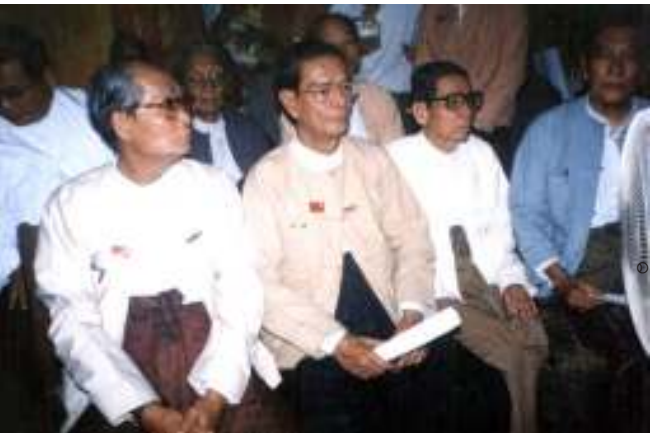
ပြည်သူ့လွှတ်တော်ကိုယ်စားပြုကော်မတီဝင်များနှင့် တက်သိပညာရှင်များ