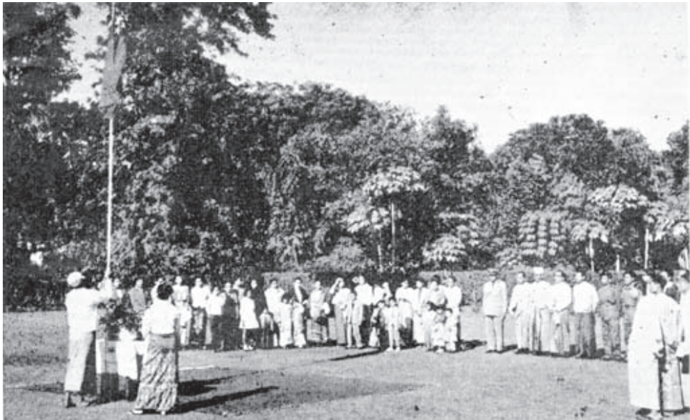
(၁၃)နှစ်မြောက် မြန်မာ့လွတ်လပ်ရေးနေ့အခမ်းအနားအား အိန္ဒိယနိုင်ငံ နယူဒေလီမြို့ရှိ မြန်မာသံရုံးတွင် ကျင်းပရာ ထိုစဉ်က အိန္ဒိယနိုင်ငံဆိုင်ရာ မြန်မာသံအမတ်ကြီး ဒေါ်ခင်ကြည် ပြည်ထောင်စုမြန်မာနိုင်ငံတော်အလံ လွှင့်တင်နေသည်ကို ကြည့်ရှုနေစဉ်နှင့် မြန်မာသံရုံးဝန်ထမ်းများ

သ ဓိ င် ၊ ဝ င် ညံ ရ င် မျ ဝ ၊ အ မှ ဝ် (၈)