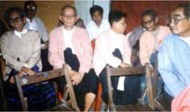
မြန်မာ့လွတ်လပ်ရေးနေ့တွင် ပါဝင်ခဲ့ကြသော သခင်ဟောင်းကြီးများ