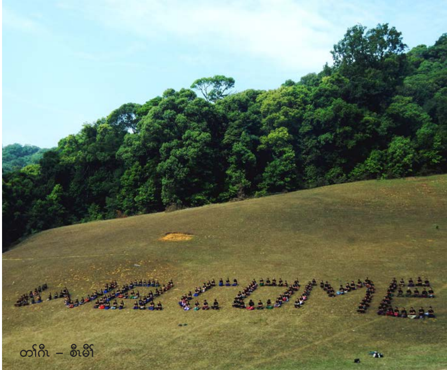
တၢ်ဂီၤ - စိၤဖိၢ်