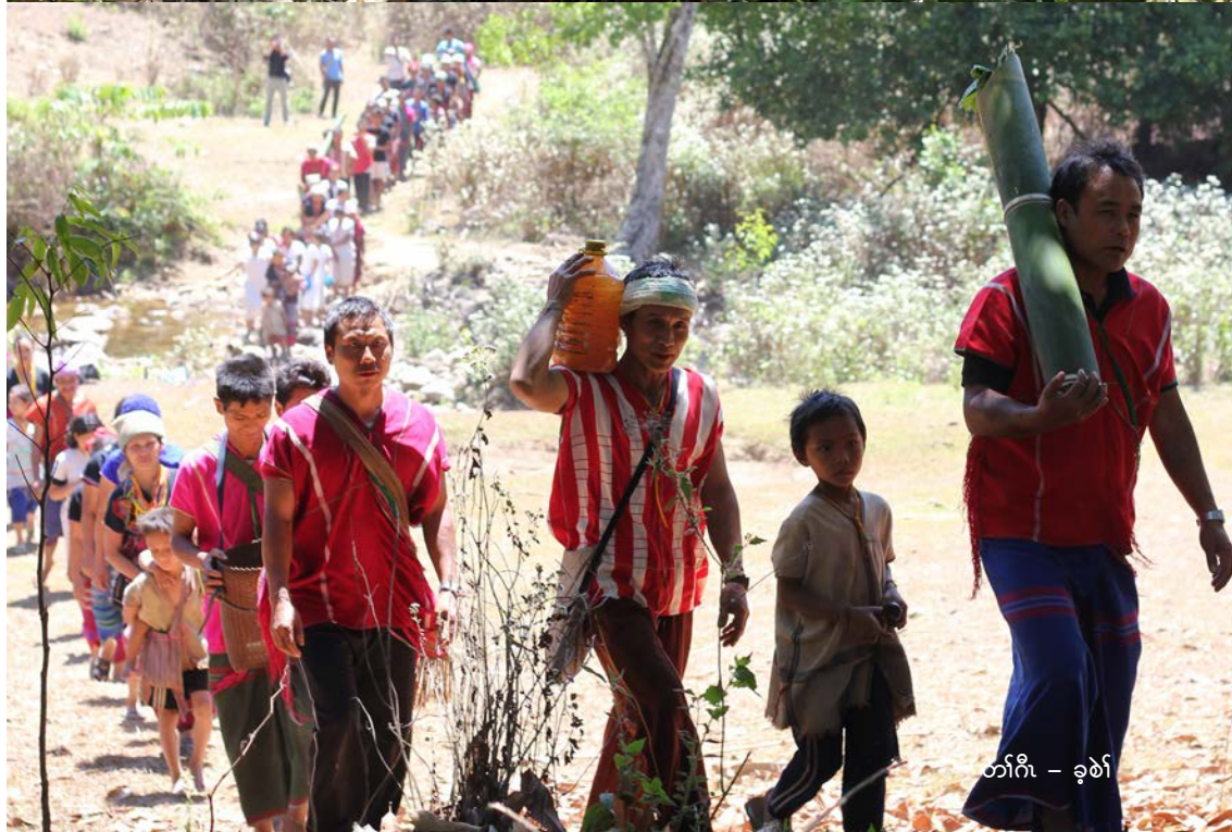
တၢ်ဂီၤ - ခုၣ်စၢ်