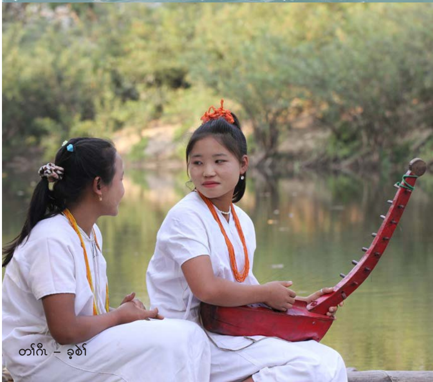
တၢ်ဂီၤ - ခုၤစဲၢ်