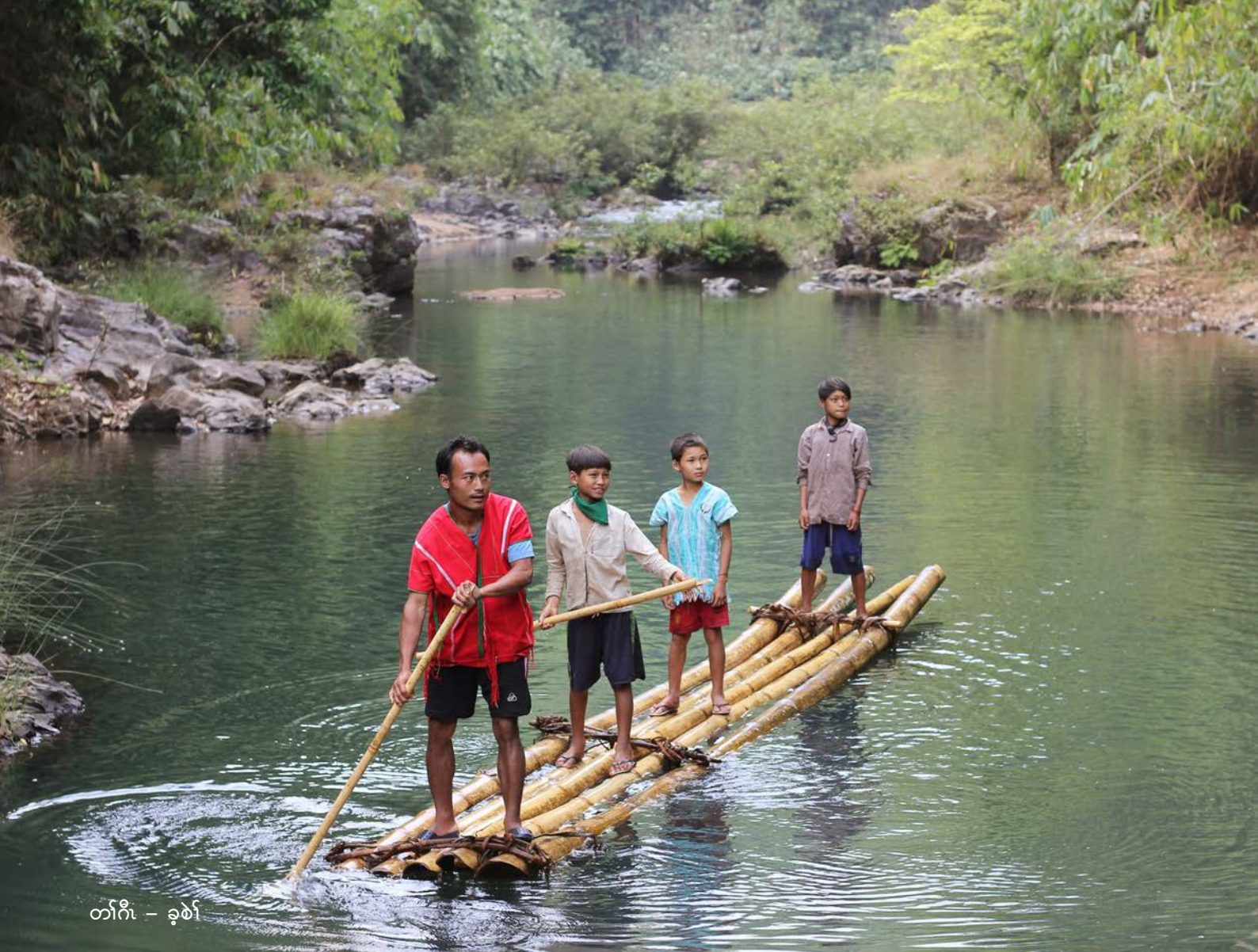
တၢ်ဂီၤ - ခုၤ