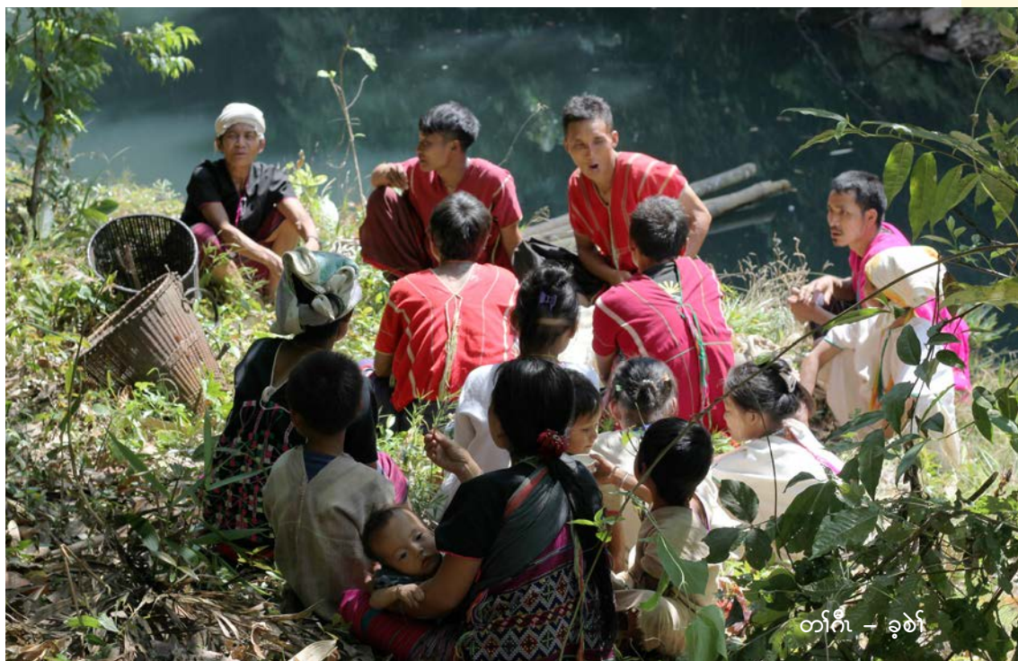
တၢ်ဂီၤ - ခုၣ်စၢ်

ဆၢၣ်ဖိကီၢ်ဖိမံၤလၢ အတၢ်အိၣ်ဆိးအလီၢ်အကျဲၤ သ့ၣ်တဖၣ် ဆဲးအိၣ်သ့ၣ်ဒီးလၢ ကညိကီၢ်ပုၤအံၤန့ၣ်မ့ၢ်တၢ်အုၣ် သးတခါလၢအပၤဖျါထီၣ်ဝဲ ဒၣ်တၢ်ကူၣ်သ့ၣ်ဒီးတၢ်သ့ၣ်ညါ နီၣ်ပၢ်ဘၣ်ထွဲဒီး “ကီၢ်” တၢ် ဖဲးတၢ်မၤအကျိၤအကျဲၤဒီးအ သန့သ့ၣ်တဖၣ်အယီၤန့ၣ်လီၤ. ယိၣ်လိာ်တၢ်မုၢ်တၢ်ခၢ်ကရၢ် စုၤလီၤဆိတၢ်မၤအပုၤပၤပုၤ ဒီး “ကီၢ်” (၈၃) ဘုၣ် ဒီးအ တၢ်ပညိၣ်တခါမ့ၢ်ဝဲဒၣ် တၢ် ဒီးသအဒီးတၢ်မၤမူမၤဂၤထီၣ်က့ၤ “ကီၢ်” အသန့လၢလီၢ်ကဝီၤ ပုၤတတၢ်သ့ၣ်တဖၣ် အကျိၤဒ် အမ့ၢ်တၢ်ယုထၢအကျဲၤလၢအ ယုၣ်ကၤတခါ လၢကခီဆၢ ဝဲဒၣ်တၢ်ဂုၤထီၣ်ပသီထီၣ်တၢ် တိာ်ကျဲၤလၢအကတကီၢ်ဒိၣ် သ့ၣ်တဖၣ်အဂီၢ်, ဒီးမ့ၢ်စ့ၢ် ကိးကျဲၤတဘိလၢပုၤဘၣ်ကီ ဘၣ်ခဲဒီးပုၤလီၢ်အိၣ်ကမ့ၢ်သ့ၣ် တဖၣ် ကဟဲက့ၤအိၣ်ဆိးက ဒါက့ၤလၢကညိကီၢ်ဖဲၣ်အပုၤ လၢအတအိၣ်ဒီးတၢ်မၤဟးဂီၤ ဝဲဒၣ်ခိၣ်ယၤန့ၣ်ဆၢၣ်ဒိၣ်ဒိၣ်မ့ၢ် မုၢ်တဂ့ၤအဂီၢ်န့ၣ်လီၤ.