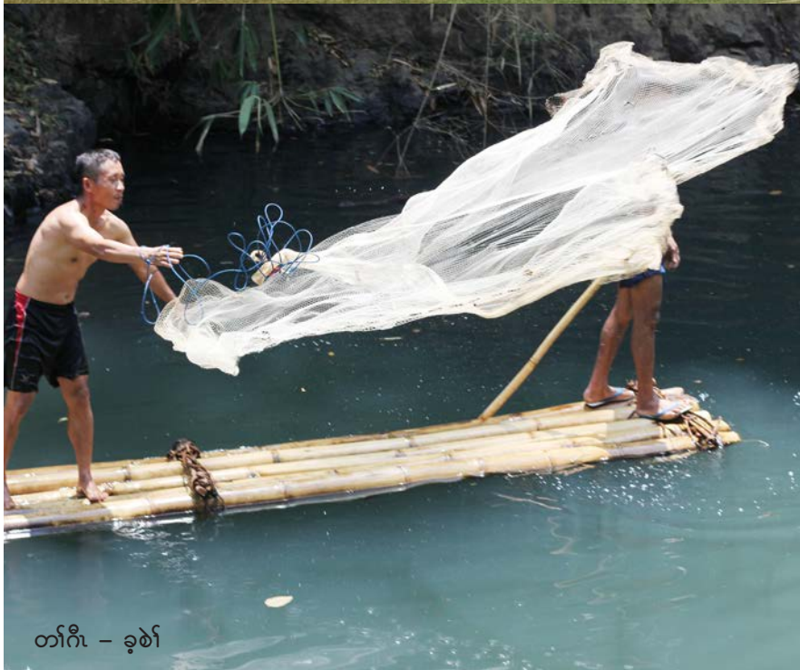
တၢ်ဂီၤ - ခုၤစဲၢ်