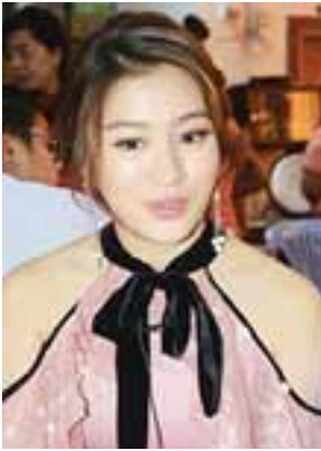
အကယ်ဒမီ ဝတ်မှုန်ရွှေရည်

ဒီဇာတ်ကားမှာ ဆရာကြီး ဒေါက်တာခင်မောင်ဝင်းရဲ့ အမေနေရာက သရုပ်ဆောင်ရတာဆိုတော့ တာဝန်ယူမှုအပိုင်းက အလွန်ကို တာဝန်ကြီးပါတယ်။ အမေဆိုတာ သားသမီးအားလုံးကို ချစ်ပါတယ်။ တချို့ အမေတွေကျတော့ သားသမီးတွေ မျှော်လင့်ချက်ရှိတဲ့ သားသမီးကို ပိုပြီးတော့ သံယောဇဉ်ရှိမှာပေါ့။ အမေဖြစ်စေချင်တာကို နားလည်ကြတဲ့ သားတွေကလည်း အမေ့ကိုပိုပြီး သံယောဇဉ်တွယ်တာပေါ့။ ဒီအမေနဲ့ ဒီသားမှာ အမေကလည်း ဂိုက်လိုင်းပေးတာ အရမ်းကောင်းတယ်။ အမေက မျှော်မှန်းချက်အရမ်းကြီးတဲ့ အခါကျတော့ ခံယူတဲ့သားသမီးတွေကလည်း အရမ်းတာဝန်ကြီးတယ်။ တချို့သားသမီးတွေက မခံယူဘူး။ တချို့သားသမီးတွေက ခံယူကြတယ်။ ဒီမိသားစုမှာ အမေနဲ့သားတွေက လိုက်ဖက်ညီတယ်။ အမေက စည်းကမ်းကြီးတယ်။ ရည်ရွယ်ချက်ကြီးတယ်။ သားသမီးတွေကလည်း လိုက်နာတဲ့ အခါကျတော့ အောင်မြင်တဲ့ မိသားစုဖြစ်တာပေါ့။ ဒါကြောင့် ဆရာရဲ့ မိသားစုက စံပြမိသားစုလို့ ပြောလို့ရပါတယ်။ ဒီကားဟာ မိဘဖြစ်လာမယ့်