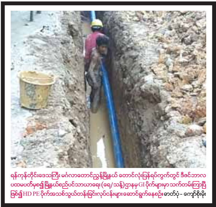
ရန်ကုန်တိုင်းဒေသကြီး မင်္ဂလာတောင်ညွန့်မြို့နယ် တောင်လုံးပြန်ရပ်ကွက်တွင် ဒီဇင်ဘာလ ပထမပတ်မှစ၍ မြို့နယ်စည်ပင်သာယာရေး (ရေ/သန့်)ဌာနမှ GI ပိုက်များမှာ သက်တမ်းကြာပြီ ဖြစ်၍ HD PE ပိုက်အသစ်သွယ်တန်းခြင်းလုပ်ငန်းများဆောင်ရွက်နေစဉ်၊ တာဝံပုံ - ကျော်စိုးမိုး

အင်ဂျင်နီယာဌာန (လမ်းနှင့် တံတား) ဦး ဆောင်မှုနဲ့ ဆောင်ရွက်ပေးလို့ ရဟန်းရှင်လူ သက်ကြီးရွယ်အို ကျောင်းသား၊ ကျောင်းသူ များ သွားလာမှုလွယ်ကူချောမွေ့တော့မှာဖြစ် သလို မြေဥယျာဉ်စိုက်ပျိုးရေးမြို့ထွက် ဟင်းသီး ဟင်းရွက်များ ထိစပ်မြို့နယ်ဈေးများသို့ မြန် ဆန်သွက်လက်စွာ ဖြန့်ဖြူးရောင်းချနိုင်ပြီး မိသားစု စားဝတ်နေရေးလည်း အဆင်ပြေ ချောမွေ့ကြမှာဖြစ်ကြောင်း ဌာနေရပ်မိရပ်ဖ ဦးဝက ပြောသည်။ ဒီသဇင်လမ်းမကြီးက ပျက်စီးပြီး ချိုင့်ခွက် တွေလည်းများတယ်၊ လမ်းသားမြေခံညှိမှု လုပ်ငန်း ဦးစားပေးဆောင်ရွက်ရတယ်၊ ဒါမှ စံချိန်စံညွှန်းပြည့် နှစ်ရှည်ခံ ကွန်ကရစ်လမ်း ဖြစ်အောင် ပေါင်းစပ်ပြီး လုပ်ငန်းများဆောင် ရွက်နေကြောင်း တာဝန်ခံတစ်ဦးက ပြော သည်။ ထွန်းဝင်း