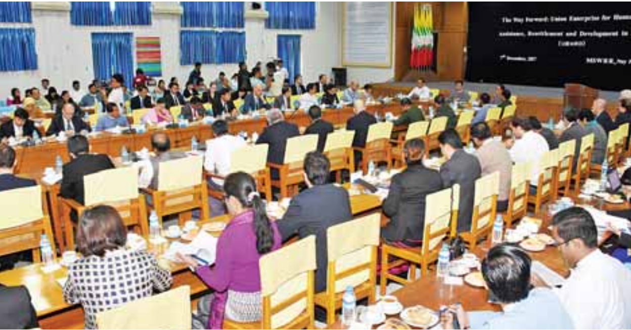
UEHRD စီမံကိန်းအား သံတမန်များနှင့် ကုလသမဂ္ဂအဖွဲ့အစည်းများသို့ ရှင်းလင်းအသိပေးခြင်းအခမ်းအနားကို လူမှုဝန်ထမ်း၊ ကယ်ဆယ်ရေးနှင့် ပြန်လည်နေရာချထားရေးဝန်ကြီးဌာန အစည်းအဝေးခန်းမ၌ ကျင်းပစဉ်။