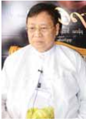
ပါမောက္ခဒေါက်တာခင်မောင်ဝင်း (အသည်း)

အမေဇာ ကြီးမားသည့် မေတ္တာတရားများကို ဖော်ကျူးပြီး အမေ့ကိုချစ်သည့် သားတစ်ယောက်အနေဖြင့် ခံစားရေးဖွဲ့ သီကုံးထားသော ပါမောက္ခ ဒေါက်တာခင်မောင်ဝင်း(အသည်း)၏ (ဝတ္ထု) ဘဝဖြစ်ရပ်မှန်ဇာတ်လမ်းကို ဒါရိုက်တာ ထပ်ဆင့်အကယ်ဒမီ စင်ရော်မောင်မောင်၊ ဇာတ်ညွှန်း မိုးနီလွင်တို့က ပုံဖော်ရိုက်ကူးထားပြီး ထပ်ဆင့်အကယ်ဒမီများ ဖြစ်ကြသည့် နေတိုး၊ ဝတ်မှုန်ရွှေရည်၊ ရဲအောင်၊ မေသန်းနု၊ ထွန်းကိုကိုနှင့် သရုပ်ဆောင်များစွာ ပါဝင်ထားသော “ထာဝရအမေ” ရုပ်ရှင်ဇာတ်ကားကြီးကို ဒီဇင်ဘာ ၈ ရက်တွင် အဆင့်မြင့်ရုပ်ရှင်ရုံကြီးများ၌ ရုံတင်ပြသသွားမည် ဖြစ်သည်။ အထူးပွဲပြသမှုအနေဖြင့် ဒီဇင်ဘာ ၆ ရက် နံနက် ၇ နာရီက သမ္မတရုပ်ရှင်ရုံတွင် ပြသခဲ့ရာ အဆိုပါ ရုပ်ရှင်ဇာတ်ကားတွင် ပါဝင်သရုပ်ဆောင်ထားသော အနုပညာရှင်များနှင့် တွေ့ဆုံမေးမြန်းမှုများကို ဖော်ပြလိုက်ရပါသည်။