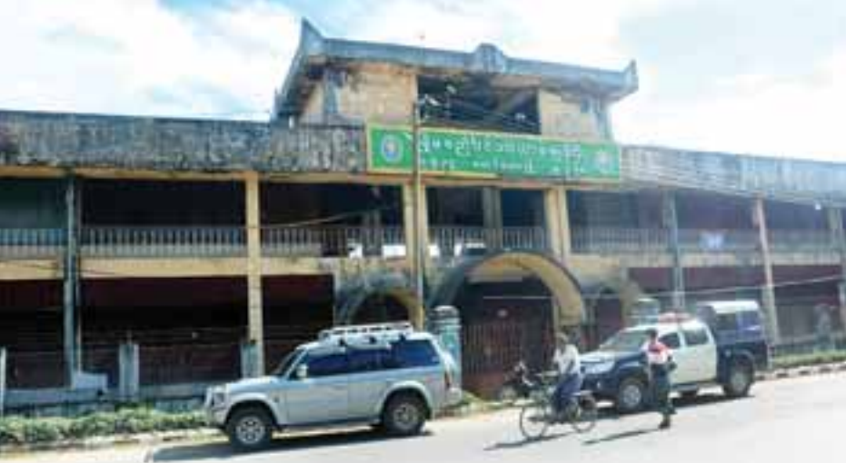
ပြန်လည်ဖွင့်လှစ်တော့မည့် မောင်တောမြို့မစည်ပင်သာယာရေးကြီးကို တွေ့ရစဉ်။

ဩဂုတ် ၂၅ ရက်က ဖြစ်ပွားခဲ့သော ARSA အစွန်းရောက်အကြမ်းဖက်သမားများ၏ တိုက်ခိုက်မှုဖြစ်စဉ်ကြောင့် ယာယီပိတ်ထားခဲ့သော မောင်တောမြို့မစည်ပင်သာယာရေးကြီးကို လုံခြုံရေးပိုင်းဆိုင်ရာရှုထောင့်အရ ပြည်သူများအေးချမ်းစွာ ဝယ်ယူရောင်းချနိုင်ရန်ရည်ရွယ်၍ လုံခြုံရေးကင်မရာ(CCTV)များကို မောင်တောစည်ပင်သာယာရေးကော်မတီက တပ်ဆင်ပေးလျက်ရှိပြီး မကြာမီ ပြန်လည်ဖွင့်လှစ်ပေးနိုင်ရန် စီစဉ်လျက်ရှိသည်။ မောင်တောမြို့မစည်ပင်သာယာရေးကြီး၌ အတွင်း၊ အပြင် လုံခြုံရေးကင်မရာ (CCTV) ၂၄ လုံး တပ်ဆင်ပေးသွားမည်ဖြစ်ပြီး သား၊ ငါးဈေးပိုင်းဘက်တွင်လည်း ထပ်မံတိုးချဲ့ကာ CCTV ရှစ်လုံးတပ်ဆင်ပေးသွားမည်ဖြစ်၍ စုစုပေါင်း CCTV ၃၂ လုံး တပ်ဆင်ပေးသွားမည်ဖြစ်ကြောင်း သိရသည်။ “ဩဂုတ် ၂၅ ရက် အကြမ်းဖက်ဖြစ်စဉ်နဲ့ ပတ်သက်ပြီး မောင်တောဒေသမှာ ဈေးတွေကို ယာယီပိတ်ထားရတာတွေရှိတယ်၊ အဲဒီဈေးတွေမှာ တချို့ကို