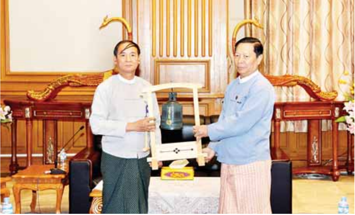
ပြည်သူ့လွှတ်တော်ဥက္ကဋ္ဌ ဦးဝင်းမြင့်ထံ ပြည်ထောင်စုဝန်ကြီး သူရဦးအောင်ကိုက ငြိမ်းချမ်းရေးခေါင်းလောင်း လွှဲပြောင်းပေးအပ်စဉ်။

ရှေးဦးစွာ ကုလသမဂ္ဂ ငြိမ်းချမ်းရေး ခေါင်းလောင်းနှင့် စပ်လျဉ်း၍ သာသနာရေးနှင့် ယဉ်ကျေးမှုဝန်ကြီးဌာန ပြည်ထောင်စုဝန်ကြီး သူရဦးအောင်ကိုက ကုလသမဂ္ဂ ငြိမ်းချမ်းရေး ခေါင်းလောင်းသည် ဂျပန်နိုင်ငံသား Chiyoji Nakagawa က ငြိမ်းချမ်းရေးကို အမြဲအမှတ်ရနေစေရန် နိုင်ငံပေါင်း ၆၀ ကျော်မှ ဒဂိုဗျား၊ ကြေးတံဆိပ်များ၊ သတ္တုများကို စုဆောင်း၍ ငြိမ်းချမ်းရေး ခေါင်းလောင်း စတင်သွန်းလုပ်ခဲ့ပြီး အဆိုပါခေါင်းလောင်းတွင် တစ်ကမ္ဘာလုံး ငြိမ်းချမ်းရေး တည်တံ့ခိုင်မြဲပါစေဟူသော ခန်းရိုးစာလုံးရှစ်လုံးကို ရေးထိုးထားကြောင်း ရှင်းလင်းတင်ပြသည်။ ထို့နောက် ပြည်သူ့လွှတ်တော်ဥက္ကဋ္ဌ ဦးဝင်းမြင့်က ကျေးဇူးတင်စကား ပြန်လည်ပြောကြား၍ ငြိမ်းချမ်းရေး ခေါင်းလောင်းကို လွှဲပြောင်းလက်ခံရယူပြီး စုပေါင်းမှတ်တမ်းတင်ဓာတ်ပုံ ရိုက်ကူးကြသည်။