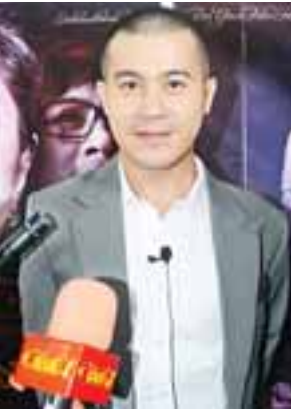
အကယ်ဒမီ နေတိုး

ဒီကားဟာ ၁၉၅၅၊ ၁၉၇၅၊ ၂၀၁၇ ခုနှစ်သုံးခု တည်နေရာ သုံးခု၊ မျိုးဆက်သုံးခုကို သုံးနှစ်အချိန် ယူပြီး ပြင်ဆင်ခဲ့တယ်။ ခြောက်လ အလိုမှာ အကြီးအကျယ် ဆက်တင်တွေ လုပ်တယ်။ အဝတ်အစား၊ ကား၊ ရွေးခေတ်ရထား၊ ဘူတာရုံတွေ မရှိတော့တဲ့ လေယာဉ်ကွင်း၊ မန္တလေး ဆေးတက္ကသိုလ်တွေ အားလုံးလုပ်တယ်။ အသံပိုင်းဆိုင်ရာ ရုပ်ပိုင်းဆိုင်ရာ ကာလာတွေကအစ နိုင်ငံတကာ အဆင့်မီအောင်ရိုက်တယ်။ နိုင်ငံတကာမှာ ပြပို့ဖို့အစီအစဉ်တွေလည်း ရှိပါတယ်။ ဒီကားကို ရိုက်ဖို့တာဝန်ပေးတဲ့ အချိန်မှာ ကျွန်တော့်ရဲ့ အသိပညာ၊ အတတ်ပညာ၊ အနုပညာ နှလုံးသားထဲမှာ ဆရာကြီးရဲ့ဝိညာဉ်ကိုထည့်ပြီး ရိုက်ခဲ့တာပါ။ ဒီကားကို ကြည့်ပြီး ဒီလို အမေမျိုးတွေ ဒီလိုသားတွေ ကမ္ဘာကြီးမှာ အများကြီးပေါ်ထွန်းလာဖို့ လိုပါတယ်။ တကယ်လည်း ဒါမျိုးတွေဟာ ထွက်ပေါ်နေဆဲပါ။ ဒီကားကိုကြည့်ပြီး မိမိကိုယ်တိုင်သည် အမေဆီသွားချင်