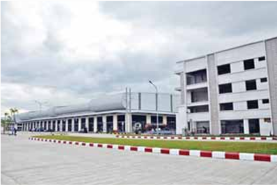
တည်းကုန်း သစ်သီးဝလံ၊ ဟင်းသီးဟင်းရွက်နှင့် ပန်းမန် အဆင့်မြင့် လက်ကားဈေးသစ်ကြီးကို တွေ့ရစဉ်။

မေး။ ။ လက်ရှိ ပြီးစီးဖွင့်လှစ်တော့မယ့်အပေါ် ဈေးရောင်းချလိုသူတွေအတွက် ဆိုင်ခန်းငှားရမ်းမှု အခြေအနေနဲ့ ဈေးစီမံကိန်းတည်ဆောက်မှု အပြီးသတ်ကာလကို သိပါရစေ။