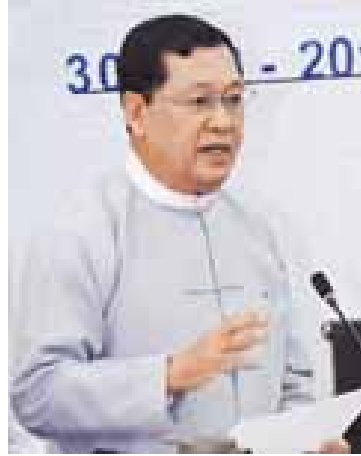
ပြည်ထောင်စုဝန်ကြီး ဦးသိန်းဆွေ