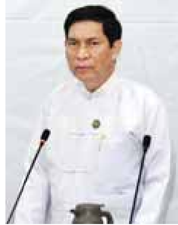
ပြည်ထောင်စုဝန်ကြီး ဦးခင်မောင်ချို