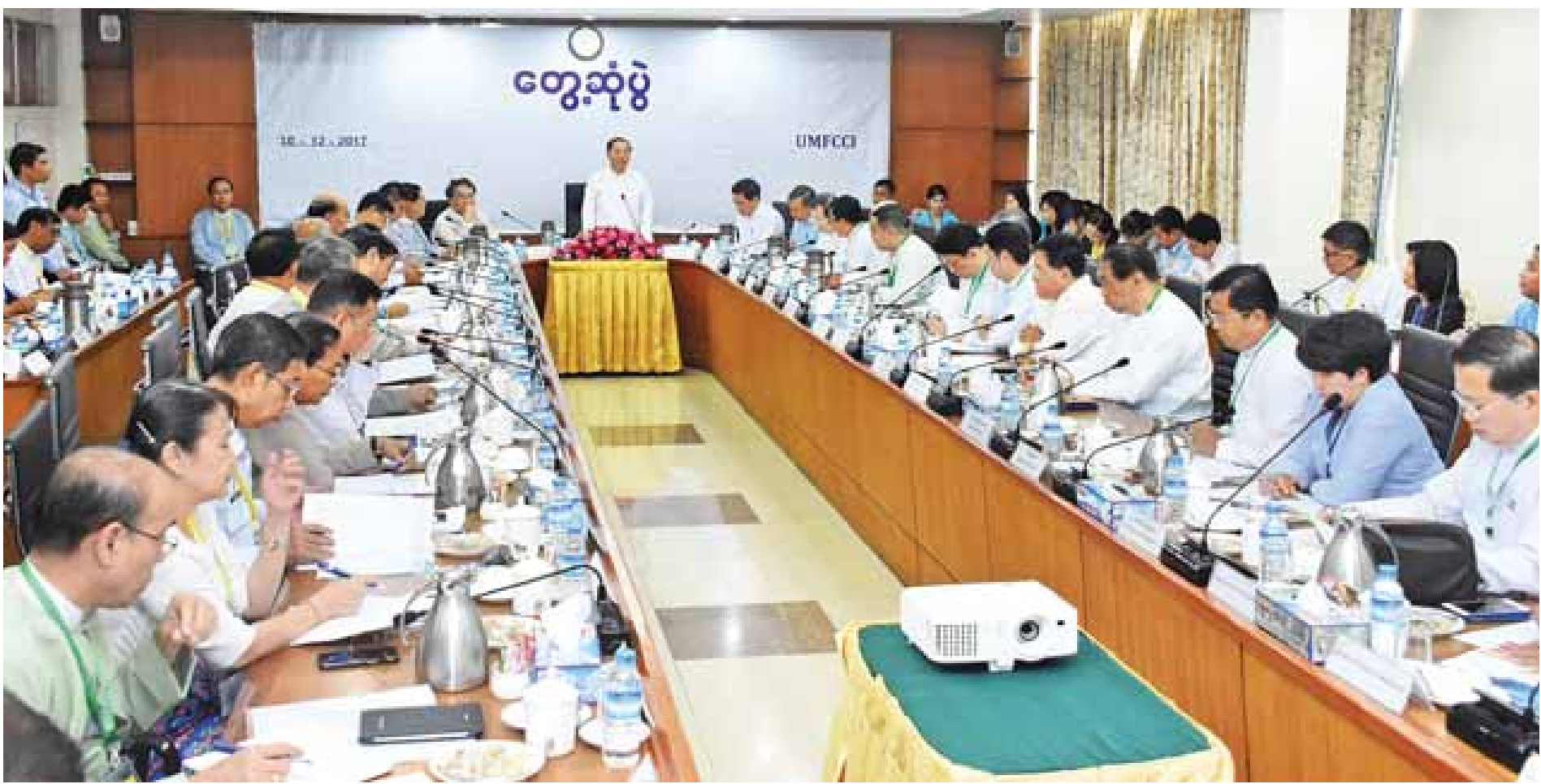
ပုဂ္ဂလိကကဏ္ဍ ဖွံ့ဖြိုးတိုးတက်ရေးကော်မတီနှင့် မြန်မာ့စီးပွားရေးလုပ်ငန်းရှင်များ (၁၃)ကြိမ်မြောက် ပုံမှန်တွေ့ဆုံပွဲ အခမ်းအနားတွင် ဒုတိယသမ္မတ ဦးမြင့်ဆွေ အမှာစကားပြောကြားစဉ်။

ရန်ကုန် ဒီဇင်ဘာ ၃၀ ပုဂ္ဂလိကကဏ္ဍ ဖွံ့ဖြိုးတိုးတက်ရေးကော်မတီနှင့် မြန်မာ့စီးပွားရေးလုပ်ငန်း ရှင်များ (၁၃)ကြိမ်မြောက် ပုံမှန်တွေ့ဆုံပွဲအခမ်းအနားကို ယနေ့နံနက် ၉ နာရီ တွင် ရန်ကုန်မြို့ လမ်းမတော်မြို့နယ် မင်းရဲကျော်စွာလမ်းရှိ ပြည်ထောင်စုသမ္မတ မြန်မာနိုင်ငံ ကုန်သည်များနှင့် စက်မှုလက်မှုလုပ်ငန်းရှင်များအသင်းချုပ် အစည်း အဝေးခန်းမ၌ ကျင်းပရာ ပုဂ္ဂလိကကဏ္ဍ ဖွံ့ဖြိုးတိုးတက်ရေးကော်မတီဥက္ကဋ္ဌ ဒုတိယသမ္မတ ဦးမြင့်ဆွေ တက်ရောက်အမှာစကား ပြောကြားသည်။ တွေ့ဆုံဆွေးနွေးပွဲသို့ ပုဂ္ဂလိကကဏ္ဍ ဖွံ့ဖြိုးတိုးတက်ရေးကော်မတီဒုတိယ