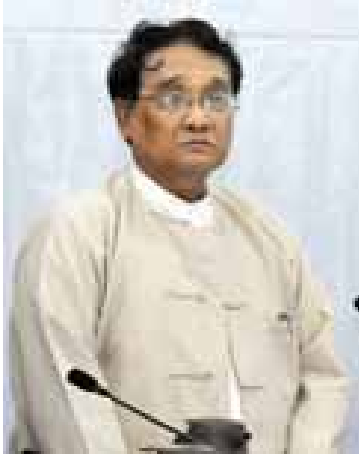
ပြည်ထောင်စုဝန်ကြီး ဒေါက်တာသန်းမြင့်