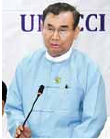
ပြည်ထောင်စုဝန်ကြီး ဦးအုန်းဝင်း