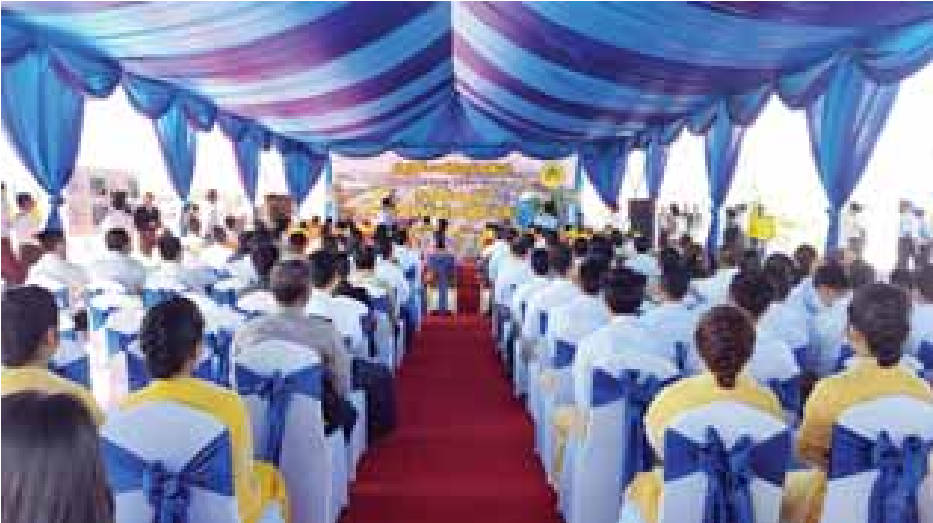
Eco Green City စီမံကိန်း ပန္နက်တင်မင်္ဂလာအခမ်းအနားနှင့် စီမံကိန်းဆိုင်ရာ ရှင်းလင်းပွဲအခမ်းအနား ကျင်းပစဉ်။

ကျောင်းနေရာတွင် ဆောက်လုပ်ရေးဝန်ကြီးဌာနနှင့် ကိုရီးယားနိုင်ငံ Land & Housing Corporation (LH) တို့ ပူးပေါင်းဆောင်ရွက်သည့် အလုပ်အကိုင် တစ်သိန်းခန့် ဝန်ဆောင်မှုပေးနိုင်သည့် Korea Myanmar Industrial Complex (KMIC) စီမံကိန်းကို ထူထောင်ဆောင်ရွက်သွားမည်ဖြစ်ပါကြောင်း၊ Eco Green City စီမံကိန်းနှင့် KMIC စီမံကိန်းတို့ တည်ဆောက်အကောင်အထည်ဖော်