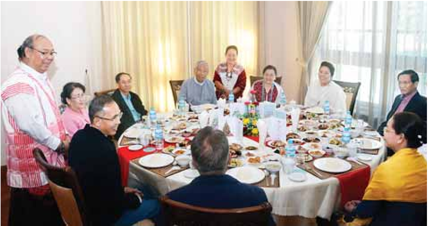
နိုင်ငံတော်သမ္မတ ဦးထင်ကျော်နှင့် ဇနီး ဒေါ်စုစုလွင်တို့ ခရစ်တော်မွေးနေ့(ခရစ္စမတ်)အကြို ဝတ်ပြုဆုတောင်းခြင်းနှင့် ကျေးဇူးတော်ချီးမွမ်းခြင်း အထိမ်းအမှတ်မိတ်ဆုံစားပွဲသို့ တက်ရောက်ကြစဉ်။

ခရစ်တော်မွေးနေ့(ခရစ္စမတ်)အကြို ဝတ်ပြုဆုတောင်းခြင်းနှင့် ကျေးဇူးတော်ချီးမွမ်းခြင်း အခမ်းအနားတွင် သိက္ခာတော်ရဆရာများက ခရစ္စမတ်ဒေသနာတော်ဟောကြားခြင်း၊ သမ္မာကျမ်းစာဖတ်ကြားခြင်း၊ ဂုဏ်တော်ချီးမွမ်းခြင်း၊ ဆုတောင်းမေတ္တာပို့သခြင်း၊ ဓမ္မတေးများ သီဆိုချီးမွမ်းခြင်းတို့ကို ဆောင်ရွက်ခဲ့ကြသည်။ သတင်းစဉ်