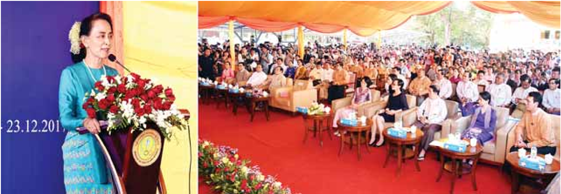
နိုင်ငံတော်၏အတိုင်ပင်ခံပုဂ္ဂိုလ် ဒေါ်အောင်ဆန်းစုကြည် ဒေါ်ခင်ကြည်အမျိုးသမီးဆေးရုံ လွှဲပြောင်းပေးအပ်ခြင်းနှင့် ဖွင့်လှစ်ခြင်းအခမ်းအနားတွင် အမှာစကားပြောကြားစဉ်။