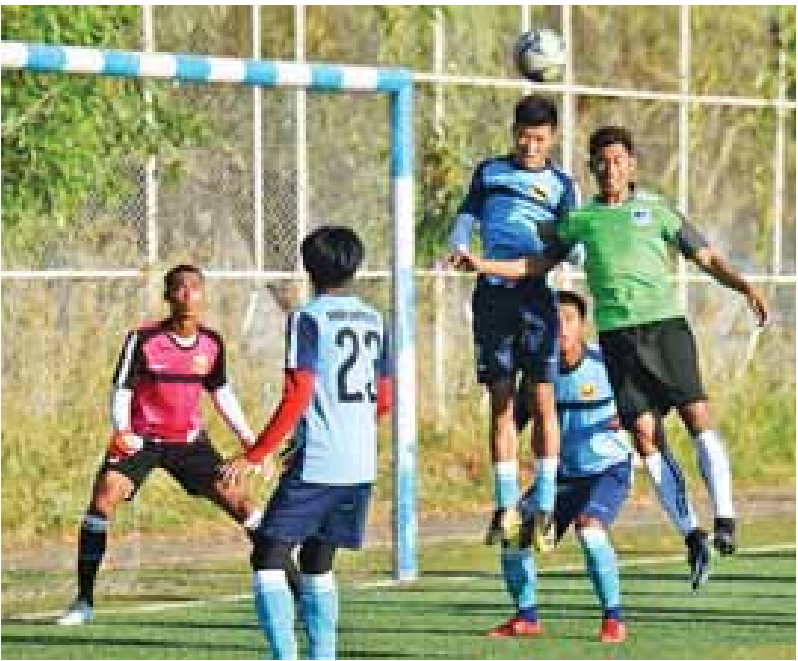
ရှမ်းယူနိုက်တက်နှင့် ရတနာပုံအသင်း ယှဉ်ပြိုင်နေစဉ်၊ ဓာတ်ပုံ-စိုးညွန့်