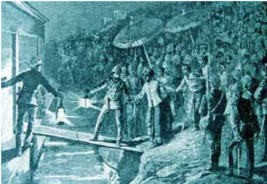
တစ်နိုင်ငံလုံး ဆုံးရှုံးပြီးနောက် ဘုရင်နှင့် မိဖုရား ဤသို့ ပါတော်မူခဲ့သည်။

အောက်မြန်မာပြည်တွင် အင်္ဂလိပ်တို့ အခြေချမိခြင်း သည်ပင်လျှင် အထက်မြန်မာပြည်တွင် ထီးနန်းစိုက်ထူ သော ကုန်းဘောင်မင်းဆက် သက်တမ်းကုန်ဆုံးခြင်း၏ အစဖြစ်သည်။