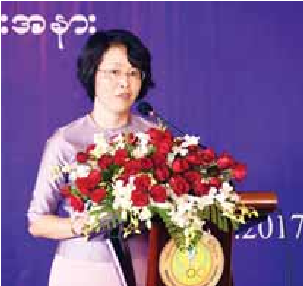
မြန်မာနိုင်ငံဆိုင်ရာ တရုတ်နိုင်ငံသံအမတ်ကြီး၏ ဇနီး Mrs.Wang Xue Hong ဒေါ်ခင်ကြည်အမျိုးသမီးဆေးရုံ လွှဲပြောင်းပေးအပ်ခြင်းနှင့် ဖွင့်လှစ်ခြင်း အခမ်းအနားတွင် နှုတ်ခွန်းဆက်စကား ပြောကြားစဉ်။

ဆရာမတွေဟာ အရေးကြီးတယ်လို့ မြင်ခဲ့ပါတယ်။ အခုလည်းပဲ ဒီအတိုင်းပဲ ကျွန်မမြင်ပါတယ်။ ဘာဖြစ်လို့လဲဆိုရင် သူနာပြုဆရာမတွေကသာ လူနာတွေကို တကယ့်အနီးကပ် ပြုစုနိုင်တာ၊ လူနာတွေကို အားပေးနိုင်တာကြောင့် ဖြစ်ပါတယ်။