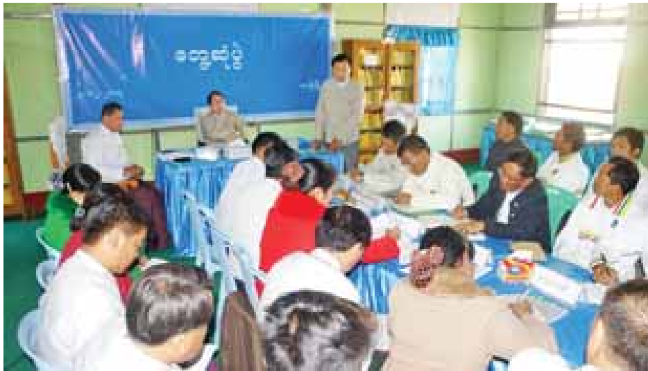
ပြည်ထောင်စုဝန်ကြီး ဒေါက်တာဖေမြင့် မြန်ကြားရေးဝန်ကြီးဌာနအောက်ရှိ ဝန်ထမ်းများနှင့် တွေ့ဆုံစဉ်။ (အပေါ်ဝဲပုံ)နှင့် လားရှိုးမြို့ စုပေါင်းလူထုလမ်းလျှောက်ပွဲအား အများပြည်သူနှင့်အတူ ပါဝင်ဆင်နွှဲစဉ်။ (အပေါ်ယာပုံ)