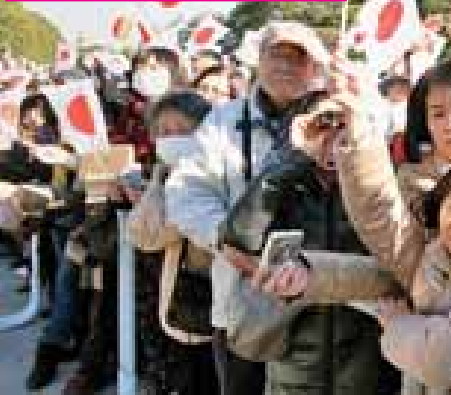
ဘေးဒုက္ခအမျိုးမျိုးနှင့် ရင်ဆိုင်ကြုံတွေ့နေရသည့် ပြည်သူများအပါအဝင် ၂၀၁၁ ခုနှစ်ကဖြစ်ပွားခဲ့သည့် ငလျင်လှုပ်