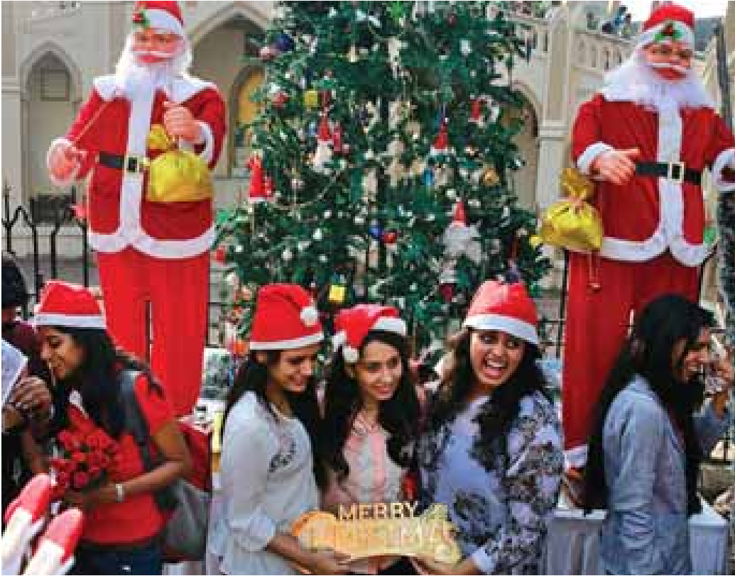
အိန္ဒိယနိုင်ငံ ပြိုတော် နယူးဒေလီ၌ ပြုလုပ်သည့် နာတာလူးပွဲတော် မှတ်တမ်းပုံ။

ကမ္ဘာတစ်ဝန်းတွင် လူပေါင်းသန်း ၁၀၀၀ ကျော်မှာ ၎င်းတို့၏ လူနေမှုဘဝအတွက် သစ်တောများအပေါ် မှီခိုအားထားနေရသော်လည်း တောရိုင်းအပင်များ၊ တိရစ္ဆာန်များ၊ အတ္ထဝါဇီဝမျိုးများတည်းဟူသော ‘သဘာဝ အရင်းအနှီး’ ကို ထိန်းသိမ်းစောင့်ရှောက်ရန်လည်းကောင်း၊ လူသားတို့ တည်မှီရာ ဂေဟစနစ်များ ကောင်းမွန်စေလျက် စီးပွားရေးခရီးဆက်ကြရန်လည်းကောင်း ကမ္ဘာ့ဘဏ်က ဆော်ပြထား၏။ ခရစ္စမတ် (နာတာလူးပွဲတော်) ကာလတွင် ကမ္ဘာ့လူသားများအားလုံး မေတ္တာအပြုံးပန်းများဖလှယ်ကြ၊ ခရစ္စမတ်တေးများကို အားပါးတရ သိကျူးကြချိန်တွင် လာမည့်နှစ်သစ်၌ ထူးခြားကောင်းမြတ်သည့် ကာယကံ၊ ဝစ်ကံ၊ မနောကံအမှုများ တိုးပွားပါစေကြောင်း ကျွန်ုပ်တို့ဆုမွန်မြွေလျက် “အဓိပ္ပာယ်ရှိသော ခရစ္စမတ် နှစ်မြတ်သို့ ဦးတည်” ဟု ကျူးရင့်မိပါသတည်း။ ။ Ref: Year in Review: 2017 (World Bank)