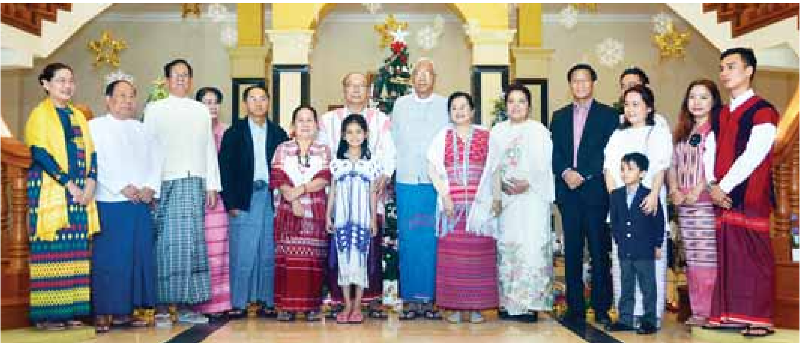
နိုင်ငံတော်သမ္မတ ဦးထင်ကျော်နှင့် ဇနီး ဒေါ်စုစုလွင်တို့ ကျေးဇူးတော်ချီးမွမ်းခြင်း အထိမ်းအမှတ် အခမ်းအနားသို့ တက်ရောက်လာကြသူများနှင့်အတူ မှတ်တမ်းဓာတ်ပုံရိုက်ကြစဉ်။

နေပြည်တော် ဒီဇင်ဘာ ၂၃ ခရစ်တော်မွေးနေ့ (ခရစ္စမတ်) အကြို ဝတ်ပြုဆုတောင်းခြင်းနှင့် ကျေးဇူးတော်ချီးမွမ်းခြင်း အထိမ်းအမှတ် မိတ်ဆုံစားပွဲကို ယနေ့နံနက် ပိုင်းတွင် အမျိုးသားလွှတ်တော်ဥက္ကဋ္ဌ မန်းဝင်းခိုင်သန်း၏ နေအိမ်၌ ကျင်းပ ရာ နိုင်ငံတော်သမ္မတ ဦးထင်ကျော် နှင့် ဇနီး ဒေါ်စုစုလွင်တို့ တက်ရောက် ကြသည်။ မိတ်ဆုံစားပွဲသို့ တက်ရောက်လာ ကြသည့် နိုင်ငံတော်သမ္မတဦးထင်ကျော် နှင့် ဇနီး ဒေါ်စုစုလွင်၊ ဒုတိယသမ္မတ ဦးမြင့်ဆွေနှင့် ဇနီး ဒေါ်ခင်သက်ဌေး၊ ဒုတိယသမ္မတ ဦးဟင်နရီဗန်ထီးယူ နှင့် ဇနီး ဒေါက်တာရွှေလွမ်း၊ နိုင်ငံ တော်ဖွဲ့စည်းပုံ အခြေခံဥပဒေဆိုင်ရာ ခုံရုံးဥက္ကဋ္ဌ ဦးမျိုးညွန့်၊ ပြည်သူ့လွှတ် တော်ဒုတိယဥက္ကဋ္ဌ ဦးတိခွန်မြတ်၊ စာမျက်နှာ ၃ ကော်လံ ၁ သို့ ○