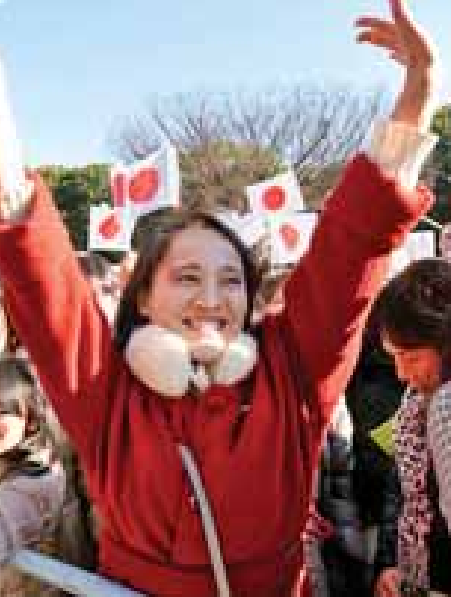
ခတ်မှုနှင့် ဆူနာမီရေလှိုင်းစသည့် သဘာဝဘေးအန္တရာယ်များ ကြုံတွေ့ခဲ့ရသည့် ပြည်သူများအား ၎င်းတို့နှင့် ထပ်တူ

ထပ်မျှ ဝမ်းနည်းပါကြောင်း ပြောကြားပြီး အားပေးစကားဆိုခဲ့သည်။