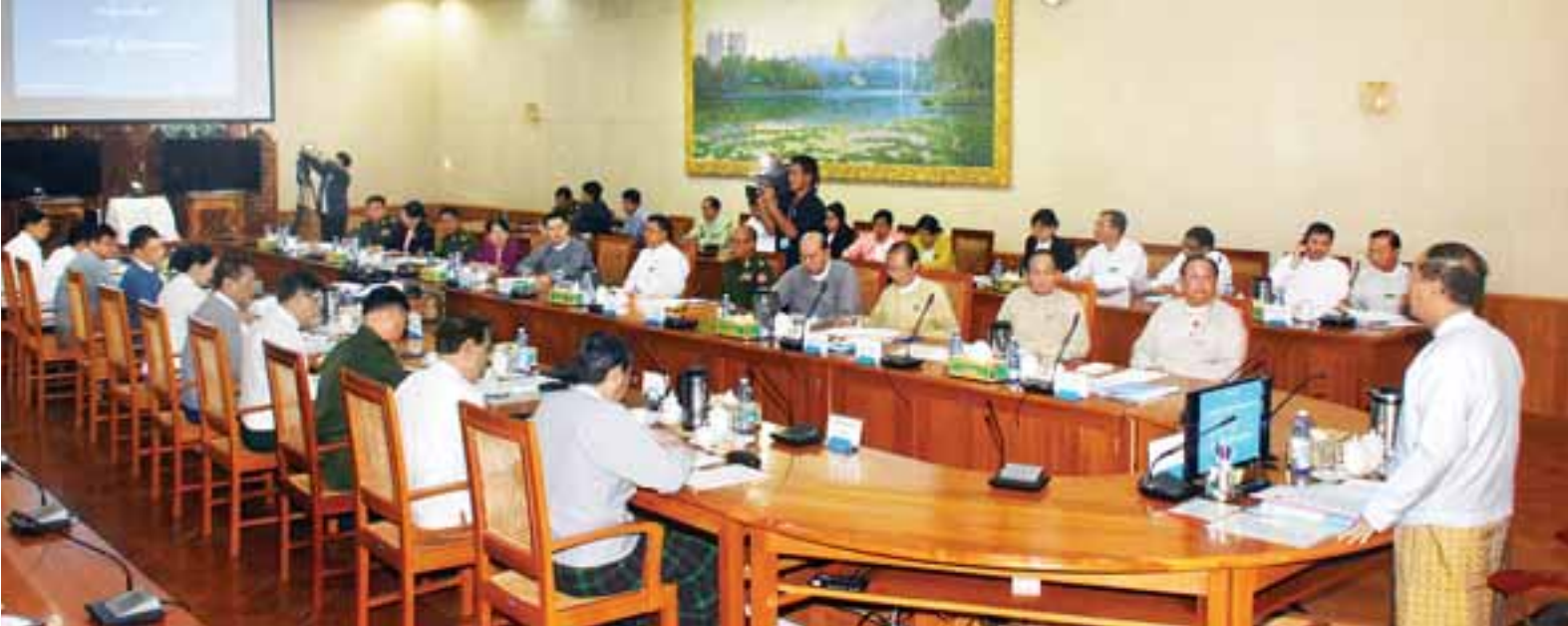
၂၀၁၈ ခုနှစ် (၇၁) နှစ်မြောက် ပြည်ထောင်စုနေကျင်းပရေး ညှိနှိုင်းအစည်းအဝေးတွင် ဒုတိယသမ္မတ ဦးမြင့်ဆွေ အမှာစကားပြောကြားစဉ်။

လွတ်လပ်ရေးရရှိခဲ့ပြီး နောက်ပိုင်းတွင်လည်း လက်နက်ကိုင်ပဋိပက္ခများကြောင့် ဒေသတွင်းနိုင်ငံများနှင့်နှိုင်းယှဉ်ပါက ဖွံ့ဖြိုးတိုးတက်မှုများစွာ နောက်ကျ ကျန်ရစ်ခဲ့ပါကြောင်း၊ ပြည်သူတစ်ရပ်လုံး လိုလားတောင့်တလျက်ရှိသည့် ပြည်တွင်းငြိမ်းချမ်းရေးကို အမြန်ဆုံး ပြန်လည်တည်ဆောက်