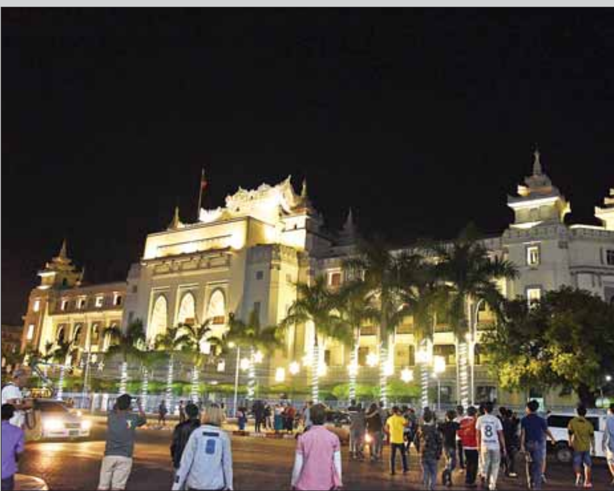
ဒီဇင်ဘာ ၂၂ ရက် ညပိုင်းတွင် ရန်ကုန်မြို့၊ မြို့တော်ခန်းမရှေ့၌ ခရစ္စမတ်အကြို ရောင်စုံမီးများ ထွန်းထားသည်ကို တွေ့ရစဉ်။ ဇာကီ