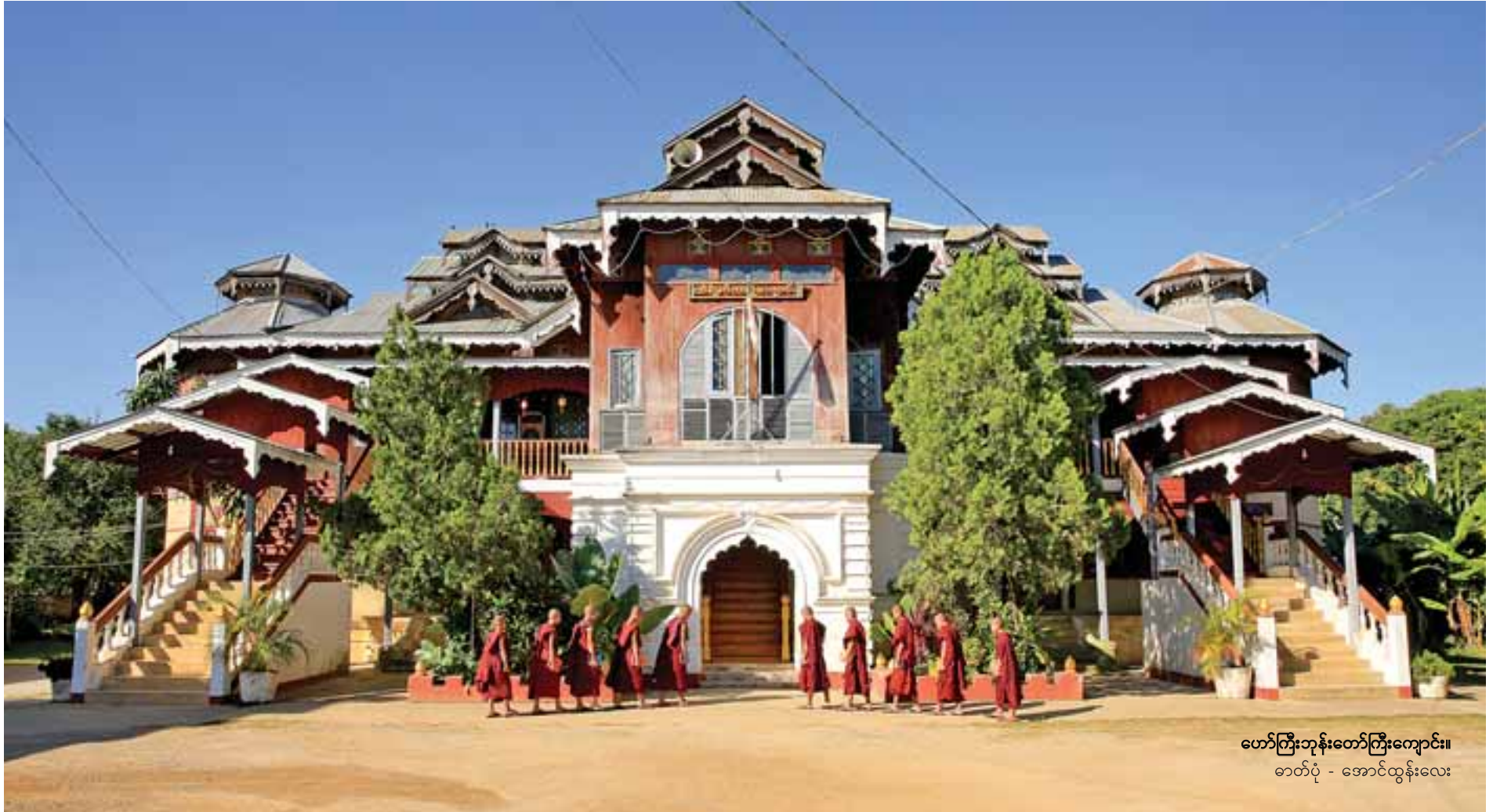
ဟော်ကြီးဘုန်းတော်ကြီးကျောင်း။