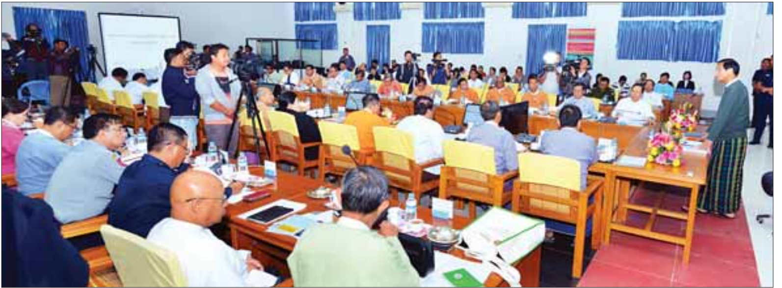
ဒုတိယသမ္မတ ဦးဟင်နရီဗန်ထီးယူ အမျိုးသားသဘာဝဘေးအန္တရာယ်ဆိုင်ရာ စီမံခန့်ခွဲမှုကော်မတီ အစည်းအဝေးတွင် အမှာစကား ပြောကြားစဉ်။

၂၀၁၅ ခုနှစ် မတ်လတွင် ဂျပန်နိုင်ငံ ဆန်ဒိုင်းမြို့၌ ကျင်းပခဲ့သည့် တတိယအကြိမ် ဘေးအန္တရာယ်ကြောင့် ထိခိုက်ဆုံးရှုံးနိုင်ခြေ လျော့ချရေး ကမ္ဘာ့ညီလာခံတွင် သဘာဝဘေးအန္တရာယ်ကြောင့် ထိခိုက်ဆုံးရှုံးနိုင်ခြေ လျော့ချရေးဆိုင်ရာ ဆန်ဒိုင်းမူဘောင်ကို ချမှတ်ခဲ့ပြီး နိုင်ငံများက လိုက်နာဆောင်ရွက်လျက် ရှိကြပါကြောင်း၊ ဆန်ဒိုင်းမူဘောင်၏ ဦးစားပေးလုပ်ငန်း(၄)ရပ်ဖြစ်သည့် သဘာဝဘေးအန္တရာယ်များ၏ သဘောသဘာဝကို နားလည်ထားရန်၊ ဘေးအန္တရာယ်ကြောင့် ထိခိုက်ဆုံးရှုံးနိုင်ခြေလျော့ပါးစေရေးအတွက် စီမံခန့်ခွဲမှု ပိုမိုအားကောင်းလာရန်၊ ဘေးအန္တရာယ်ကြောင့် ထိခိုက်ဆုံးရှုံးနိုင်ခြေလျော့ချရေး လုပ်ငန်းများတွင် ရင်းနှီးမြှုပ်နှံမှုများ ဆောင်ရွက်ရန်၊ ဘေးအန္တရာယ်ဆိုင်ရာ ကြိုတင်ပြင်ဆင်မှုလုပ်ငန်းများနှင့် ပြန်လည်ထူထောင်ရေးနှင့် ပြန်လည်