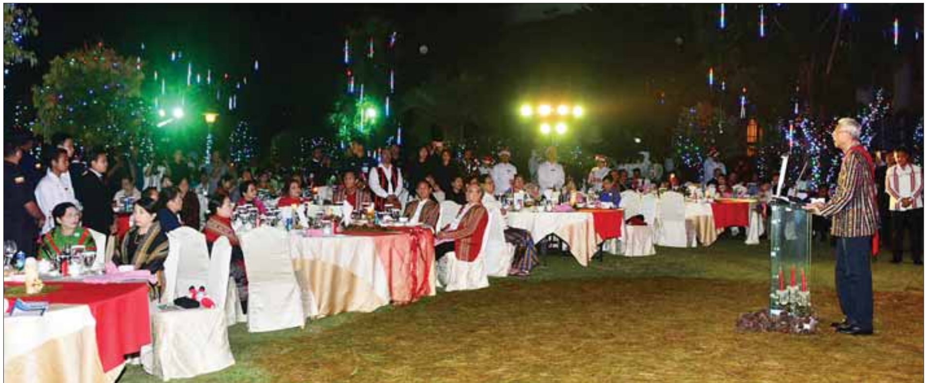
နိုင်ငံတော်သမ္မတ ဦးထင်ကျော် ခရစ္စမတ်ပွဲတော်နှင့် ကျေးဇူးတော်ချီးမွမ်းခြင်း အခမ်းအနားတွင် ခရစ္စမတ်နှုတ်ခွန်းဆက် ဆုတောင်းစကား ပြောကြားစဉ်။