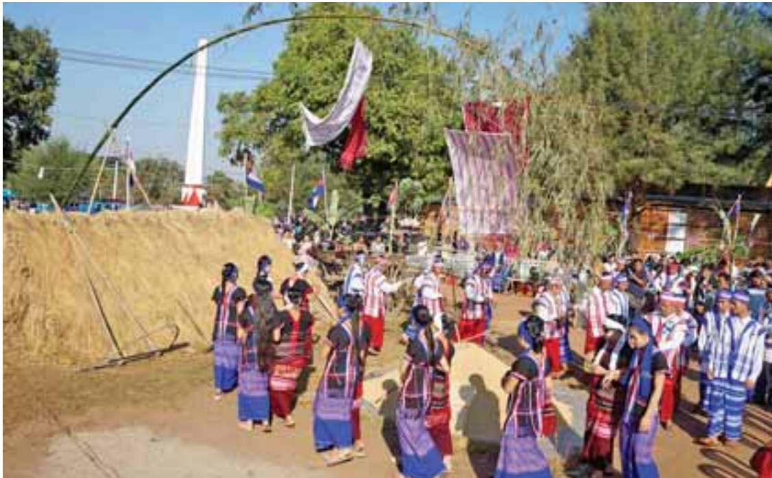
ကရင်နှစ်သစ်ကူးပွဲတော်ကို ဘားအံမြို့၌ ဤသို့ခမ်းနားစွာကျင်းပ။