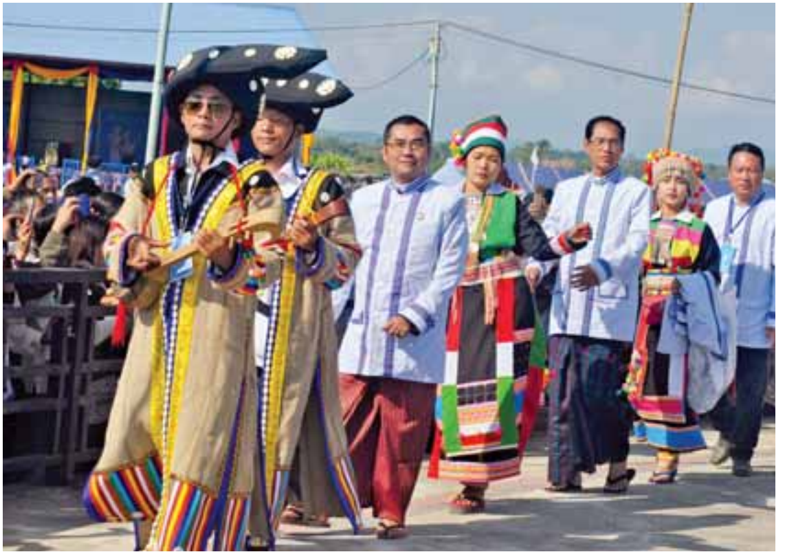
မြစ်ကြီးနား၌ လီဆူစာပေ နှစ် ၁၀၀ ပြည့် ဂျူပလီပွဲတော်ကြီးကို စည်ကားသိုက်မြိုက်စွာ ကျင်းပစဉ်။

လီဆူတို့တွင် ဗုဒ္ဓဘာသာကိုးကွယ်သူများ လည်း ရှိကြသည်။ ဗုဒ္ဓဘာသာလီဆူများကို မိုးကုတ်နယ်၊ ရှမ်းပြည်နယ်တောင်ပိုင်းနှင့် ကချင်ပြည်နယ်ရှိ အချို့ဒေသများတွင် တွေ့ရ သည်။ အချို့မှာ ရဟန်းဘောင်သို့ဝင်နေသော လီဆူ များလည်းရှိသည်။ ဗုဒ္ဓဘာသာလီဆူတို့ သည် ဗုဒ္ဓဘာသာကို သက်ဝင်ယုံကြည်ကြ၍ ဂေါတမမြတ်ဗုဒ္ဓ၏ အဆုံးအမကို ကိုးကွယ် ယုံကြည်ကြသူများဖြစ်သည်။