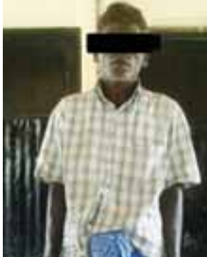
နာဂိုတာချေ

အလားတူ ဒီဇင်ဘာ ၁၈ ရက် ည ၉ နာရီတွင် ရေတွင်းကျွန်းကျေးရွာ မြောက်ဘက် ဦးရှည်ကျချောင်းအတွင်း မသင်္ကာဖွယ် လောင်းလှေ