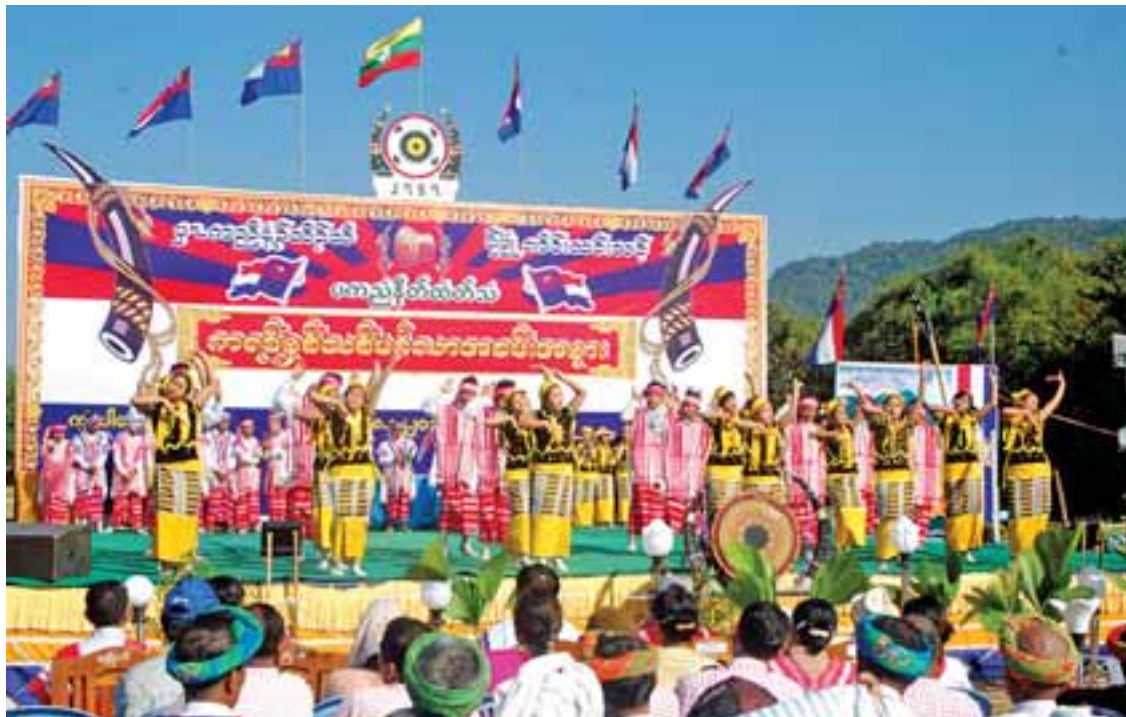
ကရင်နှစ်သစ်ကူးပွဲတော်ကို သထုံမြို့၌ ဤသို့ခမ်းနားစွာကျင်းပ။

ဗုဒ္ဓဝါဒကို လက်ခံကြသည်ဟု ဆိုသည်။ သုဝဏ္ဏဘူမိ (သထုံ) ကောင်းစားစဉ်ကတည်းက မွန်တို့နှင့် ခေတ်ပြိုင်ရေးသားထားခဲ့သော ပေစာများ၊ လက်ဆင့်ကမ်းသီဆိုလာခဲ့ကြ သော ရှေးကဗျာလင်္ကာ အထောက်အထားများ အရ ကရင်နှင့် မွန်တို့သည် ဗုဒ္ဓဝါဒကို တစ်ချိန် တည်း တစ်ပြိုင်တည်း ရရှိလာကြသည်ဟု ဆိုသည်။