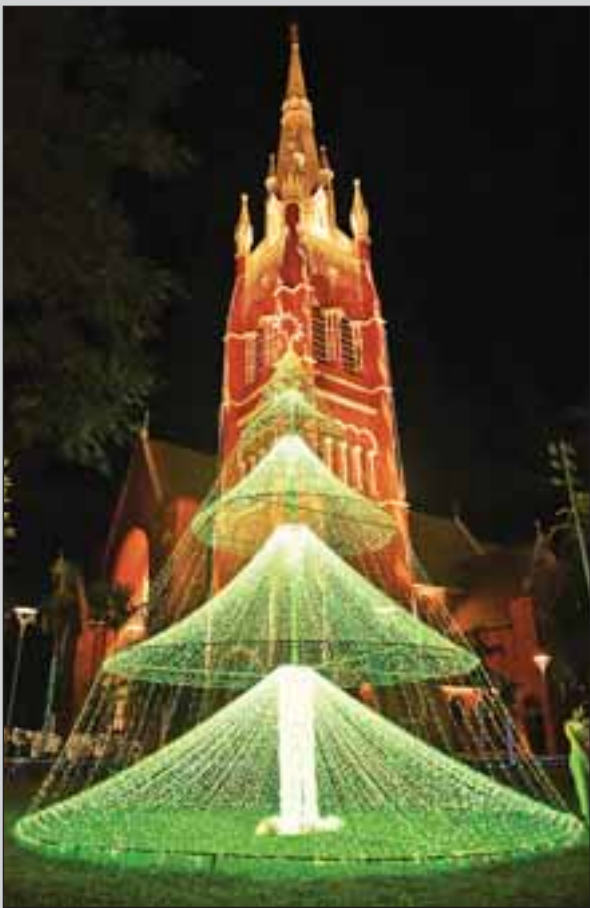
ရန်ကုန်မြို့၊ ဗိုလ်ချုပ်အောင်ဆန်းလမ်းနှင့် ရွှေတိဂုံဘုရားလမ်းထောင့်ရှိ သန့်ရှင်းသော ကြိုက်ကသိခြယ်ဘုရားကျောင်း၌ ဒီဇင်ဘာ ၂၂ ရက် ညပိုင်းတွင် ခရစ္စမတ်အကြို ရောင်စုံမီးများ ထွန်းထားသည်ကို တွေ့ရစဉ်။ မောင်မောင်ဇော်