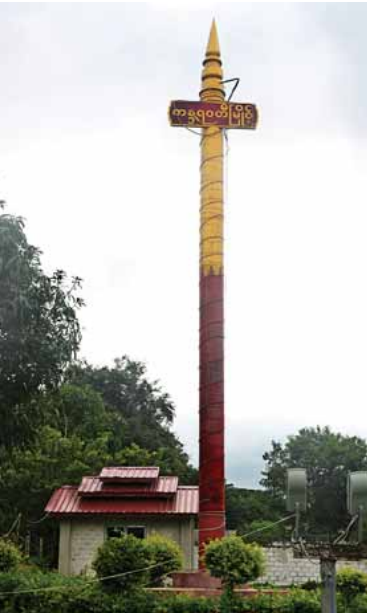
လွိုင်ကော်မြို့ မင်းစုရပ်ကွက်တွင် စိုက်ထူထားသော ကန္တရဝတီမြို့ဝင် မော်ကွန်းတိုင်။

အဆိုပါဆရာတော်သည် မင်္ဂလာ ဟော်ကြီးကျောင်းတိုက်၌ သီတင်းသုံးရင်း မြန်မာဘာသာ၊ ကယားဘာသာ၊ ရှမ်းဘာသာ၊ ပအိုဝ်းဘာသာစကားတို့ဖြင့် တရားရေအေး အမြိုက်ဆေးကို ကန္တရဝတီပြည်သူများအား တိုက်ကျွေးရင်းဖြင့် အနာဂတ်သာသနာ စည်ပင်ဖွံ့ဖြိုးရေးမြော်တွေးလျက် သာသနာပြု လုပ်ငန်းတာဝန်များကို ထမ်းဆောင်လျက်ရှိ သည်။ ကယားစော်ဘွားတစ်ဦးမှအစပြု၍ သာသနာပြုမှုကို လက်ခံအစပျိုးတည်ထောင်ခဲ့ ရာမှ ပွင့်လန်းလာသော သာသနာအကျိုး သည် ကယားပြည်နယ်တွင် ရွှန်းလက် တောက်ပလျက်ရှိနေပါသည်။