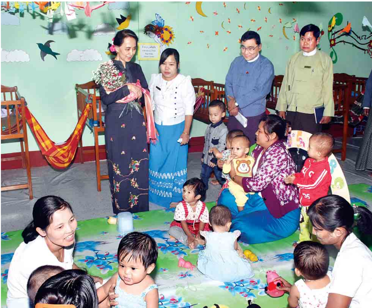
နိုင်ငံတော်၏အတိုင်ပင်ခံပုဂ္ဂိုလ် ဒေါ်အောင်ဆန်းစုကြည် “မေမေရင်ခွင်” နေ့ကလေးထိန်းဌာနမှ ကလေးငယ်များ ဆော့ကစားနေမှုကို ကြည့်ရှုစစ်ဆေး

နေပြည်တော် ဒီဇင်ဘာ ၁၉ နိုင်ငံတော်၏ အတိုင်ပင်ခံပုဂ္ဂိုလ် ဒေါ်အောင်ဆန်းစုကြည်သည် ယနေ့ ညနေပိုင်းတွင် ဒေါ်ခင်ကြည် မောင်ဒေးရှင်းက ဆောက်လုပ်လှူဒါန်းမည့် ကျေးလက်အိမ်ပုံစံနမူနာနှင့် လူမှုဝန်ထမ်း၊ ကယ်ဆယ်ရေးနှင့်ပြန်လည်နေရာချထားရေးဝန်ကြီးဌာန၌ ဖွင့်လှစ်ထားသည့် နေ့ကလေးထိန်းဌာနတို့ကို ကြည့်ရှုစစ်ဆေးသည်။ နိုင်ငံတော်၏ အတိုင်ပင်ခံပုဂ္ဂိုလ် ဒေါ်အောင်ဆန်းစုကြည်သည် ညနေ ၃ နာရီ ၁၀ မိနစ်တွင် နေပြည်တော်ရှိ လူမှုဝန်ထမ်း၊ ကယ်ဆယ်ရေးနှင့် ပြန်လည်နေရာချထားရေး ဝန်ကြီးဌာနသို့ရောက်ရှိပြီး ဝန်ကြီးဌာနရုံးဝင်းအတွင်း နမူနာပုံစံအဖြစ် ဆောက်လုပ်ပြသထားသည့် ရခိုင်ပြည်နယ် မောင်တောမြို့နယ် ခုံတိုင်ကျေးရွာ၌ ဒေါ်ခင်ကြည် မောင်ဒေးရှင်းမှ ဆောက်လုပ်လှူဒါန်းမည့် ကျေးလက်အိမ်ပုံစံကို လှည့်လည်ကြည့်ရှုစစ်ဆေးရာ ပြည်ထောင်စုဝန်ကြီး ဒေါက်တာဝင်းမြတ်အေး၊ ဒုတိယဝန်ကြီး ဦးစိုးအောင်နှင့် SEVEN KING Construction Co.,Ltd. မန်နေဂျင်း ဒါရိုက်တာ ဦးမျိုးကိုကိုတို့က ကျေးလက်အိမ်ဆိုင်ရာ အချက်အလက်များနှင့် ဒေသနှင့်ကိုက်ညီမှုအခြေအနေတို့ကို ရှင်းလင်းတင်ပြကြသည်။ စာမျက်နှာ ၃ ကော်လံ ၄ သို့ ❖