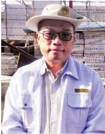
ဒုတိယဝန်ကြီး ဦးကျော်လင်း

ဘူးသီးတောင်၊ ရသေ့တောင်၊ မောင်တော ဒေသဖွံ့ဖြိုးတိုးတက်ရေးအတွက် လမ်း တံတားတွေ တည်ဆောက်လျက်ရှိပါတယ်။ ပထမဆုံးအနေနဲ့ အင်္ဂုဏ်တော် မောင်တော အထိ မိုင် ၅၀ ရှိပါတယ်။ အဲဒါကတော့ UEHRD အောက်ကနေ အေးရှားပေါ ကုမ္ပဏီက ၁၈ ပေခွဲ ကွန်ကရစ်လမ်းကြီး ခင်းဖို့ ကျွန်တော်တို့ဝန်ကြီးဌာနက ဒီဇိုင်း ထုတ်ပေးပါတယ်။ ပြီးတော့ QC ဆောင်ရွက် ပေးပါတယ်။ ဒါနဲ့ပတ်သက်ပြီး အသေးစိတ် ညှိနှိုင်းဖို့ လာရောက်ခြင်းဖြစ်ပါတယ်။ ပြီးတော့ အင်္ဂုဏ်တော်က ဘူးသီးတောင်အထိ လမ်းမကြီးရှိပါတယ်။ ဒီလမ်းကတော့ ကျေးလက်ဒေသဖွံ့ဖြိုးရေးအတွက် ဆောင်ရွက် နေတာဖြစ်ပါတယ်။ ရိုးမဖြတ်လမ်းနှစ်လမ်း ဖောက်လုပ်နေပါတယ်။ ကျောက်ပန္န- စေတီပြင်လမ်းနဲ့ ကြိမ်ချောင်း-ဂုပွိ လမ်းဖြစ်ပါ