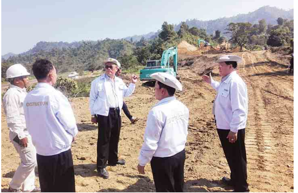
နှင့် ရသေ့တောင်-ပုဏ္ဏားကျွန်းလမ်းပေါ်ရှိ ရသေ့တောင် ကြည့်ရှုစစ်ဆေးခဲ့ကြောင်း သိရသည်။ မြင့်မောင်၊ ဇေယျာ

မွန်းလွဲပိုင်းတွင် တံတားအထူးအဖွဲ့ (၇)မှ တာဝန်ယူ တည်ဆောက်နေသော ဘူးသီးတောင်-ကျောက်တော် လမ်းပေါ်ရှိ စိုင်းဒင်တံတား တည်ဆောက်ရေးလုပ်ငန်းခွင်