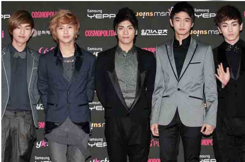
SHINee တေးဂီတအဖွဲ့ကို ၂၀၁၀ ခုနှစ်က တွေ့ရစဉ်။