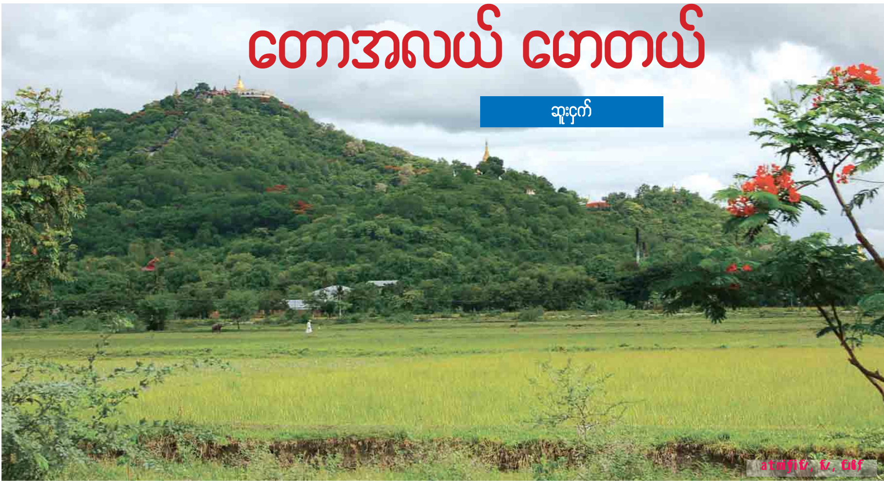
အမှတ် ၁၀၊ ၁၁၊ ၁၂

ကျွန်တော်နေထိုင်သော မန္တလေးအောင်ပင်လယ်ကန် ပေါင်ရိုးအနီး လယ်တောအိမ်ကလေး၏ အရှေ့ဘက်ခြမ်း မှာက ခြံဝင်းကွက်များနှင့်အတူ သရက်ကုန်း ဘုန်းတော်ကြီးကျောင်းဝင်းနှင့် အောင်ပင်လယ်တောတွေ ရှိသည်။ တောင်ဘက်မှာက ခပ်စိပ်စိပ်လူနေအိမ်ဝင်းများ။ မြောက်ဘက်မှာ သပြေခြံတွေ၊ သစ်ခွံခြံတွေရှိသည်။ အနောက်ဘက်မှာက ကေကွက် အကျယ်အဝန်းရှိသည့် တောရိုင်းခြံကြီး တစ်ခြံရှိသည်။ သည်ခြံကြီးထဲမှာ ငါးကန်တွေလည်း ရှိ၏။ သရက်ပင်တွေလည်း ရှိ၏။သပြေပင်တွေလည်း ရှိ၏။ လွန်ခဲ့သော ဆယ်စုနှစ်ကျော် သည်နေရာလေးသို့ ကျွန်တော်တို့ ရောက်စအချိန်တွင် အိမ်ကလေး၏ အရှေ့ဘက်မှာ၊ တောင်ဘက်မှာတွေက အခုလို ဝင်းတွေခြံတွေ မရှိသေး။ ပိတ်စွယ်ရိုင်းပင်တွေ တောထနေသည့် ကွင်းပြင်ကြီးပဲ ဖြစ်သည်။ အိမ်တောင်ဘက် ခေါင်းရင်းမှာလည်း ရေအိုင်တစ်အိုင်ရှိသည်။ ကြည်လင်သောရေမှာ ကြာပန်းတွေလည်း ပွင့်နေ၏။ ညနေစောင်းလျှင်ဖြင့် အနောက်ဘက် ရေကန်ကြီးတွေရှိသည့် ခြံကြီးထဲသို့မျိုင်းအုပ်တွေ အိပ်တန်းလာတက်သည်။ ညနေမှာအုပ်လိုက် အိပ်တန်းတက်ကြသည်။