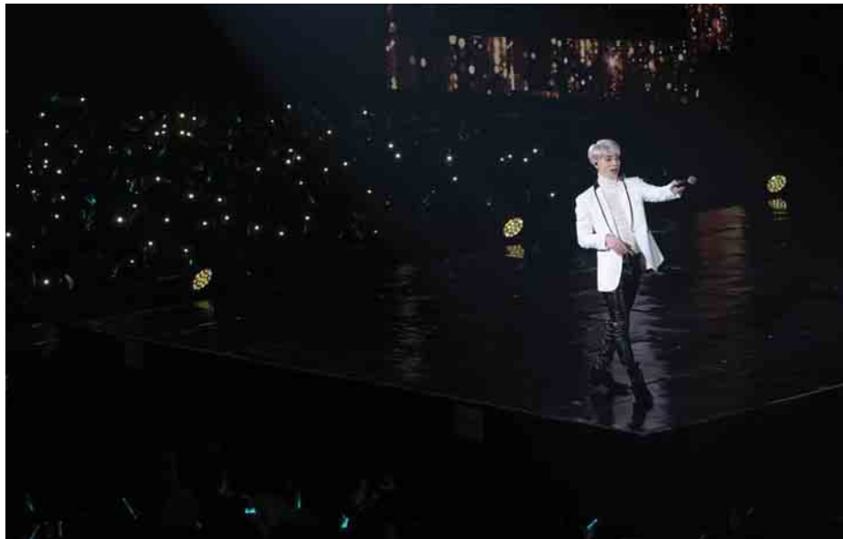
နောက်ဆုံးပြုလုပ်ခဲ့တဲ့ သူ့ရဲ့တစ်ကိုယ်တော် တေးဂီတဖျော်ဖြေပွဲတွင် ဂျွန်ဟွန်း ဖျော်ဖြေနေစဉ်။

လတ်တလောမှာတော့ တောင်ကိုရီးယားရဲ့ မီဒီယာစာမျက်နှာတွေနဲ့ ဟောလိဝုဒ်မီဒီယာစာမျက်နှာအချို့ကို လွှမ်းမိုးထားတဲ့ သတင်းတစ်ခုကတော့ ကေပေါ့ပ်ကြယ်ပွင့်တစ်ဦးဖြစ်တဲ့ ဂျွန်ဟွန်း ကွယ်လွန်ခဲ့တဲ့ သတင်းဖြစ်ပါတယ်။ ဂျွန်ဟွန်းဟာ တောင်ကိုရီးယားရဲ့ ကျော်ကြားတဲ့ အမျိုးသားတေးဂီတအဖွဲ့ တစ်ဖွဲ့ဖြစ်တဲ့ "SHINee"ရဲ့ အဖွဲ့ဝင်တစ်ဦးဖြစ်ပြီး ကွယ်လွန်ချိန်မှာတော့ အသက် (၂၇)နှစ်သာ ရှိသေးတာဖြစ်ပါတယ်။ သူဟာ ပြီးခဲ့တဲ့ ဒီဇင်ဘာ ၁၈ ရက်မှာ ကွယ်လွန်ခဲ့တာဖြစ်ကြောင်း သူ့ရဲ့ဖျော်ဖြေရေးအေဂျင်စီဖြစ်တဲ့ အက်စ်အမ်အန်တာတိန်းမန့်က ထုတ်ပြန်ပြောကြားခဲ့တဲ့စာအရ သိရပါတယ်။ ဟောလိဝုဒ်မီဒီယာတစ်ခုဖြစ်တဲ့ မစ်ရာဒေါ့ကွန်းယူကေရဲ့ ရေးသားဖော်ပြချက်အရတော့ ဂျွန်ဟွန်း သေဆုံးခဲ့ရတာဟာ ကာဗွန်မိုနောက်ဆိုက်ဒ် အဆိပ်သင့်ခဲ့တာကြောင့် ဖြစ်နိုင်ကြောင်းလည်း သိရပါတယ်။