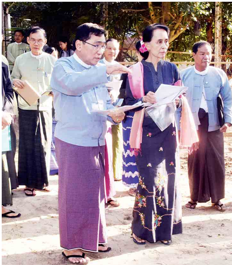
ဒေါ်ခင်ကြည်ဖောင်ဒေးရှင်းမှ ဆောက်လုပ်လှူဒါန်းမည့် ရခိုင်ပြည်နယ် ကျေးလက်အိမ်ပုံစံနမူနာကို နိုင်ငံတော်၏အတိုင်ပင်ခံပုဂ္ဂိုလ် ဒေါ်အောင်ဆန်းစုကြည် ကြည့်ရှုစစ်ဆေးစဉ်။