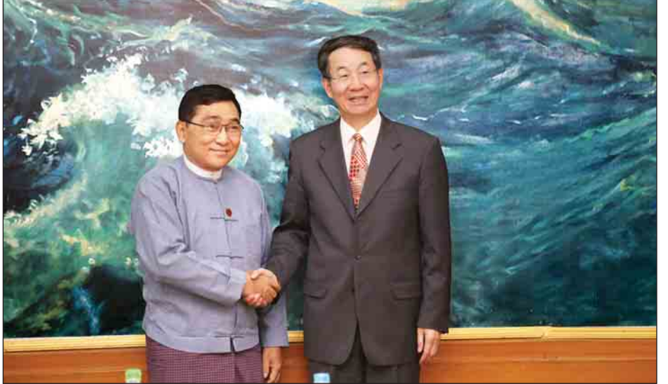
ပြည်ထောင်စုဝန်ကြီး ဒေါက်တာဝင်းမြတ်အေးနှင့် တရုတ်ပြည်သူ့သမ္မတနိုင်ငံ နိုင်ငံခြားရေးဝန်ကြီးဌာန အာရှရေးရာ အထူးကိုယ်စားလှယ် မစ္စတာ စွန်းဂေါ်ရှန်းတို့ တွေ့ဆုံစဉ်။