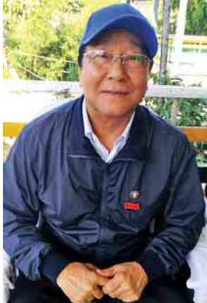
ကချင်ပြည်နယ်ဝန်ကြီးချုပ် ဒေါက်တာခက်အောင်

တွေက လှူတာရှိတယ်။ ဒီလို တိုင်းဒေသကြီးအစိုးရအဖွဲ့ကငွေနဲ့ ပေါင်းစပ်လိုက်တဲ့အခါ သိန်း ၁၉၀၀ လောက်ရတယ်။ ဒီမှာ RC နှစ်ထပ် ကျောင်းဆောက်လုပ်ဖို့ စီစဉ်ထားပါတယ်။ ဒီနေရာက လမ်းပန်းဆက်သွယ်ရေး အင်မတန်ခက်ခဲနေတာကိုလည်း တွေ့ရတယ်။ နောင်ကိုလည်း တတ်နိုင်သလောက် ကူညီနိုင်ဖို့ လုပ်သွားမှာပါ။