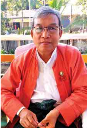
ရခိုင်ပြည်နယ်ဝန်ကြီးချုပ် ဦးညီပု

ရန်ကုန် ဒီဇင်ဘာ ၁၇ ၂၇၅၇ ခုနှစ် ကရင်အမျိုးသား နှစ်သစ်ကူးပွဲတော် ကျင်းပရေးဗဟိုကော်မတီ(မဟာရန်ကုန်)က ကြီးမှူးကျင်းပသည့် ကရင်အမျိုးသားနှစ်သစ်ကူးပွဲတော်ကို ယနေ့ညပိုင်းက ရန်ကုန်မြို့ အင်းစိန်မြို့နယ်ရှိ မဟာဆေးဝက်ဘာ အာလိန်ငါးဆင့်ကျောင်း၌ စည်ကားသိုက်မြိုက်စွာကျင်းပသည်။ ညနေ ၆ နာရီတွင် နှစ်သစ်ကူးပွဲတော် အခမ်းအနားကို စတင်ဖွင့်လှစ်ရာ ကရင်အမျိုးသားနှစ်သစ်ကူးပွဲတော်ကျင်းပရေး ဗဟိုကော်မတီ(မဟာရန်ကုန်)ဥက္ကဋ္ဌ မန်းရွှေပြည်အေးက အဖွင့်အမှာစကားပြောကြားသည်။ ထို့နောက် ဖျော်ဖြေရေးအစီအစဉ်ကို စတင်ရာ ကရင်ရိုးရာ ခုံးယိမ်းပြိုင်ပွဲများ၊ ဝါးထောက်၊ ဝါးညှပ်အကများနှင့် ကရင်ရိုးရာတေးသီချင်းများဖြင့် ဖျော်ဖြေတင်ဆက်ကြသည်။ အဆိုပါ နှစ်သစ်ကူးပွဲတော်တွင် ကရင်တိုင်းရင်းသားတို့၏ ရိုးရာအသုံးအဆောင် ပစ္စည်းပြခန်းများနှင့် ယဉ်ကျေးမှုပြခန်းများကို ဖွင့်လှစ်ပြသထားသည့်အပြင် အားကစားပွဲများနှင့် ပျော်ပွဲရွှင်ပွဲများ၊ တိုင်းရင်းသားရိုးရာ အထိမ်းအမှတ် အမှတ်တရပစ္စည်း အရောင်း