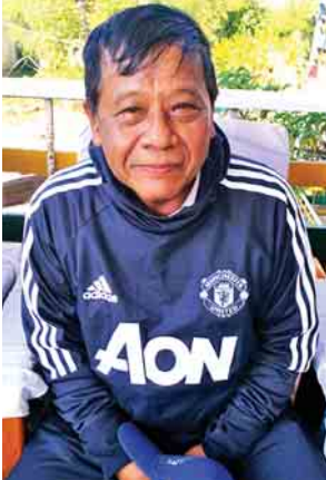
မန္တလေးတိုင်းဒေသကြီးဝန်ကြီးချုပ် ဒေါက်တာဇော်မြင့်မောင်

မကွေးတိုင်းဒေသကြီး ဝန်ကြီးချုပ် ဒေါက်တာအောင်မိုးညို မကွေးတိုင်းဒေသကြီး ၂၅ မြို့နယ်က စေတနာရှင်ပြည်သူတွေက ရခိုင်ပြည်သူတွေအတွက် လှူဒါန်းတာ သိန်း ၆၀၀ နီးပါးလောက်ရတယ်။ ကုမ္ပဏီ