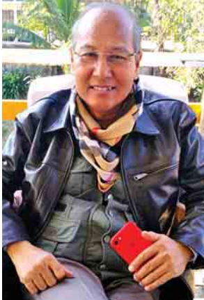
မကွေးတိုင်းဒေသကြီးဝန်ကြီးချုပ် ဒေါက်တာအောင်မိုးညို