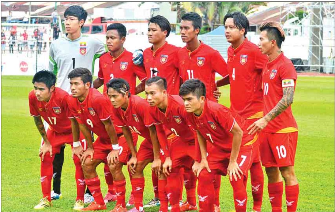
(၂၉) ကြိမ်မြောက် ဆီးရီးပြိုင်ပွဲ ယှဉ်ပြိုင်ခဲ့သည့် မြန်မာ ယူ-၂၂ အမျိုးသားအသင်း။