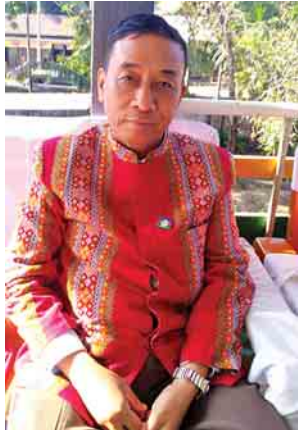
ချင်းပြည်နယ်ဝန်ကြီးချုပ် ဦးဆလိုင်းလျန်လွယ်

ကျွန်တော်တို့က မြန်မာပြည်အရေး၊ ကိုယ့်ဆွေမျိုး သားချင်းအရေးကို ပြည်တွင်းအားကိုးယူပြီး ပြန်လည်ထူထောင်ရေး လုပ်ပေးတာပါ