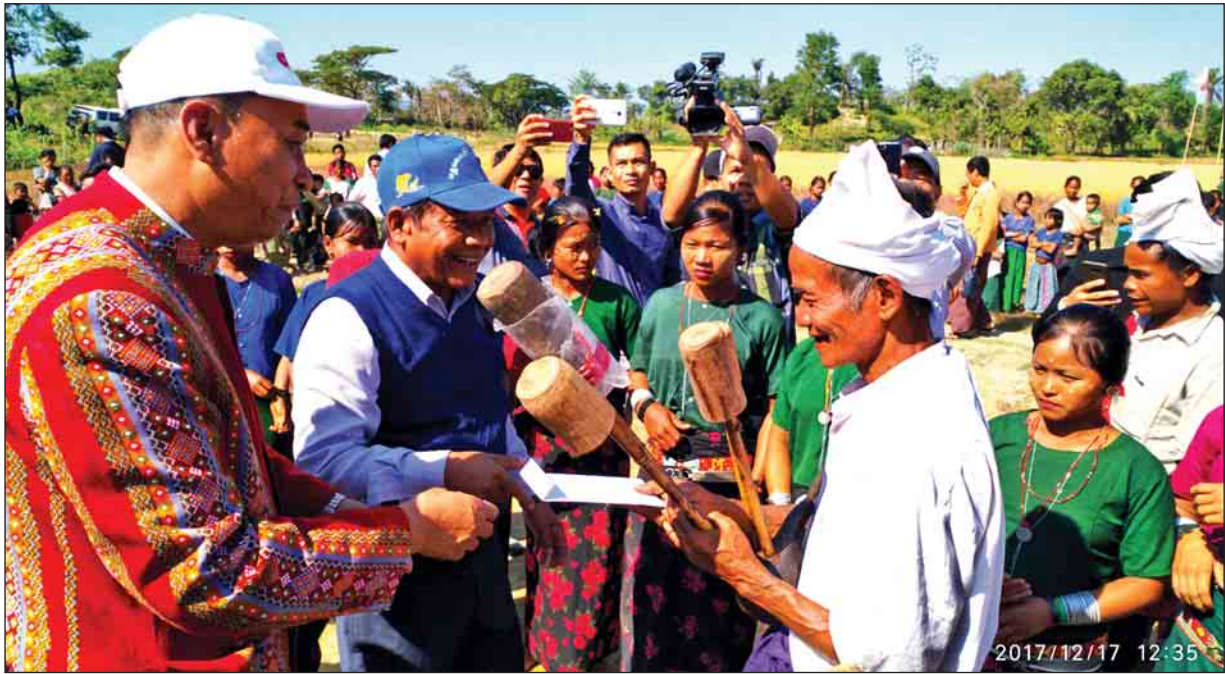
တိုင်းဒေသကြီးနှင့် ပြည်နယ် ဝန်ကြီးချုပ်များက ရိုးရာအတီးအမှုတ်များဖြင့် ကပြဖျော်ဖြေခဲ့ကြသည့် တိုင်းရင်းသားများအား ဂုဏ်ပြုငွေ ချီးမြှင့်စဉ်။