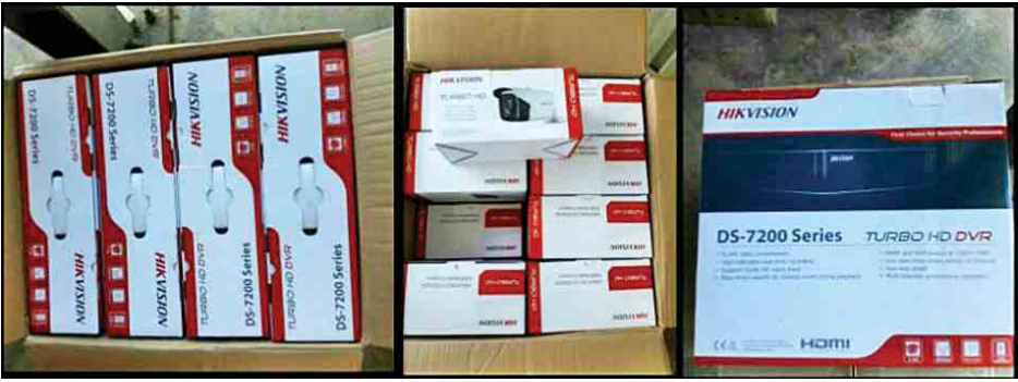
တရားဝင်စာရွက်စာတမ်း အထောက်အထား တစ်စုံတစ်ရာတင်ပြနိုင်ခြင်းမရှိသည့် Turbo, HD DVR, Turbo HD In/Out Door Exir Bullet Camera ရေပူအမြဲတမ်းစစ်ဆေးရေးစခန်းက တားဆီးမှုခံရစဉ် (ခန့်မှန်းတန်ဖိုး ငွေကျပ် ၃၆ ဒသမ ၉၈၇ သန်းခန့်) ကို သိမ်းဆည်းရမိခဲ့ပြီး ထူးခြားဖမ်းဆီးမှုအနေဖြင့် ဒီဇင်ဘာ ၁၆ ရက်တွင် မန္တလေးမြို့သို့ သွားရောက်မည့် Canter ၂၂ ဘီးယာဉ်တစ်စီးကို ရေပူအမြဲတမ်းစစ်ဆေးရေးစခန်း ပူးပေါင်းစစ်ဆေးရေးအဖွဲ့က စစ်ဆေးခဲ့ရာ တရားဝင်စာရွက်စာတမ်း အထောက်အထား တစ်စုံတစ်ရာတင်ပြနိုင်ခြင်းမရှိသည့် Turbo HD DVR (1x8)(25)Pkgs, (1x4)(8) Pkgs, Turbo HD In/Out Door Exir Bullet Camera(1x30)(2) Pkgs, (1x32)(4)Pkgs, (1x36)(1) Pkgs ခန့်မှန်းတန်ဖိုးငွေကျပ် ၁၀ ဒသမ ၂၈၀ သန်းခန့်ကို စစ်ဆေးတွေ့ရှိ၍သိမ်းဆည်းခဲ့ကြောင်း သိရသည်။ သတင်းစဉ်

နေပြည်တော် ဒီဇင်ဘာ ၁၇ တရားမဝင်ကုန်စည်များ တားဆီးထိန်းချုပ်ရေးအတွက် ရေပူနှင့် မရမ်းချောင်း အမြဲတမ်းစစ်ဆေးရေးစခန်းတို့ကို ဌာနဆိုင်ရာ ပူးပေါင်းအဖွဲ့များဖြင့် ဖွဲ့စည်းစစ်ဆေးဆောင်ရွက်လျက်ရှိရာ ဒီဇင်ဘာ ၁၆ ရက်တွင် မန္တလေး-မူဆယ် ပြည်ထောင်စုလမ်းမကြီးတစ်လျှောက် ကုန်သွယ်မှု ယာဉ် ဝိုက်ကုန် ၉၈၆ စီး၊ သွင်းကုန် ၁၀၀၅ စီး၊ ရန်ကုန်-မြဝတီလမ်းမကြီးတစ်လျှောက် ကုန်သွယ်မှုယာဉ် ဝိုက်ကုန် ၅၂ စီး၊ သွင်းကုန် ၁၅၅ စီး ကုန်စည်များ သယ်ယူပို့ဆောင်လျက်ရှိသည်။ အဆိုပါ စစ်ဆေးရေးစခန်းများက တင်သွင်း/တင်ပို့သော ကုန်ပစ္စည်းများကို စစ်ဆေးမှုပြုလုပ်ဆောင်ရွက်လျက်ရှိရာ ဒီဇင်ဘာ ၁၆ ရက်တွင်