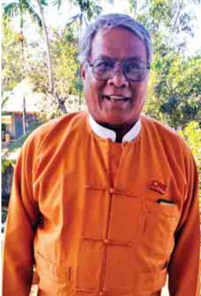
စစ်ကိုင်းတိုင်းဒေသကြီးဝန်ကြီးချုပ် ဒေါက်တာမြင့်နိုင်