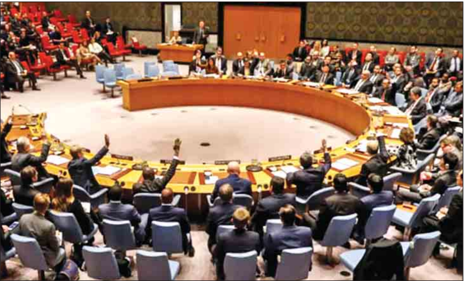
မျှော်လင့်ရကြောင်း၊ ဆုံးဖြတ်ချက်မူကြမ်းကို အတည်ပြုနိုင်ရေးအတွက် ထောက်ခံမဲကိုးမဲရရှိရန်လိုအပ်ပြီး အမေရိကန်၊ ပြင်သစ်၊ ဗြိတိန်၊ ရုရှား သို့မဟုတ် တရုတ်နိုင်ငံက ဗီတိုအာဏာသုံး၍ ပယ်ချခြင်းမရှိရန် လိုအပ်ကြောင်း သံတမန်များက ပြောကြားကြသည်။

ပြန်လည်ရုပ်သိမ်းလာစေရန်လည်းကောင်း လုံခြုံရေးကောင်စီ၏ ဆုံးဖြတ်ချက်တစ်ရပ် ပေါ်ထွက်လာသင့်သည်ဆို၏။ ကုလသမဂ္ဂလုံခြုံရေးကောင်စီ အဖွဲ့ဝင် ၁၅ နိုင်ငံထံသို့ ဖြန့်ဝေထားသော ဆုံးဖြတ်ချက်မူကြမ်းတစ်ရပ်တွင် အမေရိကန်ပြည်ထောင်စုနှင့် သမ္မတထရန်တို့ကို အတိအကျ ရည်ညွှန်းဖော်ပြထားခြင်းမရှိကြောင်း၊ အီလစ်နိုင်ငံက တင်သွင်းထားသော စာမျက်နှာ တစ်မျက်နှာပါ ဆုံးဖြတ်ချက် မူကြမ်းနှင့် ပတ်သက်၍ ကျယ်ကျယ်ပြန့်ပြန့် ထောက်ခံမှုရရှိနိုင်သော်လည်း အမေရိကန်အစိုးရအဖွဲ့က ဗီတိုအာဏာဖြင့် ပယ်ချဖွယ်ရှိကြောင်း သံတမန်များက ပြောကြားကြသည်။ အဆိုပါ ဆုံးဖြတ်ချက်မူကြမ်းနှင့် ပတ်သက်၍ ယခု ရက်သတ္တပတ်တွင် လုံခြုံရေးကောင်စီက မဲပေးမည်ဟု