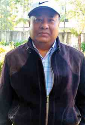
ရှမ်းပြည်နယ်ဝန်ကြီးချုပ် ဒေါက်တာလင်းထွဋ်