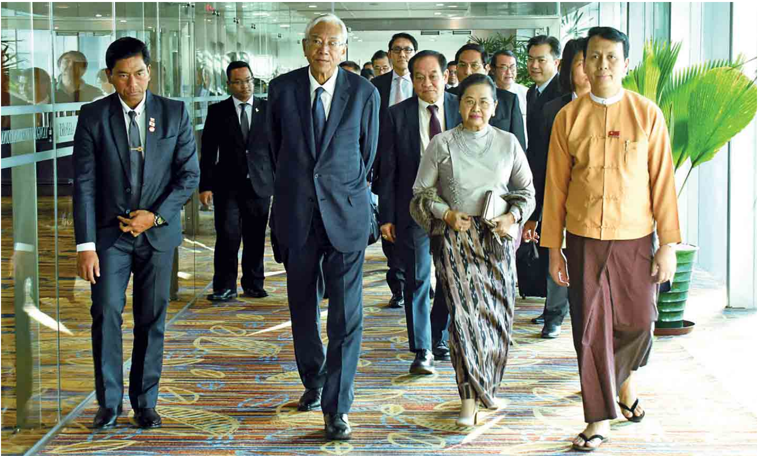
ဂျပန်နိုင်ငံမှ ပြန်လည်ရောက်ရှိလာသည့် နိုင်ငံတော်သမ္မတ ဦးထင်ကျော်နှင့် ဇနီး ဒေါ်စုစုလွင်တို့အား ရန်ကုန်အပြည်ပြည်ဆိုင်ရာလေဆိပ်တွင် ရန်ကုန်တိုင်းဒေသကြီး ဝန်ကြီးချုပ် ဦးဖိုးမင်းသိန်းနှင့် မြန်မာနိုင်ငံဆိုင်ရာ ဂျပန်သံရုံးမှ တာဝန်ရှိသူများက ကြိုဆိုနှုတ်ဆက်ကြစဉ်။

နေပြည်တော် ဒီဇင်ဘာ ၁၇ နိုင်ငံတော်သမ္မတ ဦးထင်ကျော်၊ ဇနီး ဒေါ်စုစုလွင်နှင့် အဖွဲ့သည် တိုကျိုမြို့၌ ကျင်းပခဲ့သည့် Universal Health Coverage Forum 2017 အဆင့်မြင့် ခေါင်းဆောင်များ ဆွေးနွေးပွဲသို့ တက်ရောက်ပြီး ဒီဇင်ဘာ ၁၇ ရက် ဒေသစံတော်ချိန် နံနက် ၁၁ နာရီတွင် ဂျပန်နိုင်ငံမှ All Nippon Airways လေကြောင်းဖြင့် ထွက်ခွာကြသည်။ ပို့ဆောင်နှုတ်ဆက် နိုင်ငံတော်သမ္မတနှင့် ဇနီးနှင့် အဖွဲ့အား မြန်မာနိုင်ငံဆိုင်ရာ ဂျပန်သံအမတ်ကြီး မစ္စတာ တာတရှိဟိဂူချီ၊ ဂျပန်နိုင်ငံဆိုင်ရာ မြန်မာသံအမတ်ကြီး ဦးသူရိန်သန်းဝင်း၊ မြန်မာစစ်သံမှူး ဗိုလ်မှူးချုပ်စောမင်း၊ မြန်မာသံရုံးနှင့် မြန်မာစစ်သံရုံးတို့မှ တာဝန်ရှိသူများနှင့် သံရုံးမိသားစုများက ဂျပန်နိုင်ငံ တိုကျိုမြို့ရှိ နာရီတာ (Narita)လေဆိပ်၌ ပို့ဆောင်နှုတ်ဆက်ကြသည်။ နိုင်ငံတော်သမ္မတနှင့် ဇနီးတို့ ဦးဆောင်သည့် ကိုယ်စားလှယ်အဖွဲ့သည် ညနေ ၄ နာရီခွဲတွင် ရန်ကုန်မြို့သို့ ပြန်လည်ရောက်ရှိကြရာ ရန်ကုန်တိုင်းဒေသကြီး ဝန်ကြီးချုပ် ဦးဖိုးမင်းသိန်း၊ မြန်မာနိုင်ငံဆိုင်ရာ ဂျပန်သံရုံးမှ တာဝန်ရှိသူများ၊ နိုင်ငံခြားရေးဝန်ကြီးဌာနမှ တာဝန်ရှိသူများက ရန်ကုန်အပြည်ပြည်ဆိုင်ရာလေဆိပ်၌ ကြိုဆိုနှုတ်ဆက်ကြသည်။ သတင်းစဉ်