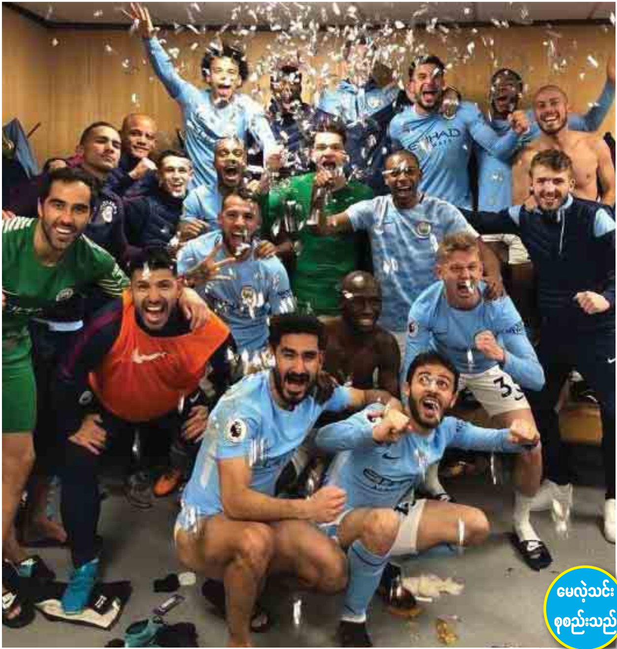
မေလဲသင်းစုစည်းသည်

ဒီပြဿနာဟာ မန်ယူကွင်းအိုးထရက်ဖွဲ့ခွဲကွင်းမှာ မန်စီးစီးကစားသမားတွေ လွန်လွန်ကျူးကျူးအောင်ပွဲခံမှုကြောင့် ဖြစ်လာတာဆိုတဲ့ ပြစ်တင်မှုတွေလည်း ရှိနေပေမယ့်