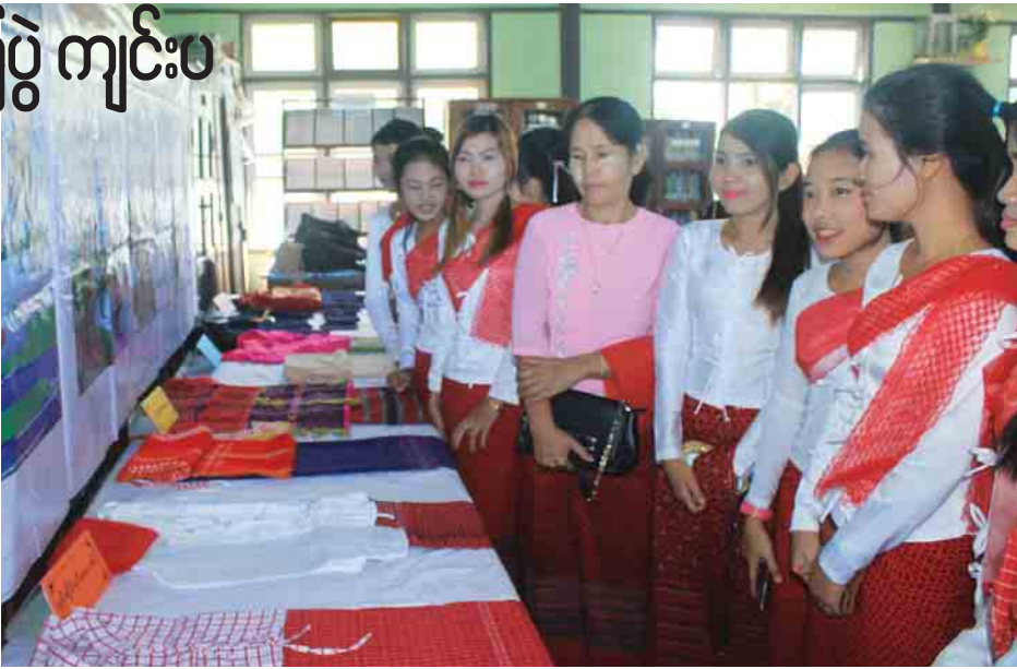
တင်နိုး(ပဲခူး)

အဆိုပါပြပွဲအား ဒီဇင်ဘာ ၁၂ ရက်မှ ၁၃ ရက်အထိ နေ့စဉ်နံနက် ၉နာရီခွဲမှ ညနေ ၄ နာရီခွဲထိ တိုင်းရင်းသားများ၏ ရိုးရာအသုံးအဆောင်များ၊ ဝတ်စားဆင်ယင်မှုများ၊ သမိုင်းဆိုင်ရာအကြောင်းအရာများ၊ စာပေများနှင့်နေထိုင်မှုများအား ကျောင်းသား ကျောင်းသူများနှင့် ပြည်သူများ လေ့လာသိရှိနိုင်ရန် ရည်ရွယ်၍ ပြပွဲကျင်းပသွားခြင်းဖြစ်ကြောင်းသိရသည်။