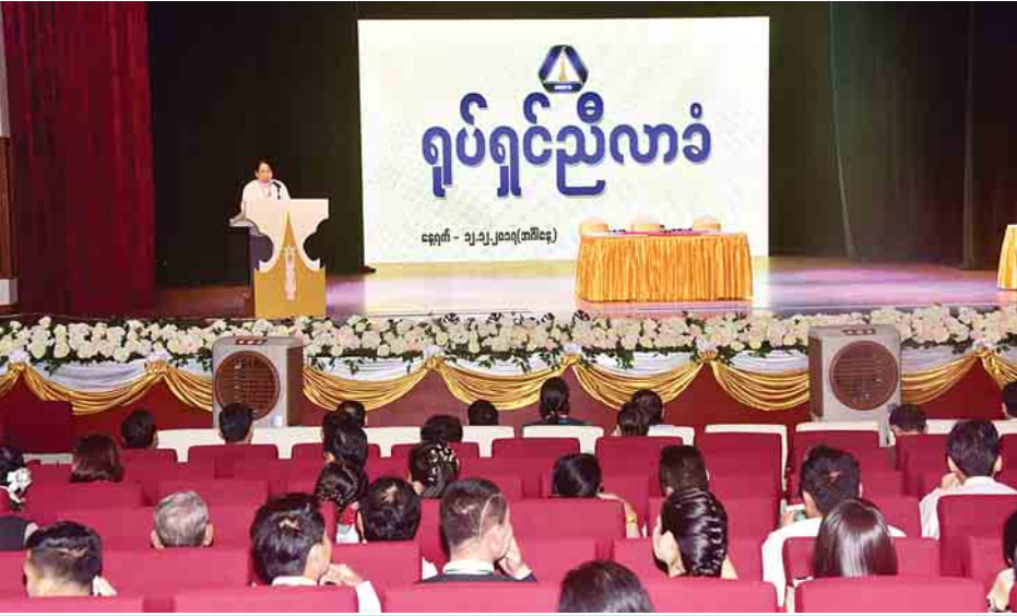
ပြည်ထောင်စုဝန်ကြီး ဒေါက်တာဖေမြင့် ရုပ်ရှင်ညီလာခံဖွင့်ပွဲအခမ်းအနားတွင် အမှာစကားပြောကြားစဉ်။

ဆက်လက်၍ ပြည်ထောင်စုဝန်ကြီးက ပြန်ကြားရေးဝန်ကြီးဌာနအနေဖြင့် ရုပ်ရှင်လောကဖွံ့ဖြိုးတိုးတက်ရေးအတွက် ရုပ်ရှင်အနုပညာသမားများနှင့်အတူ ပူးတွဲဆောင်ရွက်နေမှု၊ ရုပ်ရှင်လောကဖွံ့ဖြိုးတိုးတက်ရေးအတွက် အလုပ်ရုံဆွေးနွေးပွဲများ ကျင်းပနေမှုနှင့် ၂၀၁၈ ခုနှစ်တွင် ရုပ်ရှင်လောက ဖွံ့ဖြိုးတိုးတက်ရေးအတွက် အလုပ်ရုံဆွေးနွေးပွဲများ ဆက်တိုက်ကျင်းပနိုင်ရန် စီစဉ်လျက်ရှိမှု၊ ရုပ်ရှင်ဥပဒေပေါ်ထွန်းရေး၊ ရုပ်ရှင်ဥပဒေ၏ အရေးပါမှုနှင့် ရုပ်ရှင်အသိုင်းအဝိုင်း နှစ်နာဆုံးရှုံးမှု