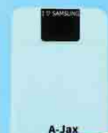
A-Jax Power Bank 10,400 mAh