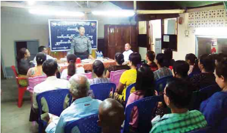
ကိုကျော်(သုံးခွ)

တက်ရောက်လာသူများ၏ မေးမြန်းမှုကို ပြန်လည်ဖြေကြားဆွေးနွေးခဲ့ပြီး လျှပ်စစ်အန္တရာယ်ကင်းရှင်းစေရေးအသိပညာပေးလက်ကမ်းစာစောင်များ ဖြန့်ဝေပေးခဲ့ကြောင်းသိရသည်။