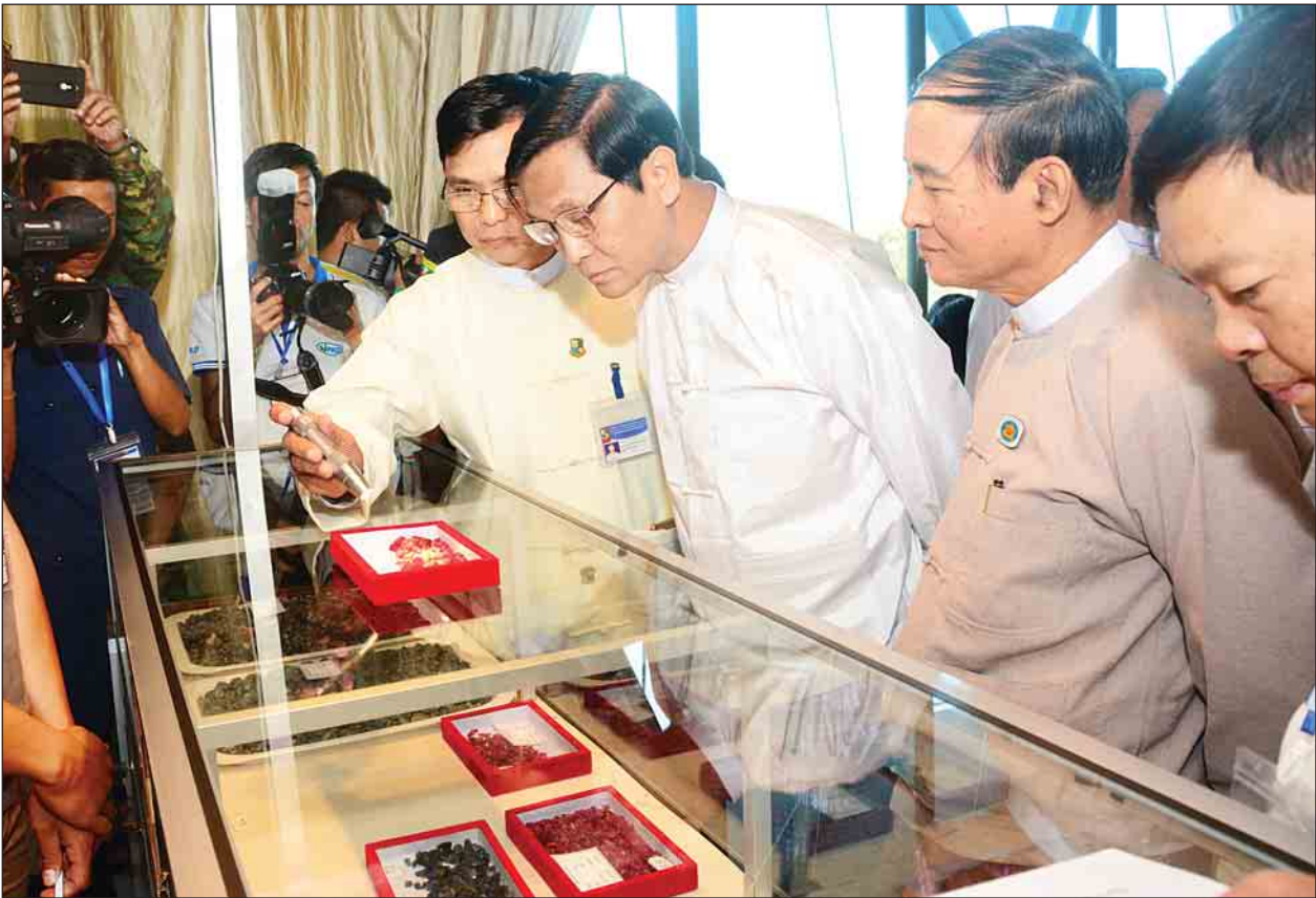
ဒုတိယသမ္မတ ဦးဟင်နရီဗန်ထီးယူ မြန်မာ့ကျောက်မျက်ရတနာပြပွဲအတွင်း ခင်းကျင်းပြသထားသည့် ကျောက်မျက်ရတနာ ပြခန်းများနှင့် ကျောက်မျက်ရတနာ အရောင်းဆိုင်များကို လှည့်လည်ကြည့်ရှုစဉ်။

တတိယအကြိမ် အာရှ-ပစိဖိတ် ရေညီလာခံ အောင်မြင်စွာ ကျင်းပပြီးစီး စာမျက်နှာ - ၃