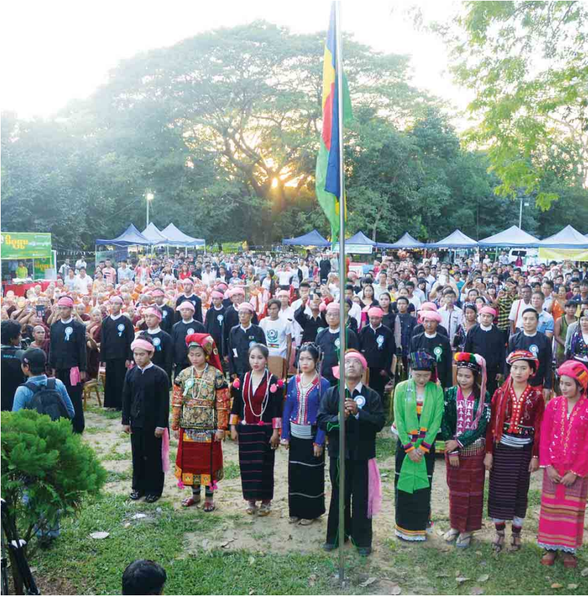
သတင်း-စာနည်းမောင်၊ ဓာတ်ပုံ-အေးမင်းသူ

တအာင်း(ပလောင်) တိုင်းရင်းသားများသည် ရှမ်းပြည်နယ်မြောက်ပိုင်း ပလောင်ကိုယ်ပိုင်အုပ်ချုပ်ခွင့်ရ ဒေသများဖြစ်သော နမ့်ဆန်မြို့နယ်၊ မန်တိုမြို့နယ်နှင့်နမ့်ခမ်း၊ မူဆယ်၊ ကွတ်ခိုင်၊ ကျောက်မဲ၊ လားရှိုး၊ နမ့်တူ၊ မိုးကုတ်၊ မိုးမိတ်နှင့် ရှမ်းပြည်နယ်တောင်ပိုင်းရှိ ကလေး၊ ရပ်စောက်၊ မိုင်းကိုင်မြို့နယ်တို့တွင် အများဆုံးနေထိုင်ပြီး ရန်ကုန်၊ မန္တလေးအစရှိသဖြင့် နေရာအနှံ့တွင် နေထိုင်ကြောင်း၊ အဓိကစီးပွားရေးလုပ်ငန်းအနေဖြင့် လက်ဖက်ခြောက်စိုက်ပျိုးထုတ်လုပ်ရောင်းဝယ်ခြင်းကိုလုပ်ကိုင်ကြောင်းသိရသည်။