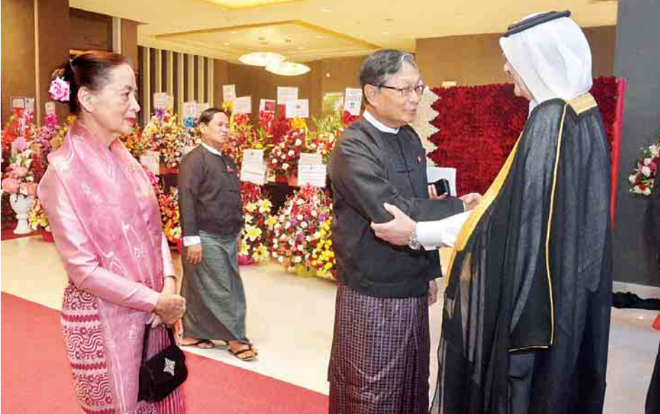
ရွက်ရေးဝန်ကြီးဌာန ပြည်ထောင်စုဝန်ကြီး ဦးကျော်တင်၊ ရန်ကုန်တိုင်းဒေသကြီးဝန်ကြီးချုပ် ဦးဖိုးမင်းသိန်းနှင့် ဖိတ်ကြားထားသည့် ဧည့်သည်တော်များ တက်ရောက်ကြသည်။

ကာတာနိုင်ငံ၏ အမျိုးသားနေ့ အထိမ်းအမှတ် ဧည့်ခံပွဲအခမ်းအနားကို ယနေ့ ည ၇ နာရီတွင် ရန်ကုန်မြို့ နိုင်ငံတော်တော်ဝင် ကျင်းပသည်။ ဧည့်ခံပွဲသို့ နိုင်ငံတော်အတိုင်ပင်ခံရုံးဝန်ကြီးဌာန ပြည်ထောင်စုဝန်ကြီး ဦးကျော်တင်ဆွေနှင့် ဇနီး ဒေါ်မေယဉ်ထွန်းတို့ တက်ရောက်ကြရာ မြန်မာနိုင်ငံဆိုင်ရာ ကာတာနိုင်ငံ သံအမတ်ကြီး H.E.Mr. Hassan Bin Mohamed Rafei AL Emadi က ကြိုဆိုနှုတ်ဆက်သည်။ ကာတာနိုင်ငံ အမျိုးသားနေ့အထိမ်းအမှတ် ဧည့်ခံပွဲအခမ်းအနားတွင် ပြည်ထောင်စု မြန်မာနိုင်ငံတော်သီချင်းနှင့် ကာတာနိုင်ငံတော်သီချင်းတို့ဖြင့် အခမ်းအနားကို စတင်ဖွင့်လှစ်သည်။ အဆိုပါ အခမ်းအနားသို့ အပြည်ပြည်ဆိုင်ရာ ပူးပေါင်းဆောင်