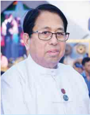
ပြည်ထောင်စုဝန်ကြီး ဒေါက်တာဖေမြင့်

စာပေညီလာခံ ကျင်းပတဲ့အခါမှာ အနယ်နယ်အရပ်ရပ်က စာရေးဆရာကြီးတွေ၊ စာပေပညာရှင်တွေ ပါတယ်။ စာပေစကားပိုင်း ၅၅ ဖွဲ့နဲ့ ကျွန်တော်တို့ ဆွေးနွေးကြတယ်။ အဲဒီကနေ ကျွန်တော်တို့ ဆွေးနွေးကြတဲ့