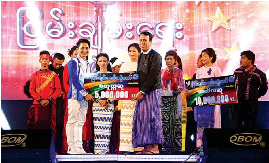
ပြန်ကြားရေးဝန်ကြီးဌာန ပြည်ထောင်စုဝန်ကြီး ဒေါက်တာဖေမြင့် ပထမဆုရ မေသူကျော်အား ဆုချီးမြှင့်စဉ်။