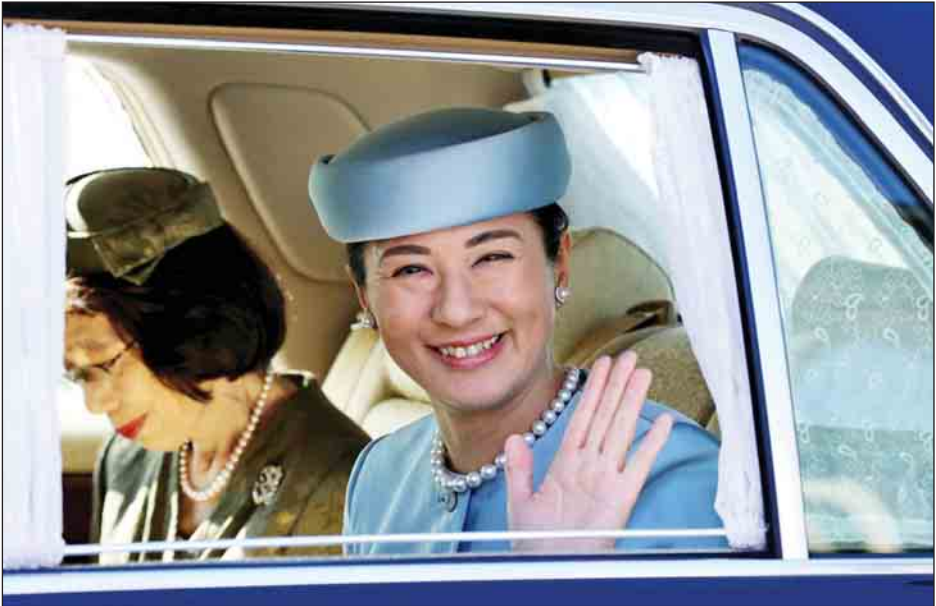
မာဆာ့ကိုသည် အိမ်ရှေ့မင်းသား နာရူဟီတိုနှင့်အတူ ခဲ့သော နိုင်ငံအရှေ့မြောက်ပိုင်း မီးယာဂီခရိုင်သို့ လွန်ခဲ့၂၀၁၁ ခုနှစ်က မြေငလျင်နှင့် ဆူနာမီရေလှိုင်းဒဏ်ခံစားသည့်လက သွားရောက်ခဲ့သည်။ ကျိုနို

ဟားဗတ်တက္ကသိုလ်နှင့် အောက်စဖို့ဒ်တက္ကသိုလ်တို့၌ ပညာဆည်းပူးခဲ့ပြီး သံတမန်ဟောင်းတစ်ဦးဖြစ်သူ