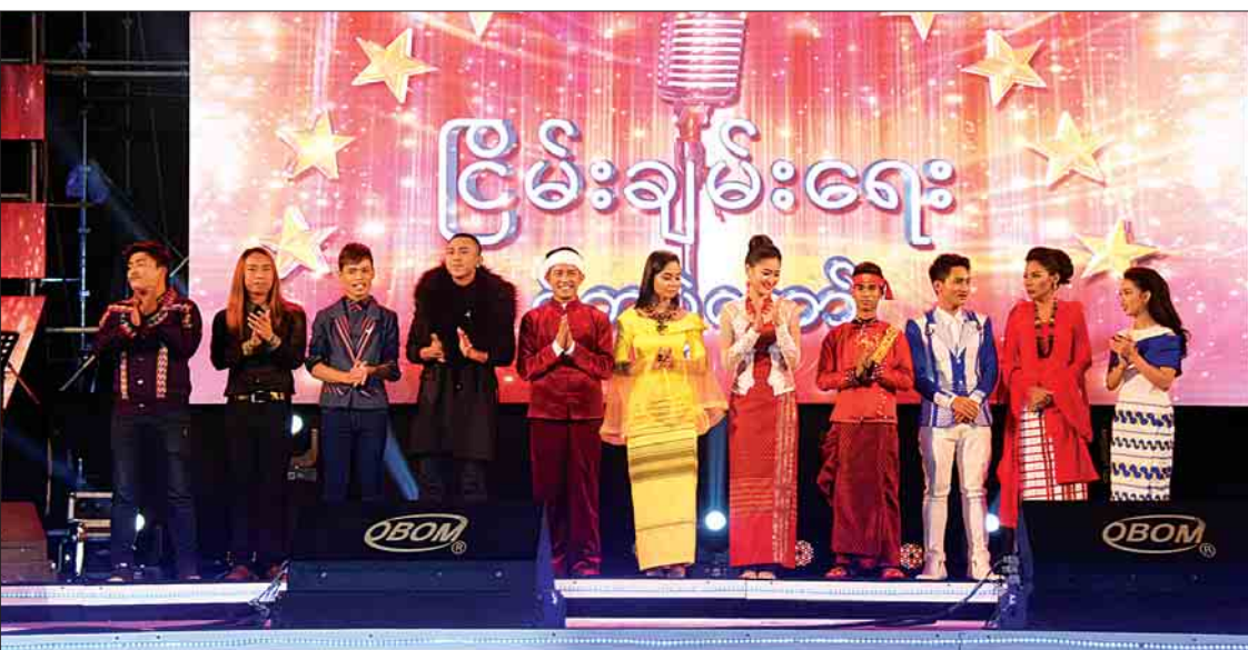
ငြိမ်းချမ်းရေးဂီတပွဲတော် သီချင်းဆိုပြိုင်ပွဲတွင် ဆုရရှိသူများကို တွေ့ရစဉ်။

ဒီဆုက မကြာအတွက် သမိုင်းမှတ်တိုင်တစ်ခုကို စိုက်ထူနိုင်လိုက်ပြီလို့ ယုံကြည်ပါတယ်။ မကြာက မြန်မာသံစဉ်တွေကို ချစ်မြတ်နိုးလို့ ထိန်းသိမ်းထားတာဖြစ်ပါတယ်။ မကြာ(၁၁)နှစ်သမီးကတည်းက ဆိုခဲ့တဲ့ မြန်မာသံစဉ်လေးတွေကို မြတ်နိုးတယ်။ ဒါကြောင့် မကြာရဲ့ မြန်မာသံစဉ်လေးတွေကို ကောင်းသည်ထက်ကောင်းအောင် ကြိုးစားခဲ့တာပါ။ ပြိုင်ပွဲကြီး ပြီးသွားရင်တော့ မကြာ