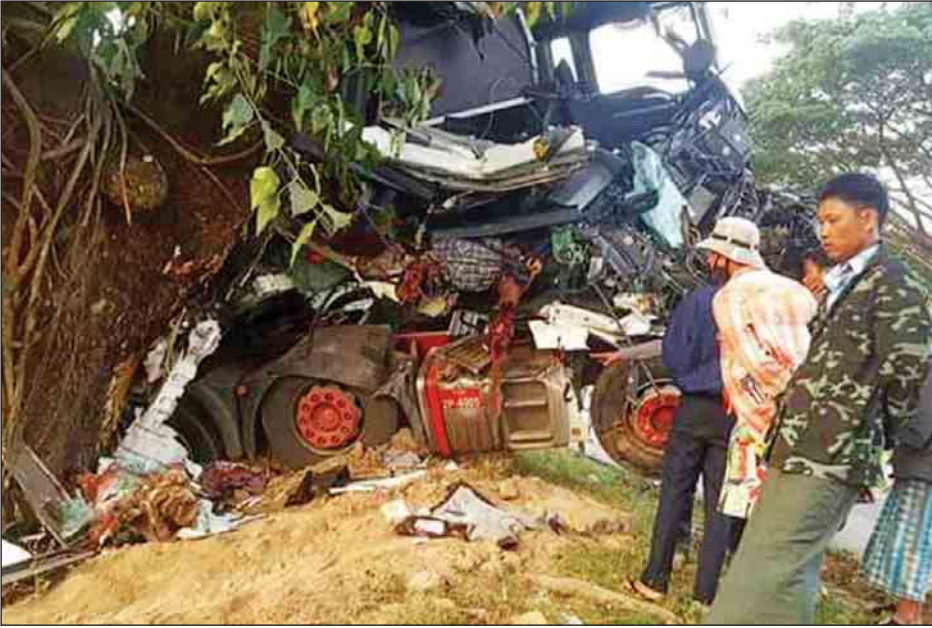
သေဆုံးသွားခဲ့ကြောင်း သိရသည်။ သို့ပါ၍ အမည်မသိ(စုံစမ်းဆဲ)