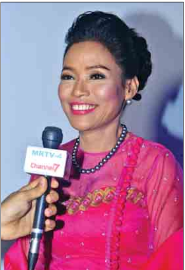
ကြာကြာနိုင်