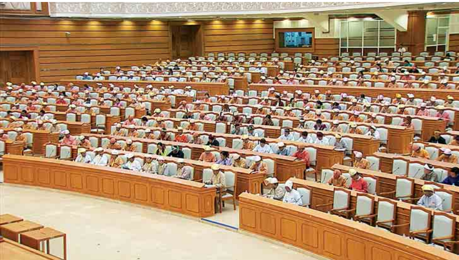
ပြည်ထောင်စုလွှတ်တော် အစည်းအဝေး တက်ရောက်သူများကို တွေ့ရစဉ်။

အဆိုပါ အာဆီယံသဘောတူညီချက် လက်မှတ်ရေးထိုးရေးကိစ္စကို ပြည်ထောင်စုအစိုးရအဖွဲ့၊ စီးပွားရေးရာကော်မတီ၏ (၁၈/၂၀၁၇) ကြိမ်မြောက် အစည်းအဝေးနှင့် နိုင်ငံတော်သမ္မတရုံးတို့မှ ပြည်ထောင်စုအစိုးရအဖွဲ့အစည်းအဝေးသို့ ဆက်လက် တင်ပြရန် သဘောတူခဲ့ပြီး ပြည်ထောင်စု အစိုးရအဖွဲ့ အစည်းအဝေးအမှတ်စဉ် (၂၁/၂၀၁၇) မှ ကြိုတင် ခွင့်ပြုပြီးဖြစ်ပါကြောင်း၊ ရွှေ့ပြောင်း အလုပ်သမားများ၏ အခွင့်အရေးများ ကာကွယ်စောင့်ရှောက်ခြင်းနှင့် မြှင့်တင်ခြင်းဆိုင်ရာ အာဆီယံသဘောတူညီချက် (ASEAN Consensus on the Protection and Promotion of the Rights of Migrant Workers)ကို ဖိလစ်ပိုင်နိုင်ငံ၌ ကျင်းပမည့် (၃၁) ကြိမ်မြောက် အာဆီယံ ထိပ်သီးအစည်းအဝေးတွင်