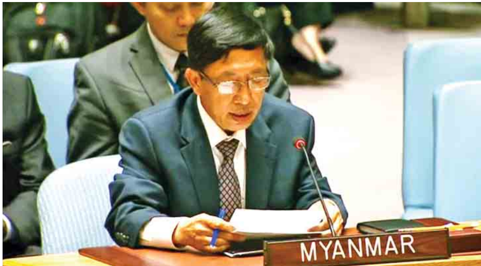
ကုလသမဂ္ဂမြန်မာအမြဲတမ်းကိုယ်စားလှယ် ဦးဟောက်ခိုဆွမ်း မိန့်ခွန်းပြောကြားစဉ်။