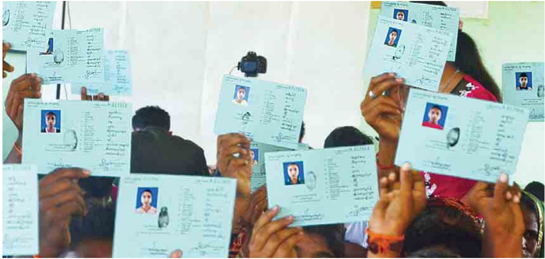
မောင်တောမြို့၌ National Verification Card ရရှိပြီးသူများအား တွေ့ရစဉ်။