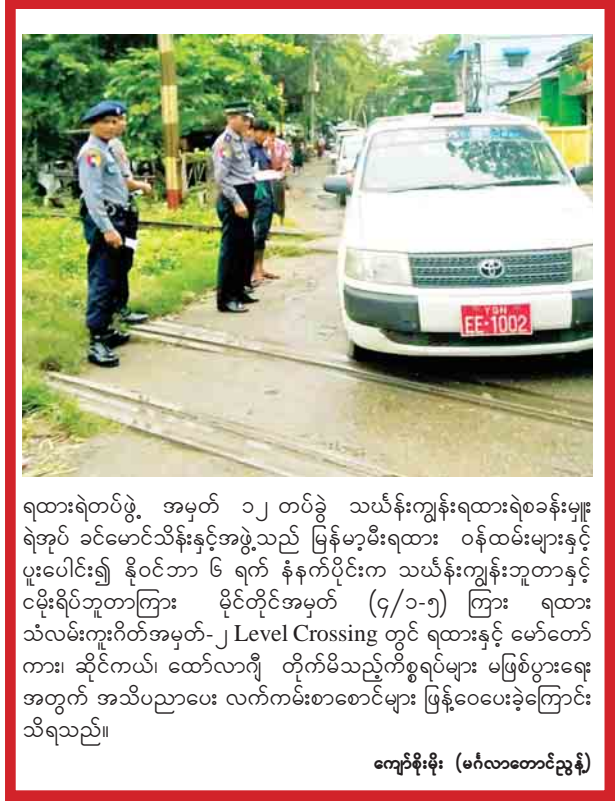
ကျော်စိုးစိုး (မင်္ဂလာတောင်ညွန့်)