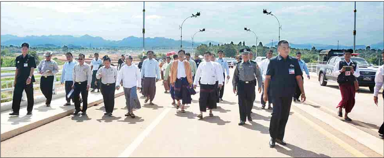
ဒုတိယသမ္မတ ဦးမြင့်ဆွေ မြန်မာ-ထိုင်း ချစ်ကြည်ရေးတံတားအမှတ်(၂)ကို ကြည့်ရှုစစ်ဆေးစဉ်။

ရှင်းလင်းတင်ပြချက်များနှင့်စပ်လျဉ်း၍ ဒုတိယသမ္မတ ဦးမြင့်ဆွေက