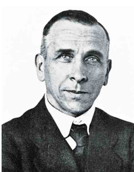
သိပ္ပံပညာရှင် အဲလ်ဖရက် ဝစ်ဂျင်နာ

Wegener ရဲ့ တင်ပြချက်ကို သူနှင့် ခေတ်ပြိုင်သိပ္ပံပညာရှင် အားလုံးလိုလိုက လက်မခံ၊ ငြင်းပယ်ပါတယ်။ (၁၉၁၅) ခုနှစ်မှာ ပထမအကြိမ် ထုတ်ဝေခဲ့တဲ့ သူ့