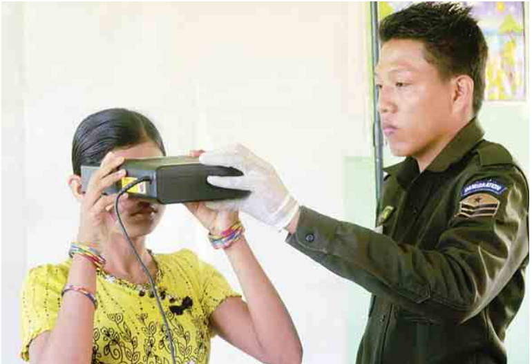
ရွှေငေးကျေးရွာ အခြေခံပညာမူလတန်းလွန်ကျောင်း၌ National Verification Card များ ပြုလုပ်ပေးနေစဉ်။