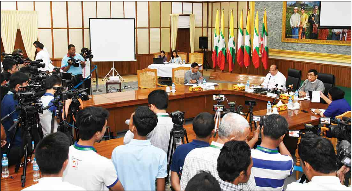
ရခိုင်ပြည်နယ်တွင် ဖြစ်ပွားနေသည့်ကိစ္စရပ်များနှင့်ပတ်သက်၍ သတင်းစာရှင်းလင်းပွဲ ကျင်းပစဉ်။

နေပြည်တော် စက်တင်ဘာ ၆ လူမှုဝန်ထမ်း၊ ကယ်ဆယ်ရေးနှင့် ပြန်လည်နေရာချထားရေးဝန်ကြီးဌာန ပြည်ထောင်စုဝန်ကြီး ဒေါက်တာဝင်းမြတ်အေးနှင့် အမျိုးသားလုံခြုံရေးဆိုင်ရာအကြံပေးပုဂ္ဂိုလ် ဦးသောင်းထွန်းတို့က ပြည်တွင်း၊ ပြည်ပသတင်းဌာနများအား ရခိုင်ပြည်နယ်တွင် လတ်တလောဖြစ်ပွားနေသည့် ကိစ္စရပ်များနှင့်ပတ်သက်၍ သတင်းစာရှင်းလင်းပွဲတစ်ရပ်ကို ယနေ့မွန်းလွဲ ၁ နာရီခွဲတွင် နိုင်ငံတော်အတိုင်ပင်ခံရုံးဝန်ကြီးဌာန၌ ကျင်းပသည်။ သတင်းစာရှင်းလင်းပွဲတွင် အမျိုးသားလုံခြုံရေးဆိုင်ရာအကြံပေးပုဂ္ဂိုလ် ဦးသောင်းထွန်းက ရခိုင်ပြည်နယ်တွင် ဖြစ်ပွားနေသည့်ကိစ္စရပ်များနှင့်ပတ်သက်၍ ကမ္ဘာ့သတင်းမီဒီယာအချို့တွင် သတင်းမှားများရေးသားဖော်ပြခြင်း၊ လူမှုကွန်ရက်စာမျက်နှာများ၌ မဟုတ်မမှန်ထင်ယောင်ထင်မှားဖြစ်စေမည့် သတင်းများအား ရည်ရွယ်ချက်ဖြင့် ဖြန့်ဝေနေခြင်းတို့ကြောင့် မြန်မာနိုင်ငံအပေါ် နိုင်ငံတကာမှ အထင်အမြင်လွဲမှားမှုများဖြစ်ပေါ်စေပြီး ရခိုင်ပြည်နယ်အရေးကိစ္စ ဆောင်ရွက်ချက်များကိုလည်း ထိခိုက်စေကြောင်း၊ ထိုသို့ သတင်းမှားများ ပျံ့နှံ့နေခြင်းသည် အကြမ်းဖက်သမားများအပေါ် ထောက်ခံပေးသကဲ့သို့ ဖြစ်နေကြောင်း၊ သို့ဖြစ်၍ မီဒီယာများအနေဖြင့် ခိုင်လုံသည့် အချက်အလက်များအပေါ် အခြေခံသည့် ပကတိအခြေအနေမှန်များကို ဖော်ပြရေးသားခြင်းဖြင့် ရခိုင်ပြည်နယ် စာမျက်နှာ ၉ ကော်လံ ၁ သို့ *