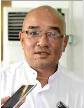
ဇာတ်လမ်း၊ ဇာတ်ညွှန်း ဦးသူရ

ဇာတ်လမ်း၊ ဇာတ်ညွှန်း ဦးသူရ ဒီဇာတ်လမ်းက ကျွန်တော်