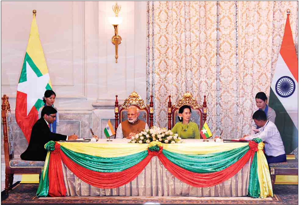
နိုင်ငံတော်၏အတိုင်ပင်ခံပုဂ္ဂိုလ်နှင့် အိန္ဒိယဝန်ကြီးချုပ်တို့၏ ရှေ့မှောက်တွင် နှစ်နိုင်ငံကြား သဘောတူညီချက် နားလည်မှုစာချွန်လွှာများ လက်မှတ်ရေးထိုးကြစဉ်။

သတင်းစာရှင်းလင်းပွဲတွင် နိုင်ငံတော်၏ အတိုင်ပင်ခံပုဂ္ဂိုလ်က ဒေသ