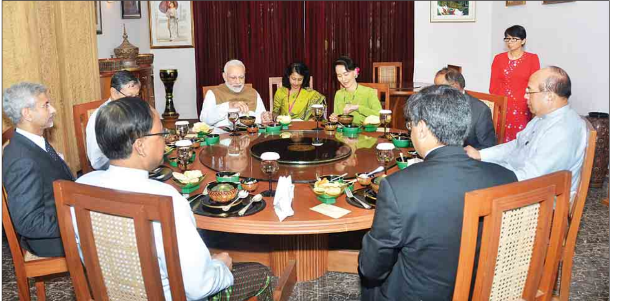
နိုင်ငံတော်၏အတိုင်ပင်ခံပုဂ္ဂိုလ် ဒေါ်အောင်ဆန်းစုကြည် အိန္ဒိယသမ္မတနိုင်ငံဝန်ကြီးချုပ် ရှာရီနာရန်ဒရာမိုဒီအား နေပြည်တော် ဇမ္ဗူသီရိမြို့နယ်ရှိ နေအိမ်၌ နေ့လယ်စာစားပွဲဖြင့် တည်ခင်းညှိနှိုင်းသည်။

စာပေဗိမာန်အသင်းဝင်လိုပါက အတွင်းရေးမှူး စာပေဗိမာန်စာအုပ် အသင်း အမှတ် (၅၂၉/၅၃၁) ကုန်သည်လမ်း ရန်ကုန်မြို့ ဖုန်း ၀၁-၂၄၉၀၃၁၊ ၃၈၁၄၄၈ သို့ လိပ်မူ၍ ဆက်သွယ်နိုင်ကြောင်း သတင်းရရှိသည်။(ကြေးမုံ)