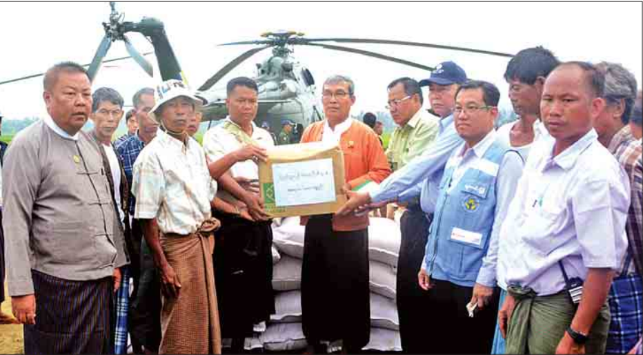
ရခိုင်ပြည်နယ်ဝန်ကြီးချုပ်ဦးညီပု၊ နိုင်ငံတော်အတိုင်ပင်ခံရုံးဝန်ကြီးဌာန ဒုတိယဝန်ကြီး ဦးခင်မောင်တင်နှင့် တာဝန်ရှိသူများ မင်္ဂလာညွန့်ကျေးရွာဒေသခံများအား စားနပ်ရိက္ခာများ ကူညီထောက်ပံ့ပေးစဉ်။

စစ်တွေ စက်တင်ဘာ ၆ ARSA အစွန်းရောက်အကြမ်းဖက်သမားများ၏ တိုက်ခိုက်မှုကြောင့် ခေတ္တနေရပ်စွန့်ခွာတိမ်းရှောင်လာကြသည့် ဒေသခံတိုင်းရင်းသားများအတွက် ပြည်ထောင်စုအစိုးရ ဦးဆောင်မှုဖြင့် လူမှုဝန်ထမ်း၊ ကယ်ဆယ်ရေးနှင့် ပြန်လည်နေရာချထားရေးဝန်ကြီးဌာနနှင့် ရခိုင်ပြည်နယ်အစိုးရအဖွဲ့တို့ ပူးပေါင်းကူညီထောက်ပံ့သော စားနပ်ရိက္ခာများအား ရခိုင်ပြည်နယ်ဝန်ကြီးချုပ် ဦးညီပု၊ နိုင်ငံတော်အတိုင်ပင်ခံရုံးဝန်ကြီးဌာန ဒုတိယဝန်ကြီး ဦးခင်မောင်တင်နှင့် တာဝန်ရှိသူများအဖွဲ့သည် ယနေ့မွန်းလွဲပိုင်းတွင် မောင်တောဒေသ မင်္ဂလာညွန့်ကျေးရွာနှင့် တမန်းသားကျေးရွာများသို့ ရဟတ်ယာဉ်ဖြင့် သွားရောက်ကူညီထောက်ပံ့လှူဒါန်းသည်။ ပြည်နယ်ဝန်ကြီးချုပ်၊ ဒုတိယဝန်ကြီးနှင့်အဖွဲ့သည် တမန်းသားကျေးရွာသို့ မွန်းလွဲ ၂ နာရီ ၄၅ မိနစ်တွင် ရောက်ရှိကြပြီး ဒေသတွင်းရှိ