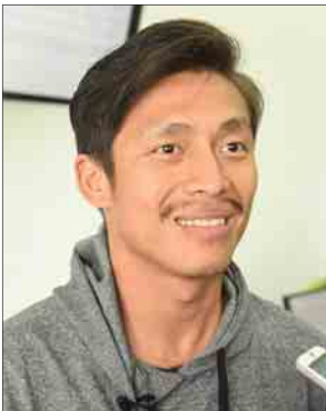
အကယ်ဒမီထွန်းထွန်း

ထောင်ထဲမှာနေကတည်းက ကြားခဲ့ရတဲ့ဇာတ်လမ်းဗျ။ ကျွန်တော့်ကိုပြောပြတဲ့လူကလည်း နိုင်ငံရေးအကျဉ်းသားပဲ။ အခုသူကတော့လွတ်တော်အမတ်ဖြစ်နေပါပြီ။ အဲဒီဒေသကပဲဆိုတော့ ဒီအကြောင်းလေးသူတို့ထဲမှာရှိတယ်။ လူတစ်ယောက် အကြောင်းပေါ့။ အဲဒီတုန်းကတည်းက စိတ်ဝင်စားနေပြီး ထောင်ပြင်ပြန်ရောက်လာတော့ ကျွန်တော့်ဘာသာ အကြမ်းသဘောမျိုးလေးရေးထားဖြစ်တယ်။ မနှစ်ကမှ ကျွန်တော်တို့ကိုယ်ပိုင်ရိုက်မယ်ဆိုပြီး လိပ်သိုက်သွား နေရာတွေဘာတွေ ကြည့်ပြီး ပြန်လာတော့မှ ပြန်ကြားရေးဝန်ကြီးကခေါ်တော့ ဒီဇာတ်လမ်းကို