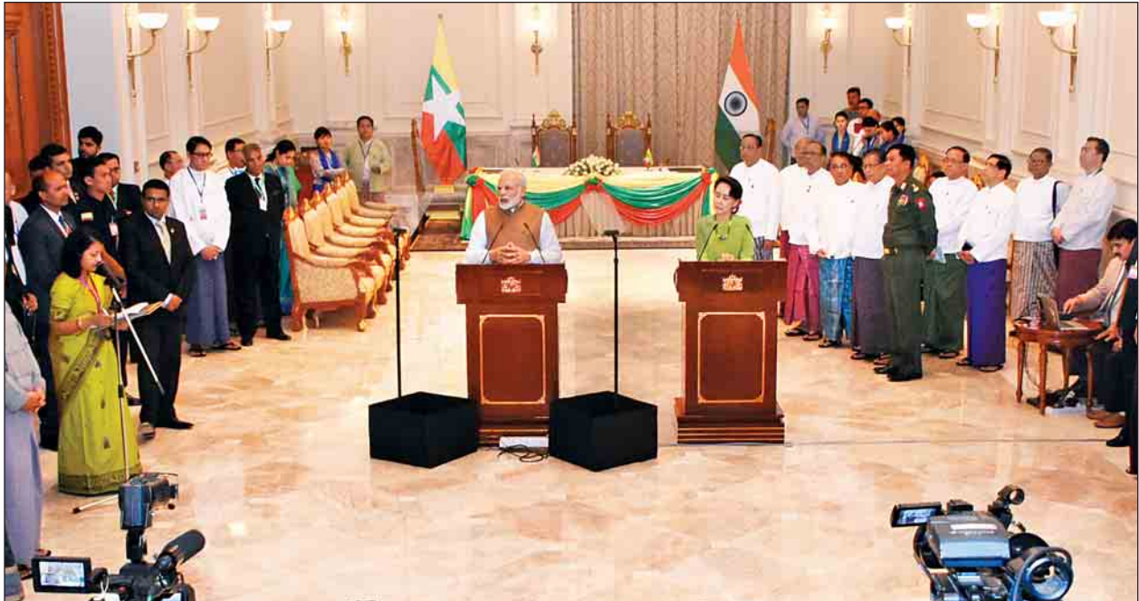
နိုင်ငံတော်၏အတိုင်ပင်ခံပုဂ္ဂိုလ် ဒေါ်အောင်ဆန်းစုကြည်နှင့် အိန္ဒိယသမ္မတနိုင်ငံဝန်ကြီးချုပ် ရှာရီနာရန်ဒရာမိုဒီတို့ သတင်းစာရှင်းလင်းပွဲပြုလုပ်စဉ်။