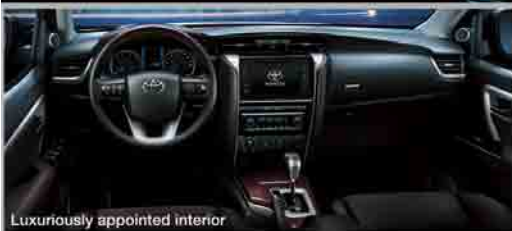
Luxuriously appointed interior