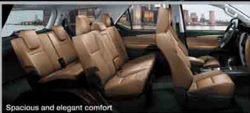
Spacious and elegant comfort