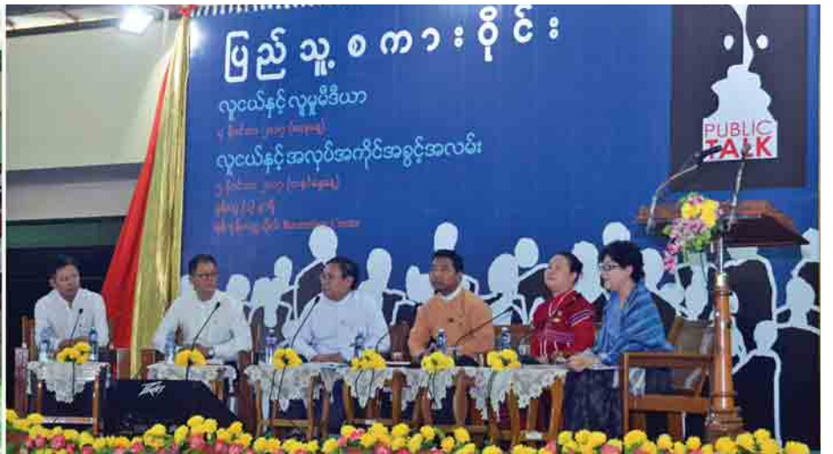
လူငယ်နှင့် အလုပ်အကိုင်အခွင့်အလမ်း ခေါင်းစဉ်ဖြင့် ပြည်သူ့စကားဝိုင်းကို ရန်ကုန်တက္ကသိုလ် Recreation Centre ၌ ကျင်းပစဉ်။