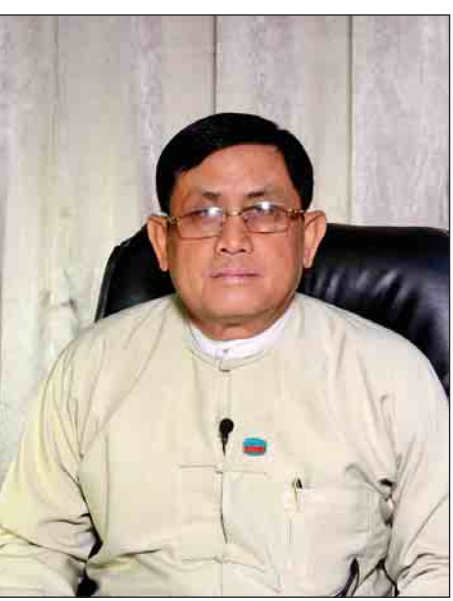
ဦးမောင်မောင်ဝင်း (ဒုတိယဝန်ကြီး၊ စီမံကိန်းနှင့် ဘဏ္ဍာရေးဝန်ကြီးဌာန)

ပြည်တွင်းအင်အားကိုယူပြီး ထုတ်ချေးမယ်ဆိုတာကလည်း မြန်မာ့စီးပွားရေးဘဏ်အနေနဲ့ အပ်ငွေအများဆုံးရှိတဲ့ အဖွဲ့အစည်းဖြစ်တဲ့အတွက် ပုံမှန်ချေးနေတဲ့ Commercial Loan လို့ခေါ်တဲ့ စီးပွားရေးချေးငွေကတော့ တစ်နှစ်ကို အတိုးနှုန်း ၁၃ ရာခိုင်နှုန်းနဲ့ ထုတ်ချေးပါတယ်။ ဒီစီးပွားရေးချေးငွေမှာ သက်တမ်းက တစ်နှစ်ပဲချေးနိုင်တယ်ဆိုတဲ့ အနေအထား၊ အတိုးနှုန်းကလည်း ၁၃