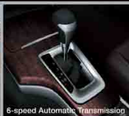
6-speed Automatic Transmission