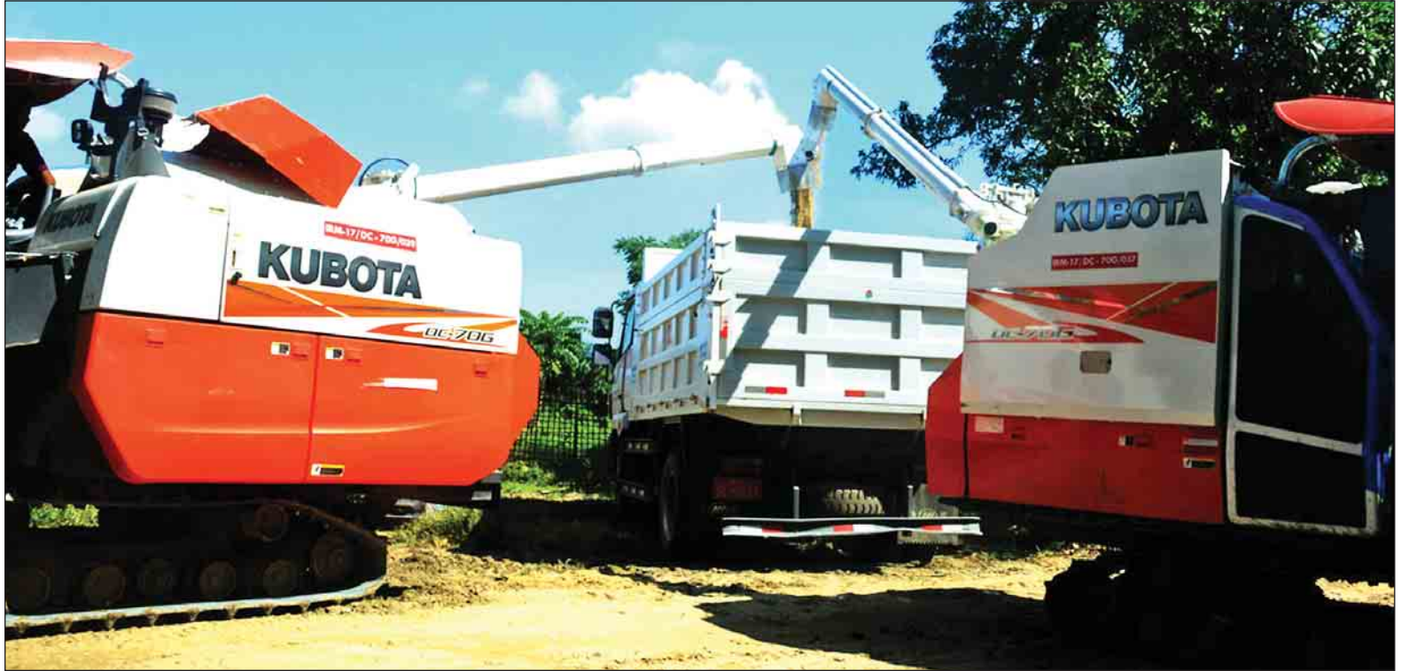
မောင်တောတောင်ပိုင်းဒေသ ကျောင်းတောင်ကျေးရွာ၌ စက်မှုလယ်ယာဦးစီးဌာနမှ ရိတ်သိမ်းခြွေလှေစက်ကြီးများဖြင့် စပါးခြွေလှေပြီး မော်တော်ယာဉ်ပေါ်သို့ တင်ဆောင်နေစဉ်။

သစ်ပင်စိုက်ပါ ဒို့ကမ္ဘာ သာယာလှပ စိမ်းမြေမြေ