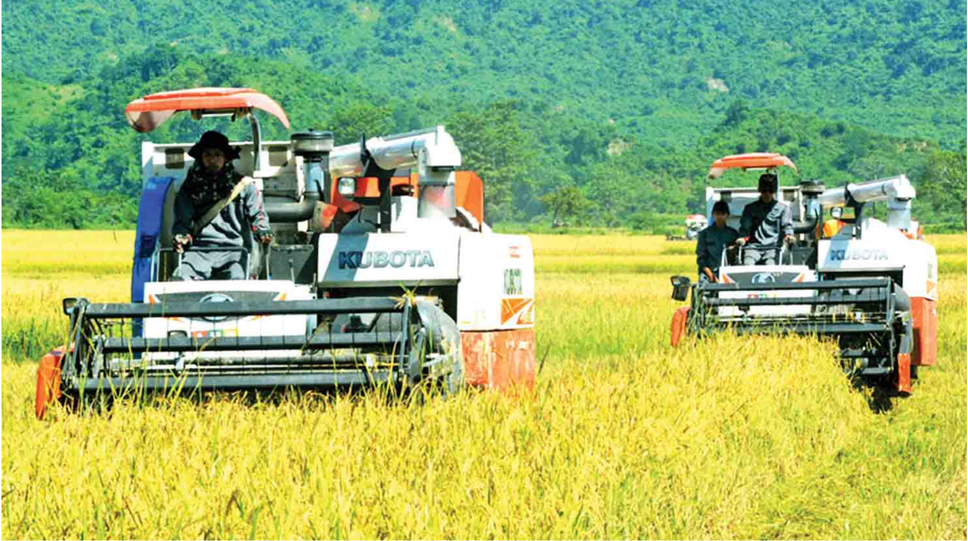
မောင်တောတောင်ပိုင်းဒေသ ကျောင်းတောင်ကျေးရွာ၌ စက်မှုလယ်ယာဦးစီးဌာနမှ ရိတ်သိမ်းခြွေလှေ့စက်ကြီးများဖြင့် ရိတ်သိမ်းပေးနေစဉ်။

လူငယ်နှင့် အလုပ်အကိုင်အခွင့်အလမ်း ခေါင်းစဉ်ဖြင့် ပြည်သူ့စကားဝိုင်းကျင်းပ တိုင်းပြည်မှာ ဒီမိုကရေစီ ပိုမိုပြည့်ဝတဲ့ စနစ်တစ်ခု တည်ဆောက်နိုင်ဖို့လေ့ကျင့်ဆောင်ရွက်နေတာဖြစ် စာမျက်နှာ - ၇