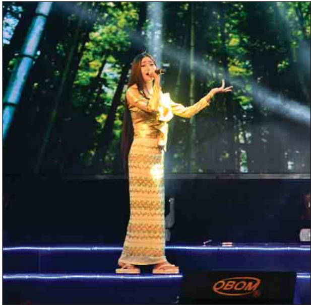
ငြိမ်းချမ်းရေးဂီတပွဲတော်(၂၀၁၇) သီချင်းဆိုပြိုင်ပွဲ Level(3) အဆင့် ပွဲစဉ်(၁) တွင် ပြိုင်ပွဲဝင်နေသူတစ်ဦးကို တွေ့ရစဉ်။