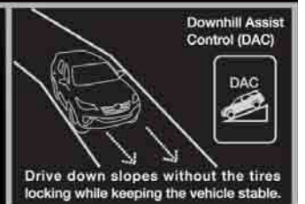
Downhill Assist Control (DAC)