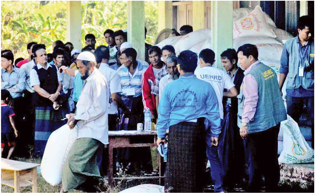
UEHRD စေတနာ့ဝန်ထမ်းလူငယ်များ ငါးခုရကျေးရွာရှိ အစ္စလာမ်ဘာသာဝင်များအား ထောက်ပံ့ပစ္စည်းများ ပေးအပ်စဉ်။