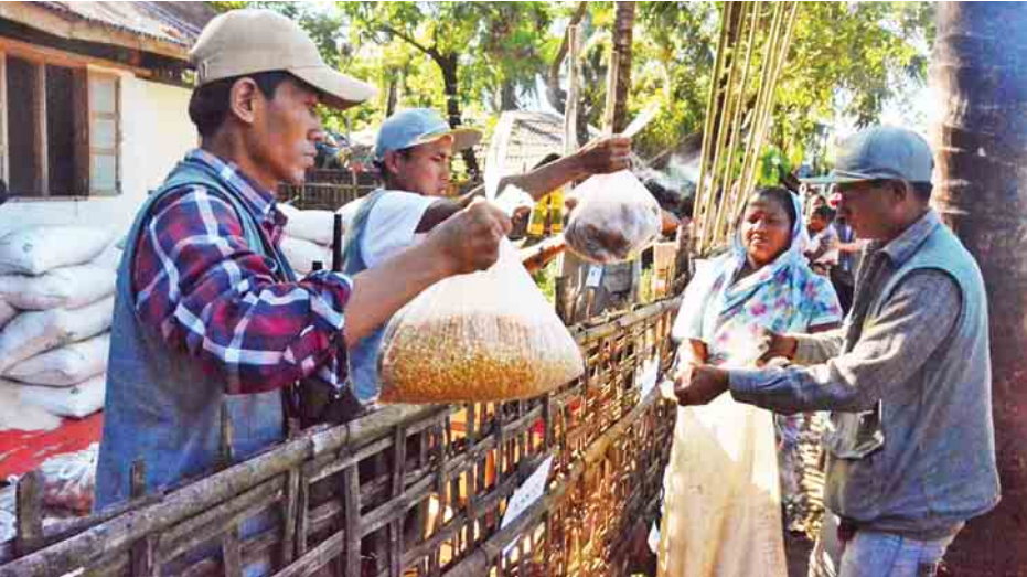
UEHRD စေတနာ့ဝန်ထမ်းလူငယ်များ ငါးခုရကျေးရွာရှိ ဟိန္ဒူဘာသာဝင်များအား ထောက်ပံ့ပစ္စည်းများ ပေးအပ်စဉ်။

နည်းနေတယ်။ အခု UEHRD လူငယ်တွေက ဆီ၊ ဆန်၊ ဆား၊ ငရုတ်၊ အာလူး၊ ပဲ စတာတွေကို လာပေးပါတယ်။ အဲဒါလေးတွေနဲ့ စားနေရတယ်။ အခု အလုပ်မရှိပါဘူး။ အရင်တုန်းက ဈေးဆိုင်တွေ ဘာတွေရောင်းတယ်။ ခုတော့ မရှိတော့ပါဘူး။ အကြမ်းဖက်ဖြစ်စဉ်တုန်းက သူတို့ ARSA တွေက ခေါင်းစွပ်အမည်းတွေစွပ်ပြီး စခန်းက သူတွေနဲ့ အပြန်အလှန်လာပြီးတော့ ပစ်ကြတယ်။ အဲဒီတုန်းက ကျွန်မတို့ ညဘက် ၁၁ နာရီလောက်မှာ ဒီစခန်းထဲကို ဝင်ပြီးတော့ ပြေးကြရပါတယ်။ ဒီရွာမှာက ဟိန္ဒူ၊ ဘင်္ဂါလီ၊ ရခိုင် သုံးစုနေကြပါတယ်။ အရင်တုန်းက ဘာသာချင်း မတူလည်း အေးအေးချမ်းချမ်းရှိပါတယ်။ တစ်ယောက်နဲ့ တစ်ယောက် အပြန်အလှန် ရှိကြပါတယ်။ သူတို့မှာ မရှိရင်လည်း တောင်းတယ်။ ချေးငှားပါတယ်။ သူတို့ကလည်း အပြန်အလှန် ကူညီပါတယ်။ အခု ဒီမှာ ထွက်မပြေးဘဲ