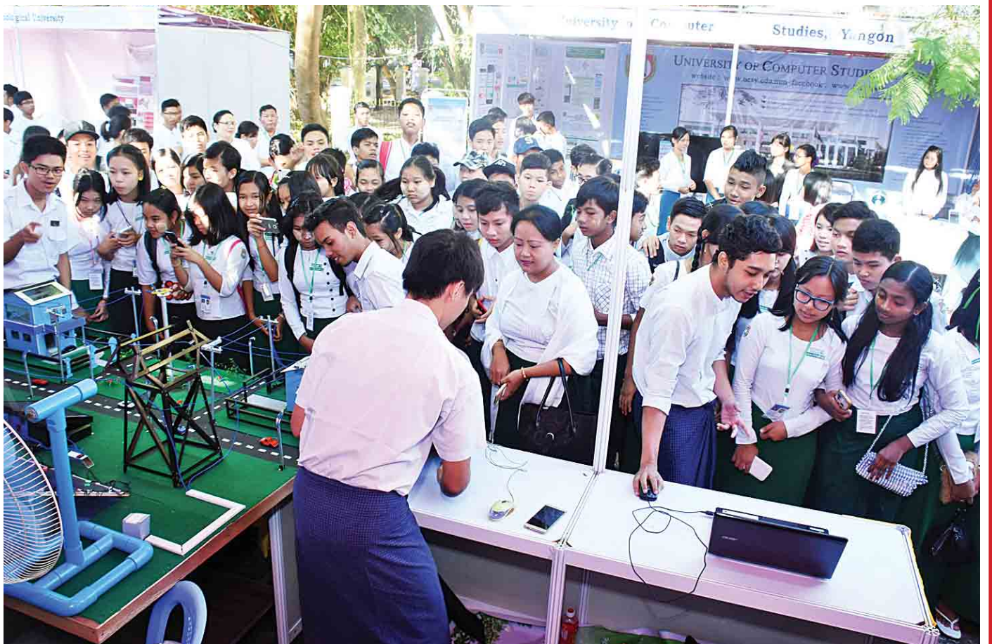
လူငယ်ဘက်စုံဖွံ့ဖြိုးရေးပွဲတော်တွင် ကျောင်းသား ကျောင်းသူ လူငယ်များ နည်းပညာဆိုင်ရာ ပြခန်းတွင် စိတ်ဝင်တစား လေ့လာနေကြစဉ်။

ဦးစွာ ရန်ကုန်တက္ကသိုလ် အဓိပတိလမ်း တစ်ဖက်တစ်ချက်တွင် ဘာသာရပ်ဆိုင်ရာ ပြခန်းကလေးများကို တွေ့ရသည်။ ရန်ကုန်နှင့် ပဲခူးကဲ့သို့ တိုင်းဒေသကြီးအတွင်း အခြေခံပညာ အထက်တန်းကျောင်းအချို့မှ ပြခန်းများကိုလည်း တွေ့ရ၏။ ပြခန်းတစ်ခုသို့ ဝင်လိုက်သည်နှင့် ကျောင်းသား ကျောင်းသူအသီးသီးတို့သည် မိမိတို့ကျောင်းမှပြသထားသည့် သိပ္ပံဆိုင်ရာ တီထွင်မှုများကို တစ်ခုစီ စိတ်ရှည်လက်ရှည် ရှင်းပြကြသည်ကို