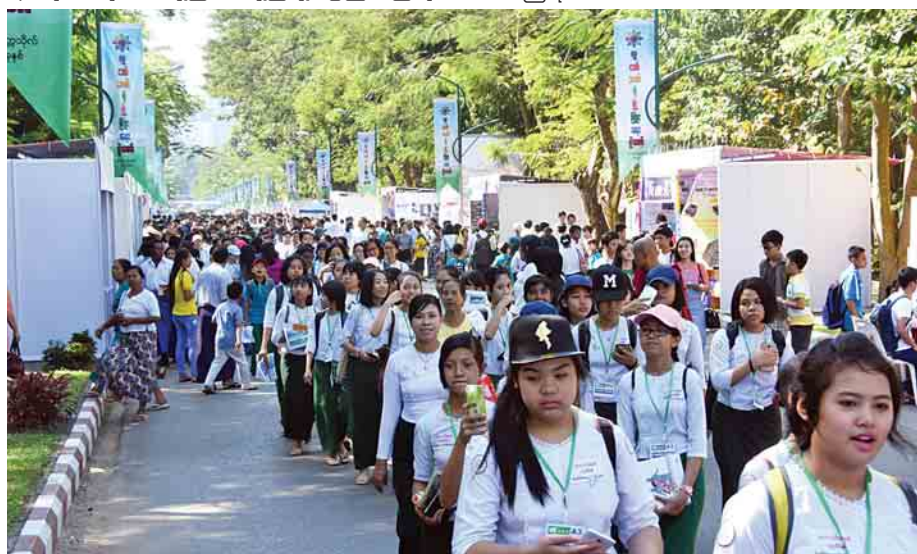
လူငယ်ဘက်စုံဖွံ့ဖြိုးရေးပွဲတော်လာရောက်လေ့လာကြသည့် ကျောင်းသူများ။

မည်သို့ပင်ဆိုစေ ကျောင်းသား ကျောင်းသူ၊ လူငယ်များ ကိုယ်တိုင်ပါဝင်ဆင်နွှဲနေသည့် လူငယ်ဘက်စုံဖွံ့ဖြိုးရေးပွဲတော်တွင် ပါဝင်လှုပ်ရှားနေသည့် လူငယ်များ၏ တက်ကြွသည့် အားမာန်၊ ထက်သန်သည့် စိတ်နှလုံးသားကို အထင်အရှားတွေ့မြင်နေရလေပြီ။ စာရေးသူတို့ ပြန်လာချိန်တွင် နေရောင်ခြည်ပင် အတော်ကလေးကျသွားပြီဖြစ်၏။ အဓိပတိလမ်းမကြီးတစ်လျှောက် ရေတမာနံ့ ခရေကတို့ကား သင်းရနံ့လှိုင်၍ နေချေပြီ။ သစ်ပင်ပင်ကြီးကား ခန့်ခန့်တည်တည်၊ လူငယ်ထု၏ တက်တက်ကြွကြွ အားမာန်အလှများကို ကျေနပ်နေသည့်ဟန်။ ထင်ဟပ်နေသည့်သဏ္ဌာန်ပင် ဖြစ်ပေတော့သည်။ ။