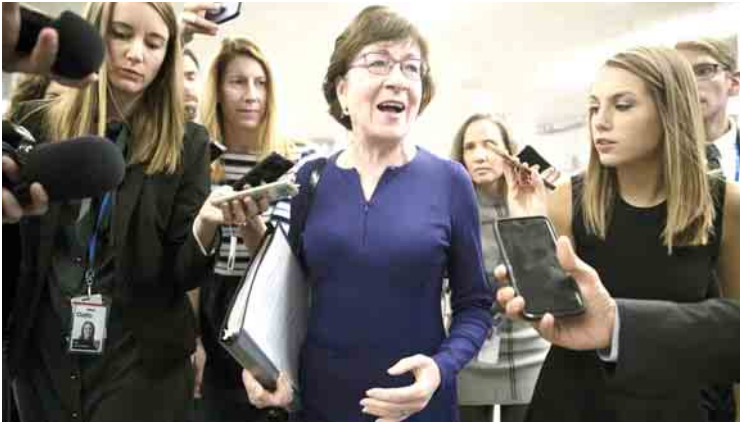
အခွန်ဆိုင်ရာ ဥပဒေမူကြမ်း အတည်ပြုခြင်းနှင့် ပတ်သက်၍ အထက်လွှတ်တော်အမတ်တစ်ဦးအား သတင်းထောက်များက မေးမြန်းကြစဉ်။

အဖြစ် အထက်လွှတ်တော်က အခွန်ပြုပြင် ပြောင်းလဲရေးဆိုင်ရာ ဥပဒေမူကြမ်းတစ်ရပ်ကို ထောက်ခံမဲ ပွတ်ကာသီကာ အနိုင်ရရှိမှုဖြင့် ဒီဇင်ဘာ ၂ ရက်က အတည်ပြုပေးခဲ့သည်။ နိုင်ငံတော်၏ စီးပွားရေး ပိုမိုတိုးတက် ကောင်းမွန်စေရေးအတွက် ပြုပြင်ပြောင်းလဲ ရေး အစီအစဉ်များအတွက် ဘဏ္ဍာငွေကြေး ထောက်ပံ့ပေးနိုင်စေရန် ဆောင်ရွက်ရာ၌ လာမည့်ဆယ်နှစ်တာကာလပတ်လုံး အမျိုး သား ကြေးမြီ ဒေါ်လာ ၂၀ ထရီလီယံ ပမာဏ တွင် နောက်ထပ်ဒေါ်လာ ၁ ဒသမ ၄ ထရီ လီယံ တိုးစေလိုမည်ဟု ချီပတ်ဘလီကန် အမတ်များက ဆိုကြသည်။ ကြီးကျယ်လှသည့် အခွန်ဆိုင်ရာ ပြုပြင် ပြောင်းလဲရေး အစီအစဉ်သစ်ကို အထက် လွှတ်တော်က ထောက်ခံအတည်ပြုပေးခြင်း အတွက် ချီးကျူးပါကြောင်း သမ္မတထရပ်က အိမ်ဖြူတော်မှ နယူးယောက်မြို့သို့ မထွက်ခွာမီ သတင်းထောက်များအား ပြောကြားသည်။ အခွန်ဆိုင်ရာ ဥပဒေသစ်နှင့် ပတ်သက်၍ အထက်လွှတ်တော်နှင့် အောက်လွှတ်တော် နှစ်ရပ်အကြား စေ့စပ်ညှိနှိုင်းမှုများ ပြုလုပ် ပြီးစီးသည်နှင့် တစ်ပြိုင်နက်တည်းကမ္ဘာတိုများ