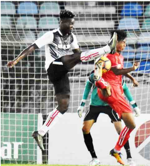
MNL ညွှန်ပေါင်းအသင်းအတွက် ချေပပေးသွင်းခဲ့သည့် အိမ်နံနူရယ် မြန်မာ ယူ-၂၀ အသင်းဘက်သို့ ထိုးဖောက်ပေးသွင်းရန် ကြိုးပမ်းနေစဉ်။

ထိုင်းနိုင်ငံ၌ ကျင်းပမည့် M-150 Cup ယူ-၂၃ ဖိတ်ခေါ်ပြိုင်ပွဲအတွက် လေ့ကျင့်ပြင်ဆင်မှုများပြုလုပ်နေသည့် မြန်မာ ယူ-၂၃ အသင်း၏ ဒုတိယ ခြေစမ်းပွဲမှာလည်း သရေရလွန်ဖြင့် ကျေနပ်ခဲ့ရပြီး ပြိုင်ပွဲမတိုင်မီ ကစားသည့် နှစ်ပွဲစလုံး နိုင်ပွဲပျောက်ဆုံးခဲ့သည်။ မြန်မာ ယူ-၂၃ အသင်းသည် အမာခံ ကစားသမားအစုံအလင်ဖြင့် ပွဲထွက်ခဲ့သော်လည်း ခြေစွမ်းအရ သာမန်သာရှိခဲ့ သလို ယခုပွဲတွင်လည်း ဦးဆောင်ဂိုးကိုမထိနိုင်ခဲ့သဖြင့် သရေကျခဲ့ခြင်းဖြစ်သည်။ MNL ညွှန်ပေါင်းအသင်းသည် မြန်မာ့လက်ရွေးစင် ကစားသမားအများစုကို အမာခံထားကာ စာမျက်နှာ ၇ ကော်လံ ၁ သို့ ❖