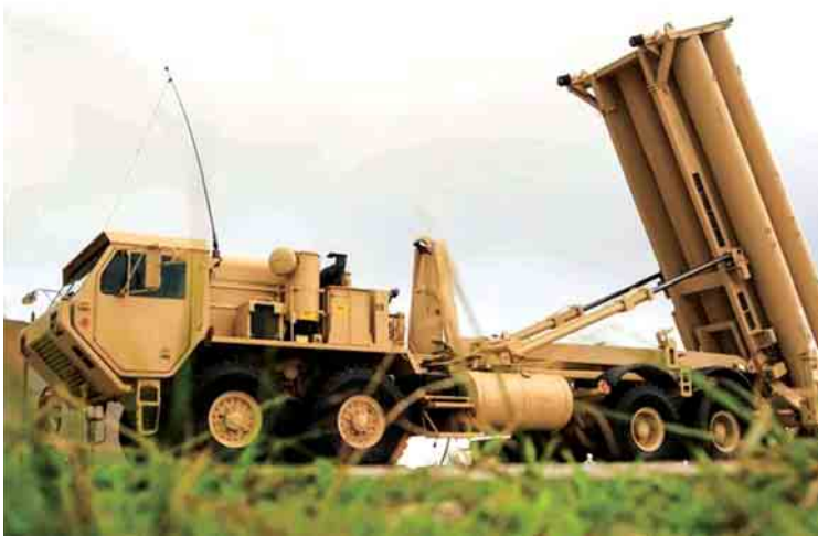
ဂူအမ်ကျွန်းရှိ အင်ဒါဆန် လေတပ်စခန်း၌ ဖြန့်ကြက်ထားသော THAAD ခုံးခွင်းခုံး စနစ်ကို တွေ့ရစဉ်။