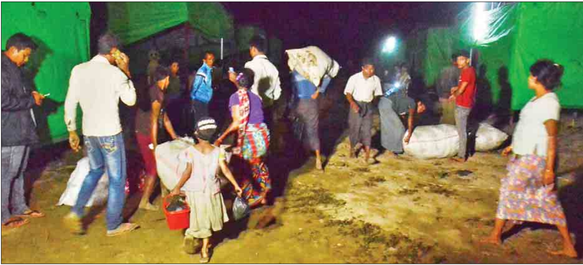
စစ်တွေမြို့ ဓညဝတီ အားကစားကွင်း ကယ်ဆယ်ရေးစခန်းမှ ဟိန္ဒူဘာသာဝင်များ မောင်တောခရိုင် အုပ်ချုပ်ရေးမှူး ရုံးဘေးရှိ ယာယီ တန်းလျားသို့ ဒီဇင်ဘာ ၃ ရက် ည ၉ နာရီက ရောက်ရှိလာစဉ်။

တင်ထွန်း(ပြန်/ဆက်)နှင့် သတင်းအဖွဲ့၊ ဓာတ်ပုံ- ဖိုးထောင်