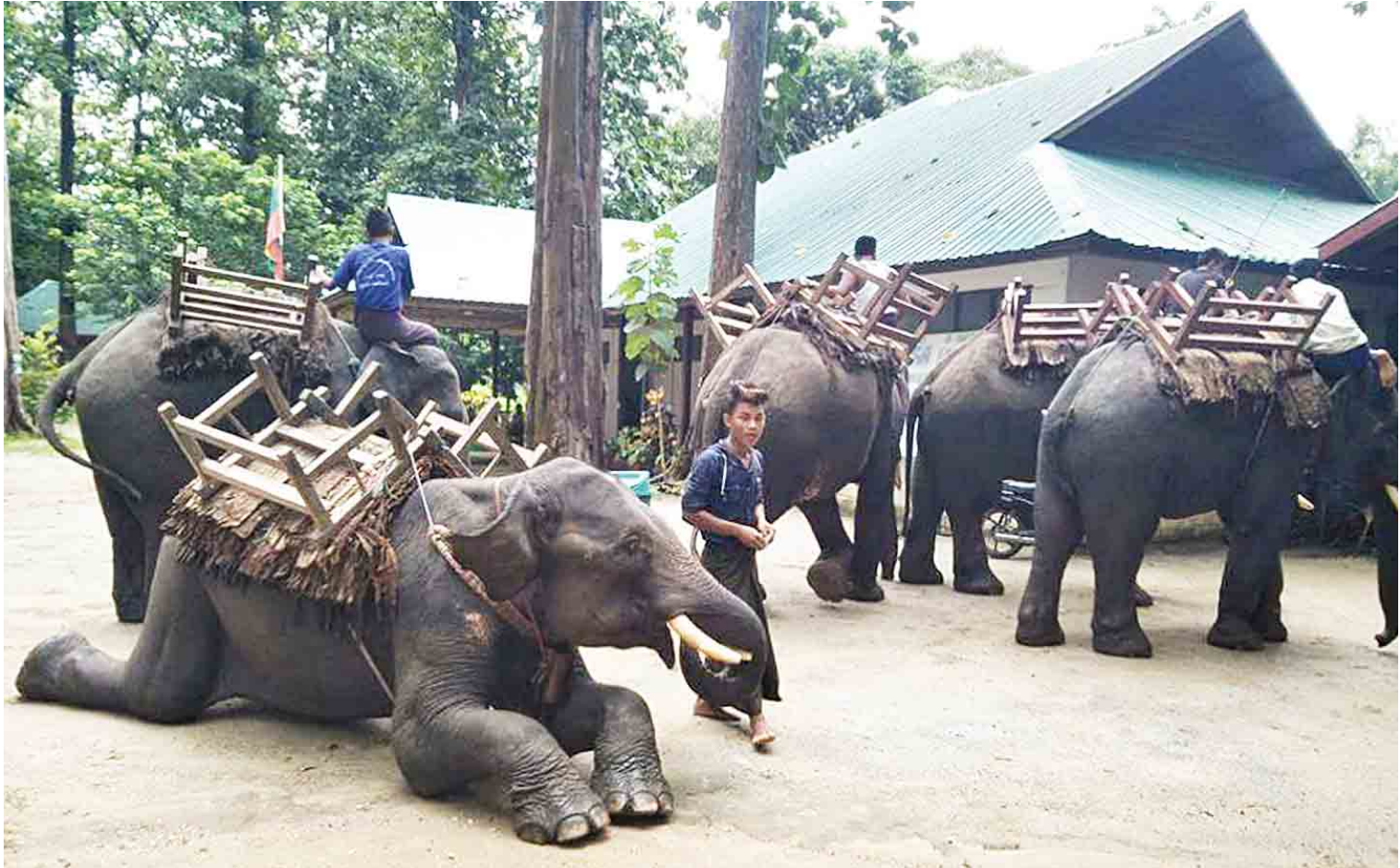
ပဲခူးတိုင်းဒေသကြီး သာဂရမြို့အနောက်ဘက် ၁၀ မိုင်ခန့်အကွာတွင် တည်ရှိသည့် ဖိုးကျားဆင်စခန်းကို တွေ့ရစဉ်။