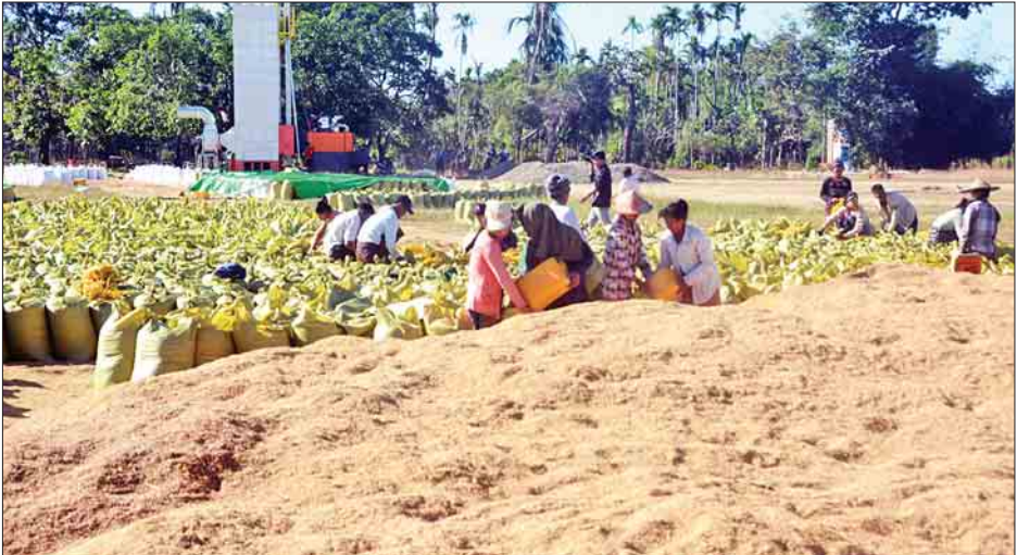
မောင်တောဒေသတွင် ရိတ်သိမ်းခြေလှေ့ပြီး မိုးစပါးများ အခြောက်ခံသိမ်းဆည်းနေမှုမြင်ကွင်း။

ဖြေ- မောင်တောဒေသလမ်းပိုင်းနဲ့ ပတ်သက်လို့ မိုးတွင်း ကာလမှာ ပျက်စီးခဲ့တဲ့လမ်းတွေကို သက်ဆိုင်ရာ လမ်းဦးစီး ဌာနက ပြည်ထောင်စုအဆင့်၊ ပြည်နယ်အစိုးရအဖွဲ့ သီးခြားဘတ်ဂျက်နဲ့ လမ်းပြုပြင်မှုအပိုင်းကို လတ်တလော အသုံးပြုလို့ရအောင် ပြုပြင်မှုအပိုင်းတွေ ဆောင်ရွက် နေသလို နိုင်ငံတော်အဆင့် တာဝန်ပေးထားတဲ့ ကုမ္ပဏီ