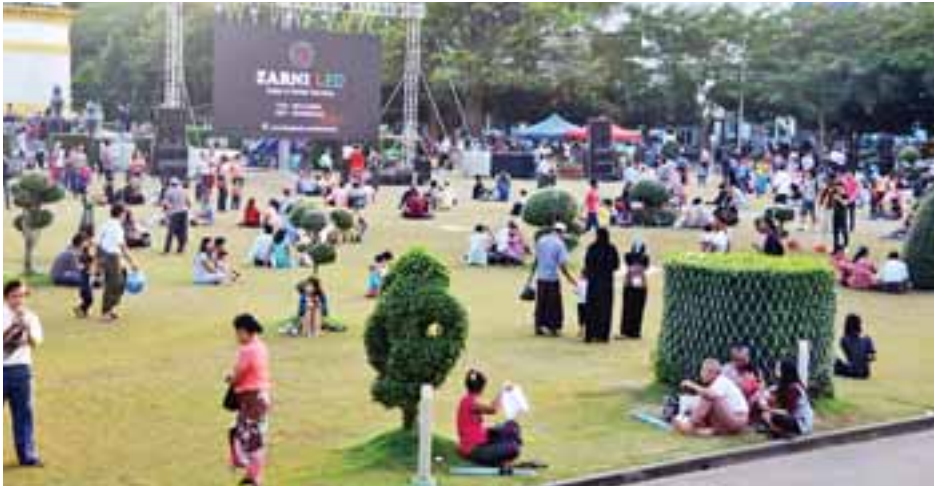
မဟာဗန္ဓုလပန်းခြံအတွင်း နိုင်ငံတကာရုပ်ရှင်ပွဲတော်ပြသမှုကို လာရောက်ကြည့်ရှုသူများအား တွေ့ရစဉ်။

နေပြည်တော် နိုဝင်ဘာ ၄ မြန်မာအထူးစီးပွားရေးဇုန်ဆိုင်ရာ ဗဟိုအဖွဲ့ဥက္ကဋ္ဌ ဒုတိယသမ္မတ ဦးဟင်နရီဗန်ထီးယူသည် ပြည်ထောင်စုဝန်ကြီး ဦးဝင်းခိုင်၊ ဒေါက်တာသန်းမြင့်၊ ရခိုင်ပြည်နယ်ဝန်ကြီးချုပ် ဦးညီပု၊ ဒုတိယဝန်ကြီး ဦးဆက်အောင်၊ ဒေါက်တာထွန်းနိုင်၊ ရခိုင်ပြည်နယ်ဝန်ကြီးများနှင့်အတူ ယနေ့နံနက်ပိုင်းတွင် ရခိုင်ပြည်နယ် ကျောက်ဖြူသို့ရောက်ရှိပြီး မဒဲကျွန်းဆိပ်ကမ်း၊ ကျောက်ဖြူအထူးစီးပွားရေးဇုန် တည်ဆောက်မည့်ပြေနေရာနှင့် သဘာဝဓာတ်ငွေ့စခန်း(OGT)အား ကြည့်ရှုစစ်ဆေးသည်။ စာမျက်နှာ ၇ ကော်လံ ၁ သို့ *