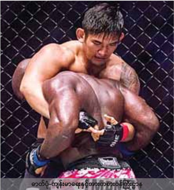
ဓာတ်ပုံ-ကျန်းမာရေးနှင့်အားကစားဝန်ကြီးဌာန