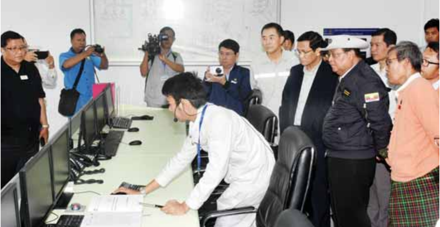
ဒုတိယသမ္မတ ဦးဟင်နရီဗန်ထီးယူ ကျောက်ဖြူမြို့နယ် မဒဲကျွန်းရေနံဆိပ်ကမ်းပေါ်ရှိ ထိန်းချုပ်ခန်းအား ကြည့်ရှုစစ်ဆေးစဉ်။