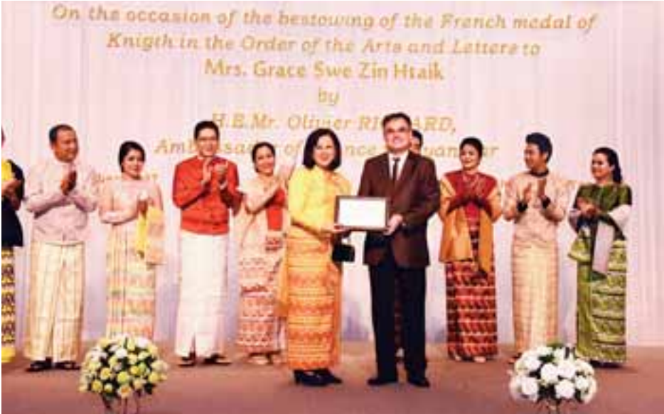
ကြောင်း အကြောင်းကြားခဲ့သည်။ မြန်မာ-ပြင်သစ် ပါဝင်နေသဖြင့် ဆုချီးမြှင့်ခြင်းဖြစ်ကြောင်း သိရသည်။ ယဉ်ကျေးမှုကဏ္ဍမြှင့်တင်ရာတွင် အဓိကအခန်းကဏ္ဍမှ သတင်းစဉ်

ယနေ့ကျင်းပသည့် ပြင်သစ်နိုင်ငံ ယဉ်ကျေးမှုနှင့် ဆက်သွယ်ရေးဝန်ကြီးဌာနက ပေးအပ်သည့် စာပေ အနုပညာသူရဲကောင်းဆုတံဆိပ် ချီးမြှင့်ခြင်းအခမ်းအနားသို့ ပြန်ကြားရေးဝန်ကြီးဌာန ပြည်ထောင်စုဝန်ကြီးနှင့်ဇနီး၊ မြန်မာနိုင်ငံဆိုင်ရာ ပြင်သစ်နိုင်ငံ သံအမတ်ကြီး၊ ပြင်သစ် သံရုံးမှ တာဝန်ရှိသူများ၊ ပြန်ကြားရေးဝန်ကြီးဌာနမှ တာဝန်ရှိသူများ၊ အနုပညာရှင်များ၊ စာပေပညာရှင်များနှင့် ဖိတ်ကြားထားသူများ တက်ရောက်ကြသည်။ စာပေနှင့် အနုပညာသူရဲကောင်းတံဆိပ်သည် ပြင်သစ်နိုင်ငံ နွေဦးရာသီဆုချီးမြှင့်သည့် အစီအစဉ်၏ အစိတ်အပိုင်းတစ်ရပ်ဖြစ်ပြီး ပြင်သစ်သမ္မတနိုင်ငံ ဝန်ကြီးဌာနများကပေးအပ်ချီးမြှင့်သော အဓိကဆုကြီးလေးခုထဲတွင် တစ်ခုအပါအဝင်ဖြစ်သည်။ ပြင်သစ်အမည်ဖြင့် "Chevalier de L' ordre des Arts et des Letters" ဆုဟု ခေါ်ဆိုကြောင်း သိရသည်။ ယခုနှစ်အတွက် ချီးမြှင့်သည့်ဆုကို ပြင်သစ်သမ္မတနိုင်ငံ ယဉ်ကျေးမှုနှင့် ဆက်သွယ်ရေးဝန်ကြီးဌာနက ၂၀၁၇ ခုနှစ် ဧပြီ ၂၁ ရက်စွဲဖြင့် ဒေါ်ဆွေဇင်ထိုက်အား ဆုချီးမြှင့်