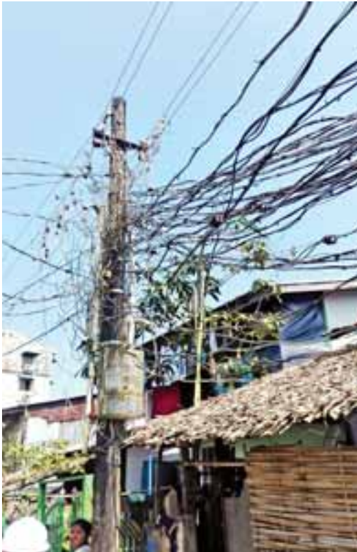
ဌေးကြိုင်

ရန်ကုန် နိုဝင်ဘာ ၄ ရန်ကုန်မြောက်ပိုင်းခရိုင် အင်းစိန်မြို့နယ်အတွင်းရှိ လျှပ်စစ်မီးကြိုးများ ရှုပ်ထွေးခြင်း၊ ဗိုအားနည်းခြင်းကို နိုဝင်ဘာ ၄ ရက် နံနက် ၉ နာရီခွဲက ကြိုးကြီးများဖြင့် လဲလှယ်တပ်ဆင်ခဲ့ကြသည်။ ထိုသို့ ဆောင်ရွက်ခဲ့သည့် ရပ်ကွက်များမှာ ကမ်းနားအလယ်ရပ်ကွက် ခေမာတောင် ၂ လမ်းတွင် ၄၀၀ ဗို့ ရှုပ်ထွေးလျှပ်စစ် မီးကြိုး ၁၀၀၊ ကမ်းနားအနောက်ရပ်ကွက် နီလာလမ်းတွင် ၄၀၀ ဗို့ ရှုပ်ထွေးလျှပ်စစ် မီးကြိုး လေးခန်းတို့ကို မြို့နယ်လျှပ်စစ်မှ လုပ်သား ၁၀ ဦးနှင့် ခန့်ရာဇာကမ္ဘဏီမှ ခုနစ်ဦးတို့ ပူးပေါင်းပြီး ဆောင်ရွက်ခဲ့သည်။ ကျန်ရှိနေသေးသည့် ရှုပ်ထွေးလျှပ်စစ် မီးကြိုးများကိုလည်း ဆက်လက်ဆောင်ရွက်သွားမည်ဖြစ်ကြောင်း သိရသည်။