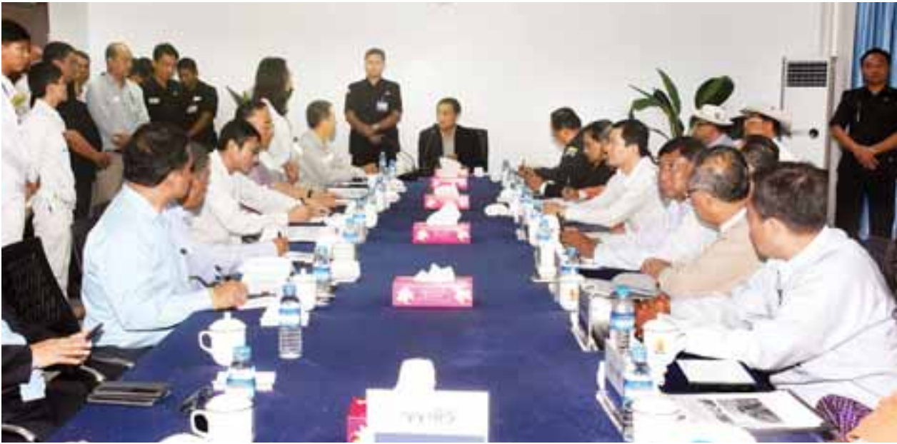
ဒုတိယသမ္မတ ဦးဟင်နရီဗန်ထီးယူ ကျောက်ဖြူမြို့ မဒဲကျွန်းရေနံဆိပ်ကမ်းရှိ တာဝန်ရှိသူများနှင့် တွေ့ဆုံဆွေးနွေးစဉ်။

ရခိုင်ပြည်နယ် ဖွံ့ဖြိုးတိုးတက်ရေးအတွက် အထူးအရေးပါသဖြင့် ကျောက်ဖြူဒေသအား အထူးစီးပွားရေးဇုန်အဖြစ် သတ်မှတ်အကောင်အထည်ဖော်ဆောင်ရွက်ရန် နိုင်ငံတော်က ၂၀၁၁ ခုနှစ်တွင် ခွင့်ပြုခဲ့သည်။ ကျောက်ဖြူအထူးစီးပွားရေးဇုန်တွင် စီမံကိန်းများအနေဖြင့် ရေနက်ဆိပ်ကမ်းစီမံကိန်း၊ စက်မှုဇုန်စီမံကိန်းနှင့် အဆင့်မြင့်အိမ်ရာစီမံကိန်းများ ပါဝင်သည်။