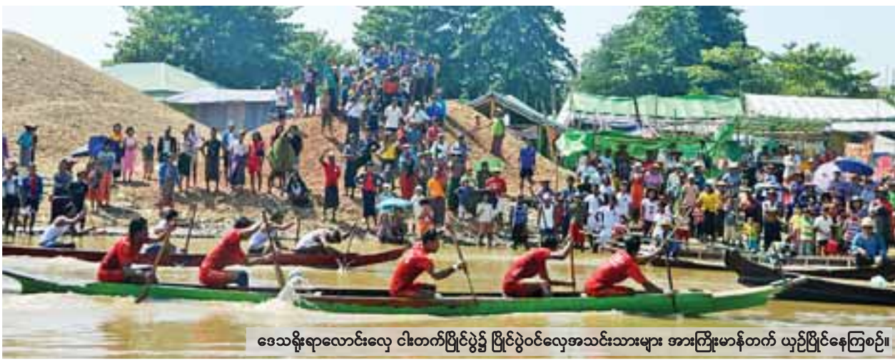
ဒေသရိုးရာလောင်းလှေ ငါးတက်ပြိုင်ပွဲ၌ ပြိုင်ပွဲဝင်လှေအသင်းသားများ အားကြီးမာန်တက် ယှဉ်ပြိုင်နေကြစဉ်။