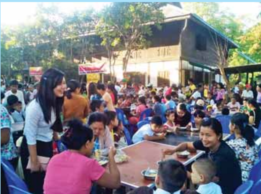
တောင်တွင်းကြီးမြို့၊ သီရိမင်္ဂလာတိုက်သစ် ဓမ္မစကူးလ်ကျောင်းတိုက်တွင် မြန်မာမုန့် နိဗ္ဗာန်ဈေးပွဲတော် ကျင်းပစဉ်။