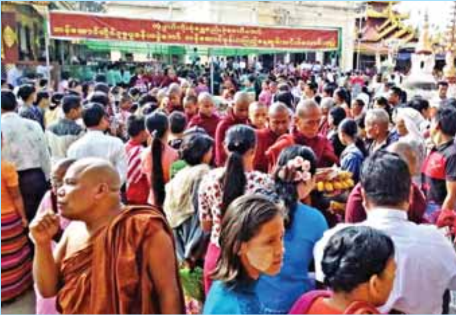
ညောင်ဦးမြို့၊ ရှေးဟောင်းသမိုင်းဝင် ရွှေစည်းခုံဘုရားပွဲတော်တွင် သံဃာတော်အပါး ၂၀၀၀ ကျော်တို့အား ဆွမ်းသဝိတ်လုံးနှင့် လှူဖွယ်ဝတ္ထုပစ္စည်းများ လောင်းလှူကြစဉ်။