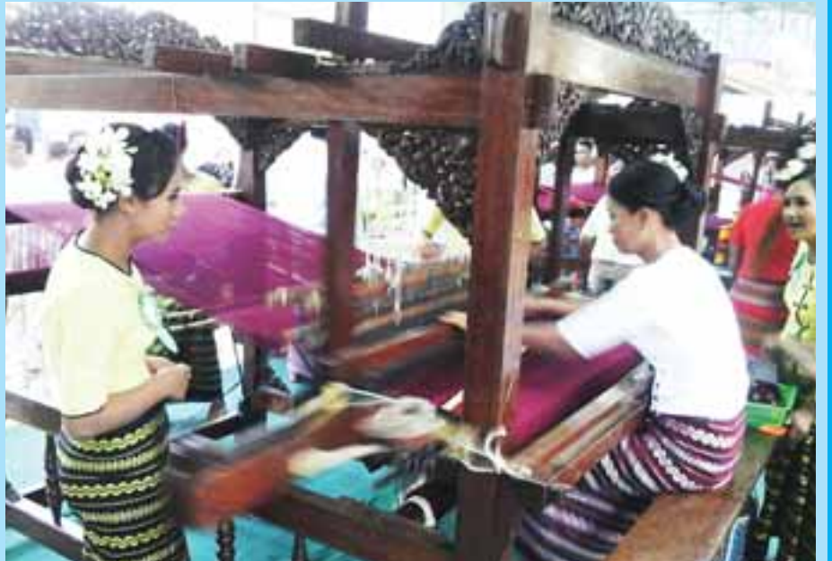
မုံရွာမြို့၊ ရွှေစည်းခုံဘုရား ရင်ပြင်တော်တွင် ၁၈ ကြိမ်မြောက် မသိုးသင်္ကန်း ရက်လုပ်ပူဇော်ပွဲ ကျင်းပစဉ်။