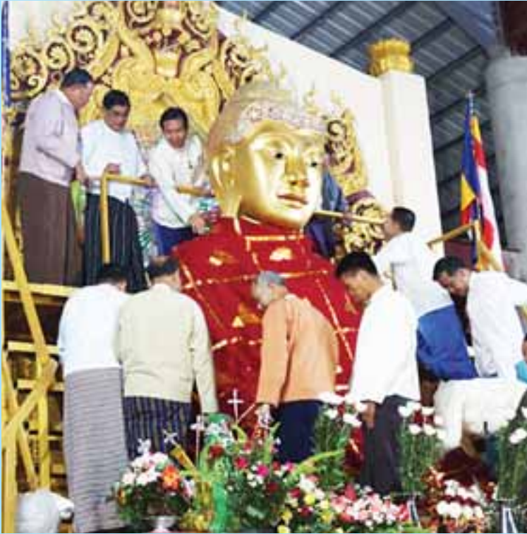
လွိုင်ကော်မြို့၊ မိုးကောင်းမဟာမြတ်မုနိရုပ်ပွားတော်မြတ်တွင် ခုတိယအကြိမ် မသိုးသင်္ကန်း ရက်လုပ်ပူဇော်ပွဲနှင့် ဆက်ကပ်လှူဒါန်းပွဲ ကျင်းပစဉ်။