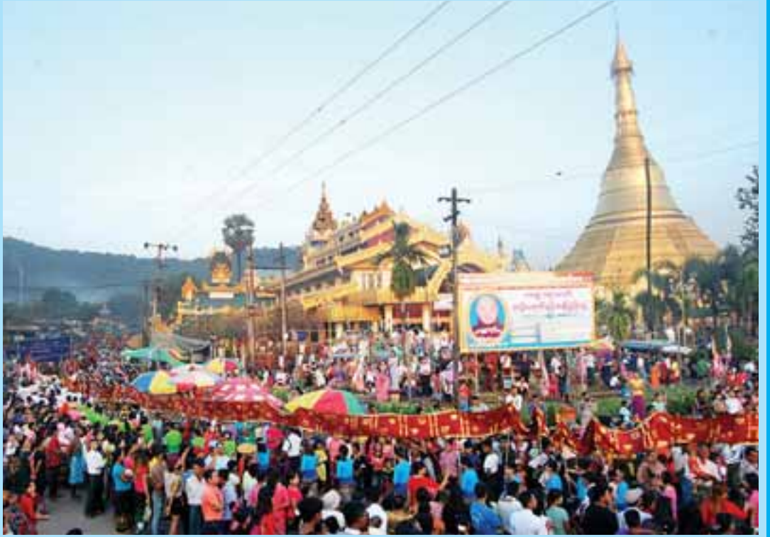
သထုံမြို့၏ ကျက်သရေဆောင် လေးဆူဓာတ်စံ ရွှေစာရံ စေတီတော်မြတ်ကြီးတွင် ရွှေကြာသင်္ကန်းတော် ဆက်ကပ်လှူဒါန်းပွဲကို တန်ဆောင်မုန်းလပြည့်နေ့က မြို့လုံးကျွတ် ခြိမ်းခြံသံဆင်နွှဲကြစဉ်။