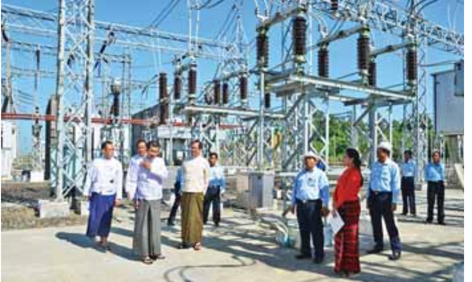
ရေးလုပ်ငန်းပြီးစီးအောင် ဆောင်ရွက်လျက်ရှိပြီး စီမံကိန်း ဘီလီယံခန့် ကုန်ကျမည်ဖြစ်ကြောင်း သိရသည်။ တစ်ခုလုံးအတွက် ကုန်ကျစရိတ် စုစုပေါင်းကျပ် ၃၀ သတင်းစဉ်

ရခိုင်ပြည်နယ်မြောက်ပိုင်းရှိ ဖွံ့ဖြိုးမှုနည်းပါးသော ရသေ့တောင်၊ ဘူးသီးတောင်၊ မောင်တောဒေသများသို့ ၂၄ နာရီ စက်အားဖြန့်ဖြူးပေးနိုင်ရန်အတွက် နိုင်ငံတော် စက်အားစနစ်ချောင့်ချိန်ပြုပြင်သော ၂၃၀ ကေဗီပုဏ္ဏား ကျွန်းစက်အားခွဲရုံမှတစ်ဆင့် ပုဏ္ဏားကျွန်း-ရသေ့တောင်- ဘူးသီးတောင်-မောင်တော ၆၆ ကေဗီ စက်အားလိုင်း ၆၅ ဒဿမ ၁ မိုင်နှင့် ရသေ့တောင်၊ ဘူးသီးတောင်၊ မောင်တောမြို့များတွင် ၆၆/၁၁ ကေဗီ၊ ၁၀ အမ်ပီအေ စက်အားခွဲရုံများ တည်ဆောက်ကာ စက်အားဖြန့်ဖြူး ပေးနိုင်ရေးဆောင်ရွက်လျက်ရှိရာ ယင်းစီမံကိန်းလုပ်ငန်း များကို စက်တင်ဘာလမှစတင်၍ တည်ဆောက်ရေး လုပ်ငန်းများ ဆောင်ရွက်နေပြီဖြစ်ပြီး ၂၀၁၈ ခုနှစ် မတ်လ တွင် ရသေ့တောင်မြို့နယ်အားလည်းကောင်း၊ ၂၀၁၈ ခုနှစ် ဇွန်လတွင် ဘူးသီးတောင်မြို့နယ်အား လည်းကောင်း၊ ၂၀၁၈ ခုနှစ် ဒီဇင်ဘာလတွင် မောင်တောမြို့နယ်အား လည်းကောင်း စက်အားဖြန့်ဖြူးနိုင်ရေးအတွက် စက်အားလိုင်းများနှင့် စက်အားခွဲရုံများ တည်ဆောက်