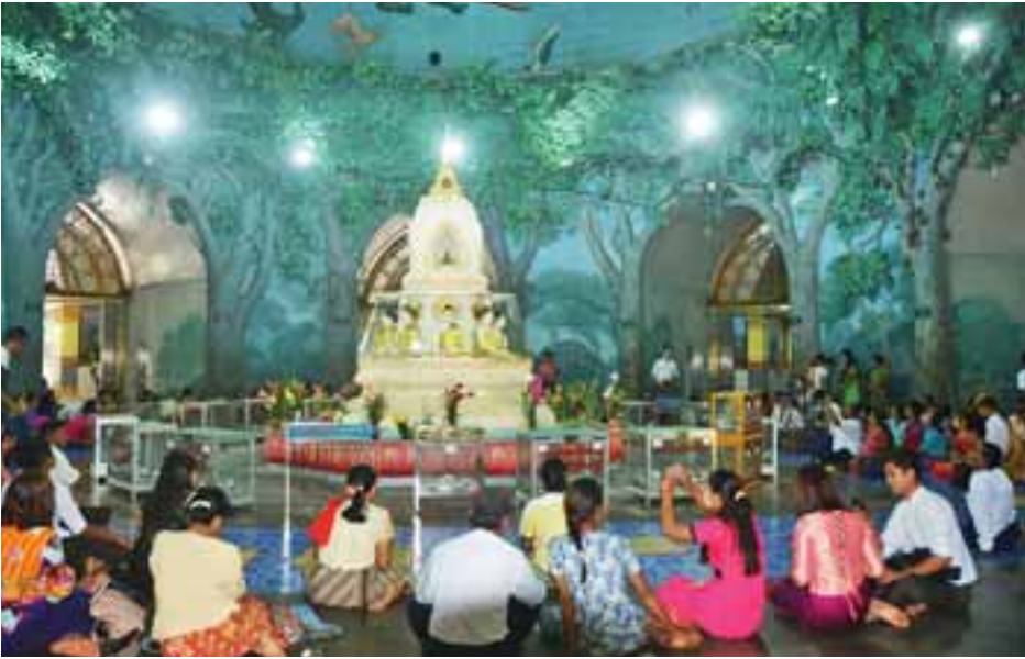
တန်ဆောင်မုန်းလပြည့်နေ့က မဟာဝိဇယစေတီတော်တွင် ဘုရားဖူးများ ကောင်းမှုကုသိုလ်ပြုလုပ်နေကြသည်ကို တွေ့ရစဉ်။ ဓာတ်ပုံ-ခင်မောင်ဝင်း (ကြေးမုံ)

ထို့နောက် ရွှေတိဂုံစေတီတော်ကြီးအား ဆွမ်း၊ ဆီမီး၊ ပန်း၊ ရေချမ်းနှင့် သစ်သီးဆွမ်းများကပ်လှူပြီး စေတီတော် ဩဝါဒါစရိယ ဆရာတော်များ