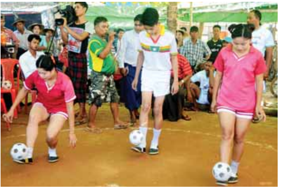
မဒေါက်မြို့ (၄၅)ကြိမ်မြောက် တန်ဆောင်တိုင်မီးမျှောပွဲတော်ကြီး၏ မြန်မာ့ရိုးရာခြင်းလုံးအလှူခတ်ပွဲတွင် ခြင်းခတ်စွမ်းရည် ပြသနေစဉ်။