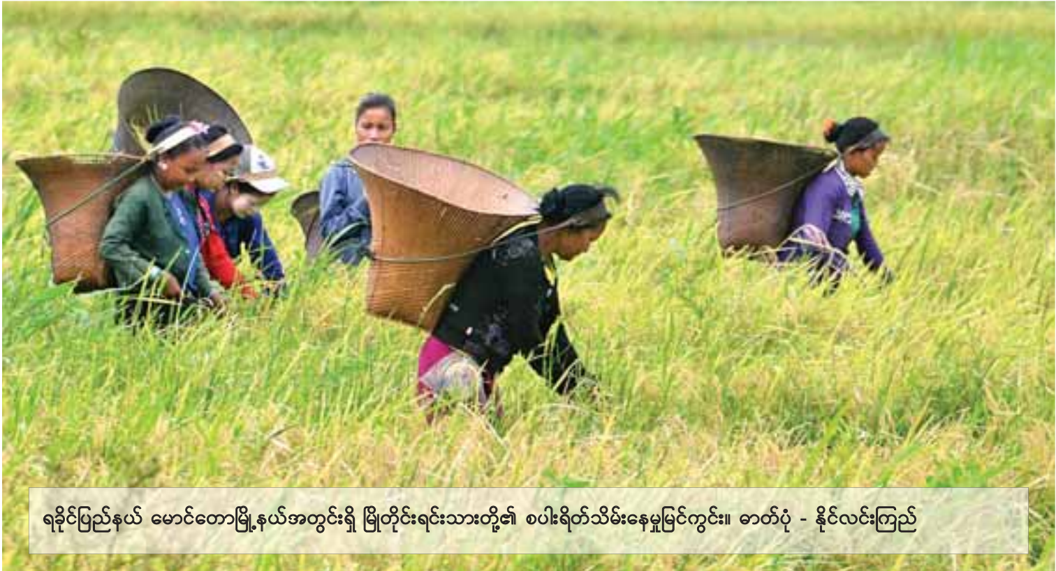
ရခိုင်ပြည်နယ် မောင်တောမြို့နယ်အတွင်းရှိ မြို့တိုင်းရင်းသားတို့၏ စပါးရိတ်သိမ်းနေမှုမြင်ကွင်း။