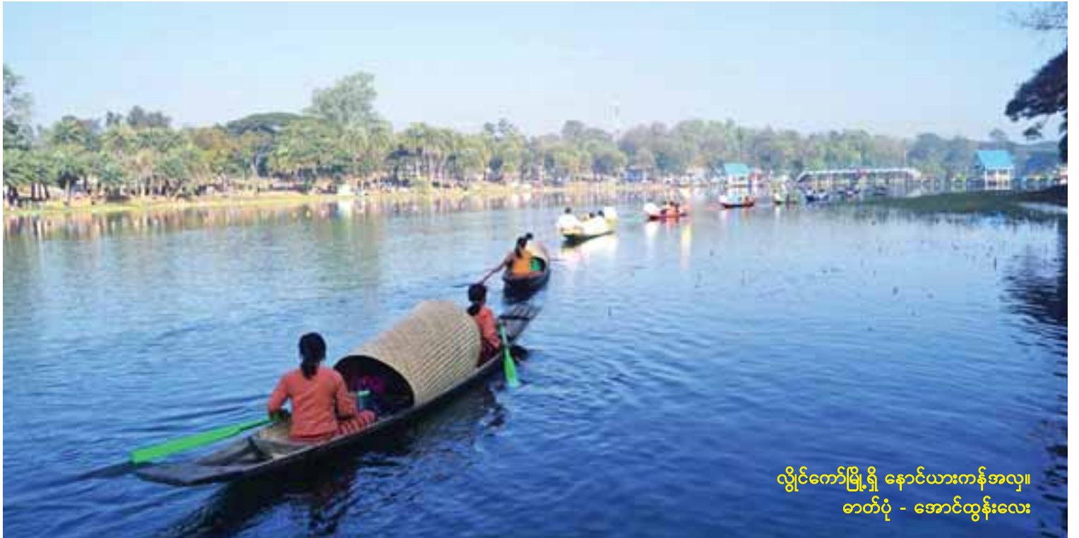
လွိုင်ကော်မြို့ရှိ နောင်ယားကန်အလှ။