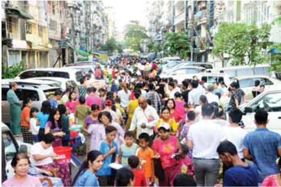
ပုဗ္ဗမအကြိမ်မြောက် ပုဇွန်တောင်မြို့နယ် အမှတ်(၁)ရပ်ကွက် (၅၁)လမ်း (အလယ်)မိသားစု တန်ဆောင်မုန်းလပြည့်နေ့ နိဗ္ဗာန်ဈေးအလှူတော်ကို တွေ့ရ စဉ်။

ဖဲကြိုးဖြတ်ဖွင့်လှစ်ပေးကြပြီး ပွဲတော်အထိမ်းအမှတ် မုခ်ဦးဆင်းဘုတ်ကို တိုင်းဒေသကြီး လွှတ်တော်ကိုယ်စားလှယ် ဦးညီညီထွေးက စက်ခလုတ်နှိပ်ဖွင့်လှစ်ပေးသည်။