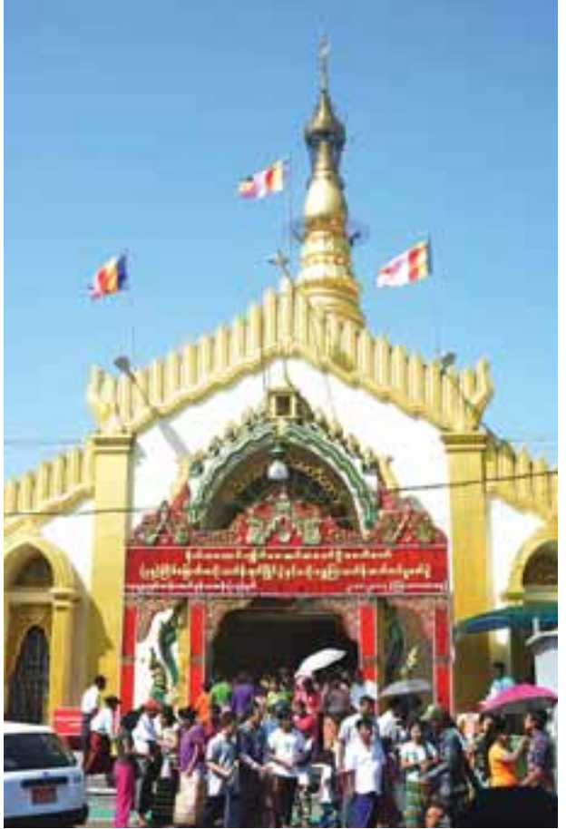
တန်ဆောင်မုန်းလပြည့်နေ့တွင် ရန်ကုန်မြို့၊ ဗိုလ်တထောင် ကျိုက်ဒေးအပ် ဆံတော်ဦးစေတီတော်၌ ဘုရားဖူးလာပြည်သူများဖြင့် စည်ကားနေသည်ကို တွေ့ရစဉ်။

ယင်းနောက် မသိုးရွှေကြာသင်္ကန်းရက်ခတ်ကပ်လှူပူဇော်ခြင်း အောင်ပွဲအခမ်းအနားကိုကျင်းပရာ နိုင်ငံတော်သံဃမဟာနာယကအဖွဲ့ ခုတိယဥက္ကဋ္ဌ ဆရာတော်ထံမှ ကိုးပါးသီလ ခံယူဆောက်တည်ကြပြီး ဆရာတော်သံဃာတော်များအား လှူဖွယ်ဝတ္ထုပစ္စည်းများ ဆက်ကပ်လှူဒါန်းကာ လှူဒါန်းမှုအစုစုတို့အတွက် ရေစက်သွန်းချ အမျှပေးဝေကြသည်။ ဆက်လက်၍ အာရုံခံတန်ဆောင်း အပေါ်ထပ်၌ သာမညဖလ အခါတော်