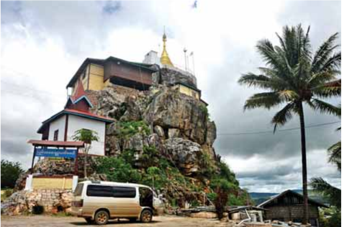
မြကလပ်တောင်တော်ကို တွေ့မြင်ရစဉ်။