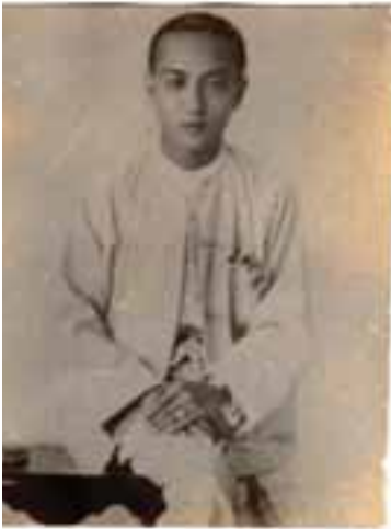
ရွှေယားရွှေပြည်အေး ဇာသစ် (၂၂)နှစ်အရွယ် ၁၉၃၁-ခုနှစ်

လုံးကြိုက်တာပဲ။ နောက်ဆုံးတော့ ကိုဘရီနောက်လိုက်ပဲ ဖြစ်ခဲ့ရတာပေါ့ကွာ” ဟူ၍ ပြန်လည်ပြောပြခဲ့ပါသည်။