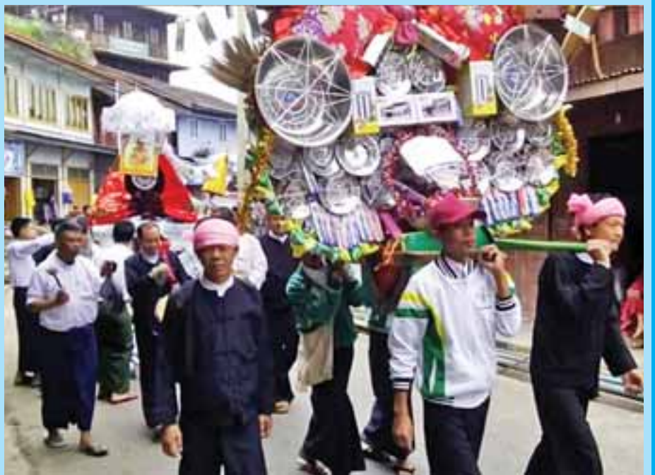
ရှမ်းပြည်နယ်(မြောက်ပိုင်း) ပလောင်ကိုယ်ပိုင်အုပ်ချုပ်ခွင့်ရဒေသ နမ့်ဆန်မြို့နယ်တွင် ၆၉ ကြိမ်မြောက် မဟာဘုံကထိန်ပွဲ လှည့်လည်ကြစဉ်။