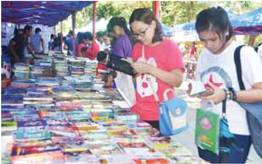
ဗဟုသုတရှာမယ် စာအုပ်ဝယ်။