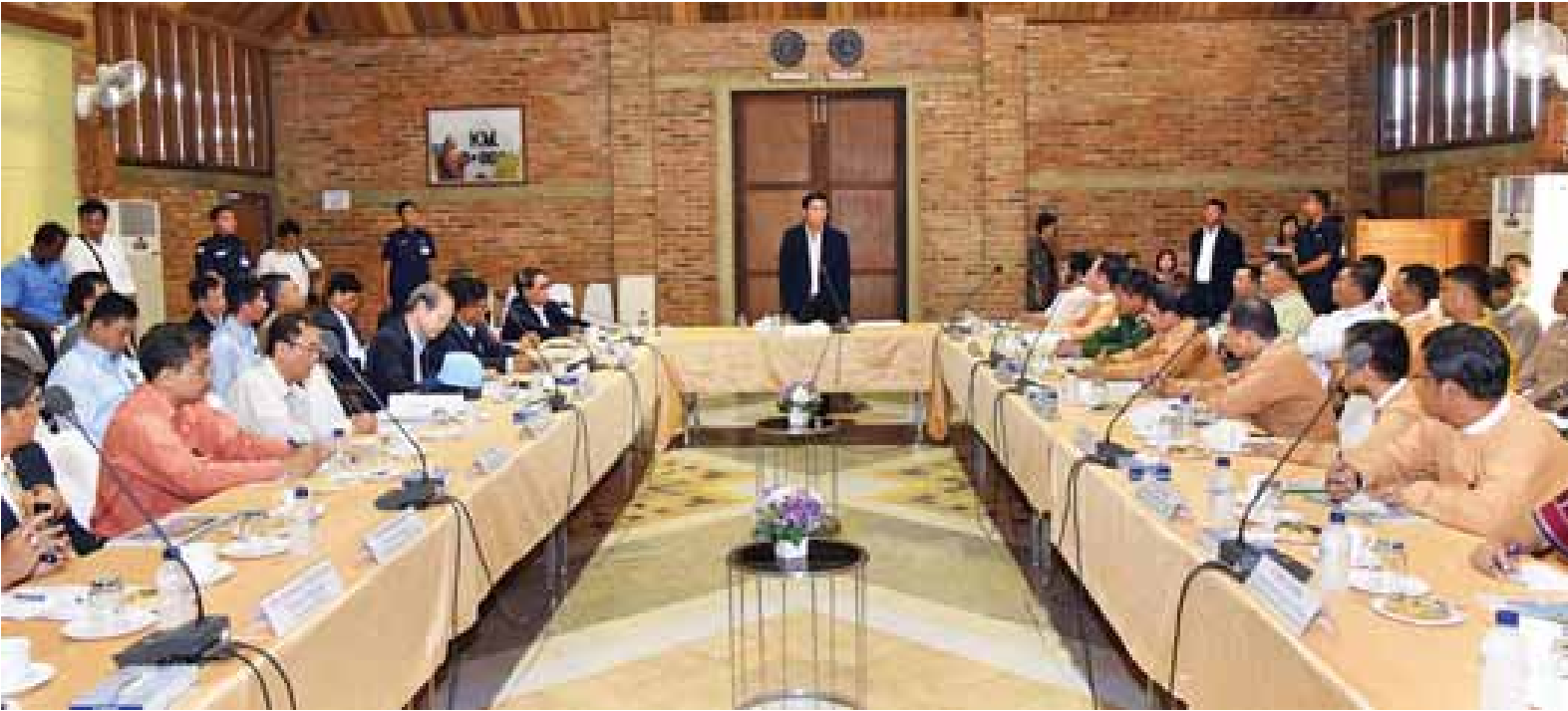
ဒုတိယသမ္မတ ဦးဟင်နရီဗန်ထီးယူ ထားဝယ် အထူးစီးပွားရေးဇုန် စီမံခန့်ခွဲမှုကော်မတီ အစည်းအဝေးတွင် အမှာစကားပြောကြားစဉ်။

ဒုတိယသမ္မတနှင့် အဖွဲ့သည် တနင်္သာရီတိုင်းဒေသကြီး ဝန်ကြီးချုပ် ဒေါက်တာဒေါ်လှဲလှဲမော် နှင့်အတူ ထားဝယ်အထူးစီးပွားရေးဇုန်စီမံကိန်း သို့ နံနက် ၁၁ နာရီတွင် ရောက်ရှိကြပြီး စီမံကိန်းလုပ်ငန်းများ အကောင်အထည်ဖော်မှု အခြေအနေကို စစ်ဆေးရာ ထားဝယ်အထူးစီးပွားရေး ဇုန်စီမံခန့်ခွဲမှုကော်မတီ ဒုတိယဥက္ကဋ္ဌ တိုင်းဒေသကြီး စီမံကိန်းနှင့်ဘဏ္ဍာရေး ဝန်ကြီး ဦးမြိုးဝင်းထွန်းနှင့် ကော်မတီ အတွင်းရေးမှူး ဒေါက်တာတင့်ထူးနိုင် တို့က ထားဝယ် အထူးစီးပွားရေးဇုန် စီမံကိန်းဆိုင်ရာ အချက်အလက်များ၊ စီမံကိန်းလုပ်ငန်းများ ဆောင်ရွက်သွား မည့်ပုံစံ၊ ကနဦး စီမံကိန်းများအတွက် လက်မှတ်ရေးထိုးခဲ့သည့် သဘောတူ စာချုပ်များ၊ ထားဝယ်အထူးစီးပွားရေး ဇုန်မှ မြန်မာ-ထိုင်း နယ်စပ်(ဖုန်းခရိုင်) သို့ ဆက်သွယ်သည့် နှစ်လမ်းသွား ကတ္တရာလမ်း အဆင့်မြှင့်တင်ခြင်း စာမျက်နှာ ၃ ကော်လံ ၁ သို့ *