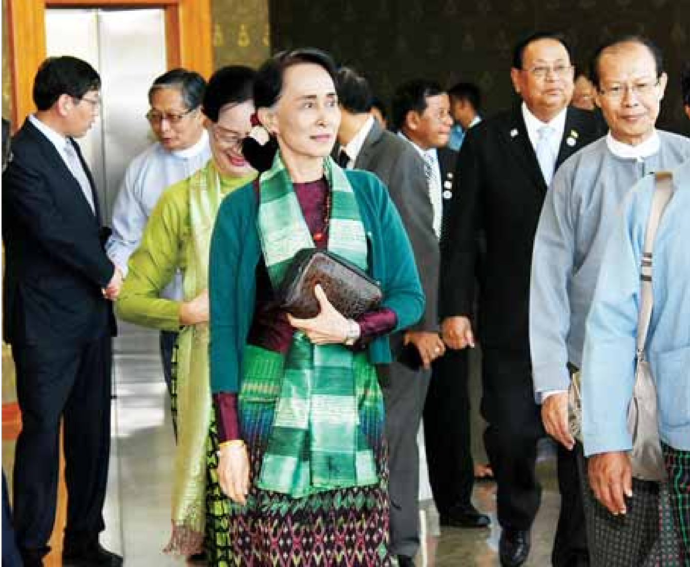
နိုင်ငံတော်၏အတိုင်ပင်ခံပုဂ္ဂိုလ် ဒေါ်အောင်ဆန်းစုကြည်အား နေပြည်တော်အပြည်ပြည်ဆိုင်ရာလေဆိပ်၌ ကြိုဆိုနှုတ်ဆက်သူများနှင့်အတူ တွေ့ရစဉ်။

ဂုဏ်တော်ထူးနှင့်ပြည့်စုံတော်မူ မြတ်စွာဘုရားသည် စိုးရိမ်ကြောင့်ကြမှု မရှိဘဲ အလွန် ချမ်းသာစွာ အသက်မွေးနိုင်ကုန်၏။ ဆွမ်းအာဟာရ မရ သော်လည်း အာဘဿရဘုံရှိ ပြဟ္မာကြီးများကဲ့သို့ ပီတိ ဟူသော အစာကို စားသုံး၍ နေနိုင်ကုန်၏။ (ထိုသို့ ဂုဏ်တော်ထူးနှင့် ပြည့်စုံတော်မူပေသော မြတ်စွာဘုရား အား ရည်မှန်း၍ ပူဇော်ကန်တော့ရာ၏) ၁၃၁၀ဂ်(ဓမ္မပဒ-၂၀၀)