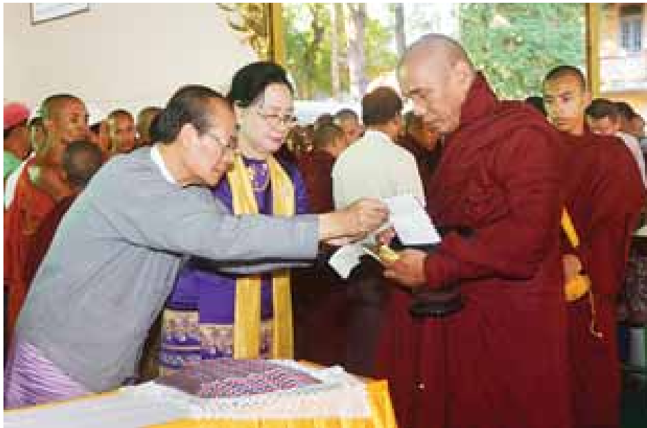
နေပြည်တော်ကောင်စီဥက္ကဋ္ဌ ဒေါက်တာမျိုးအောင်နှင့်ဇနီး၊ ဆရာတော်များအား လှူဖွယ်ဝတ္ထုပစ္စည်းများ ဆက်ကပ်လှူဒါန်းကြစဉ်။