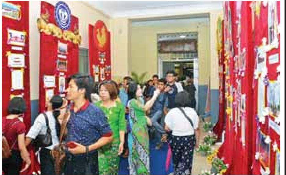
ဗဟုသုတစုံစွာ ပြခန်းမှာ။