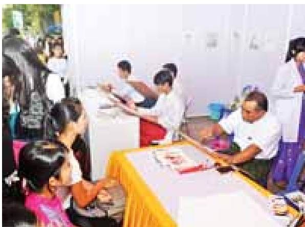
ပုံကစားကြမယ်။