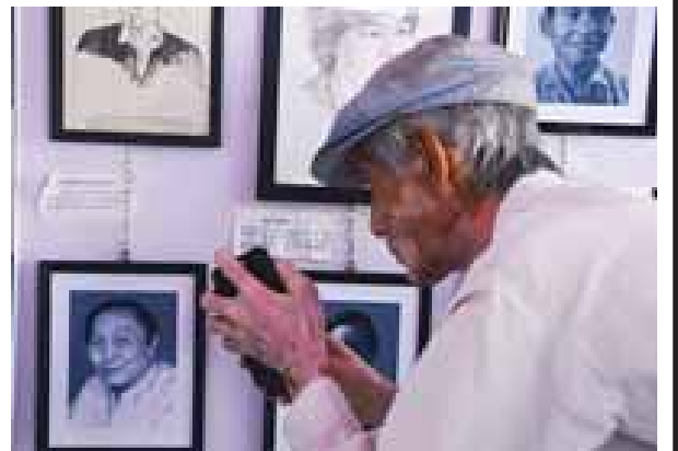
စာရေးဆရာကြီးများ၏ ဓာတ်ပုံများပြခန်း။