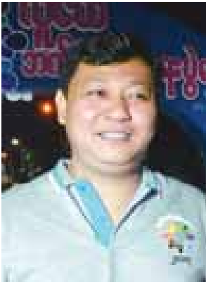
အမြဲတမ်းအတွင်းဝန် ဦးမျိုးမြင့်မောင်

ဒီပွဲတော်ဟာ ဝန်ကြီးဌာန ငါးခုနဲ့ ရန်ကုန်တိုင်းဒေသကြီး အစိုးရအဖွဲ့၊ ပူးပေါင်းပြီး လုပ်တဲ့ပွဲပါ။ နိုင်ငံတကာ