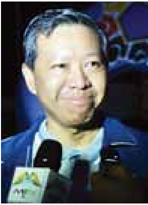
ပြည်ထောင်စုဝန်ကြီး ဒေါက်တာမျိုးသိမ်းကြီး

ဒီနေ့က ဒီဇင်ဘာလ ၂ ရက်နေ့ဖြစ် တော့ ပုံမှန်လူထုလမ်းလျှောက်ပွဲနေ့ လည်းဖြစ်ပါတယ်။ လူငယ်ဘက်စုံဖွံ့ဖြိုး ရေးပွဲတော် အထိမ်းအမှတ် လမ်းလျှောက်ပွဲလည်း ဖြစ်တဲ့အတွက် ကြောင့်မို့ သမိုင်းဝင်တဲ့နေ့တစ်နေ့ဖြစ် ပါတယ်။ ပြီးရင် လူငယ်ဘက်စုံဖွံ့ဖြိုး ရေးပွဲတော်ကို ရန်ကုန်တက္ကသိုလ်မှာ ကျင်းပခွင့်ရရှိခြင်းဟာ ရန်ကုန် တက္ကသိုလ်ရဲ့ ၉၇ နှစ်မြောက် အထိမ်း