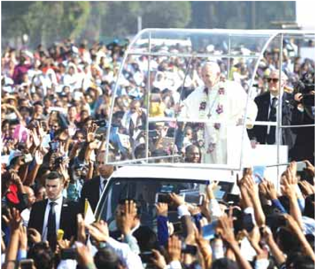
ဒီဇင်ဘာ ၁ ရက်က ဘင်္ဂလားဒေ့ရှ်နိုင်ငံ ရူရာဝါဒီ အူဒီယန်ကွင်း၌ ပြုလုပ်သော ပူဇော်ဆုတောင်းခြင်း အခမ်းအနားတွင် ရဟန်းမင်းကြီးအား ပရိသတ်က ဖူးမြော်နေကြသည်ကိုတွေ့ရစဉ်။

Ref: Pope Francis celebrates Mass in Dhaka, Bangladesh (Vatican Radio)