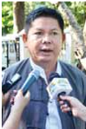
ဒေါက်တာထွန်းကို

ကျွန်တော်တို့ ဌာနကတော့ အဓိကအားဖြင့် ဘူမိ