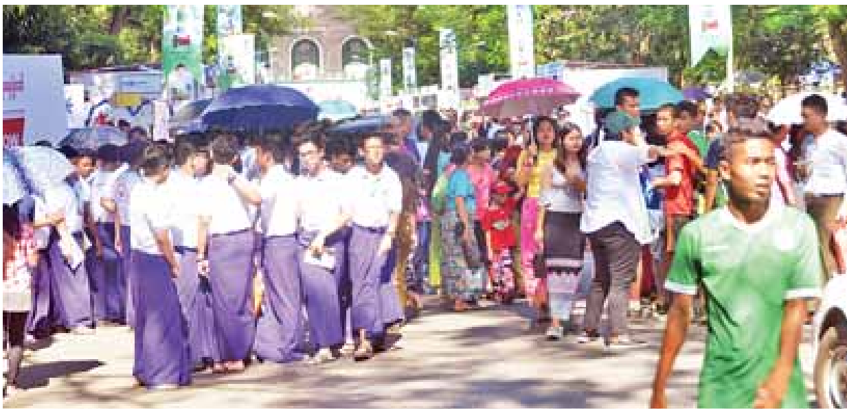
အိမ်ပတ်လမ်းမှာ စည်ကားစွာ။