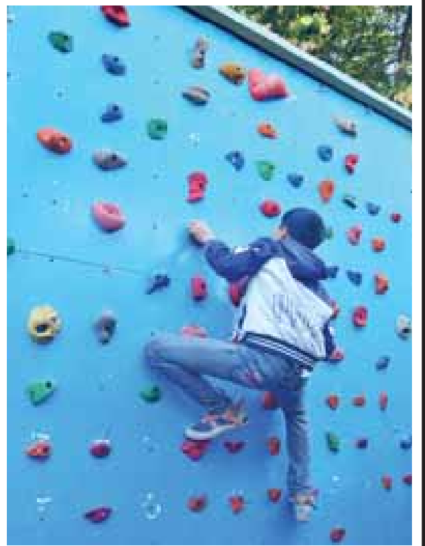
တောင်တက်လေ့ကျင့်မယ်။