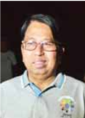
ပြည်ထောင်စုဝန်ကြီး ဒေါက်တာဖေမြင့်

တစ်ပတ်ပတ်ပြီး လမ်းလျှောက်ကြမှာ ပါ။ စုပေါင်းလမ်းလျှောက်ကြတဲ့ အားကစားလှုပ်ရှားမှုတစ်ရပ်အနေနဲ့ ဆောင်ရွက်တာပါ။ လူငယ်တွေအနေ နဲ့လည်း ဒီလိုလမ်းလျှောက်ပွဲမှာ ပါဝင် လာတဲ့အတွက် စုပေါင်းပါဝင်ချင် ဆောင်ရွက်ချင်တဲ့ စိတ်ဓာတ်တွေရ မယ်။ လမ်းလျှောက်ခြင်းဟာလည်း ကျန်းမာရေးအတွက် ကောင်းမွန်တဲ့ အလေ့အကျင့်တစ်ရပ်ကို တည်ဆောက် တာပဲ။ ကျန်းမာခြင်းဟာ လာဘ်တစ်ပါး ဖြစ်ပါတယ်။ လူငယ်တွေအတွက် ဗလ ငါးတန်ဖွံ့ဖြိုးဖို့ဆိုရင် ကာယဗလသည် လည်း ခွန်အားတွေထဲမှာ အရေးကြီး တဲ့အချက်တစ်ခုဖြစ်ပါတယ်။ မကျန်း မာ၊ မသန်စွမ်းရင် ဘယ်အလုပ်ကိုမဆို ထိထိရောက်ရောက် မဆောင်ရွက်နိုင် ဘူးပေါ့။ ဒီလိုပွဲတော်တွေကိုလည်း နှစ်စဉ်ကျင်းပဖို့ ရည်ရွယ်ချက်ရှိပါ တယ်။ ကျင်းပတဲ့အခါမှာလည်း အများပါဝင်တဲ့ ဒီလိုအစီအစဉ်မျိုးတွေ ပါပါလိမ့်မယ်။ အဲဒီအခါကျရင်လည်း ဒီလို လမ်းလျှောက်ပွဲဟာလည်း ပါဝင် လာမှာပါ။