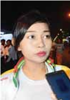
ဒေါ်အိအိမော်

ရည်ရွယ်ချက်က အဓိကဘာလဲဆို တော့ တိုင်းပြည်ရဲ့ အင်အားစုဟာ လူငယ်တွေဖြစ်တယ်။ ဒီလူငယ်တွေ