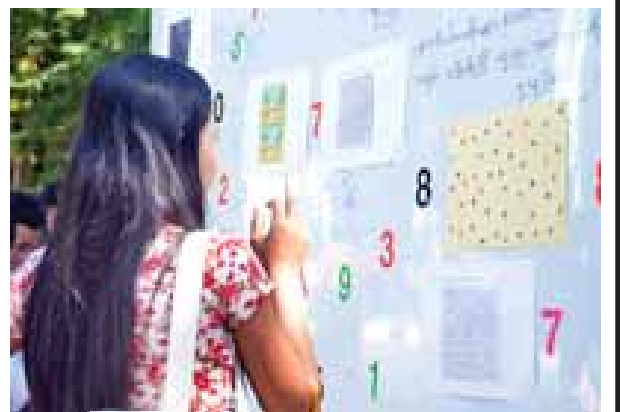
သင်္ချာဉာဏ်စမ်းကြမယ်။