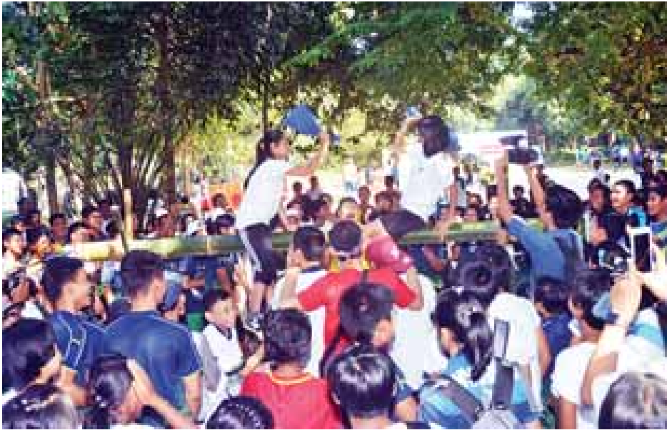
လူငယ်ဘက်စုံဖွံ့ဖြိုးရေးပွဲတော်တွင် အားကစားပြိုင်ပွဲများ ကျင်းပနေသည်ကို တွေ့ရစဉ်။

Science Fair ပြခန်းများပြသခြင်းအဖြစ် ဘွဲ့နှင်း