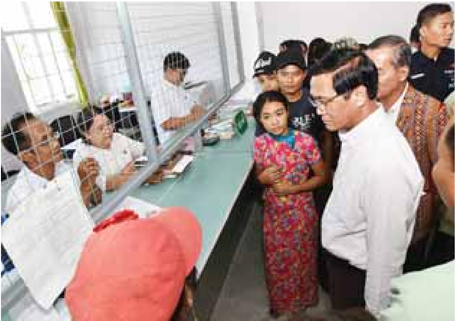
ဒုတိယသမ္မတ ဦးဟင်နရီဗန်ထီးယူ ထားဝယ်မြို့ ပြည်သူ့ဝန်ဆောင်မှုရုံး၌ ပြည်သူ့ဝန်ဆောင်မှုလုပ်ငန်းများကို ကြည့်ရှုအားပေးစဉ်။

ထားဝယ်အထူးစီးပွားရေးဇုန်သည် ထိုင်းနိုင်ငံနယ်စပ်နှင့် ၁၃၂ ကီလိုမီတာ၊ ဘန်ကောက်နှင့် ၃၀၀ ကီလိုမီတာ တွင်တည်ရှိပြီး GMS Southern Economic Corridor ဖြစ်သည့် ဘန်ကောက်-ဖန္နမ်းပင်-ဟိုချီမင်းမြို့များနှင့် တစ်ဆက်တည်း ချိတ်ဆက်နိုင်ကြောင်း၊ အနောက်အာရှ၊ အရှေ့အလယ်ပိုင်း၊ ဥရောပနှင့် အာဖရိကဒေသများသို့ ချိတ်ဆက်နိုင်မည့်နေရာဖြစ်ပြီး မလတ္တာရေလက်ကြားအပြင် အခြားရှေးချယ်စရာ လမ်းကြောင်းအဖြစ် တည်ရှိကြောင်း၊ ထို့ပြင် သတ္တုနှင့်ရေလုပ်ငန်း စသည့် သဘာဝသယံဇာတ အရင်းအမြစ်များ ကြွယ်ဝခြင်းနှင့် လုပ်အားခဈေးနှုန်းအရ အခြားနိုင်ငံများထက် ပိုမိုဆွဲဆောင်မှုရှိသည့်