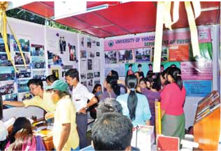
လူငယ်ဘက်စုံဖွံ့ဖြိုးရေးပွဲတော်တွင် ခင်းကျင်းပြသထားသော ပြခန်းများတွင် လေ့လာနေသူများအား တွေ့ရစဉ်။

ဒီပွဲမှာလူငယ်တွေကို အသိပညာပေးချင်လို့ ပြခန်းတွေပါဝင်ပြသပါတယ်။ ဉာဏ်စမ်းတွေ၊ တစ်ခန်းရပ်ပြဇာတ်တွေလည်း ပါဝင်ကပြတယ်။ အဓိကက မလိုလားအပ်တဲ့ ကိုယ်ဝန်ရပြီး မွေးဖွားပြီးတဲ့နောက် ကလေး