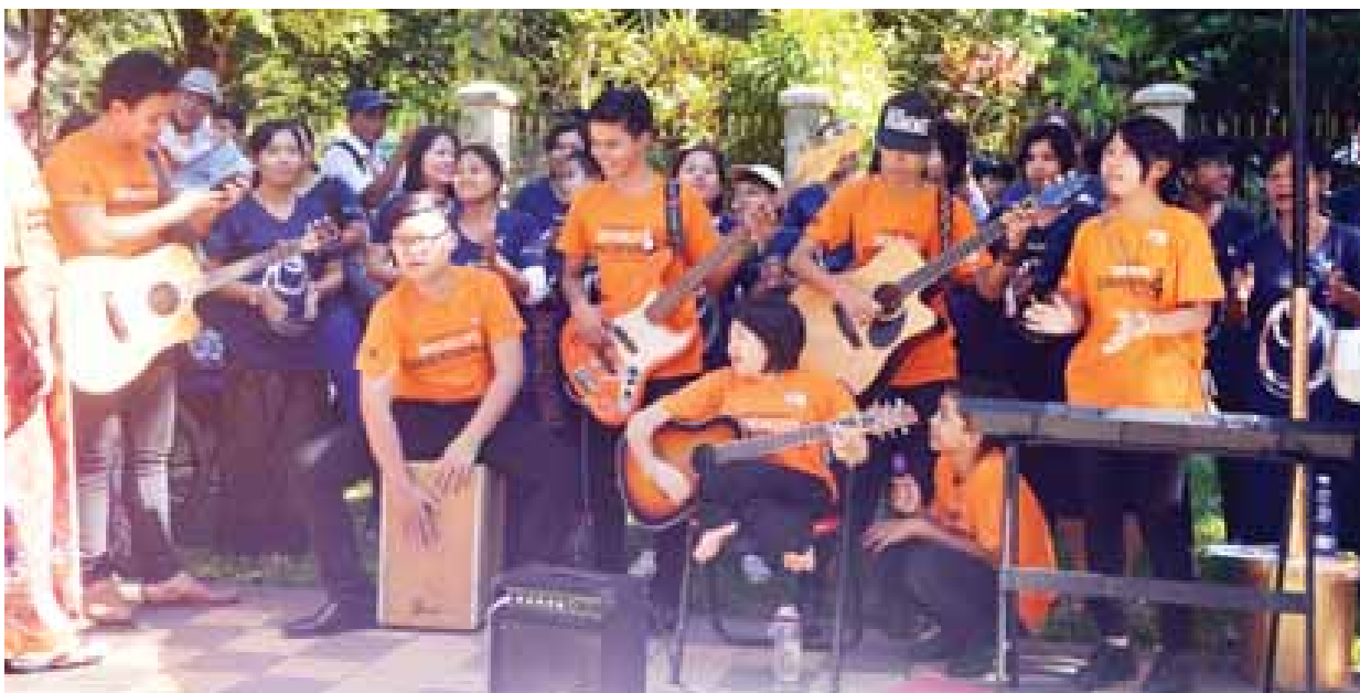
မသန်ပေမယ့် စွမ်းကြတယ်။