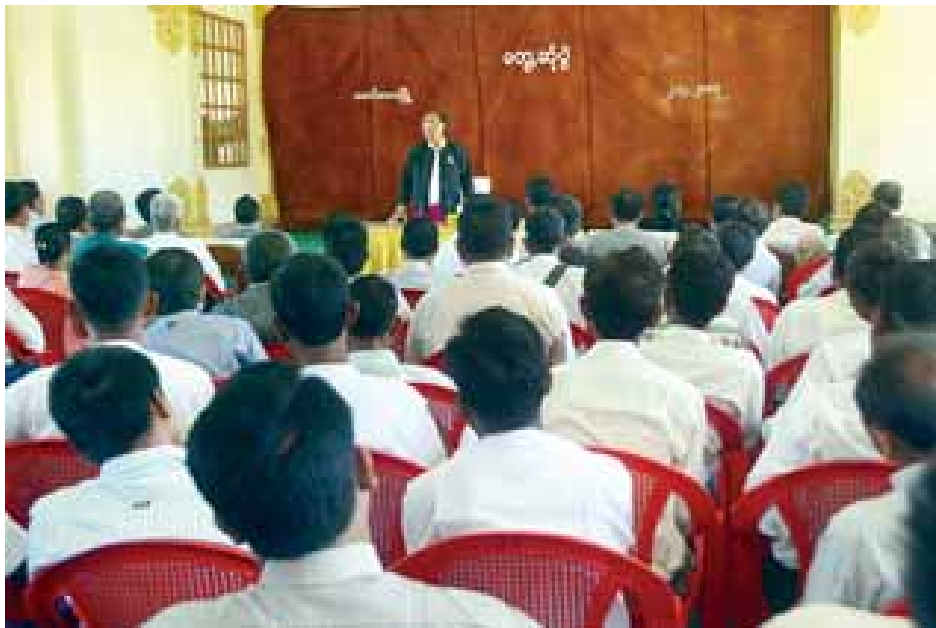
ရခိုင်ပြည်နယ်လွှတ်တော်ဥက္ကဋ္ဌနှင့် မောင်တောဒေသခံပြည်သူများ တွေ့ဆုံဆွေးနွေးစဉ်။

မောင်တော ဒီဇင်ဘာ ၂ ရခိုင်ပြည်နယ် မောင်တောဒေသအတွင်း ဖြစ်ပေါ်ခဲ့သော အကြမ်းဖက်ဖြစ်ရပ်များနှင့်ပတ်သက်ပြီး ပြန်လည် ထူထောင်မှုအပိုင်းများနှင့် ဒေသဖွံ့ဖြိုးတိုးတက်မှုအစ ကဏ္ဍမျိုးစုံတွင် ရခိုင်ပြည်နယ်လွှတ်တော်အနေဖြင့် ဒေသခံ ပြည်သူများနှင့် တစ်သားတည်းရှိကြောင်း၊ ဒေသခံပြည်သူ များ၏ ဆန္ဒမှာလည်း လွှတ်တော်၏ဆန္ဒဖြစ်ကြောင်း ရခိုင် ပြည်နယ်လွှတ်တော်ဥက္ကဋ္ဌ ဦးစံကျော်လှက ယနေ့ မောင်တော ဒေသခံပြည်သူများနှင့်တွေ့ဆုံစဉ် ပြောကြားသည်။ မောင်တောမြို့ သာသနာ့ဗိမာန်၌ ယနေ့မွန်းလွဲ ၂ နာရီတွင် ကျင်းပသော ရခိုင်ပြည်နယ်လွှတ်တော်ဥက္ကဋ္ဌ၊ ဒုတိယဥက္ကဋ္ဌ၊ လွှတ်တော်ကိုယ်စားလှယ်များ၊ ဥပဒေရေးရာ၊ အကြံပေးအဖွဲ့ဝင်များနှင့် မောင်တောမြို့ ဒေသခံပြည်သူ များ တွေ့ဆုံအခမ်းအနားတွင် ရခိုင်ပြည်နယ်လွှတ်တော် ဥက္ကဋ္ဌက အထက်ပါအတိုင်း ပြောကြားခဲ့ခြင်းဖြစ်သည်။ မောင်တောဒေသနှင့် ဘူးသီးတောင်ဒေသများအနေဖြင့် လတ်တလော အေးချမ်းသင့်သလောက် အေးချမ်းမှုရှိနေပြီ ဖြစ်ကြောင်း၊ ဖြစ်ပေါ်ခဲ့သော အကြမ်းဖက်မှုဖြစ်ရပ်များနှင့် ပတ်သက်ပြီး ရခိုင်ပြည်နယ်လွှတ်တော်အနေဖြင့် ဒေသခံ