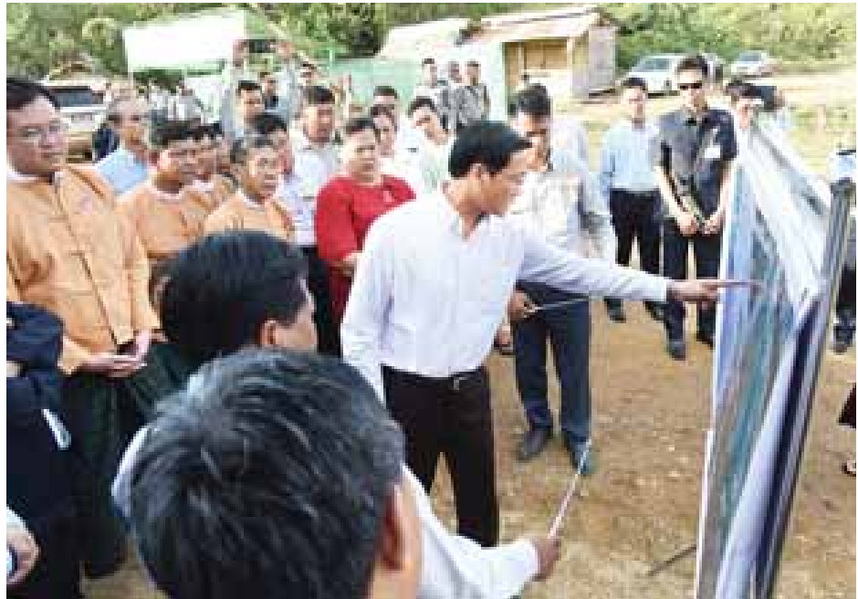
ဒုတိယသမ္မတ ဦးဟင်နရီဗန်ထီးယူ မြန်မာ-ထိုင်းနယ်စပ်သို့ ဆက်သွယ်သည့် နှစ်လမ်းသွား ကတ္တရာလမ်း အဆင့်မြှင့်တင်ခြင်းစီမံကိန်းပုံကို ကြည့်ရှုစစ်ဆေးစဉ်။