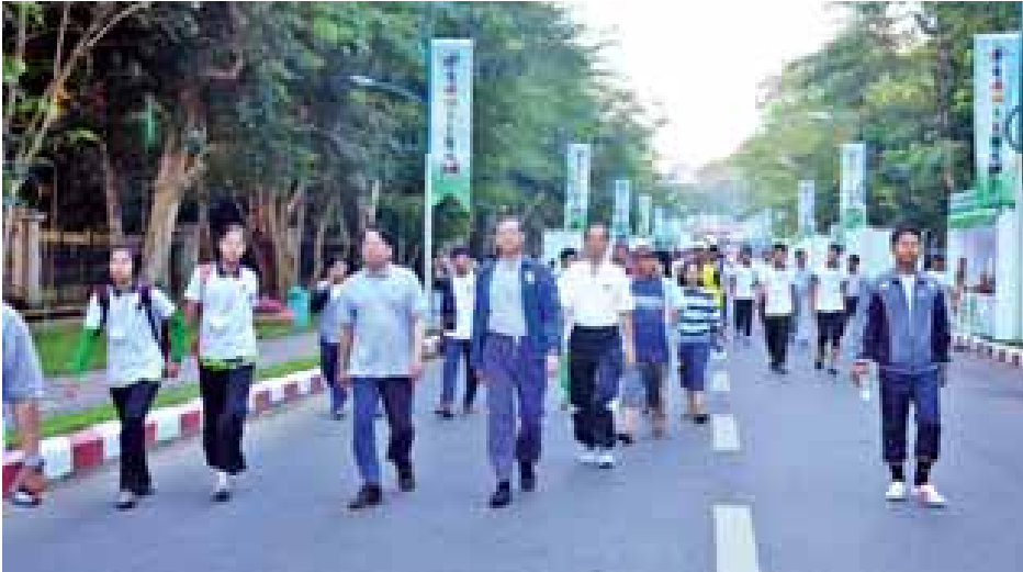
ပွဲကို ပါဝင်ဆင်နွှဲကြသူများအား အအေး၊ မုန့်များဖြင့် ဧည့်ခံကျွေးမွေးကြသည့်အပြင် ဒီဇင်ဘာ ၂ ရက်ထုတ် မြန်မာ့အလင်းနှင့် ကြေးမုံသတင်းစာများကို အခမဲ့ ဝေငှပေးခဲ့ကြောင်း သိရသည်။ သတင်းစဉ်

ရန်ကုန်တက္ကသိုလ်ဝင်းအတွင်းရှိ အဓိပတိလမ်း(ပန်းဝင်နေရာ)သို့ ပြန်လည်ရောက်ရှိရာတွင် စုပေါင်းလမ်းလျှောက်