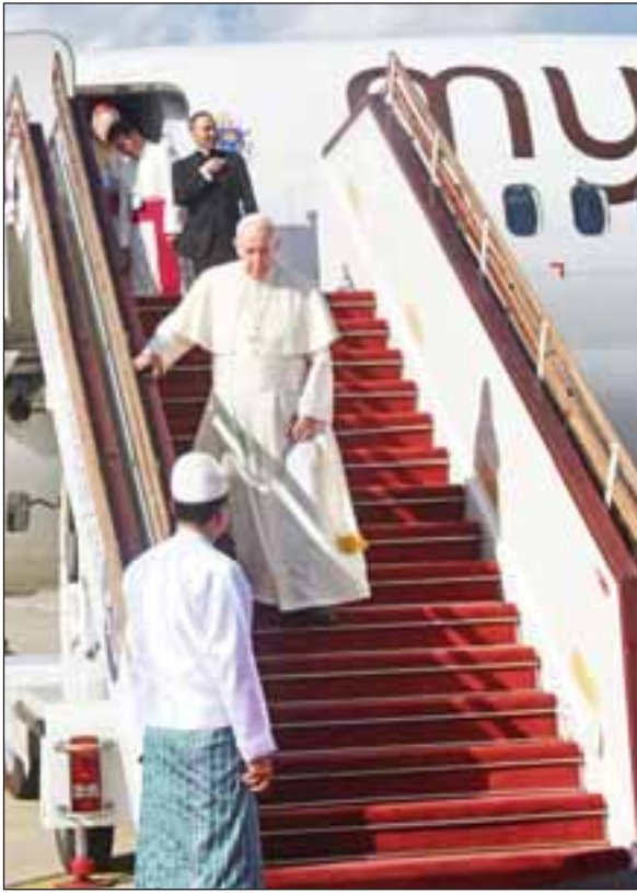
မြန်မာနိုင်ငံ၌ တရားဝင်ချစ်ကြည်ရေးခရီး ရောက်ရှိနေသော ပုပ်ရဟန်းမင်းကြီး ဖရန်စစ် နေပြည်တော်လေဆိပ်သို့ ရောက်ရှိလာစဉ်။