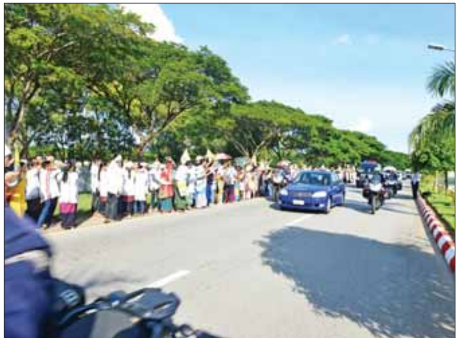
မြန်မာနိုင်ငံ၌ တရားဝင်ချစ်ကြည်ရေးခရီး ရောက်ရှိနေသော ပုပ်ရဟန်းမင်းကြီး ဖရန်စစ် နေပြည်တော်သို့ ရောက်ရှိလာရာ လမ်းဘေး ဝဲ၊ ယာမှ ကြိုဆိုနှုတ်ဆက်နေကြသူများကို တွေ့ရစဉ်။