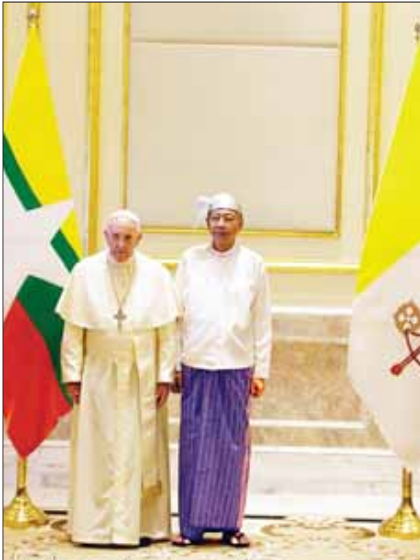
နိုင်ငံတော်သမ္မတ ဦးထင်ကျော်နှင့် ပုပ်ရဟန်းမင်းကြီး ဖရန်စစ်တို့ သမ္မတအိမ်တော်တွင် မှတ်တမ်းတင်ဓာတ်ပုံရိုက်စဉ်။