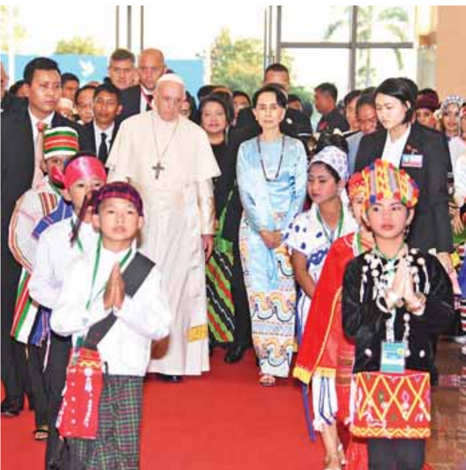
နိုင်ငံတော်၏အတိုင်ပင်ခံပုဂ္ဂိုလ် ဒေါ်အောင်ဆန်းစုကြည်၊ ပုဂံရဟန်းမင်းကြီး ဖရန်စစ်နှင့် အခမ်းအနားသို့ တက်ရောက်လာသူများကို အတူတကွ တွေ့ရစဉ်။

○ ပုဂံရဟန်းမင်းကြီးမှ လူမှုရေးအဖွဲ့အစည်းများမှ ကိုယ်စားလှယ်များ၊ ဝန်ကြီးဌာနများမှ တာဝန်ရှိသူများနှင့် စိတ်ကြွားထားသူများ တက်ရောက်ကြသည်။ အခမ်းအနားတွင် နိုင်ငံတော်၏အတိုင်ပင်ခံပုဂ္ဂိုလ် ဒေါ်အောင်ဆန်းစုကြည်က ကြိုဆိုနှုတ်ခွန်းဆက်စကား ပြောကြားသည်။ (နိုင်ငံတော်၏အတိုင်ပင်ခံပုဂ္ဂိုလ်၏ ကြိုဆိုနှုတ်ခွန်းဆက်စကားကို သီးခြားဖော်ပြထားပါသည်) ယင်းနောက် ပုဂံရဟန်းမင်းကြီး ဖရန်စစ်က မိန့်ခွန်းပြောကြားသည်။ (ပုဂံရဟန်းမင်းကြီး ဖရန်စစ်၏ မိန့်ခွန်းကို သီးခြားဖော်ပြထားပါသည်) ပုဂံရဟန်းမင်းကြီး ဖရန်စစ်သည် နိုဝင်ဘာ ၂၉ ရက်တွင် ရန်ကုန်မြို့ ကျိုက္ကဆံကွင်းတွင် လူထုပရိသတ်နှင့် မစ္စားပူဇော်ဝတ်ပြုဆုတောင်းခြင်း၊ ကမ္ဘာအေး သံယာဉ်ဟိုဌာန၌ နိုင်ငံတော်သံယာဉ်မဟာနာယကအဖွဲ့နှင့် သွားရောက်တွေ့ဆုံခြင်း၊ စိန့်မေရီဘုရားကျောင်းတွင် မြန်မာနိုင်ငံကလေးသစ်ဆရာတော်ကြီးများနှင့် တွေ့ဆုံခြင်းများ ဆောင်ရွက်ပြီး နိုဝင်ဘာ ၃၀ ရက်တွင် ဘင်္ဂလားဒေ့ရှ်နိုင်ငံသို့ ဆက်လက်သွားရောက်မည် ဖြစ်ကြောင်း သိရသည်။ သတင်းစဉ်