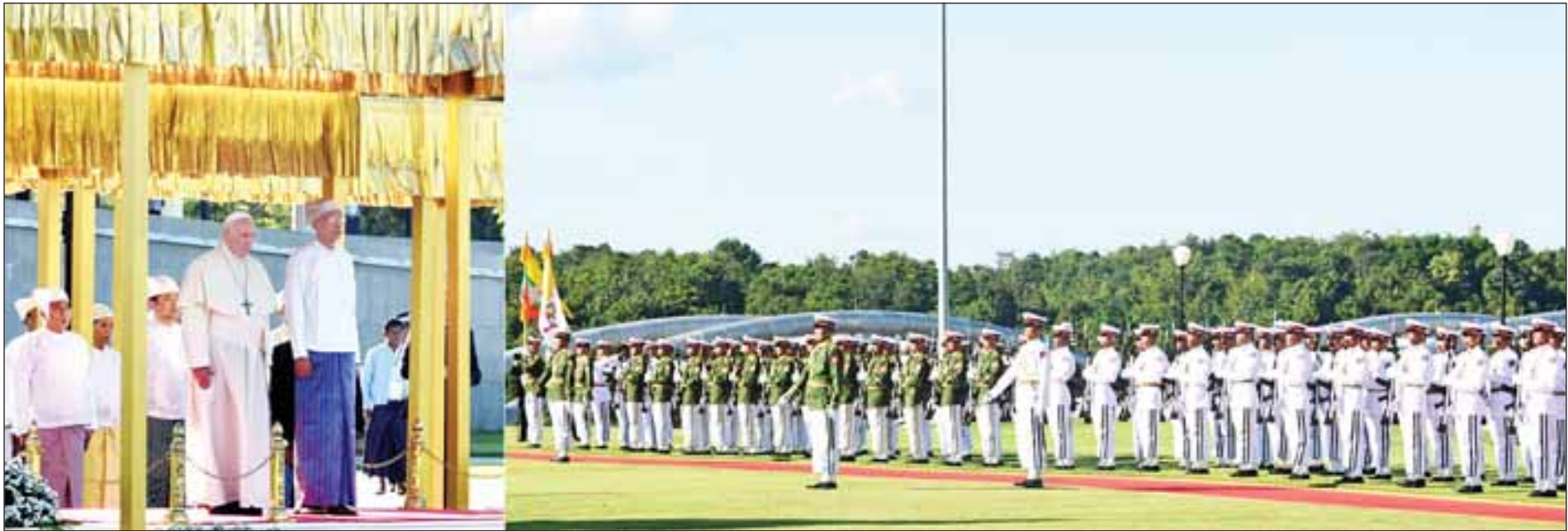
နိုင်ငံတော်သမ္မတ ဦးထင်ကျော် ပုပ်ရဟန်းမင်းကြီး ဖရန်စစ်အား နေပြည်တော်ရှိ နိုင်ငံတော်သမ္မတအိမ်တော်၌ ဂုဏ်ပြုအခမ်းအနားဖြင့် ကြိုဆိုစဉ်။

နေပြည်တော် နိုဝင်ဘာ ၂၈ ပြည်ထောင်စုသမ္မတမြန်မာနိုင်ငံတော် နိုင်ငံတော်သမ္မတ၏ ဖိတ်ကြားချက်အရ မြန်မာနိုင်ငံ၌ တရားဝင်ချစ်ကြည်ရေးခရီးရောက်ရှိနေသော ပုပ်ရဟန်းမင်းကြီး ဖရန်စစ် အား နိုင်ငံတော်သမ္မတ ဦးထင်ကျော်သည် ယနေ့ညနေပိုင်းတွင် နေပြည်တော်ရှိ နိုင်ငံတော်သမ္မတအိမ်တော်၌ ဂုဏ်ပြုအခမ်းအနားဖြင့် ကြိုဆိုသည်။ စာမျက်နှာ ၃ ကော်လံ ၁ သို့ ၁၁