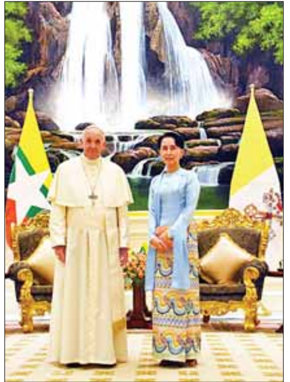
နိုင်ငံတော်၏အတိုင်ပင်ခံပုဂ္ဂိုလ် ဒေါ်အောင်ဆန်းစုကြည်နှင့် ပုပ်ရဟန်းမင်းကြီး ဖရန်စစ်တို့ သမ္မတအိမ်တော် သံတမန်ဆောင်ရွက်ခန်းမတွင် မှတ်တမ်းတင်ဓာတ်ပုံရိုက်စဉ်။