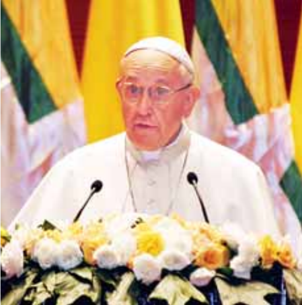
ပုပ်ရဟန်းမင်းကြီး ဖရန်စစ် မိန့်ခွန်းပြောကြားစဉ်။

ဖြစ်ပါသည်။ ရုတ်ခြည်း ပြောင်းလဲနေပြီး ချိတ်ဆက်မှု အားကောင်းလာလျက်ရှိသော ကမ္ဘာကြီးရှိ မြန်မာနိုင်ငံ၏ အနာဂတ်သည် လူငယ်များအား လေ့ကျင့်ပျိုးထောင်ပေးမှုအပေါ်တွင် မူတည်ပါသည်။ ထိုသို့ လူငယ်များအား လေ့ကျင့်ပျိုးထောင်ရာတွင် နည်းပညာ နယ်ပယ်များဆိုင်ရာ အတတ်ပညာများသာမက ပြောင့်မတ်ရိုးသားခြင်း၊ သိက္ခာ သမာဓိရှိခြင်းနှင့် လူသားချင်းစာနာစိတ်ထားရှိခြင်း စသည့် နီတိတန်ဖိုးများကိုလည်း သင်ကြားပေးရန်လိုအပ်ပါသည်။ ထိုနီတိတန်ဖိုးများသည် ဒီမိုကရေစီစနစ်အား ခိုင်မာစေခြင်းနှင့် လူ့အဖွဲ့အစည်း၏ အဆင့်တိုင်းတွင် စည်းလုံးညီညွတ်ရေးနှင့် ငြိမ်းချမ်းရေးကို ရှင်သန်တိုးပွားစေပါသည်။ သားစဉ်မြေးဆက်များအကြား ရှိရမည့် တရားမျှတမှုသည် လူလောဘနှင့် အတ္တတို့ဖြင့် ဖျက်ဆီးခြင်းကင်းသော သဘာဝပတ်ဝန်းကျင်တစ်ခုကို အနာဂတ်မျိုးဆက်သစ်များအတွက် အမွေပေးရန် တောင်းဆိုပါသည်။ လူငယ်များထံမှ မျှော်လင့်ခြင်းကို လူယူဖျက်ဆီးခြင်း မပြုရန်၊ နိုင်ငံတော်နှင့် လူသားမျိုးနွယ်တစ်ခုလုံး၏ အနာဂတ်ကို ပုံသွင်းပေးမည့်သူတို့၏ စိတ်ကူးအိပ်မက်များနှင့် အရည်အချင်းများအား လက်တွေ့အကောင်ထည်ဖော်ခြင်းကို မဟန့်တားရန် အရေးကြီးပါသည်။