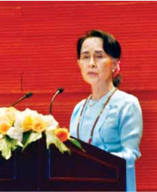
နိုင်ငံတော်၏အတိုင်ပင်ခံပုဂ္ဂိုလ် ဒေါ်အောင်ဆန်းစုကြည် ကြိုဆိုနှုတ်ခွန်းဆက်စကား ပြောကြားစဉ်။

အပစ်အခတ်ရပ်စဲရေးသဘောတူညီချက်အပေါ်အခြေခံပြီး ငြိမ်းချမ်းရေးဖြစ်စဉ်ကို ဆက်လက်ဖော်ဆောင်ဖို့ပဲဖြစ်ပါတယ်။ ငြိမ်းချမ်းရေးရရှိဖို့ လျှောက်လှမ်းရတဲ့ ခရီးလမ်းဟာ အမြဲတမ်း မချောမွေ့နိုင်ပါဘူး။ သို့ပေမယ့် ဒီကြိုးပမ်းမှုဟာ မိမိတို့အတွက်အေးချမ်းစွာမိမိရ၊ ဂုဏ်သိက္ခာရှိမှုနဲ့ ပျော်ရွှင်မှုတွေကို ဆောင်ကြဉ်းပေးမယ့် တရားမျှတပြီးကြွယ်ဝချမ်းသာတဲ့နိုင်ငံတစ်နိုင်ငံ ဖြစ်လာစေလိုတဲ့ ကျွန်ုပ်တို့ ပြည်သူတွေအားလုံးရဲ့ အိပ်မက်တွေကိုပြည့်ဝစေနိုင်မယ့် တစ်ခုတည်းသော နည်းလမ်းပဲဖြစ်ပါတယ်။ ငြိမ်းချမ်းရေးရရှိရေးအတွက်ကြိုးပမ်းမှုဟာ နောင်လာမယ့်မျိုးဆက်သစ်တွေရဲ့ အနာဂတ်ကို အာမခံချက်ရှိစေမယ့် စဉ်ဆက်မပြတ်ဖွံ့ဖြိုးတိုးတက်မှုတွေရရှိစေမှုနဲ့ အားဖြည့်