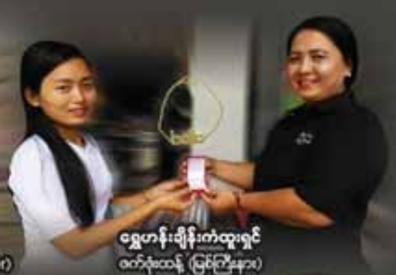
ရွှေဟန်းချိန်းကံထူးရှင် ဝက်လုံးထွန်း (မြင်ကြီးနား)