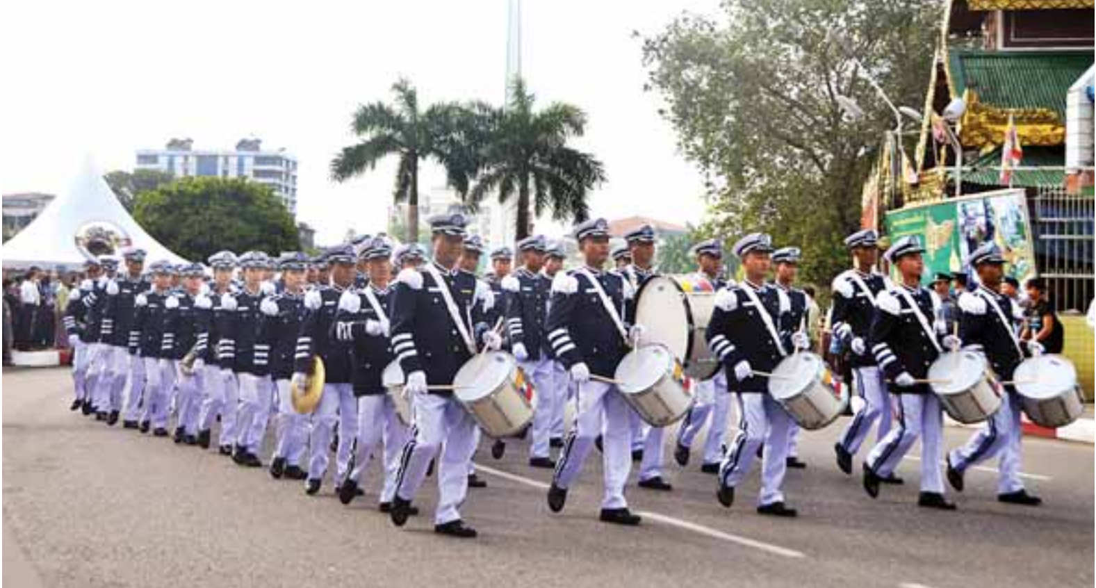
မြန်မာနိုင်ငံရဲတပ်ဖွဲ့မှ Police Band ၏ တီးခတ်ဖျော်ဖြေမှုကို တွေ့ရစဉ်။

ရသစာပေ ကျဆုံးတယ်ဆိုတာ ရသစာပေရေးတဲ့သူ မရှိလို့ပါ။ လူသားတွေကို အကျိုးပြုတဲ့စာပေတွေ ရေးကြပါလို့ လူငယ်စာရေးဆရာတွေကို ပြောချင်ပါတယ် စာမျက်နှာ - ၇ မူးယစ်နွံအတွင်း နှစ်ဆင်းနေတဲ့ လူငယ်လူရွယ်တွေကို အားလုံးက ကယ်ထုတ်ဖို့ ကြိုးပမ်းကြရမှာဖြစ်သလို တစ်ဖက်ကလည်း မူးယစ်ဆေးဝါးတွေကို အမြစ်ပါမကျန် တွန်းလှန်ဖယ်ရှားပေးကြဖို့ အားလုံးမှာတာဝန်ရှိနေ စာမျက်နှာ - ၈