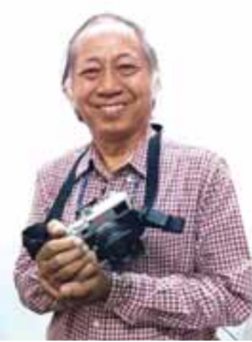
ဆရာညီပုလေး