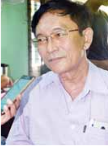
ဆရာဦးထွန်းဝေ(ကိုခါး-ကွမ်းခြံကုန်း)

ပြန်ကြားရေးဝန်ကြီးဌာန အမျိုးသားစာပေဆု စိစစ်ရွေးချယ်ရေးကော်မတီသည် ပြည်ထောင်စု သမ္မတ မြန်မာနိုင်ငံတော်တွင် မြန်မာစာပေ အကျိုးကို ထူးချွန်ပြောင်မြောက်စွာ တစ်သက်တာ လုံး အားထုတ်ရေးသားပြုစုခဲ့သော ဆောင်ရွက်ချက်များကို နိုင်ငံတော်က အသိအမှတ်ပြုသောအားဖြင့် ၂၀၁၆ ခုနှစ်အတွက် အမျိုးသားစာပေတစ်သက်တာဆုရှင်အဖြစ် ရွေးချယ်ချီးမြှင့်ခံရသည့် ဆရာကြီး ဦးသိန်းသန်းထွန်း (သိန်းသန်းထွန်း)၊ ၂၀၁၆ ခုနှစ်အတွက် အမျိုးသားစာပေဆုရရှိခဲ့သည့် စာရေးဆရာတို့နှင့် တွေ့ဆုံမေးမြန်းထားမှုများကို ရေးသားဖော်ပြလိုက်ပါသည်။