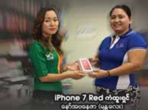
iPhone 7 Red ကံထူးရှင် နော်အဝနေတာ (ယန္တရော)