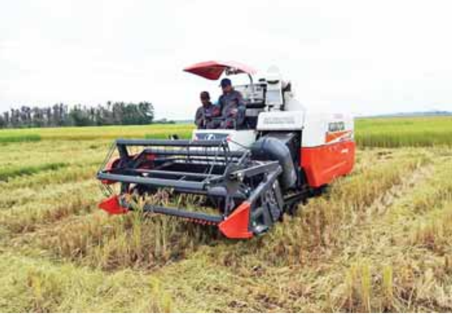
မောင်တောမြို့နယ် မြို့သူကြီးကျေးရွာ၌ စက်မှုလယ်ယာမှ ထောက်ပံ့ထားသည့် ကုတိုတာစက်ကြီးများဖြင့် မိုးစပါးများ ရိတ်သိမ်းခြွေလှေ့နေစဉ်။