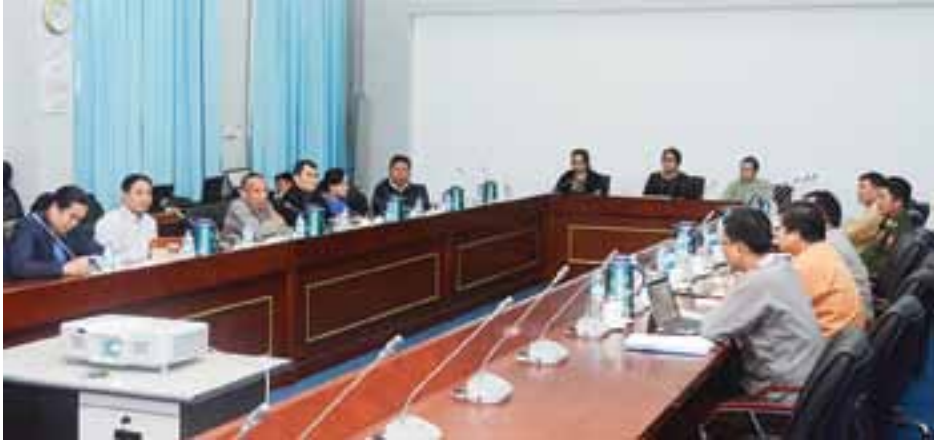
ပြည်ထောင်စုငြိမ်းချမ်းရေးဆွေးနွေးမှု ပူးတွဲကော်မတီ-UPDJC အတွင်းရေးမှူးအဖွဲ့ အစည်းအဝေးကျင်းပစဉ်။

* ရှေ့ဖူးမှ ကျင်းပချင်တယ်ဆိုတော့ အဲဒါနဲ့ဆက်စပ်ပြီး လိုအပ်တဲ့ အချက်တွေကို သုံးသပ်တယ်။ အဲဒီမှာ အဓိကအခက်အခဲ သွားတွေ့တာက အမျိုးသားအဆင့်နိုင်ငံရေးဆွေးနွေးပွဲကို နဂိုအတိုင်းပဲ နေရာတိုင်းမှာ လုပ်မလား၊ ဒါမှမဟုတ် ပြီးခဲ့တဲ့ဖြစ်စဉ်တုန်းက မလုပ်နိုင်သေးတဲ့ RCSS နေရာနဲ့ ALP နေရာတွေမှာပဲ လုပ်မလား၊ အဲဒါလည်းလုပ်ဖို့ အဆင်မပြေဘူးဆိုရင် ဘယ်လိုလုပ်သင့်သလဲဆိုတာတွေကို ကျွန်တော်တို့ ဆွေးနွေးပါတယ်”ဟု ပြောကြားသည်။