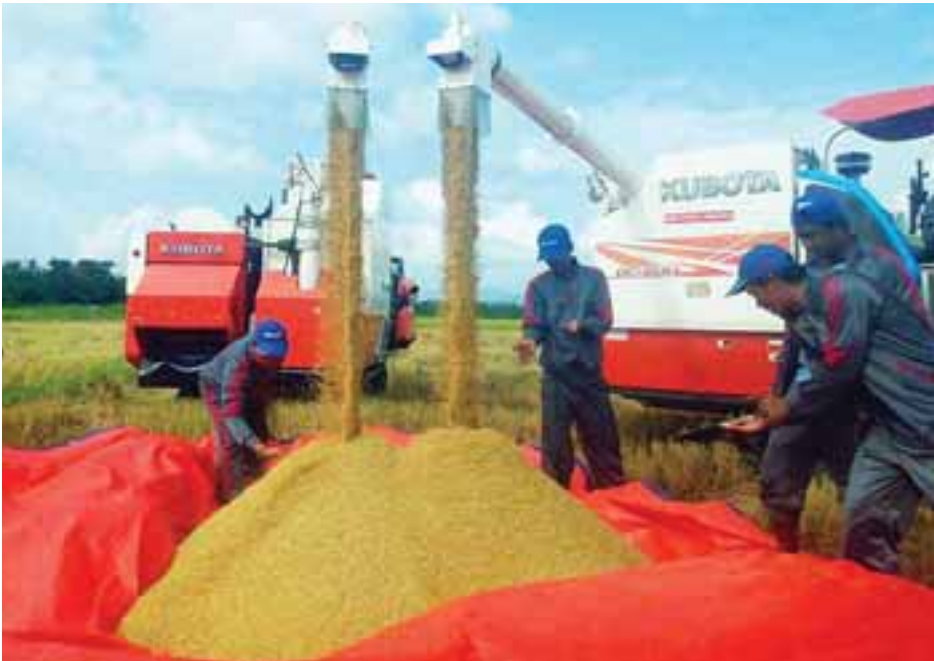
မောင်တောမြို့နယ် အလယ်သံကျော်ကျေးရွာ၌ စက်မှုလယ်ယာမှ ကူဘိုတာစက်ကြီးများဖြင့် စပါးများ ရိတ်သိမ်းခြွေလှေ့ပေးနေစဉ်။

“နီဝင်ဘာနဲ့ ဒီဇင်ဘာနှစ်လလုံး စက်ကြီးတွေနဲ့ ရိတ်သိမ်းပေးသွားပါမယ်။ လိုအပ်ရင် ဇန်နဝါရီအထိ ရိတ်သိမ်းပေးဖို့ ကြိုတင်စီစဉ်ဆောင်ရွက်နေပါတယ်။ ဒီစက်ကြီးတွေက မြေအနေအထား၊ အကွက်အနေအထားအကျဉ်း၊ အကျယ်ပေါ်မူတည်ပြီး တစ်ရက်ကို ငါးဧကကနေ ၁၀ ဧကအတွင်း ပြီးစီးနိုင်ပါတယ်။ လက်ရှိမြို့သူကြီးကျေးရွာအုပ်စုအပါအဝင် ဒီအနီးပတ်ဝန်းကျင်မှာရှိတဲ့ ကျေးရွာအုပ်စုတွေကို လေးမိုင် ရှေ့တန်းစခန်းမှာ အခြေပြုပြီး စာမျက်နှာ ၁၁ ကော်လံ ၁ သို့