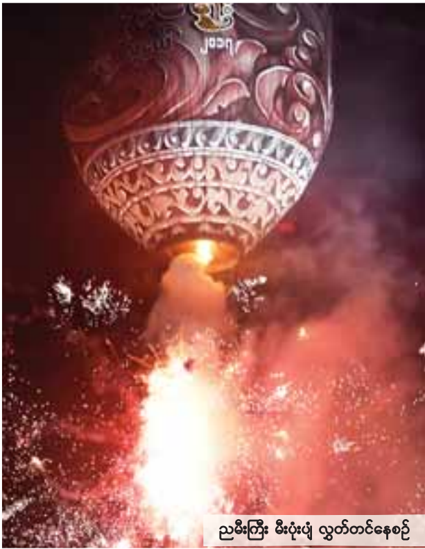
ညမီးကြီး မီးပုံးပွဲ လွှတ်တင်နေစဉ်

ချန်ပီယံဆုအတွက် အပြိုင်ဖြစ်နေသည့် ရှမ်းယူနိုက်တက်အသင်းနှင့် ရန်ကုန်အသင်းတို့မှာ နောက်ဆုံးပွဲများကို အိမ်ကွင်း၌ လက်ခံကစားရမည်ဖြစ်ပြီး ရှမ်းယူနိုက်တက်အသင်းသည် နိုင်ပွဲရယူနိုင်ပါက ချန်ပီယံဆုရယူနိုင်မည်ဖြစ်သည်။ ပွဲစဉ်(၂၂)အဖြစ် ယနေ့တွင် တောင်ကြီးကွင်း၌ ရှမ်းယူနိုက်တက်အသင်းနှင့် ဟံသာဝတီအသင်း၊ YUSC ကွင်း၌ ရန်ကုန်အသင်းနှင့် ချင်းယူနိုက်တက်အသင်း၊ ပုသိမ်ကွင်း၌ ရော့ဝတီအသင်းနှင့် ရခိုင်အသင်း၊ သုဝဏ္ဏကွင်း၌ ဇွဲကပင်အသင်းနှင့် Southern အသင်း၊ အောင်ဆန်းကွင်း၌ GFA အသင်းနှင့် မကွေးအသင်းတို့ ယှဉ်ပြိုင်ကစားမည်ဖြစ်သည်။ ပွဲစဉ် (၂၁)အပြီးတွင် ချန်ပီယံအသင်းမှလွဲ၍ တတိယဆုရအသင်း၊ တန်းဆင်းအသင်းတို့ထွက်ပေါ်ခဲ့ပြီး ချန်ပီယံအသင်းကိုမူ နောက်ဆုံးမိနစ်၊ နောက်ဆုံးအချိန်အထိ စောင့်ကြည့်ရမည်ဖြစ်သည်။ ရှမ်းယူနိုက်တက်အသင်းသည် စာမျက်နှာ ၃ ကော်လံ ၁ သို့